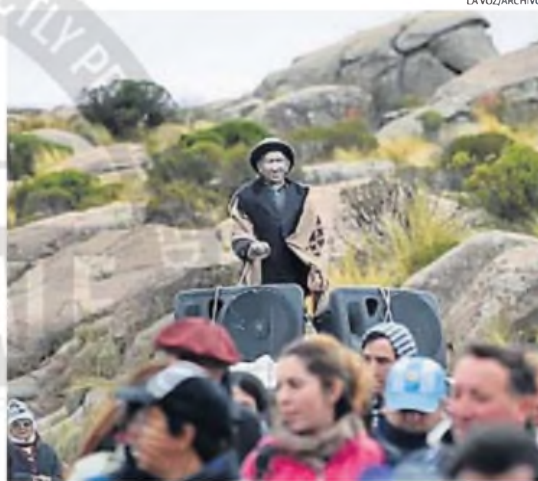
RELIGIOSIDAD. Una de las tradicionales procesiones en honor al cura Brochero.