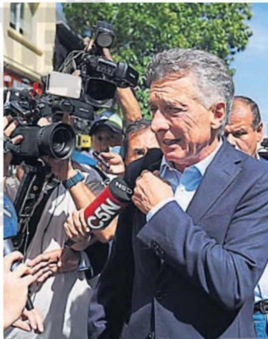
PRESENCIA. Macri lideró la reunión del PRO en Buenos Aires. No hubo definiciones.

Pese a que el centro de la atención está puesto en territorio bonaerense, en la cumbre del PRO se repasó el estado de situación en elecciones que son más próximas: Santa Fe (elige convencionales constituyentes el 13 de abril), San Luis (legisladores provinciales el 11 de mayo) y Ciudad de Buenos Aires (también legisladores el 18 del mismo mes). En esos dis-