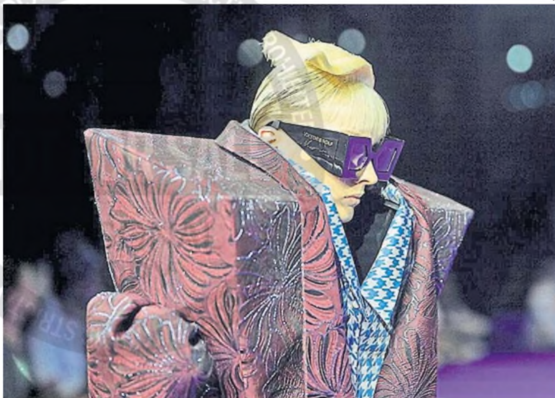
CAMBIOS EN LA INDUSTRIA. La alta costura pero también el diseño de marcas de producción a gran escala cambian sus procesos con la tecnología de la IA.