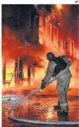
ARDE ODESA. Un bombero lucha contra las llamas que consumen un edificio.

Analistas coinciden en que este cambio generará, sin duda, un gran debate sobre el futuro de la educación en Estados Unidos, sobre todo en un momento en que la gestión federal resulta clave para garantizar la equidad en el acceso a la educación y la distribución de recursos en todo el país. Lo que está claro es que, con esta orden ejecutiva, Trump ha dado un paso decisivo hacia una descentralización total del sistema educativo en el país.