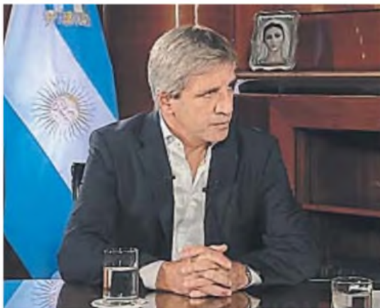
ORDEN FISCAL. El ministro Caputo lo prioriza por encima de todas las variables.

A medida que la dirigencia y la sociedad se polarizan, se dificulta la construcción de consensos políticos y sociales sobre reformas clave, lo que afecta la estabilidad y la confianza en las instituciones, aumenta la volatilidad de los mercados, reduce las inversiones, profundiza la incertidumbre y aumenta la salida de capitales, todo lo cual socava las bases de un crecimiento económico sostenible.