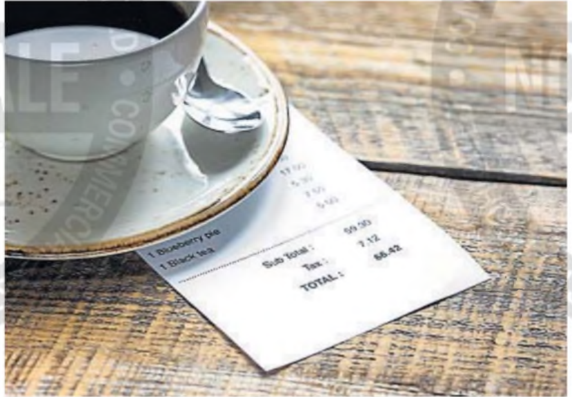
TRANSPARENCIA FISCAL. La ley nacional busca que el comprador pueda ver qué parte de su consumo son impuestos.

CONSUMO. En la Legislatura hay dos proyectos de la oposición para que sea obligatorio en la provincia identificar los tributos en los comprobantes de pago.