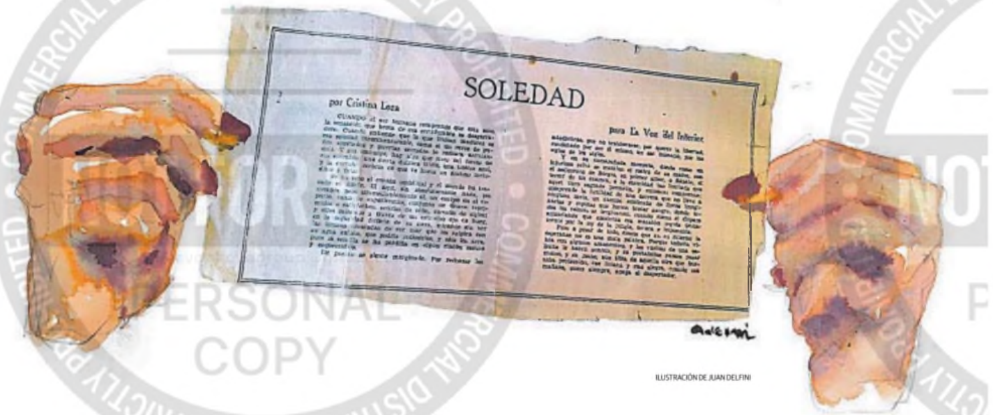
ILUSTRACIÓN DE AJAN DELFINI