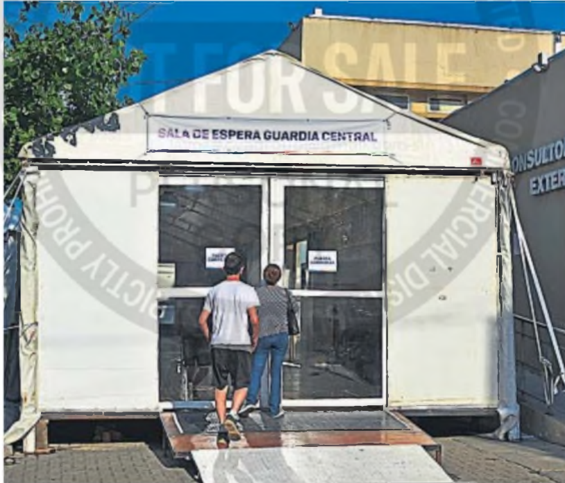
ATENCIÓN TEMPRANA. La recomendación es no subestimar síntomas y acudir rápidamente a consulta en centros de salud.