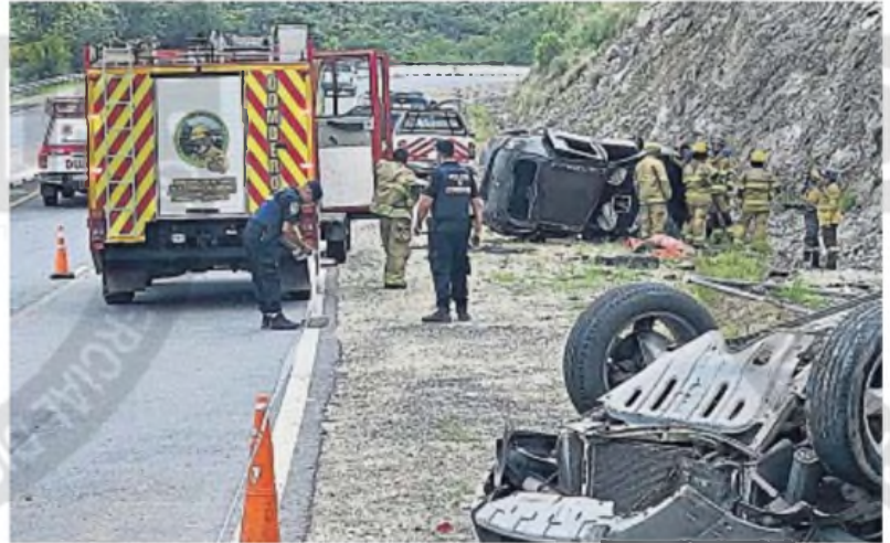
EN LA AUTOVÍA 5. El fuerte impacto dejó a los dos vehículos volcados en la banquina. Uno habría chocado al otro de atrás.