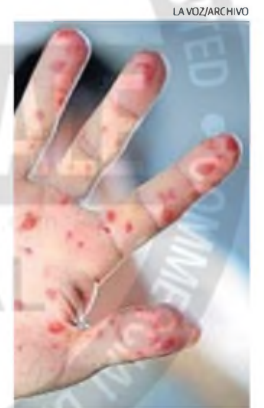
SARAMPIÓN. Ya hay brote en el Amba y se extiende la alerta.

Por este brote, el Gobierno de la Provincia de Buenos Aires reclamó a la Nación una urgente campaña de vacunación para reforzar las coberturas.