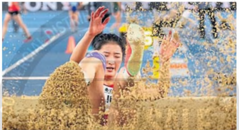
Con alma y vida a la cama de arena

Se disputa en China el Mundial de atletismo "indoor". El fotógrafo logró captar a esta atleta local que levanta la arena en el máximo esfuerzo en la prueba de salto en largo.