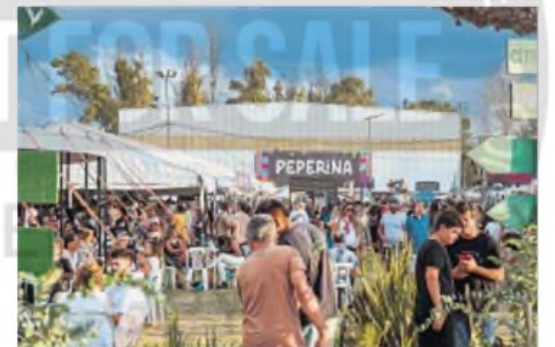
Alta Gracia recibirá el fin de semana extra largo de Semana Santa a lo mejor de la gastronomía de la mano del Festival Peperina. La entrada es libre y gratuita.

Peperina también ofrece un gran “Espacio para niños” con juegos, personajes y mucha diversión para compartir cuatro días a puro sabor, con toda la familia. El festival se ha convertido en favorito del público y de la agenda festivalera de Alta Gracia, una ciudad que verdaderamente enamora.