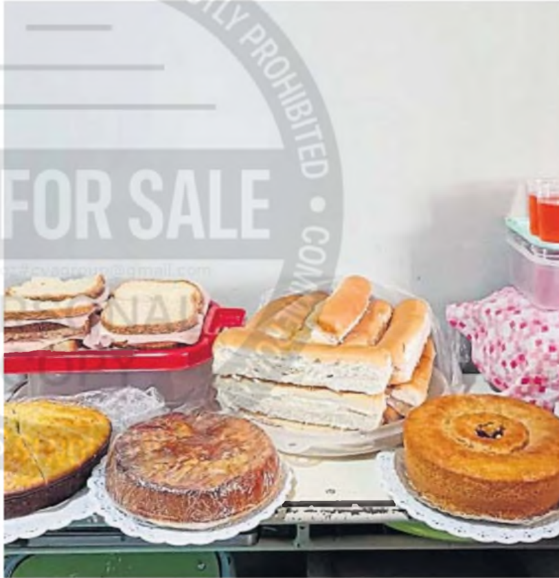
CANTINAS SALUDABLES. La escuela Romero, de barrio Sacchi, ofrece productos 100% saludables en su quiosco.

Para ello, estableció un plan progresivo en quioscos y cantinas escolares municipales para que las 38 escuelas ofrezcan exclusivamente opciones saludables y eliminen gradualmente la venta de productos ultraprocesados y de bebidas azuca-