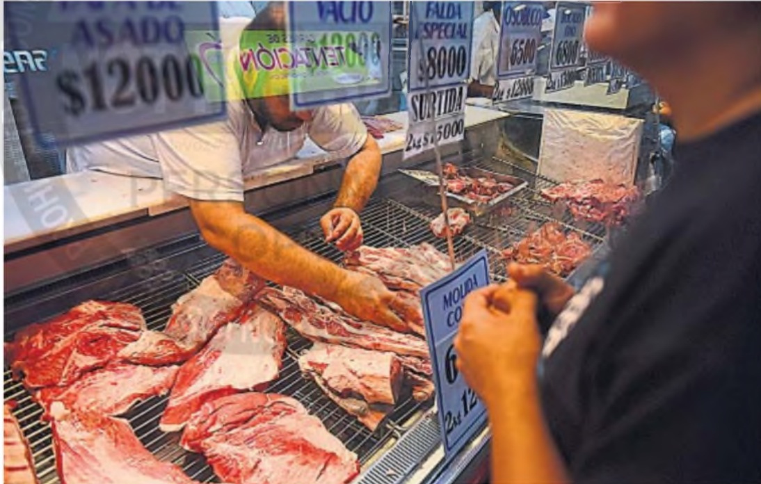
MENOS CANTIDAD. Se acabaron las compras mensuales y cada vez menos se llevan cortes para la semana: la gente compra lo justo y para el día en la carnicería.