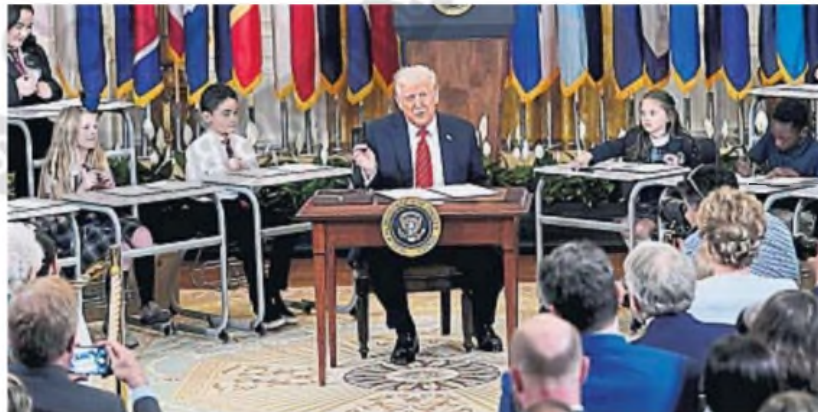
SAQUEN UNA HOJA. Fianqueado por alumnos, Trump explicó los cambios profundos al sistema educativo. Decidirá el Congreso.

Sin embargo, el plan tiene un inconveniente fundamental: el Departamento de Educación fue creado por el Congreso en 1979, lo que significa que solo el Poder Legislativo puede desmantelarlo. A pesar de ello, Trump instruyó a la secretaria de Educación, Linda McMahon, a llevar a cabo despidos masivos y recortes de fondos, como primer paso hacia la disolución del organismo federal. La idea es reducir a la mínima