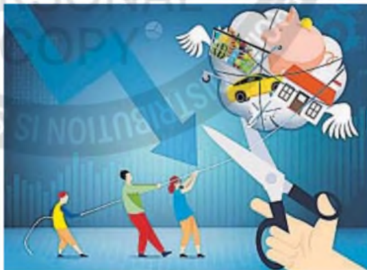
ILUSTRACIÓN DE OSCAR ROLDÁN

Para cualquiera, darse cuenta no es fácil, pero aceptarlo es mucho más difícil.