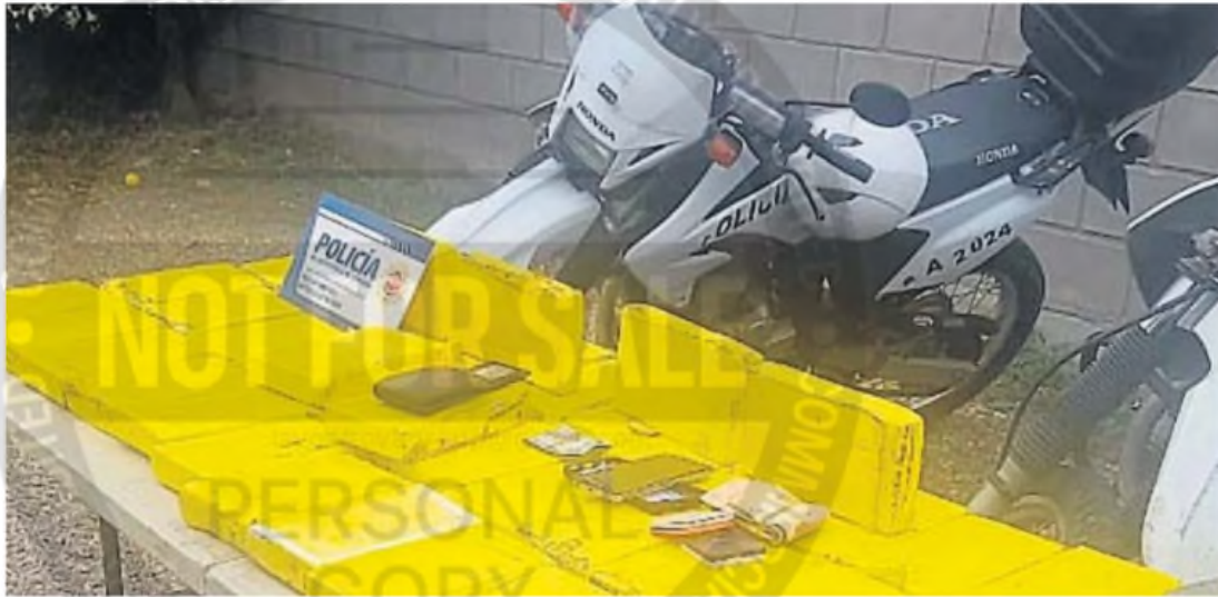
LA DROGA. La carga secuestrada en la camioneta Toyota, en la ciudad de Córdoba, el 24 de abril de 2024. Un año después, Germán Córdoba fue condenado