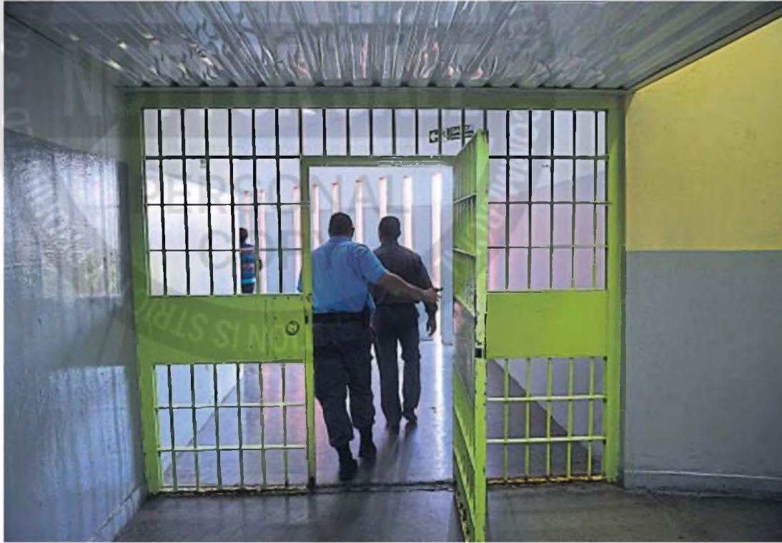
EMPLAZADOS. La Justicia intimó al Servicio Penitenciario a garantizar condiciones dignas de alojamiento y solucionar la falta de agua corriente y potable.