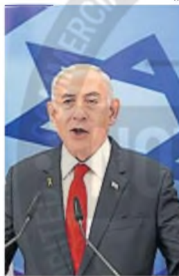
BENJAMIN NETANYAHU. El primer ministro israelí.

Demasiada oscuridad para descartar intenciones ocultas en el abrumador bombardeo que demolió la tregua.