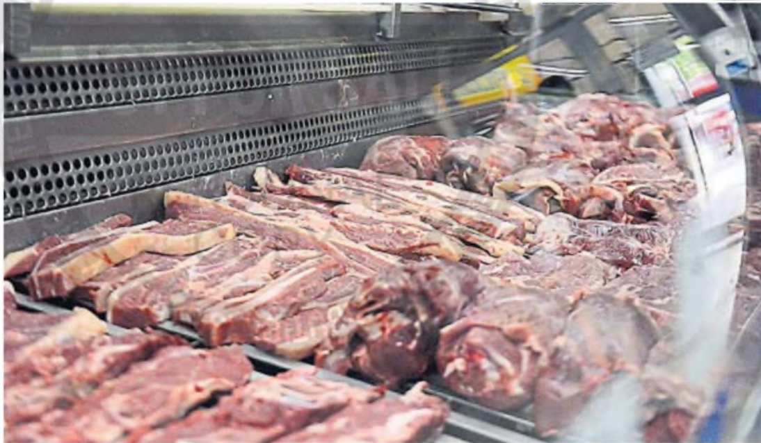
ALIMENTOS. Febrero marcó un avance en el precio de los productos de la canasta de alimentos, con especial protagonismo de la carne, lo que impactó en el índice general.