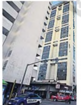
INCENDIO. El fuego afectó a un departamento de la Torre Ángela.

Además, dos mujeres que serían vecinas y dos policías que participaban del operativo resultaron intoxicados por inhalación de monóxido de carbono. Los efectivos fueron trasladados al Policlínico Policial. Pasadas las 20, se llevó a cabo un