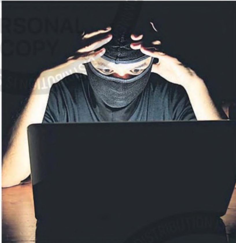
PELIGROS. La ‘dark web’ representa un riesgo para las personas y para las instituciones.

La dark web es una sección de internet accesible únicamente a través de software especializado que se ha consolidado como un espacio propicio para las actividades ilícitas a nivel global. En su entorno, plataformas similares a mercados electrónicos convencionales permiten la proliferación de redes criminales que aprovechan el anonimato y la descentralización para operar sin restricciones. Se trata de un fenómeno que ha sido denominado por algunos expertos como una forma de “globalización desviada”, en la que los acto-