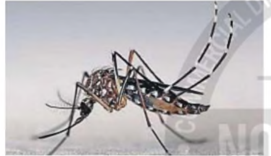
MOSQUITO. El "Aedes aegypti" es el mosquito que transmite el virus del dengue.

Una medida cautelar en la ciudad de Buenos Aires fue la que promovió el "turismo reproductivo".