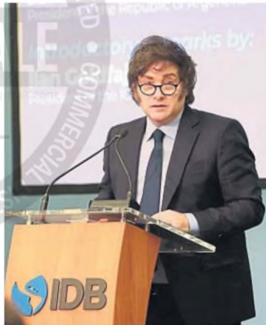
DISERTACIÓN. Milei brindó ayer una conferencia, en la cual vivió un incidente.

vertidos) sobre el rumbo económico de su gobierno: "En poquito más de un año, en 13 meses, bajamos y sacamos de la pobreza a más de 10 millones de argentinos", dijo para valorar el papel de "Luis 'Toto' Caputo, que está acá y que, sin duda, es el mejor ministro de Economía de toda la historia argentina". Milei también afirmó que "está creando empleo" y que "los salarios, en dólares, básicamente, se triplicaron en los formales".