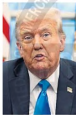
TRUMP. Su relación con Putin genera sospechas desde hace años

Por cierto fue un error geopolítico no haberse acercado más a la URSS de Mijail Gorbachov y la Rusia de Boris Yeltsin. Pero lo que debió hacerse y no se hizo con aquellos líderes no puede hacerse ahora con un autócrata que asesina a opositores y críticos, mientras inicia guerras expansionistas.