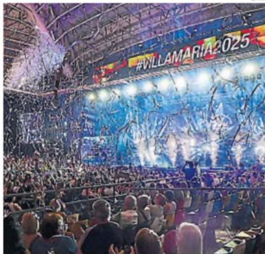
VILLA MARÍA. El festival volvió a sus raíces peñas.

de las cinco noches (domingo, lunes y martes) vieron la capacidad del anfiteatro agotada. En tanto, el sábado, sostuvo los números del viernes.