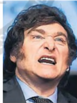
COMPLICADO. Milei vivió la peor semana en el poder.

Los mercados financieros y cambiarios no reaccionaron en forma