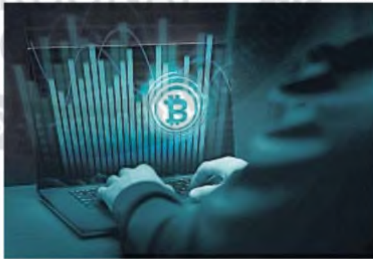
REDES. En las redes sociales preferidas por los jóvenes pulula el contenido de criptos.

ha desechado casi por completo la cultura del esfuerzo, del trabajo y del estudio en la que se formaron sus padres y abuelos.