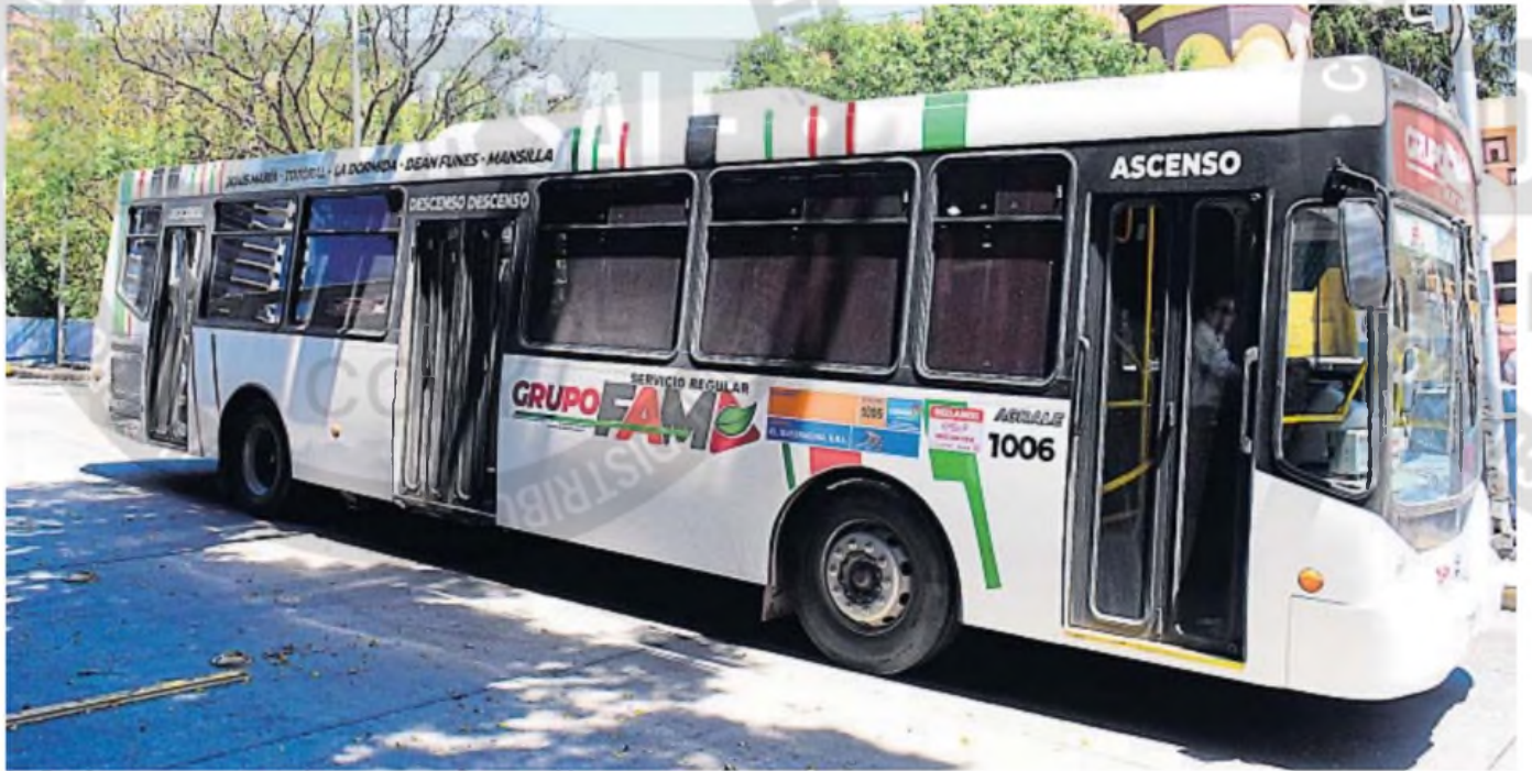
LA EXPERIENCIA DEL GRUPO FAM. La empresa comenzó a operar en el transporte interurbano a principios de este mes, cuando tomó a cargo parte de las líneas que controlaba la empresa correntina Ersá.