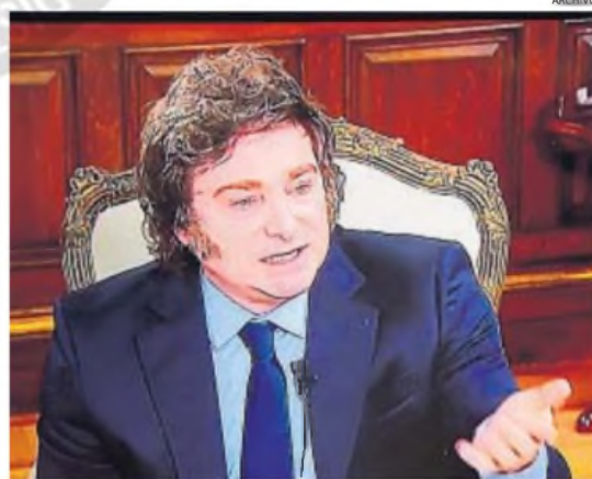
ESCÁNDALO. Javier Milei quedó implicado en una estafa con criptomonedas.

Por lo tanto, este episodio de la criptomoneda $Libra, además de demandar el análisis respecto de una cosmovisión del rol de los estados-nación en los sistemas capitalistas de Occidente, requiere también concluir que serán finalmente las instituciones –a través de la Justicia–, el juicio de los ciudadanos y el juicio de los mercados los que van a ir marcando el efecto que este episodio pueda o no tener en la evolución futura del Gobierno.