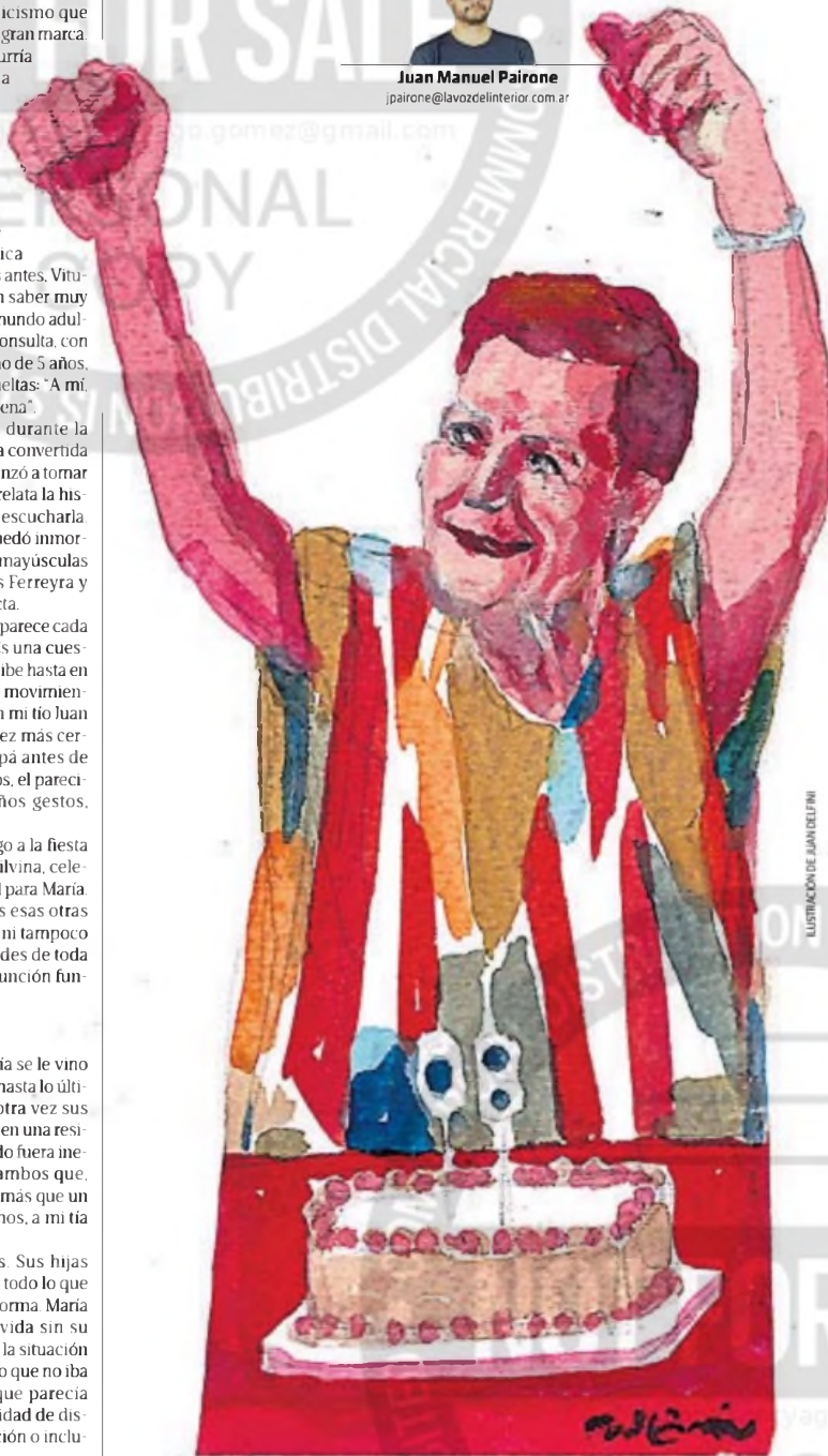
ILUSTRACIÓN DE JUAN DELFINI

A Dario y a todos sus compañeros, muchas gracias de corazón por abrazar a mi tía de esa forma.