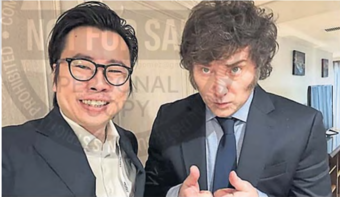
CERCANOS. El presidente Javier Milei compartió varios encuentros con algunos de los empresarios vinculados a la criptomoneda que produjo pérdidas masivas hace siete días.