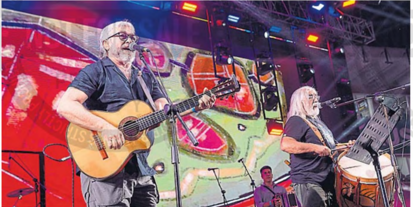
JESÚS MARÍA. Momento de coplas y de chacareras con el Dúo Coplanacu en el escenario Martín Fierro del anfiteatro José Hernández.