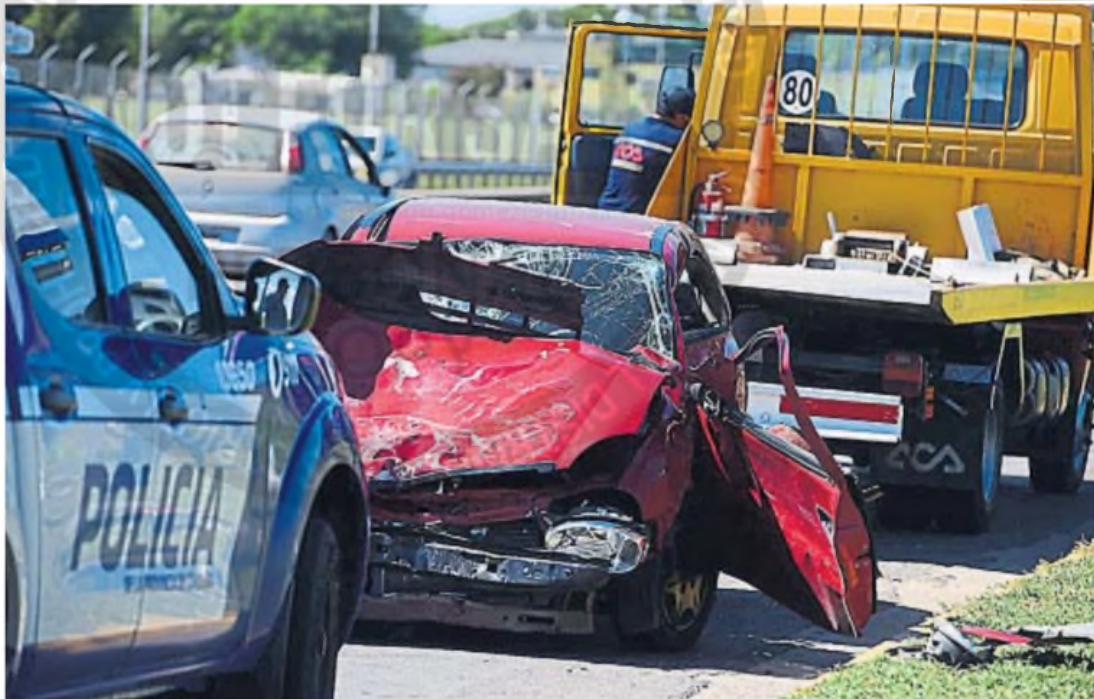
CHOQUE MÚLTIPLE Y UN MUERTO. La carrera ilegal entre dos autos dejó un joven muerto, además de heridos de gravedad. Investigarán a funcionarios municipales.