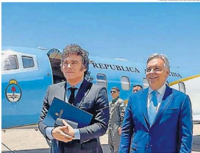
ARMONÍA. El presidente Milei agradeció el apoyo de gobernadores peronistas, entre ellos, Llaryora.

REPERCUSIONES. Agradeció el respaldo a los gobernadores peronistas, entre ellos, Llaryora. También a los radicales. Volvió a mostrarse cercano a Juez. Los libertarios extrañaron a Karina Milei.