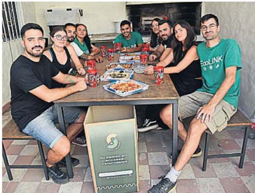
SIN DESPERDICIO. Los alimentos que se piden por "delivery" también pueden venir en envases retornables plásticos.

En octubre supieron que habían ganado y con los fondos obtenidos empezaron la fase I del proyecto, que finalizó el 20 de diciembre y cuyos resultados deberán ser presentados a Bloomberg.