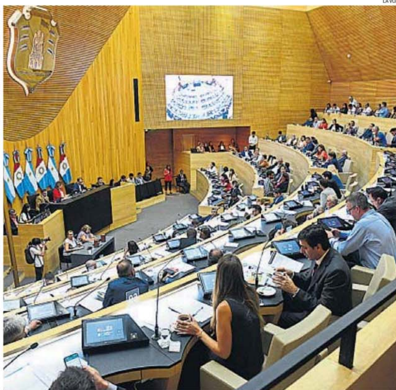
2025. El tratamiento legislativo del proyecto será el año próximo, justo cuando Córdoba renueva nueve diputados nacionales.

"Existe cierta incomodidad y hartazgo con un Poder Judicial alejados por no tener la exigencia y la premura que exige el cara a cara de la