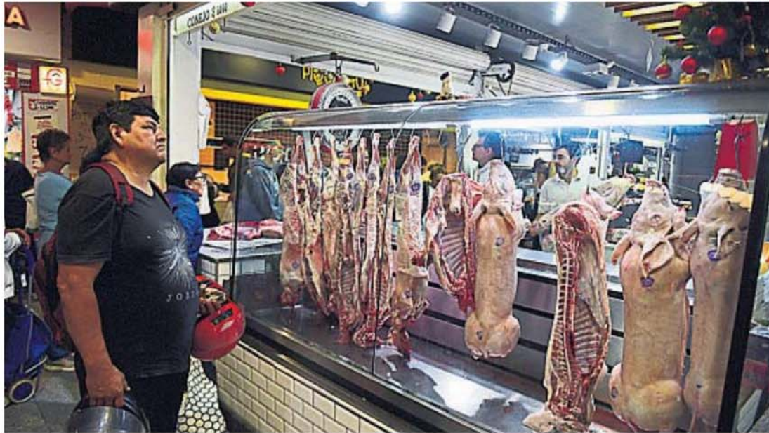
MUY VENDIDOS. Los cabritos y los lechones estuvieron entre los productos cárnicos más demandados. En los cortes de vaca, el tradicional pececito y el matambre.