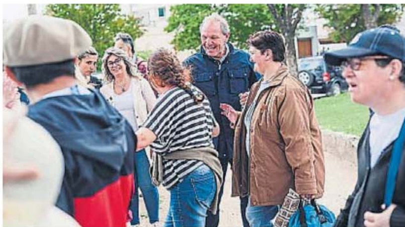
A través de las vecinales, el municipio desarrolla su trabajo en territorio.

"Todo nuestro plan de gestión se desarrolla sobre la premisa de lograr una ciudad centrada en las personas y que apueste al crecimiento continuo", aseguró De Rivas.