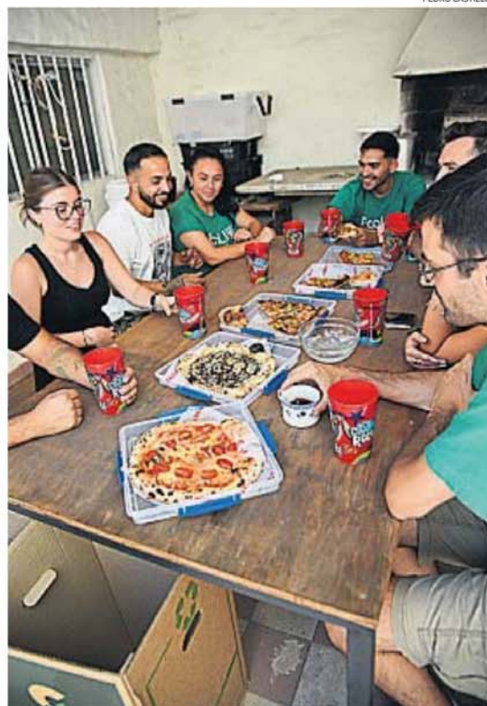
PIZZA EN "TUPPER". El envase reciclable evita el cartón y el plástico de un uso.

Al momento de hacer el pedido en alguno de los comercios adheridos, el cliente debe aclarar que quiere un