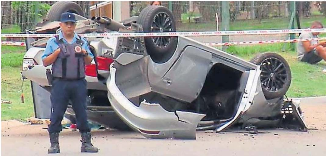
PICADA TRÁGICA. Ruedas para arriba quedó uno de los vehículos que participó de la picada en Villa Warcalde en la que murieron dos personas en el año 2019.