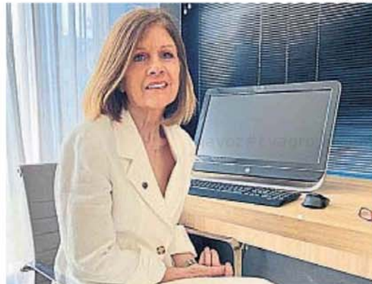
CHIAPERO. La titular de la Asociación de Magistrados cuestionó la propuesta.

La nota añade que "se agudiza la preocupación al advertir que el proyecto tiene previsto que el acceso a dichos cargos no exigirá el tránsito por el Consejo de la Magistratura, sino que se designarían por el mismo sistema previsto para los vocales del