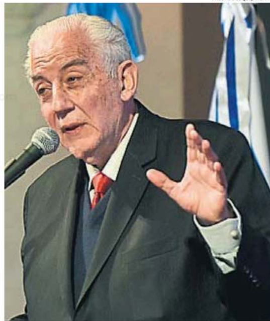
ANGULO. El titular del TSJ pidió "diálogo interinstitucional" y respeto a las normas.

Señaló que, a los efectos de mejorar el fuero penal, se están creando nuevas fiscalías en el interior y en Capital, además de fiscalías especifi-