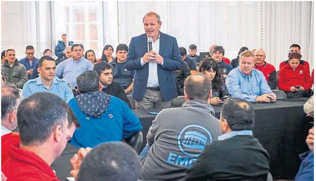
El intendente Guillermo De Rivas cumplió su primer año de gestión al frente de la Municipalidad de Río Cuarto.

Las empresas tienen que constituir domicilio en Río Cuarto y designar un representante o apoderado. Además, deben inscribirse ante la autoridad de aplicación y abonar un Fondo de Movilidad.