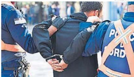
ALLANAMIENTOS. Se hicieron 21 allanamientos por violencia familiar y de género.

De los allanamientos participaron también el Grupo de Saturación Móvil, los CAP de los Distritos Policiales