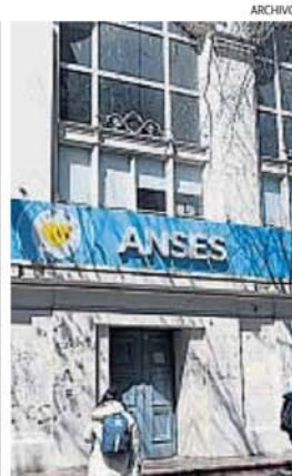
ANSES. El órgano nacional encargado de las pensiones y las jubilaciones.

Ese resabio de ancestral cultura, evidentemente, hoy ya está perdido, y el respeto por los mayores ha sido sustituido por el desprecio hacia los que la militancia libertaria define como "viejos meados". Todos, sin embargo, tarde o temprano, llegarán a viejos, y es su derecho que el Estado les dé lo que les corresponde, lo que nos corresponde, luego de una vida de aportes y de trabajo para el bien de la comunidad.