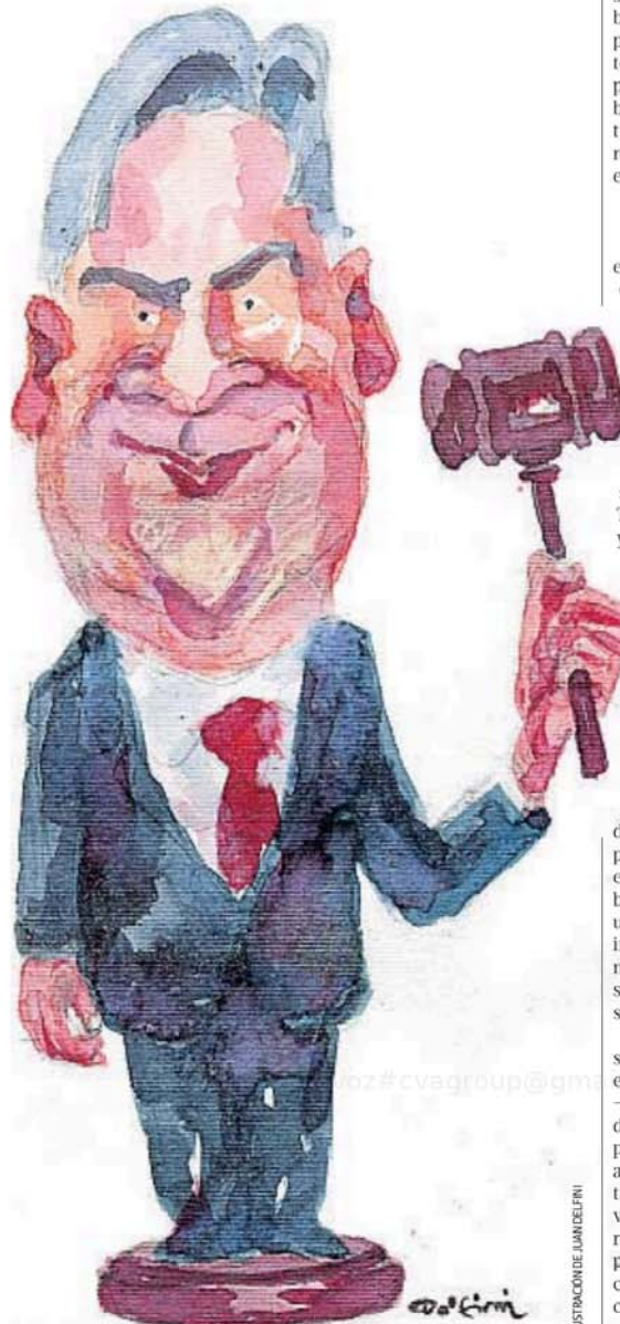
ILUSTRACIÓN DE LUAN DELFINI

Tal vez la explicación correcta sea la más evidente: fue un grueso error político de un peronismo que –especialmente en la Unicameral y de madrugada– suele exhibir el perfil que menos lo favorece. Más allá de lo legislativo, para muchos también sonaron esta semana varias alarmas sobre el tipo de operadores a los que apela Llaryora para sentar sus bases en una Justicia que recién ahora registra el cambio de mando que ocurrió hace un año.