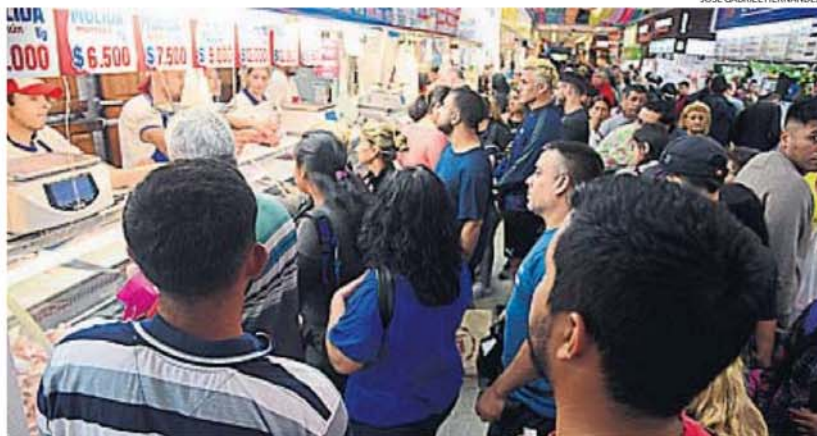
SÁBADO CALIENTE. Mucha gente aprovechó el día de ayer para comprar sus cortes de carne en el Mercado Norte de Córdoba.