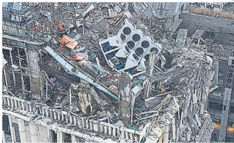
ESCOMBROS. Bomberos trabajan en un edificio destruido en Kiev por ataque ruso el jueves. Ucrania respondió ayer a la agresión.

EXPANSIÓN. El Ejército ucraniano marcó así un nuevo hito en la escala de la guerra que comenzó hace 34 meses. Tropas rusas cierran el cerco sobre Kurakhove, situación considerada "la más desafiante" por Volodimir Zelenski. Analizan un alto el fuego.