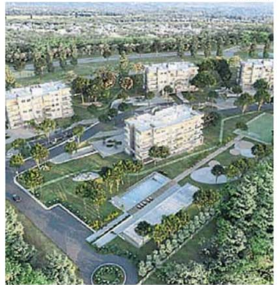
VISTAS DEL PARQUE. Así se promocionaba con un “render” el fallido desarrollo.