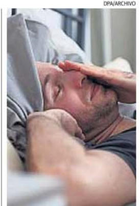
PAUSA. Necesaria en chicos y adultos para recuperar fuerzas.

Un pido gancho para detener los insultos que dominan las discusiones públicas. Para que no todas las diferencias de opinión se expresen con una sordera emocional e ideológica que, con asombrosa facilidad,