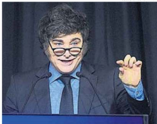
JAVIER MILEI. Se opone a cualquier modelo político de consensos.

Insfrán lleva 30 años ininterrumpidos gobernando Formosa. Esa rémora monárquica nunca fue objetada por sus pares. Política de buenos modales.