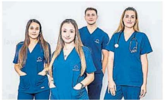
La Adaarc dio recomendaciones frente a posibles golpes de calor.