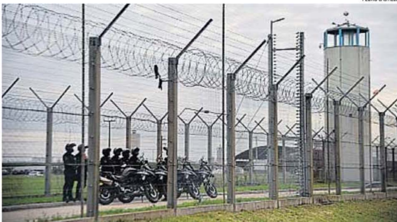
SATURADAS. Las cárceles de Córdoba están desbordadas en su capacidad de alojamiento. En particular, el complejo de Bouwer.

SERVICIO PENITENCIARIO. La Cámara Nacional de Casación Penal ordenó la medida. Critica el alojamiento de hasta cinco reclusos en una celda prevista para una persona. Córdoba intima a la Nación por "sus presos".