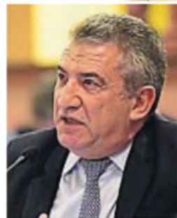
SERGIO URRIBARRI. El exgobernador fue condenado a ocho años de prisión.

Los fiscales habían pedido el cumplimiento de la condena de Urribarri y de Aguilera, y luego de dar por "acreditados los requisitos de admisibilidad del recurso, afirmaron que para "los mismos solicitaban la prisión preventiva efectiva, fundada particularmente en el riesgo serio de fuga, en atención al monto de la pena y modo de ejecución impuestos por senten-