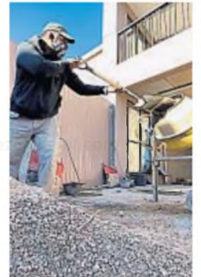
CONSTRUCCIÓN. El 2024 cerrará con una baja de 20% frente a 2023.