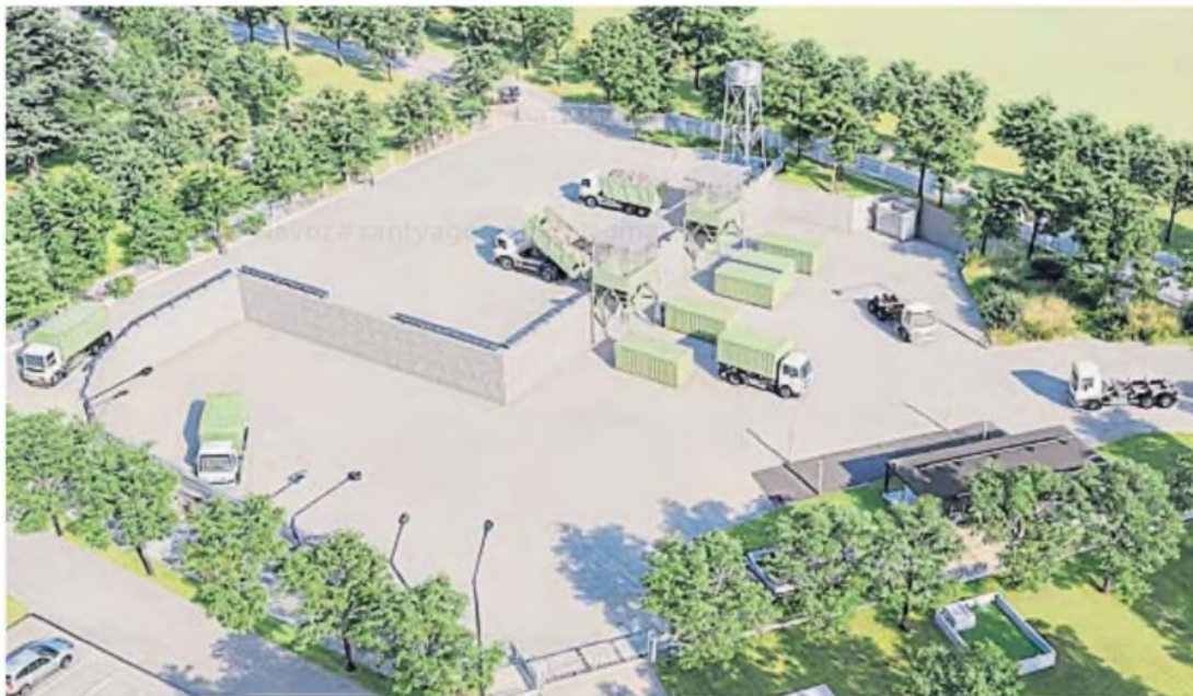
EN LA CALERA. El diseño de cómo se vería el centro de transferencia de residuos urbanos, desde el que se derivarán compactados hacia el predio de Cormecor, en la Capital.