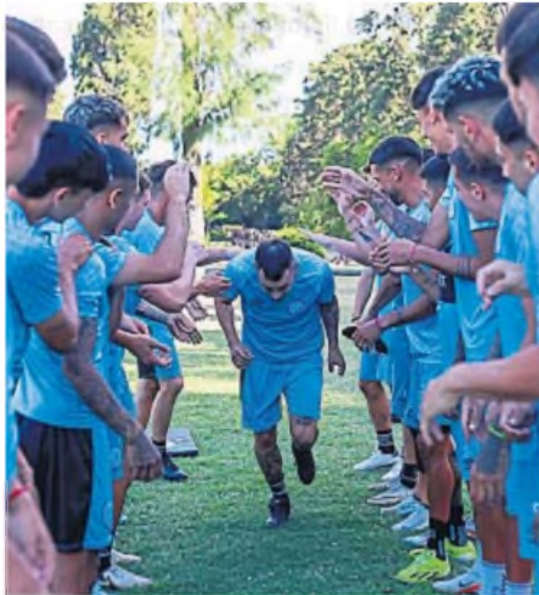
BIENVENIDA. El plantel celeste le hizo el pasillo ayer a su refuerzo estrella.

"El Chino" está otra vez en Alberdi tras desoir sondeos de Boca, River y San Lorenzo. A los 32 años, el volante