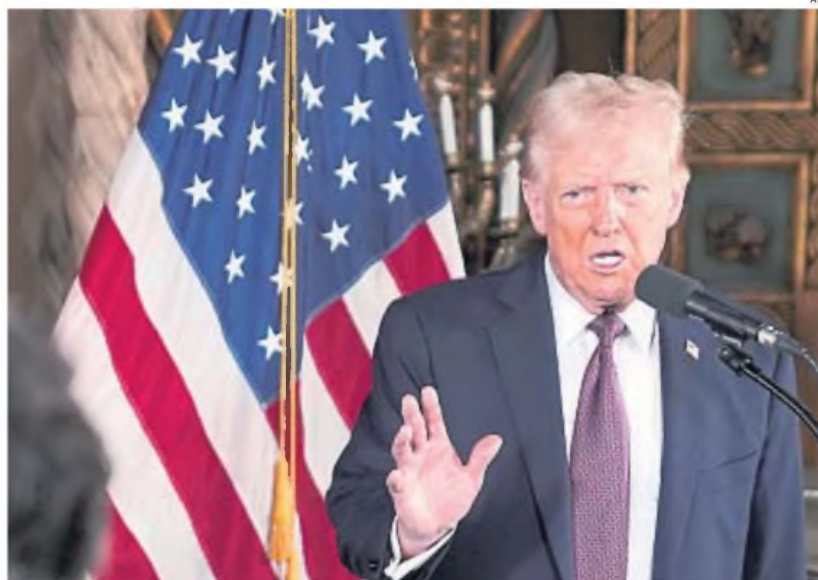
PRESIDENTE ELECTO. Donald Trump sorprendió al mundo con fuertes declaraciones sobre sus planes de expansión.

ESTADOS UNIDOS. El presidente electo dijo que Canadá, Groenlandia y el Canal de Panamá deberían estar bajo control de su país, y propuso cambiar el nombre del Golfo de México. Fuertes reacciones de los dirigentes de los países involucrados.