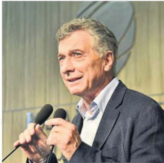
PEDRO CASTILLO / ARCHIVO

El presidente evitó pronunciarse sobre esa revelación, que le atribuyen a su asesor Santiago Caputo. "Es una denuncia extremadamente grave y están involucrados los kirchneristas y el macrismo (...) Es algo de una gravedad institucional tan grande que amerita una investigación muy seria",