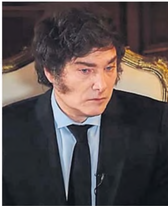
RESERVAS. Milei dijo que el país busca dólares frescos para liberar el cepo cambiario.

“Hay que discutir qué tamaño de gasto público quiere la sociedad, porque para sostenerlo hay que financiarlo y eso se hace con impuestos”.