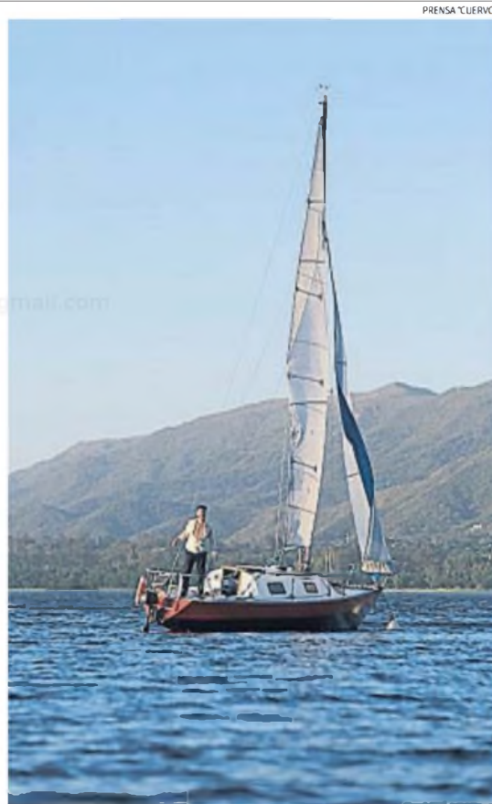
ORIGINAL. La obra transcurre en un velero, y el público está sobre un catamarán.

Boasso y Raspanti explican que no la pensaron para Carlos Paz específicamente. Quizás, si lo hubieran hecho, se olería algo artificial. No, no desde el agua: me refiero a algo artificial como esos gags forzados y chistes repetidos sobre el cordobesismo que abundan en otras propuestas y que, sin embargo, encantan a gran parte