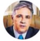
Martín Llaryora Gobernador de Córdoba

"Hay que sacarle la pata de encima al campo y liberar toda su capacidad productiva. ¿Se imaginan lo que sería nuestra provincia si ese dinero quedara en manos de quienes invierten?"