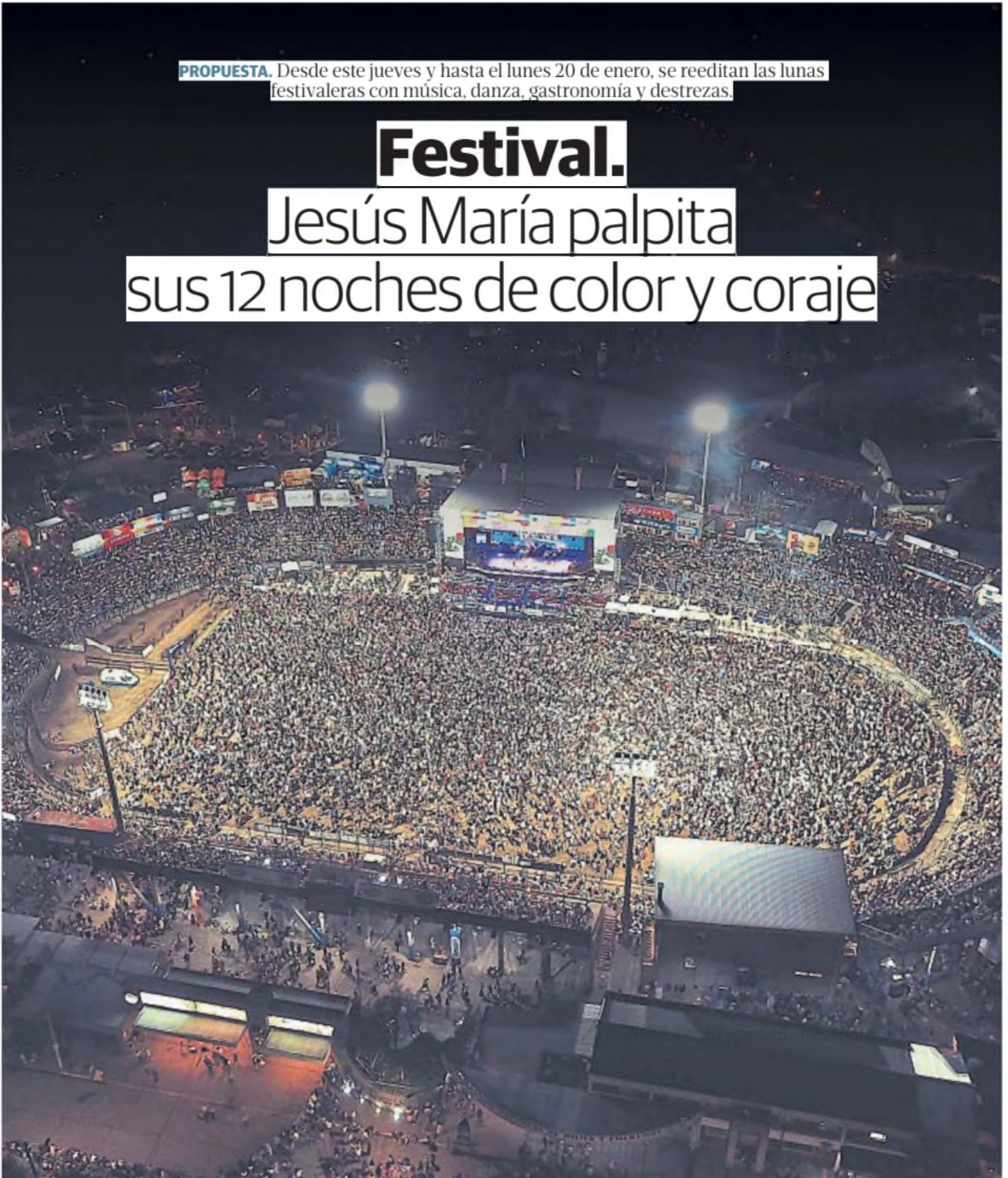
GIGANTE. El anfiteatro José Hernández se prepara para recibir a miles de visitantes de todo el país.