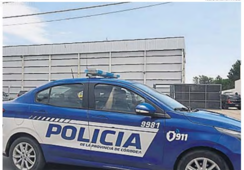
PESQUISA ABIERTA. La Policía trabaja para dar con la banda que logró entrar a robar a la fábrica de hielo en Coronel Olmedo.

madrugada del miércoles gracias a un guardia de seguridad de una empresa vecina que observó movimientos extraños de personas en la firma y alertó al 911.