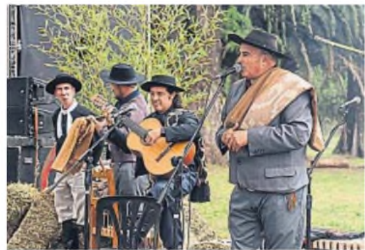
CLÁSICO. No faltarán los tradicionales payadores.