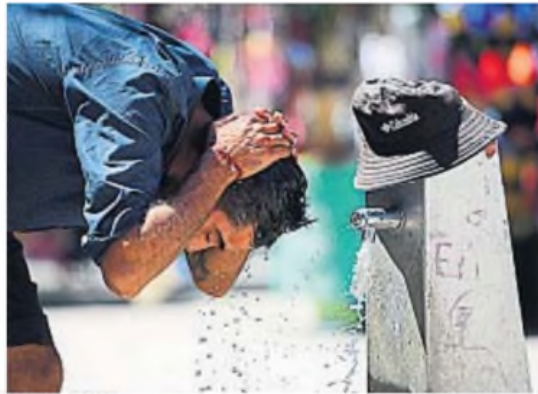
CÓRDOBA. Esta semana hubo jornadas calurosas. Pero se vienen más intensas.

El viernes 17 recién llegaría un alivio temporal con tormentas y chaparrones que refrescarán el ambiente, aunque las temperaturas seguirán siendo altas.