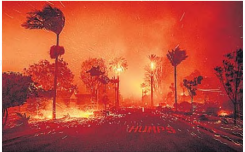
LLUVIA DE FUEGO. Alimentadas por el fuerte viento, las llamas avanzan y dejan destrucción en varios poblados de Los Ángeles.

DRAMA. Hay cuatro frentes imparables alimentados por fuertes vientos. No hay pronóstico de lluvia. Hay evacuaciones masivas e incógnitas sobre el origen de las llamas.