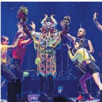
SIDAD. El festival mostrará la variedad cultural argentina.

Este año, se sumó la propuesta de la "plataforma 360°" para quienes quieren llevarse su registro audiovisual dentro del predio.