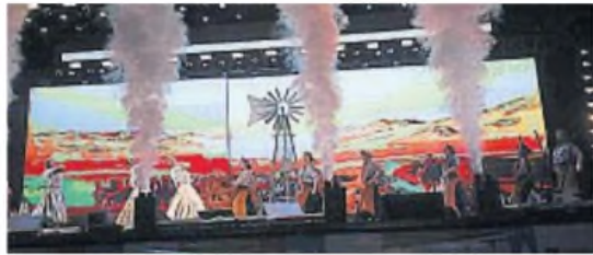
ACCESO. Las entradas se pueden conseguir en paseshow.com.ar y en las boleterías del anfiteatro José Hernández.

Las entradas para la edición 59° del Festival Nacional de Doma y Folklore de Jesús María se pueden conseguir vía web en paseshow.com.ar y también en las boleterías del anfiteatro José Hernández, sobre calle Cleto Peña.