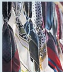
PASEOS. Decenas de artesanos exponen sus producciones en las instalaciones del predio.

A partir de esta determinación, anualmente se irán sumando nuevos colegios a la institución, los que recibirán los beneficios que brinda cada ciclo festivalero.