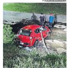
VUELCO. En la fuga, el ladrón cayó con el auto a un canal de Circunvalación.

El procedimiento se extendió hasta la colectora de la Circunvalación. En medio de la fuga, el delincuente perdió el control del volante y el coche terminó dado vuelta en un canal de desagüe. Pese al vuelco, el ladrón escapó corriendo y fue a refugiarse hasta la entrada de una vivienda en barrio Parque Liceo, donde fue cercado y detenido. En el operativo, hubo disparos con balas de goma.