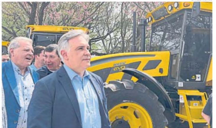
RECLAMO. El gobernador Martín Llaryora coincidió con el santafesino Pullaro en reclamar bajar las retenciones al agro.

Las declaraciones coincidentes de Llaryora y Pullaro no sorprenden, ya que ambos gobernadores administran dos provincias de similares características, en las cuales el cam-