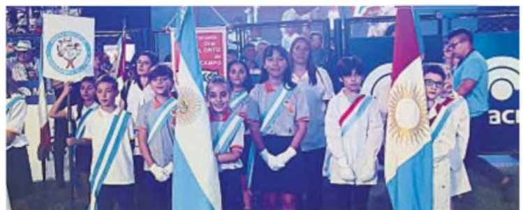
SOLIDARIDAD. Las escuelas participantes recibieron más de 200 millones de pesos tras la edición 2024.