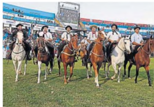
CAMPO. Habrá alrededor de 75 montas por noche entre los diferentes campeonatos.

Están dispuestas 250 luminarias en el escenario y otras 64 sobre el campo del anfiteatro José Hernández.