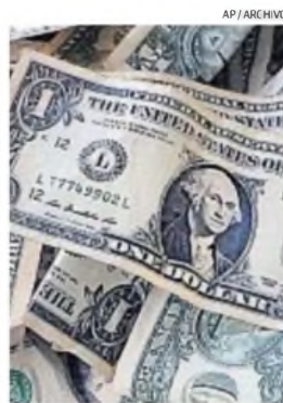
DÓLARES. Los billetes de cara chica son válidos y de curso legal.

Tampoco entremos en pánico y confundamos también a los ejemplares "cara grande", emitidos después del año 1996, que no han tenido, no tienen ni tendrán ningún inconveniente, porque son tan perfectos como los vulgarmente denominados "azules".