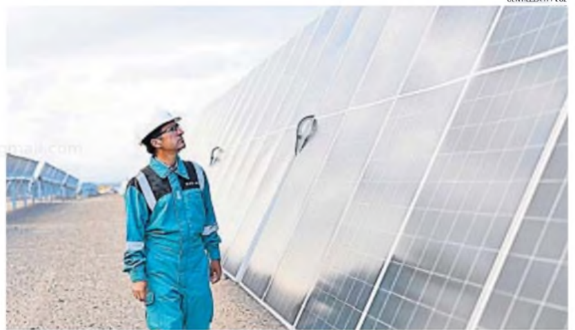
EL PRIMERO. Parque solar El Quemado, el primer proyecto aprobado en el Rigi, de la alianza entre Luz del Campo e YPF Luz

Ahora, la Agencia de Recaudación y Control Aduanero (Arca) generará un Cuit especial para la alianza Luz del Campo-YPF Luz, así como tam-