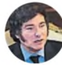
Javier Milei Presidente de la Nación

"Hay que sacarle la pata de encima al campo y liberar toda su capacidad productiva. ¿Se imaginan lo que sería nuestra provincia si ese dinero quedara en manos de quienes invierten?"