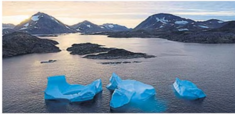
GROENLANDIA. La isla más grande del mundo es un objetivo geopolítico y económico para Estados Unidos.

Groenlandia es una isla estratégica no sólo por su ubicación en el Ártico, sino también por sus vastos recursos naturales. Minerales y tierras raras, esenciales para la transición energética, convierten a este territorio en un activo invaluable.