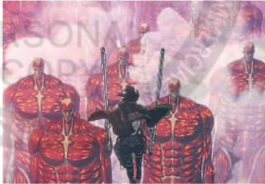
ATTACK ON TITAN. Se estrenó en el cine con mejoras en la animación y el sonido.

El final del emblemático animé trajo todo tipo de controversias. Tal y como recuerda el periodista loaquín