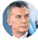
Mauricio Macri Líder del PRO

"Los casi 27 mil policías que tiene la Ciudad de Buenos Aires tienen que cuidar las calles y a los porteños, no a los presos. El Ministerio de Seguridad y el Servicio Penitenciario Federal tienen que cumplir con su rol".