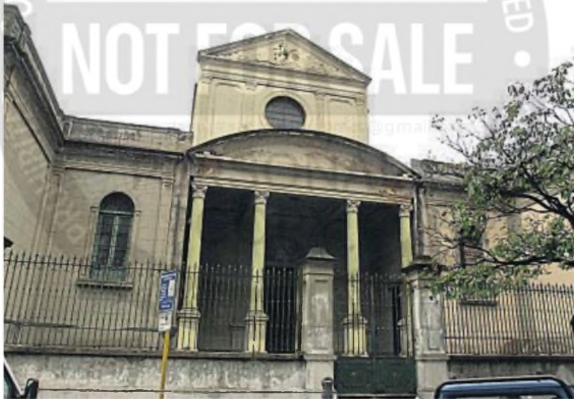
BUEN PASTOR. La mujer condenada aseguraba tener contactos en la Iglesia porque había sido criada en el Buen Pastor.