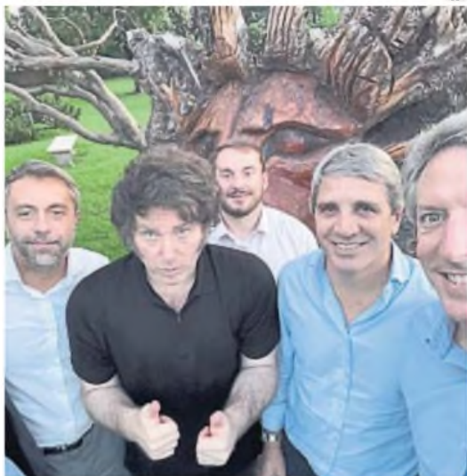
ANÁLISIS. Milei, el ministro Luis Caputo y economistas evaluaron ayer el plan.

La administración de Milei cumple con la sentencia, pero, en lugar de que el dinero sea transferido día a día por el sistema de coparticipación, se cancela por semana como giro no automático.