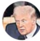
Donald Trump Presidente de Estados Unidos

(A Macri) "Al transferir la Policía en el gobierno del que fuiste presidente debías pasar la Justicia y los presos. No lo hiciste. Es fácil tener Policía y dejar que los ciudadanos de todo el país sigan pagando los presos a la ciudad".