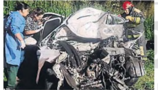
DESTRUIDO. Así quedó el Fiat Cronos que colisionó con el colectivo.