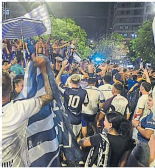
LOCURA TOTAL. Los hinchas de la "T" se adueñaron de Córdoba para celebrar.

SUPERCOPIA INTERNACIONAL. El Albiazul se sacó de encima la espina de las finales perdidas en Copa Argentina y logró el título que tanto anhelaba después de un partido dramático. Fue en los penales.