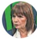
Patricia Bullrich Ministra de Seguridad

"Los casi 27 mil policías que tiene la Ciudad de Buenos Aires tienen que cuidar las calles y a los porteños, no a los presos. El Ministerio de Seguridad y el Servicio Penitenciario Federal tienen que cumplir con su rol".