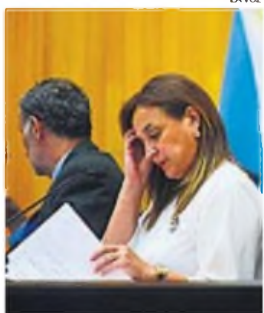
PRUNOTTO. El recurso busca que la vicegovernadora dé información.

Al remarcar su postura pro-Estado, Passerini dijo: “El Estado es indispensable y es claramente parte de la solución cuando funciona con eficiencia, con inteligencia, construyendo soluciones. Hoy ningún cordobés y ninguna cordobesa renegaban de Ciudadano Digital; al contrario, es un derecho”, dijo el intendente