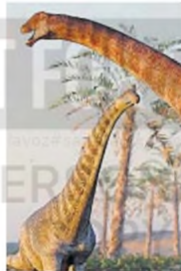
“ CHADRITAN CALVOI ”: La especie de dinosaurio herbívoro hallada ahora

numerosos fósiles de peces, como pejelagartos y peces pulmonados, que no son comunes en la región.