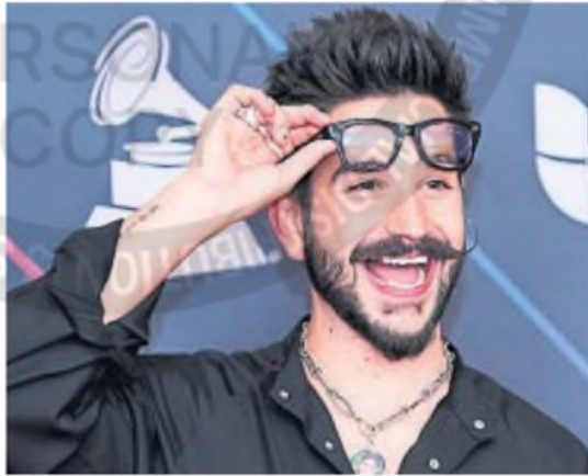
CAMILLO. El cantante colombiano tendrá hoy su esperado regreso a Córdoba

Musicalmente, el artista produjo un disco con sonidos latinos que van desde la salsa, la cumbia, la balada y el pop.