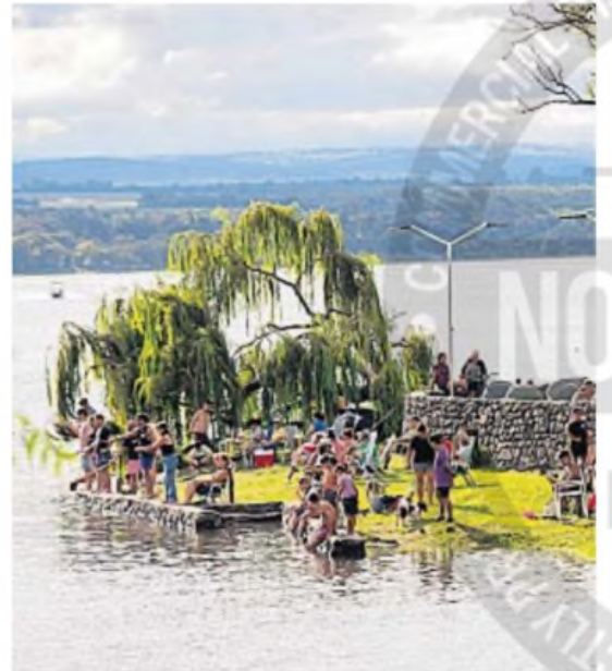
EMBALSE. El lago de Calamuchita subió y estaba ayer a 80 centímetros del vertedero.