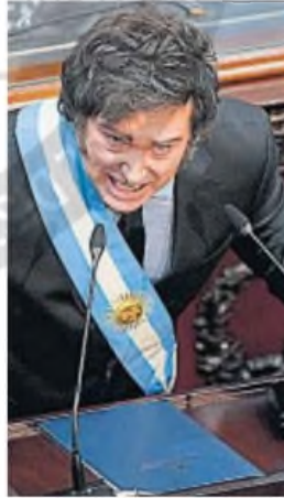
MOMENTO. Hay un contraste entre el Milei de 2024 y el de inicios de 2025.

En Córdoba, el momento de Milei, que Cristina Kirchner comparó —y desea en lo más íntimo que así sea— como el de un reloj de arena dado vuelta, también es observado por la cúpula del poder provincial.