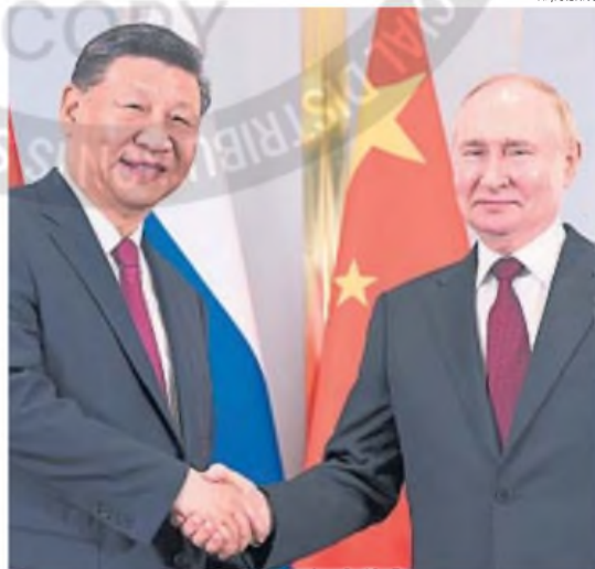
CERCANOS. Xi Jinping y Putin, ganadores de la pelea entre Trump y Zelenski.

lucha existencial por su soberanía y su derecho a alinearse con Occidente. Pero el enfrentamiento trasciende las fronteras regionales y se ha convertido en un tablero de ajedrez geopolítico donde grandes potencias, como Estados Unidos y China, desempeñan roles determinantes.