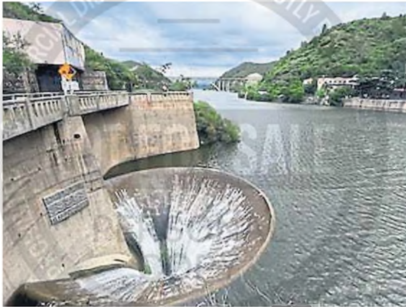
SAN ROQUE. Es el único que este verano superó el vertedero. Actualmente, con más de 20 centímetros por arriba de su embudo.