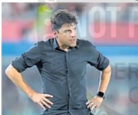
"CACIQUE". Medina logró la tan ansiada consagración con Talleres.