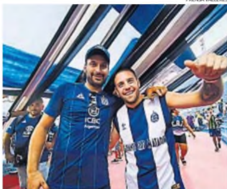
ALBIAZULES. Miles de hinchas viajaron para alentar. Inolvidable.

Talleres campeón. Con el alma, con su gente. Para la historia. Y para siempre.