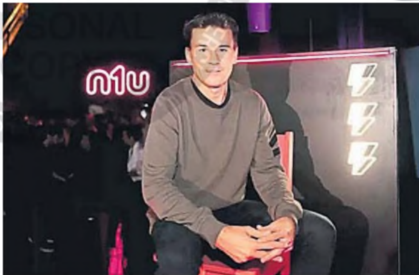
CORIA. El extenista sigue invirtiendo en las fintech. Deja de lado la billetera virtual, pero incursiona en un nuevo modelo de negocio.

Según fuentes del sector consultadas por Forbes Argentina, durante los últimos meses, quienes quedaron al mando de nlu realizaron análisis de due diligence que llevaron a la conclusión de que el modelo de