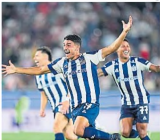
DESBORDADOS DE ALEGRÍA. Talleres celebra su consagración en Paraguay

Belgrano igualó ayer sin goles en Fortaleza de Colombia, por la fecha 2 de la Zona B de la Copa Libertadores Sub 20. Están a un paso de avanzar de ronda.