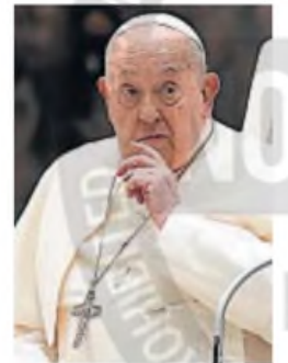
PAPA. Hace 20 días que está internado en el hospital Gemelli.

Las autoridades de Estados Unidos cortaron el intercambio de información de Inteligencia con Ucrania, según confirmó el director de la CIA, John Ratcliffe, después de que Washington suspendiera la ayuda militar a Kiev, en medio de la invasión desatada por Rusia en febrero de 2022. La información sobre las intenciones y movimientos militares de Rusia ha sido crítica para la defensa de Ucrania y un fuerte indicio de apoyo por parte de Estados Unidos y otros aliados occidentales. La suspensión se produce después de que Trump detuvo la ayuda militar a Kiev y luego de la discusión que tuvo con el presidente Zelenski en la Casa Blanca, la semana pasada.