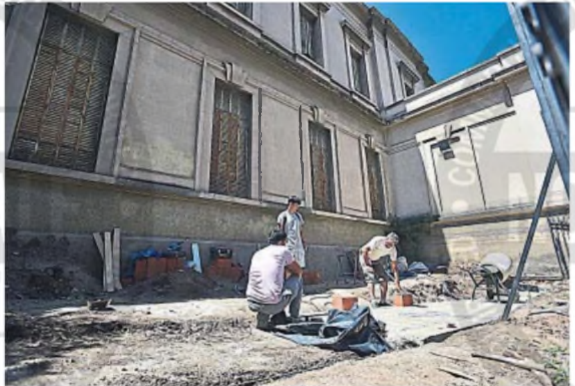
EN OBRA. La construcción de la rampa para acceder al Incasup comenzó hace unos días y tendría un costo de unos $ 18 millones.

ACCESIBILIDAD. Se trata del Incasup, un instituto de enseñanza del Arzobispado de Córdoba. Una estudiante había hecho público su pedido por la dificultad que tenía para acceder al edificio.