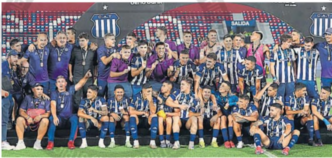
PARA LA HISTORIA. El plantel campeón y todos los colaboradores celebran en lo más alto la consagración en La Nueva Olla, en Asunción del Paraguay.

SUPERCOPIA INTERNACIONAL. En una definición por penales de locos, logró el título que tanto anhelaba. Crónica de una consagración que se hizo esperar.