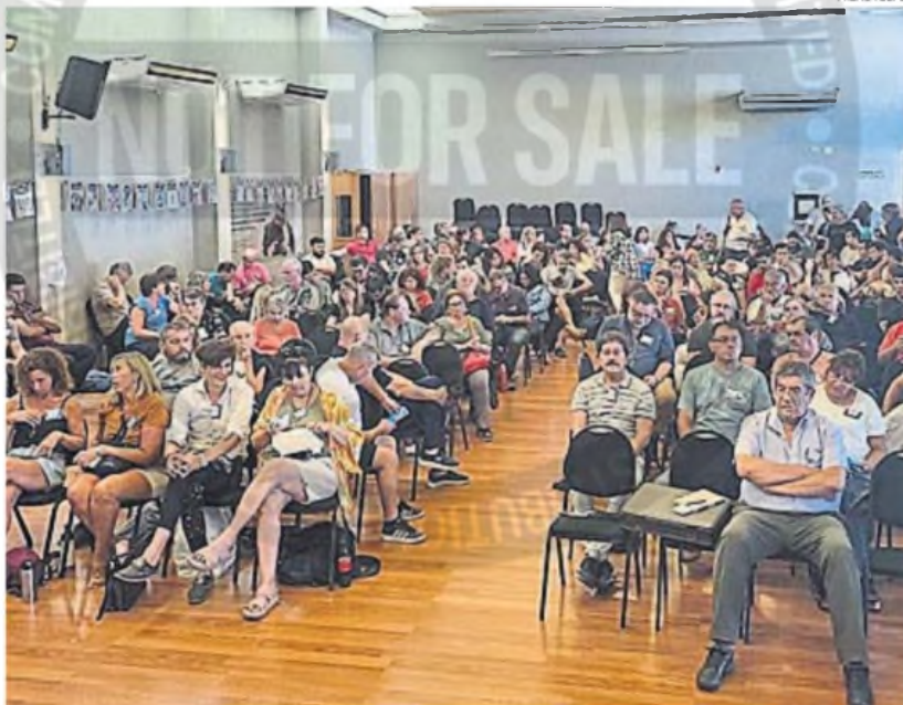
RECLAMO. La asamblea docente podría resolver nuevas medidas de fuerza, en el caso de que no haya una oferta "superadora".