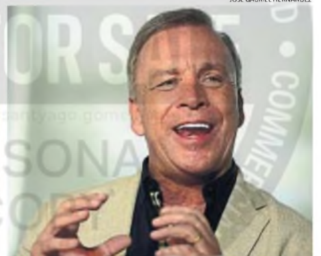
FASSÍ. El presidente albiazul en su hora más gloriosa con Talleres.