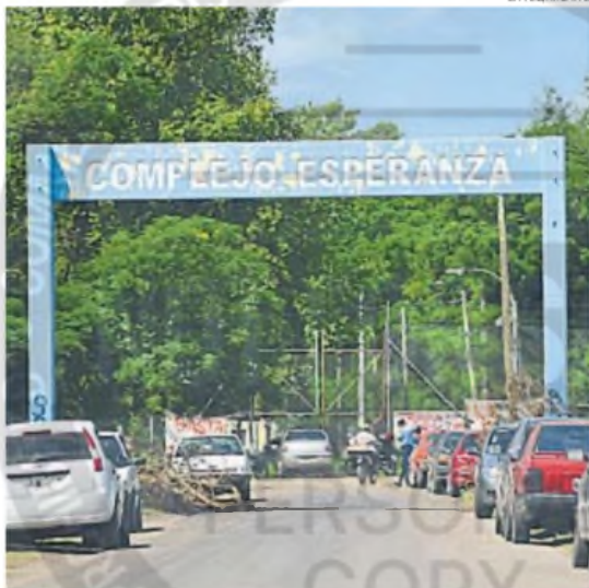
COMPLEJO ESPERANZA. M.S. fue detenido no bien cumplió los 16 años.