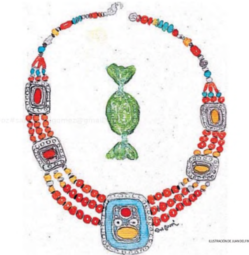
ILUSTRACIÓN DE JUAN DELFIN

El cielo plomizo de enero y el paisaje humedecido alteran la postal esperada. Camino a Tetuán divisamos a dos personas que cuidan a dos camellos al borde de la ruta. Se trata de dos hermosos ejemplares debidamente decorados con borlas de colores. Están echados en el suelo, en medio de charcos. Mi hija mayor se