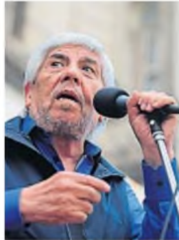
SALARIOS. El acuerdo alcanzado por Hugo Moyano le vino bien al Gobierno.

La salida aún requiere de mucho esfuerzo, aunque el Presidente no usó esa palabra en los augurios para este año.