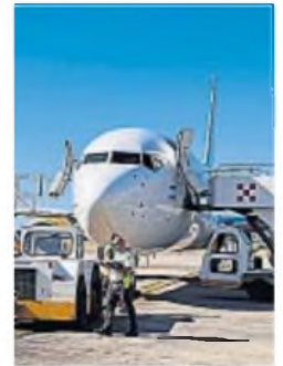
EXTRANJERA. La firma Air Class Cargo es de capitales uruguayos.

La estrategia de Kueider para pedir la anulación de la sesión que lo destituyó tiene que ver con que la vicepresidenta Victoria Villarruel no podía cumplir en la sesión con sus funciones de presidenta del Senado, ya que estaba en ejercicio del Ejecutivo al hallarse el presidente Milei de viaje en el exterior.