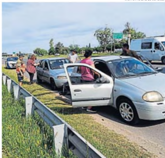
ASISTENCIA. La Guardia Urbana asistirá a conductores en problemas

166 intervenciones diarias. Es lo que tiene registrado en su primer año de trabajo la Guardia Urbana capitalina, dotada hasta el momento de 400 agentes y 20 móviles. El promedio son cinco mil intervenciones mensuales.