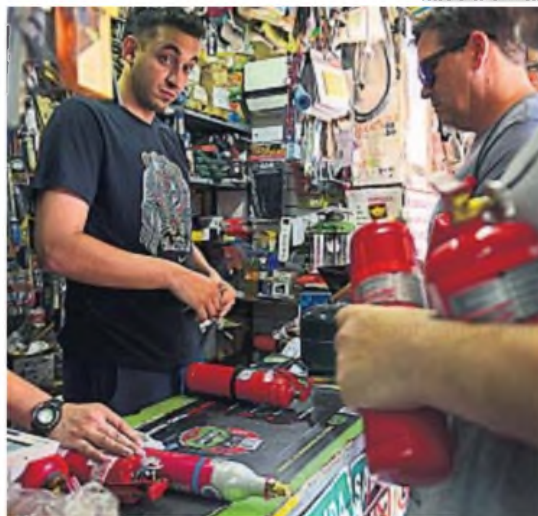
FIEBRE POR LOS MATAFUEGOS. Comerciantes manifiestan que muchos llegan en mal estado, lo que demora su proceso de recarga.

"No tenemos un minuto de respiro", confió.