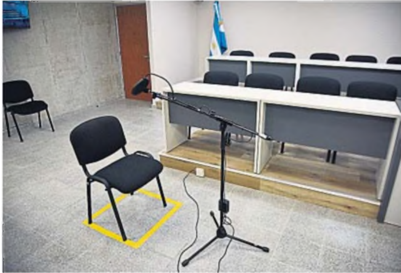
SE ABREN LAS AUDIENCIAS. Se acondicionó una sala especial para el megajuicio por las muertes de bebés en el Neonatal.