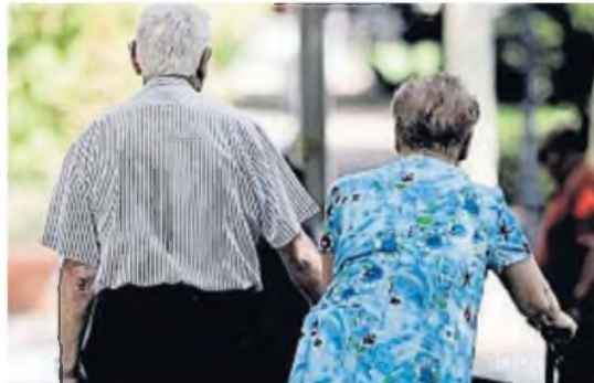
JUBILACIONES. Habría un premio para quienes no debieron pedir una moratoria.

Como buena parte de las decisiones que tiene pensadas el Gobierno para este 2025, la reforma previsional estaría atada al resultado de las elecciones de medio término.