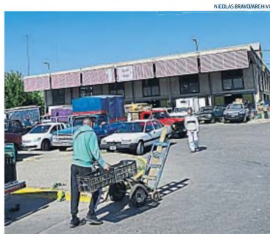
ABASTO. En uno de los proyectos, el mercado capitalino incorporó energía solar.

En este marco, Ruival insistió en que la intención de la agencia es lograr un