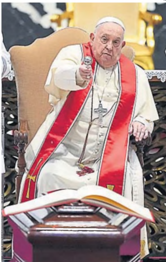
PAPA FRANCISCO. Preocupado por las víctimas infantiles de guerras y migraciones.

"La educación es una esperanza para todos: puede salvar a los migrantes, a los refugiados, de la