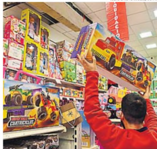
DÍA DE REYES. Las jugueterías buscan en estos días agregar ventas a las de Navidad.

Mientras niños y niñas se sacan fotos y reciben obsequios, se intenta que sus familias aprovechen descuentos y promociones en los negocios. La campaña se extendió más allá del Centro, con ofertas en hipermercados. Durante la semana previa al Día de Reyes, se ofrecen descuentos de hasta el 50% en productos demandados para la temporada, como