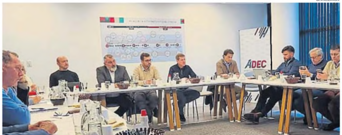
ADEC. A través de las cámaras y otras entidades asociadas, la agencia co-invierte en proyectos para el desarrollo económico de la ciudad, que impactan sobre todo en las pymes.

En el caso específico del Fondo de Competitividad, el directivo analizó que se cierra un año muy bueno, pues "con todos los programas que pusimos