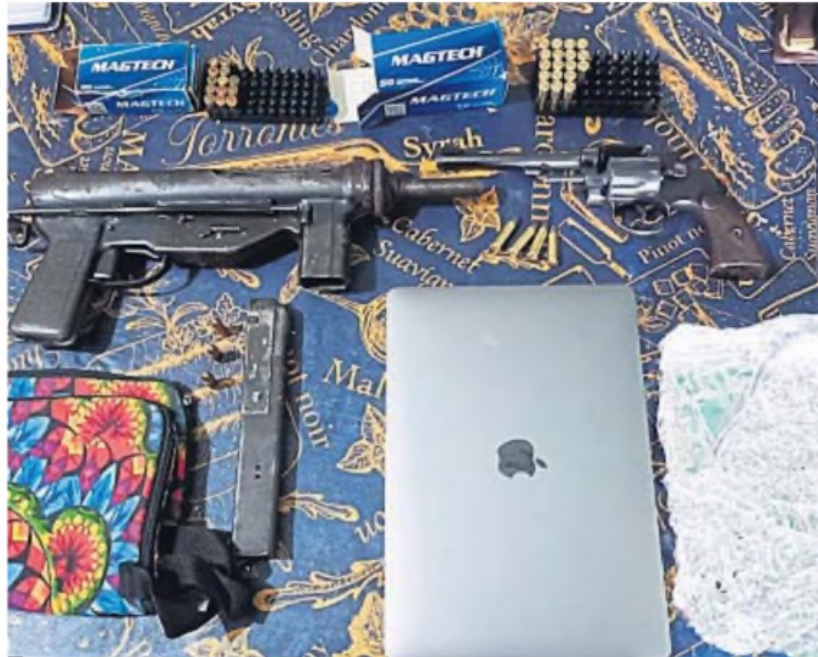
ARSENAL. Una ametralladora y un revólver estaban escondidos tras una pared de "durlock" en una casa de Villa El Libertador

Bajo una madera que hacía las veces de desayunador, sostenida por dos barandillas de durlock, estaban resguardadas varias armas de fuego: un revólver calibre 38 y