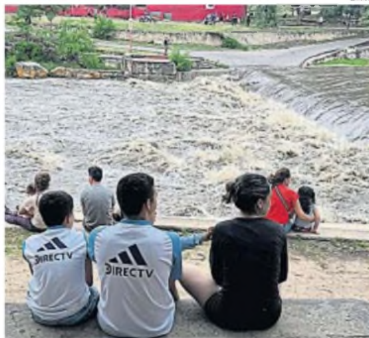
PUNILLA. El río San Antonio crecido, en octubre, cuando se dieron intensas lluvias

En ese marco, ejemplificó que en los embalses serranos sólo el San Roque (en Punilla) llegó antes de finalizar el año al nivel del vertedero.