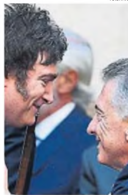
RELACIÓN TENSA. Milei y Macri tratan de definir una alianza electoral.

Se espera que 2025 ofrezca respuestas a estas dificultades que hoy nos parecen severas.