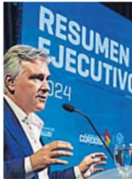
MARTÍN LLARYORA. El gobernador se quita dramatismo a las legislativas.

En privado, Llaryora está convencido de que el resultado de las elecciones legislativas será sólo un “mal tra-