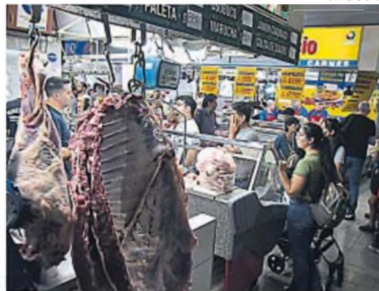
FIN DE AÑO. Hacia el cierre de 2024, las ventas en general aumentaron levemente.

Por un lado, señalan que la política cambiaria sostiene el dólar bajo de manera artificial, lo que hasta ahora fue posible merced al blanqueo impulsado el año pasado y que a futuro el ingreso de dólares frescos dependerá en buena medida de un eventual acuerdo con el FMI.