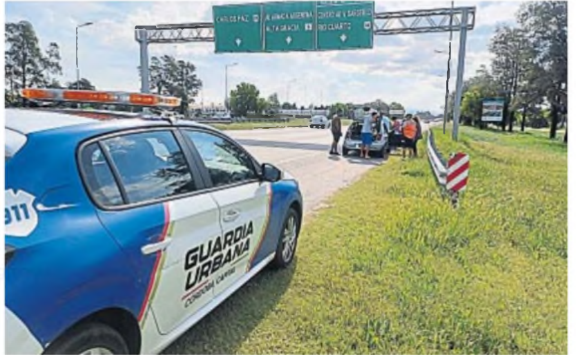
OTRO CORREDOR. La Guardia Urbana coordinará sus patrullajes con la Policía Caminera en la avenida Circunvalación.

CIUDAD DE CÓRDOBA. Los agentes acompañan a la Policía Caminera. Asisten a los vecinos en casos de siniestros viales, desperfectos mecánicos o en cualquier pedido de ayuda.