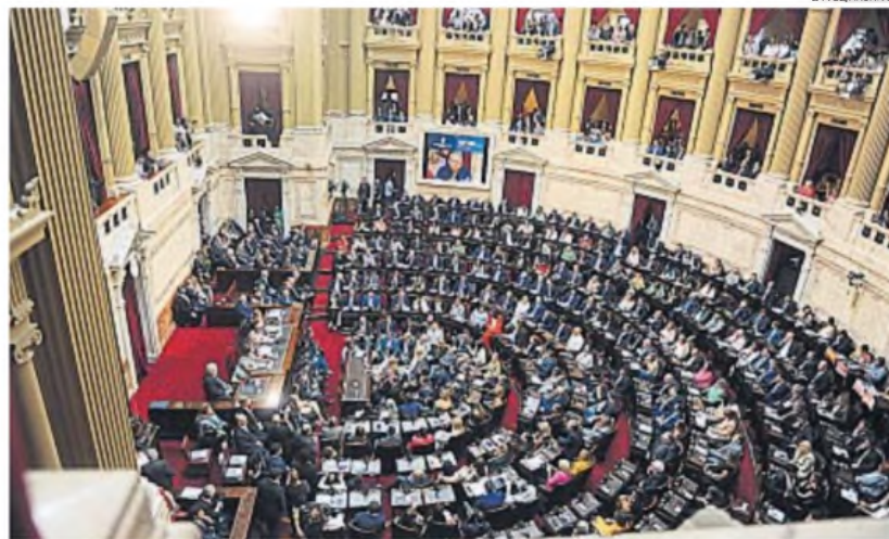
EN JUEGO. Diputados renueva 127 de 257 escaños, mientras que el Senado, 24 de 72. El oficialismo quiere engrosar su fuerza.