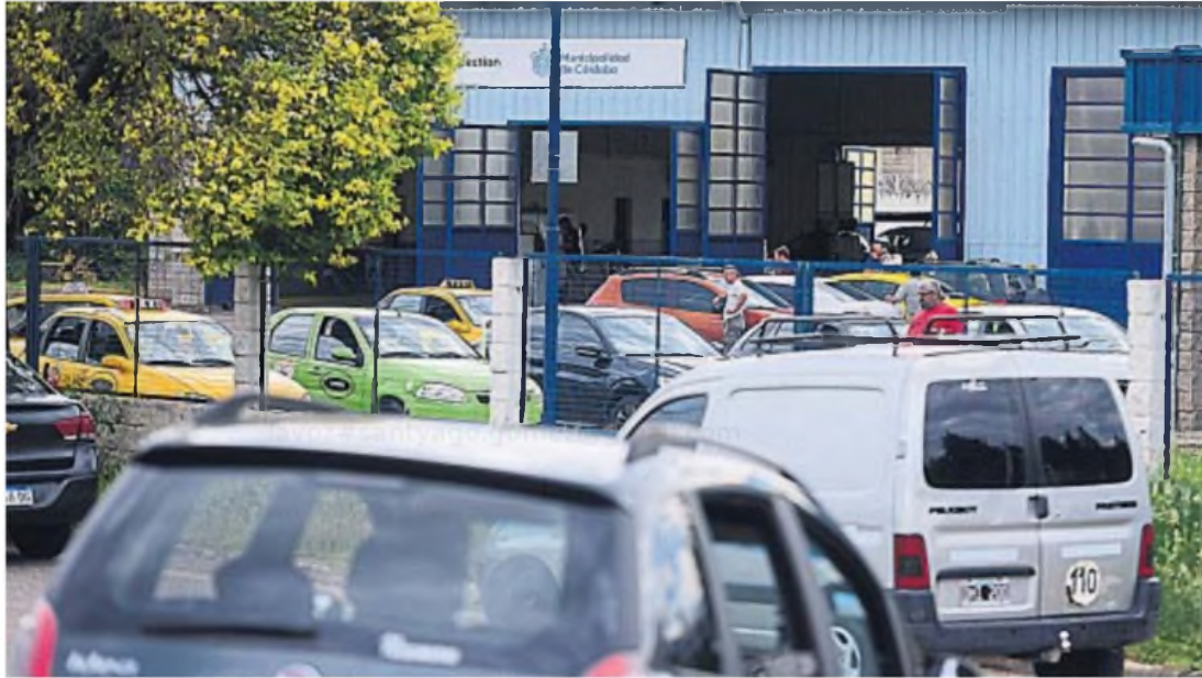
SIEMPRE CON TURNO. Desde la empresa que realiza la inspección técnica vehicular (ITV) aseguraron que luego de dos días con gran demanda, se normalizará la próxima semana.