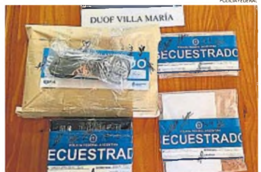
CAUSA FEDERAL. El caso fue investigado por fuerzas federales en Córdoba.