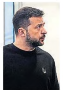
VOLODIMIR ZELENSKI. Pone fichas a la imprevisibilidad de Trump.

Y es que, a la hora de las conclusiones, la clave está en la imprevisibilidad. Según Zelenski, la estrategia que más beneficiaría a su país sería que esa característica personal del próximo inquilino de la Casa Blanca se dirigiera hacia el enemigo común: la Federación Rusa.