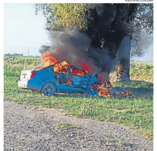
ESTRELLADO. El presunto victimario se mató al chocar contra un árbol.