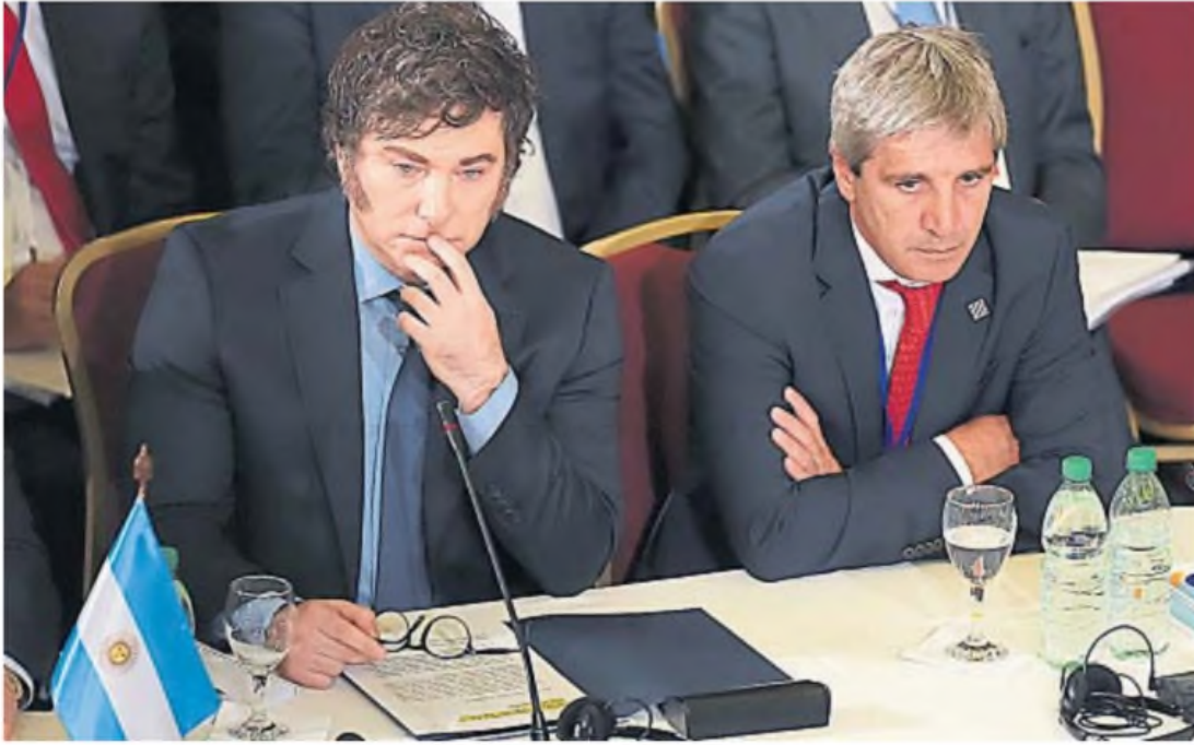
PLAZO. El presidente Milei y el ministro Luis Caputo quieren apurar la salida del cepo cambiario para antes de las elecciones de medio término. Economistas piden más velocidad.