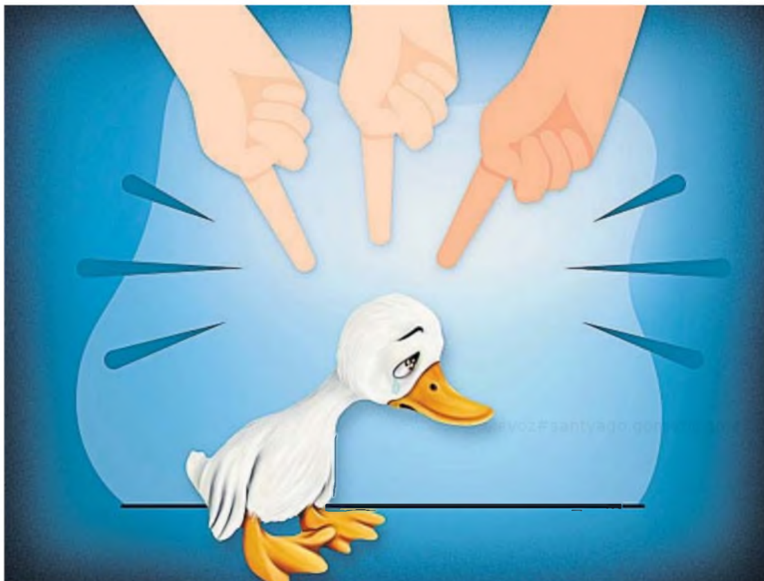
ILUSTRACIÓN DE OSCAR BOLAN

Sería mucho mejor no vincular ningún color de piel o de pelaje con el hecho de ser un villano.