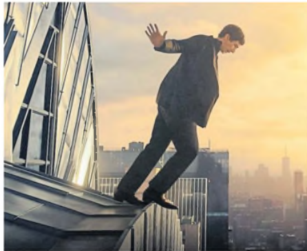
El actor Adam Driver en una escena de Megalópolis