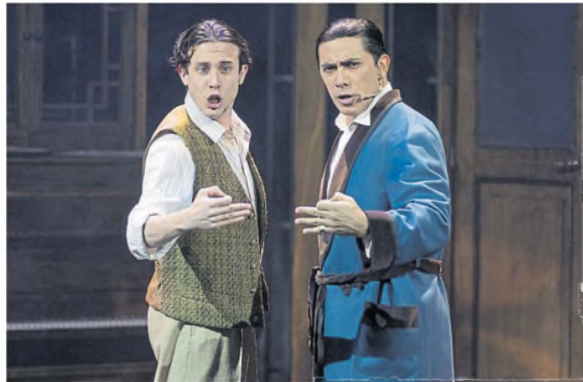
Cuando Frank conoció a Carlitos , un verdadero fenómeno de 2024 que regresa