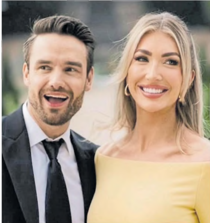
Liam Payne y Kate Cassidy en tiempos felices

El cantautor murió a mediados de octubre pasado, tras caer del tercer piso del hotel en el que se hospedaba en Buenos Aires. La autopsia determinó que la causa de su muerte fue "politraumatismo" y "hemorragia interna y externa" como consecuencia de la caída desde el balcón del hotel, y las pruebas toxicológicas revelaron rastros de alcohol, cocaína y un antidepresivo recetado en su cuerpo. ●