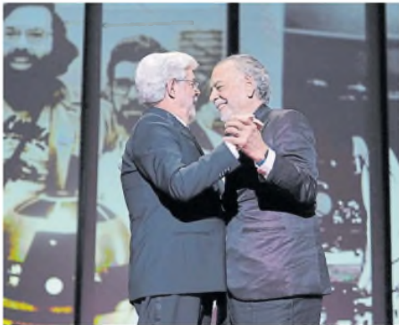
El abrazo de dos grandes en Cannes: Coppola y George Lucas