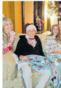
Michael Bolton en familia

La imagen adquirió un valor importante para sus fans, no solo porque es una tierna postal de su vida en familia, sino porque es la primera fotografía que el músico comparte desde que, a finales del año pasado, anunció que le habían detectado un tumor cerebral y que debía someterse a una intervención quirúrgica para extirparlo. ●