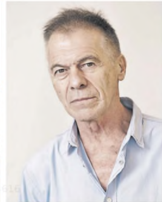
Miguel Ángel Solá, otra figura de 2025