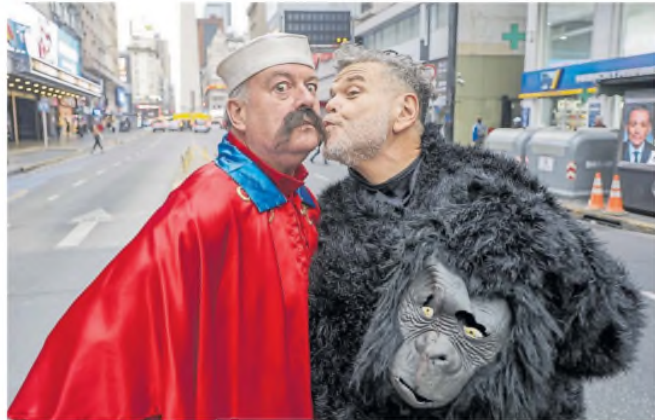
Después del enorme éxito este año, Cha Cha Cha vuelve en 2025

ESCENAS. Enero propone a Luis Brandoni y Soledad Silveyra juntos, la vuelta de Elena Roger, el humor desopilante de Alfredo Casero y Fabio Alberti, y el esperado retorno de Miguel Ángel Solá