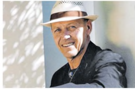
Un rosarino que dejó huella en la historia de los DJ DISCOS.GS

No fue hasta que llegó al bar Be Bop que tuvo la chance de hacer música. Su jefe, un francés que