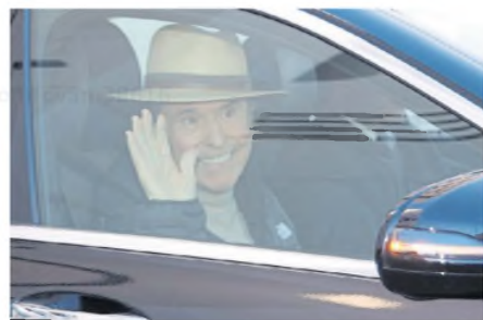
Al salir de su internación

El músico, de 81 años, comenzó a sentirse mal y a manifestar problemas en el habla. Si bien se acercó por sus propios medios a la ambulancia solicitada en el teatro donde se realizaba la grabación, en un principio se sospechó, debido a la sintomatología, de un accidente cerebrovascular. Sin embargo, con los primeros exámenes se corroboró que el malestar respondía al diag-