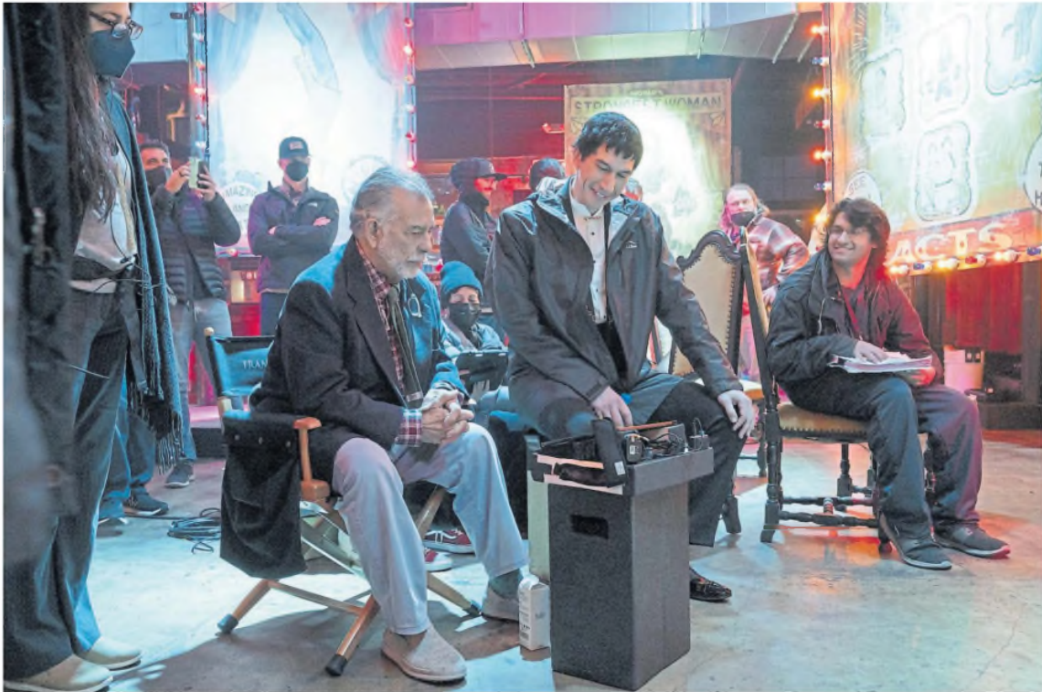
En el rodaje de Megalópolis junto al protagonista de la película, Adam Driver