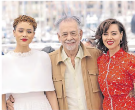
Junto con Nathalie Emmanuel y Aubrey Plaza en Cannes