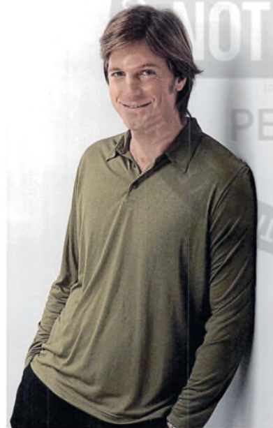
Horacio Cabak, en sus días como modelo