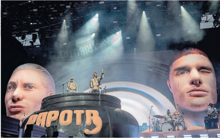
La impactante puesta en escena de Ca7riel y Paco, de lo mejor de la jornada inaugural

MÚSICA. Celebra sus diez ediciones con tres días intensos de múltiples propuestas; se presentaron Ca7riel y Paco, Foster the People, Alanis Morissette y Justin Timberlake