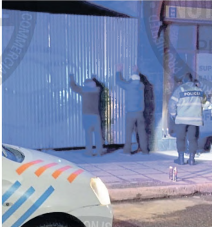
El grafiti que estaba pintando Peter Lanzani

Se desconocen los motivos por los cuales Lanzani se encuentra en Ushuaia. Aun así, versiones apuntan a que el conocido intérprete llegó a la ciudad junto a los dos hombres por trabajo. Se trataría de una ficción audiovisual, aunque no está claro de qué índole. Lo que sí se conoce es que el actor había adelantado que trabajaría en un proyecto sobre la vida de Luca Prodan, el cantante italiano que lideró Sumo tras radicarse en la Argentina. Las intenciones de Lanzani eran dirigir la película biográfica sobre el músico. ●