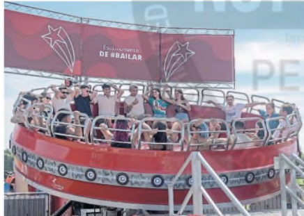
El público siempre es protagonista en el festival

embargo, el formato musical fue una versión potenciada de su famoso Tiny Desk, que se hizo viral. Ya entre sus primeras canciones metieron los grooves de “Dumbai” y “Baby Gangsta” impulsados por una banda que suena magistralmente.