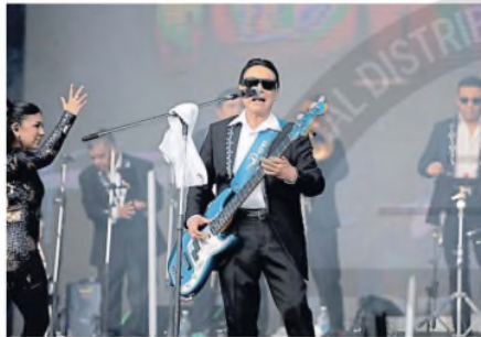
Los Ángeles Azules: cumbia mexicana

Ca7riel y Paco, los muchachos terribles de estos tiempos, llevaron una gran escenografía y pusieron un guiño con su broma muscular de su último video, “Papota”. Sin