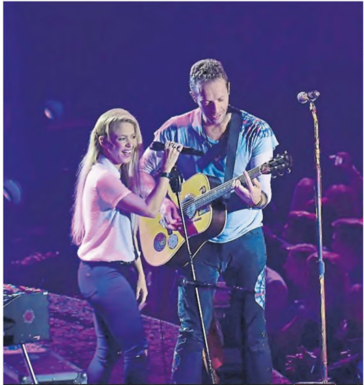
Los dos artistas tocando juntos en el Global Citizen Festival de 2017

taleza y sabiduría". Shakira, junto a otras celebridades y personalidades del mundo de la música también definió a su colega y amigo, con quien actuó en el Global Citizen Festival en 2017: "Lo veo como una persona que observa la vida a través de una lente diferente, que es sensible a las necesidades de otras personas. Es alguien muy, muy empático". La ex pareja de la cantante dijo en un comunicado conjunto en ese momento: "Lamentamos confirmar que nos separamos. Por el bienestar de nuestros hijos, que son nuestra máxima prioridad, les pedimos que respeten nuestra privacidad". Sin embargo, tanto ellos como la familia del deportista hicieron todo lo posible porque el mundo entero se enterara de detalles escabrosos de la separación. La artista conoció a Piqué en el set del video musical de "Waka Waka (This Time for Africa)", el hit que se convirtió en la canción oficial del Mundial de Fútbol de Sudáfrica, en 2010. Tres años más tarde, le dieron la bienvenida a su primer hijo, Milan, y dos años después llegó Sasha. La familia vivió hasta el momento de la separación en Barcelona, España. La decisión de establecerse allí no fue casual: el futbolista era parte del Fútbol Club Barcelona. ●