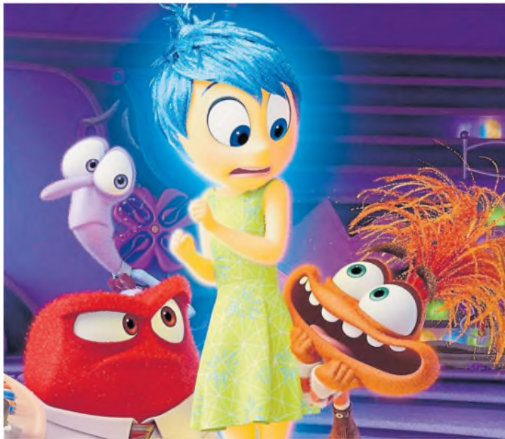
Intensa-mente 2 fue la película más vista con 6.470.026 de tickets vendidos