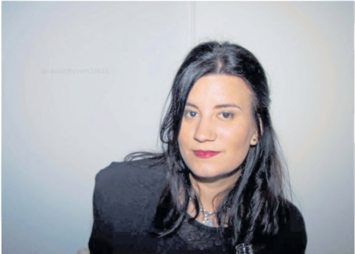
"No podría contar bien el tema judicial. Internamente no se calmó; que no se filtren cosas es otro tema", aclara la primogénita de Lanata