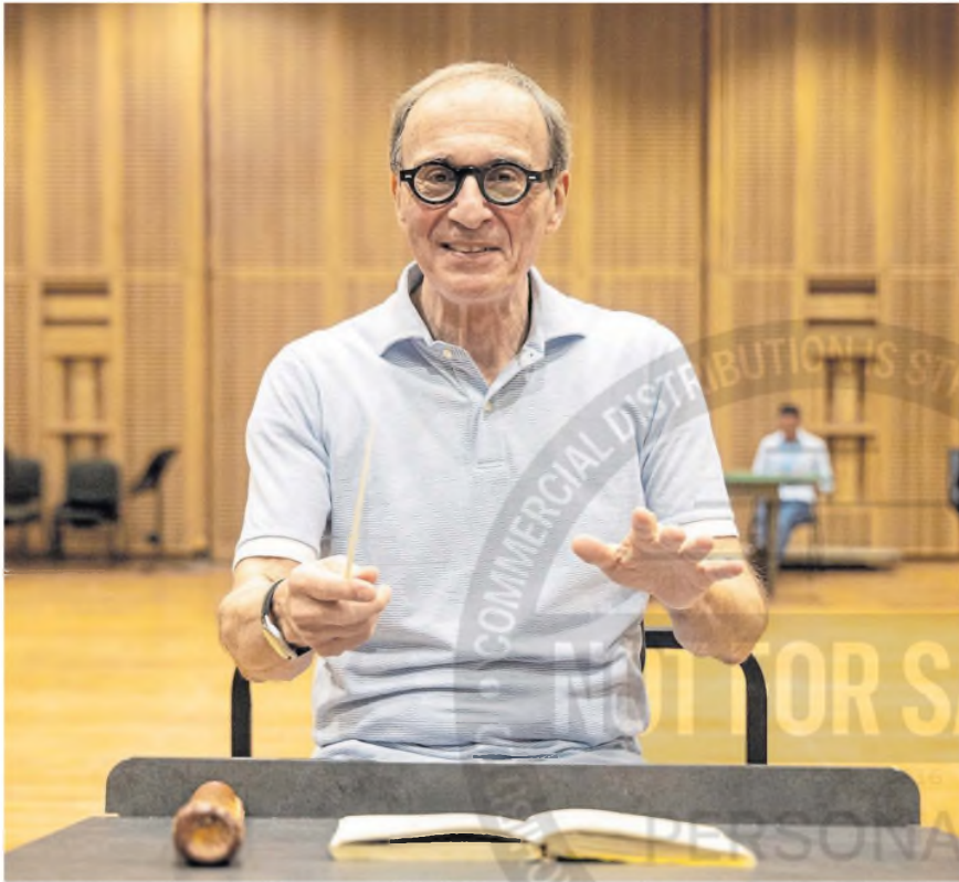
“Es un concierto especial y me siento halagado con esta invitación”, asegura el director, en pleno ensayo

El destacado director italiano inaugura el martes próximo el inicio de la temporada de conciertos al frente de la Orquesta Estable, que este año celebra su centenario | PÁGINA 4