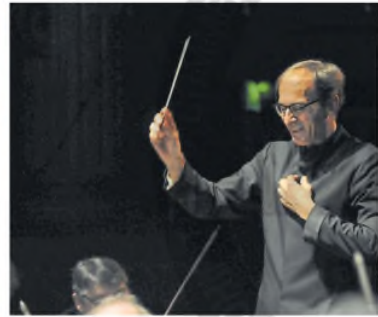
Con la Orquesta Nacional de Lille