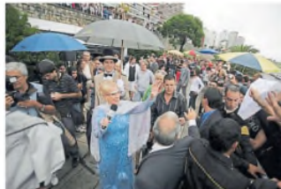
Ni la lluvia impedía los saludos