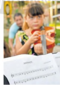
Orquestas sociales de Sojjar