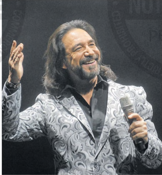
El músico debió postergar su show de anoche por las lluvias

El Bukí, como también se lo conoce gracias al nombre del grupo con el que se hizo famoso (Los Bukis), nació en Arío de Rosales, en México, en diciembre de 1959. Su primer sueño fue convertirse en sacerdote, pero luego de renunciar a esa vocación se dedicó a su otra gran pasión: la música, con la que logró una larga trayectoria y diversos galardones, incluidos cinco Latin Grammy, una estrella en el Paseo de la Fama de Hollywood y su inclusión en el Salón de la Fama de Billboard. ●