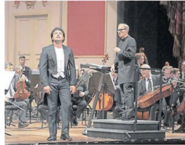
En 2023, con el tenor Vittorio Grigolo