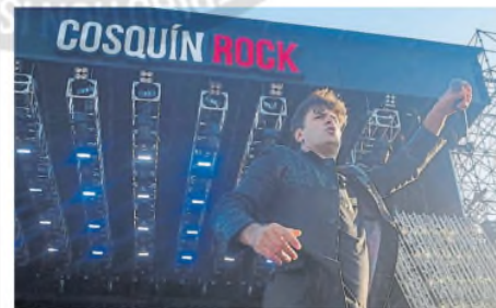
Ciro y Los Persas, en la edición 2024 del festival