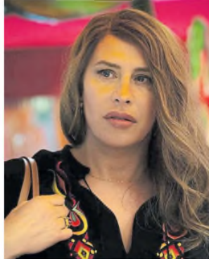
Emilia Pérez, la más nominada