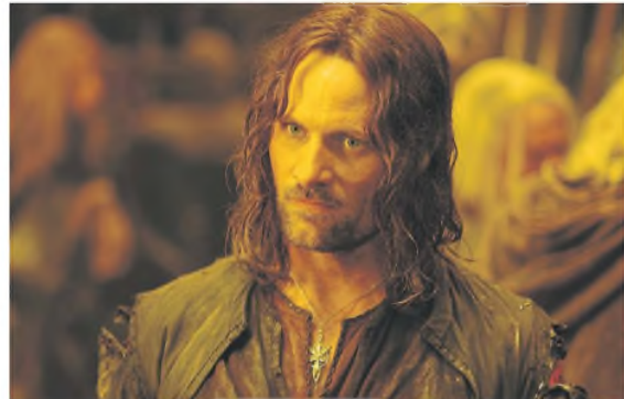
Su rol en El señor de los anillos tiene un "homenaje" en su nuevo film ARCHIVO