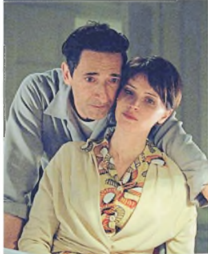
El drama The Brutalist

PREMIOS. Hay varios nominados con chances parejas en las principales categorías de cine y series; la ceremonia será mañana en Los Angeles y se verá en nuestro país desde las 22