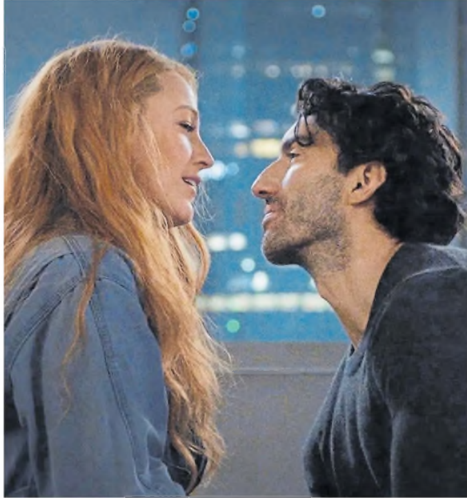
Blake Lively acusó a Justin Baldoni de acoso y difamación en el set de Romper el círculo

El 20 de diciembre pasado, Lively denunció a Baldoni por acoso sexual y lo responsabilizó de armar una campaña de desprestigio en su contra. La denuncia se hizo en el estado de California. Los rounds judiciales entre ambos, por lo visto, están lejos de finalizar. ●