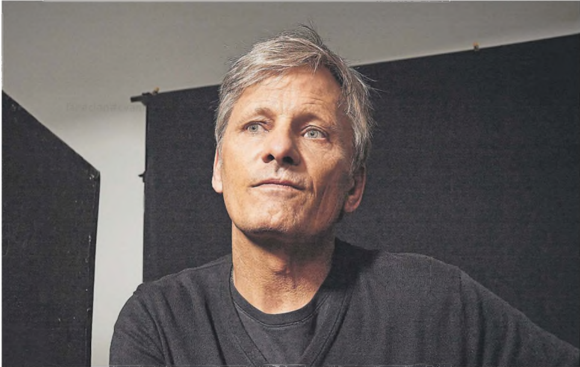
En charla con LA NACION, Mortensen asegura que quiso filmar una historia atípica, apoyada en un relato femenino