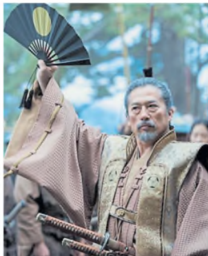
Shogun , entre los dramas de TV