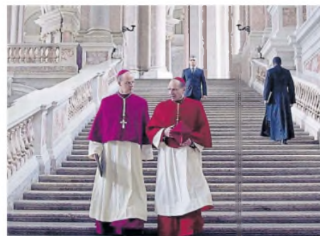
Cónclave, uno de los films más fuertes de esta edición

Los nuevos responsables de uno de los premios con más antigüedad de Hollywood, que se prepara para festejar la edición número 82 de su larga historia, se frotan las manos frente a esta perspectiva. Continúa en la página 6