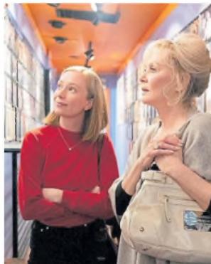
La serie de comedia Hacks