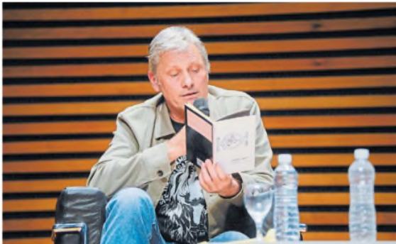
En 2023, durante la presentación de su libro de poesía ARCHIVO