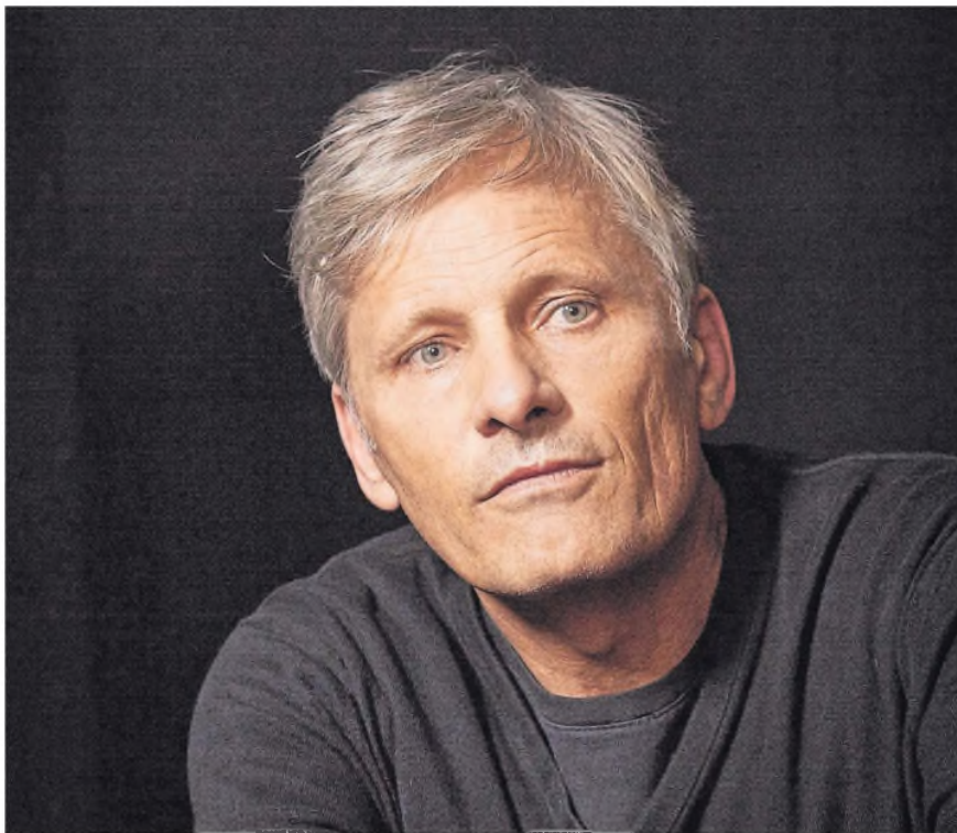
A los 66, Mortensen reconoce que lo mueve la pasión por contar historias, en la pantalla o a través de sus libros

En diálogo con LA NACION por el estreno de Hasta el fin del mundo , su segundo film como realizador, el actor reflexiona sobre los desafíos del cine independiente y las similitudes entre la actualidad de nuestro país y la de los EE.UU.; “hay que aguantar”, asegura | PÁGINA 2