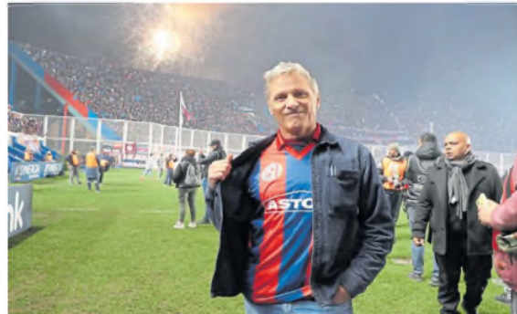
Siempre con San Lorenzo, el club de sus amores

perder su humanidad y sencillez. Es alguien con quien la gente puede identificarse.