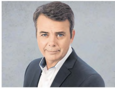
“Estaba muy colapsado”, asegura Young

-¿Cómo es volver a casa, reencontrarte con tus hijos y tu familia?