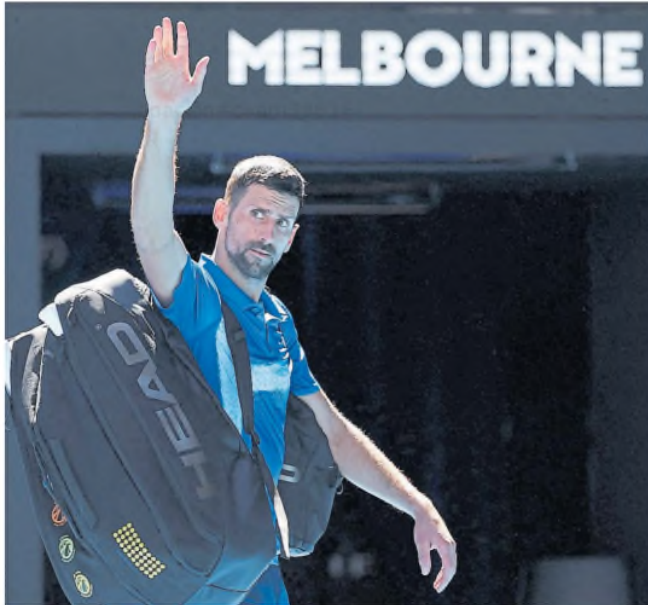
Djokovic le dijo adiós al Australian Open; un desgarro lo sacó de las semifinales