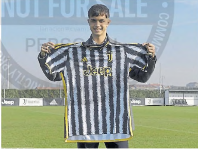
Baridó en Juventus; en Italia lo apodan "la Joya" por su juego parecido al de Paulo Dybala