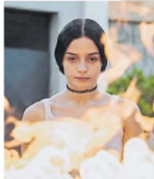
La virgen de la tosquera

Como ocurre desde hace un tiempo, el Bafici suele ser la presentación de algunas de las películas que marcarán el pulso del año, fuera y dentro de la cartelera. Ese es el caso de La virgen de la tosquera , de Laura Casabé, presentada en el último festival de Sundance y ahora parte de la Competencia Argentina