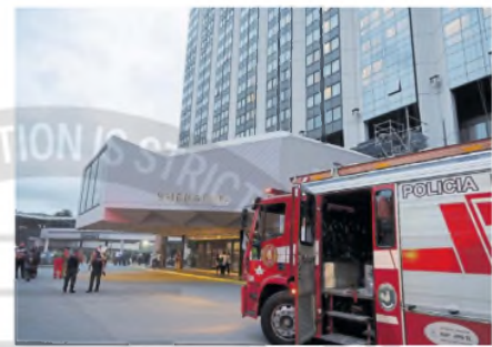
Bomberos contuvieron el incendio en Retiro

"El sector donde se desató el incendio tiene cuatro plantas. El proceso se desarrolló sobre el extractor del sector de pastelería. Se produjo un fuego de un diámetro de un metro que llegó hasta el cuarto piso. Fue atacado con polvo químico seco -un agente extintor-. Mientras tanto, la Brigada Especial Federal de Rescate de la Policía de la Ciudad atacó el posible inicio de otros focos en el cuarto piso", explicaron fuentes de la fuerza de seguridad portena.