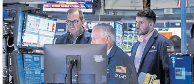
En Wall Street se vieron alzas en los bonos soberanos y caídas en las acciones argentinas