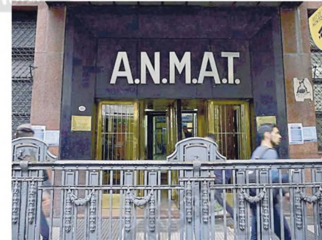
La Anmat quedó en un escalón inferior de la nueva estructura oficial

Ahora, a través de un texto que se iba a publicar a primera hora de hoy en el Boletín Oficial, darán a conocer la creación de la Anefits, tras distintos proyectos de ley que no lograron consenso legislativo. Entre los últimos estuvieron los de creación de una Agencia Nacional de Evaluación de Tecnologías Sanitarias (Anefit) que, en 2018, el entonces ministro Adolfo Rubinstein defendió ante la Comisión de Salud del Senado, o los proyectos presentados en 2022 por diputados del Frente de Todos, entre los que estuvo el del ex ministro Daniel Gollán con el que, en Salud,