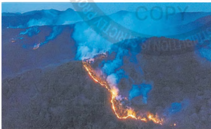
El fuego se extiende por una montaña de Andong, en el sur del país

El Ministerio de Interior y Seguridad afirmó que 27 personas murieron y decenas resultaron heridas. El balance, que probablemente aumente, es el peor desde el inicio de