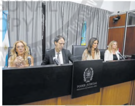
Los integrantes del TOC N° 3 de San Isidro