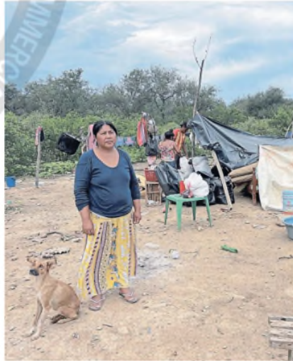
El drama de perderlo todo

Las comunidades cercanas al río tienen un anillo que consiste en un terraplén que las protege de las crecidas. Eso fue efectivo. El principal problema fue que el agua se filtró hasta llegar a los caminos de acceso y muchas de esas comunidades quedaron aisladas. Además, unas cuantas se quedaron sin luz ni agua. De a poco la situación se empezó a normalizar y muchas familias están regresando a sus hogares.