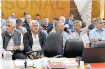
Los acusados, en la audiencia de ayer.