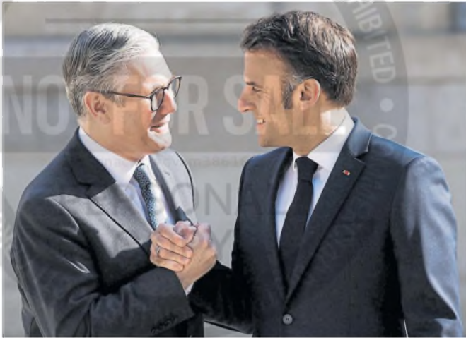
Keir Starmer y Emmanuel Macron, ayer, en el Palacio del Eliseo