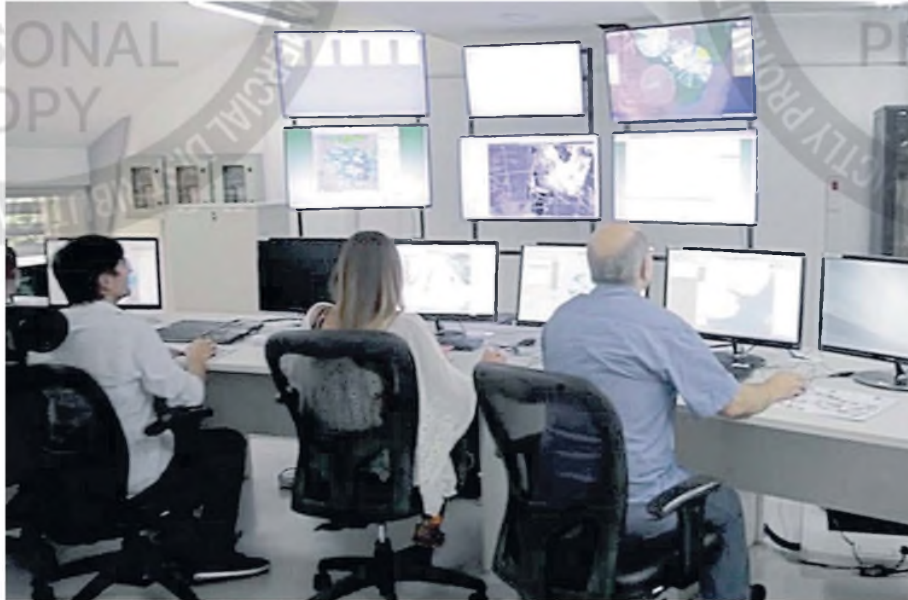
La tarea cotidiana del SMN es un insumo clave para la población y hasta para la actividad aeronáutica

Según denunciaron voces dentro del SMN, el negacionismo es solo uno de los cambios que se sienten. Son varias las medidas que ponen a la institución en riesgo de ser desarticulada: pérdida de autonomía y de financiamiento, deudas millonarias y recorte presupuestario.