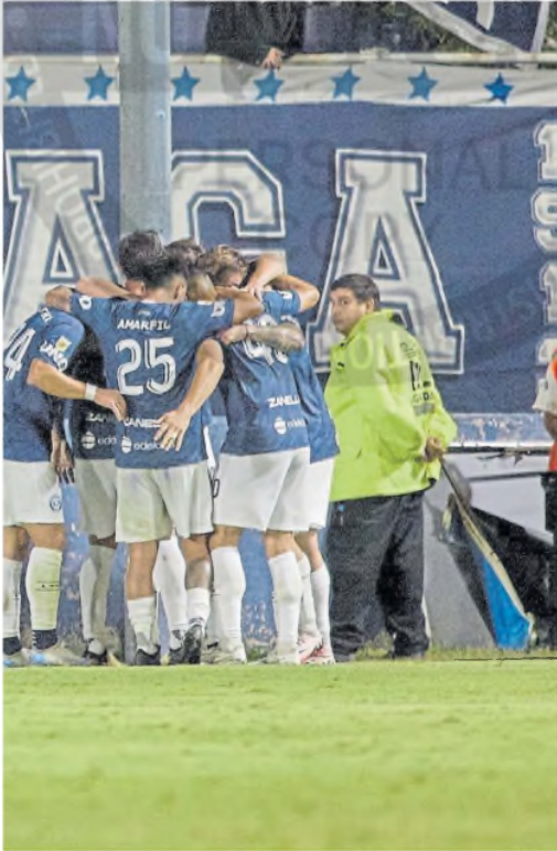
nte Rivadavia, que dio vuelta el marcador