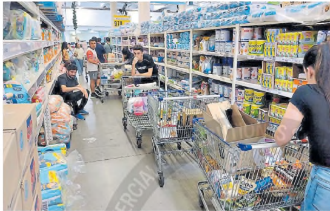
El comercio mayorista y minorista creció un 11,3% interanual en enero

Por el contrario, cinco sectores registraron caídas interanuales. Entre ellos se destacaron la pesca (-3,8%) y los hoteles y restaurantes (-2,8%). También se observaron retrocesos en administración pública y defensa, planes de seguridad social de afiliación obligatoria (-1,7%), y otras actividades de servicios comunitarios, sociales y personales (-2,6%). Estas cuatro actividades restaron en conjunto 0,22 puntos porcentuales (p.p.) al crecimiento interanual del EMAE.