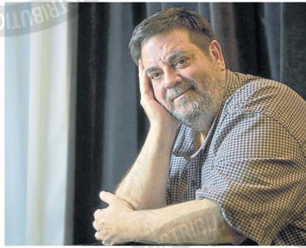
Desde el Metropolitan, Portaluppi se entusiasma con el planteo de Druk

Texto Pablo Mascareño para LA NACION