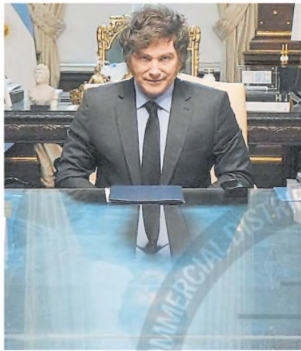
El presidente Javier Milei

En busca de desmentir los ruidos sobre una posible devaluación tras la fuerte intervención del Central en los últimos días y también de calmar las especulaciones ante los números rojos del mercado en algunas jornadas, Milei indicó: “Muchas de las cosas que se han es-