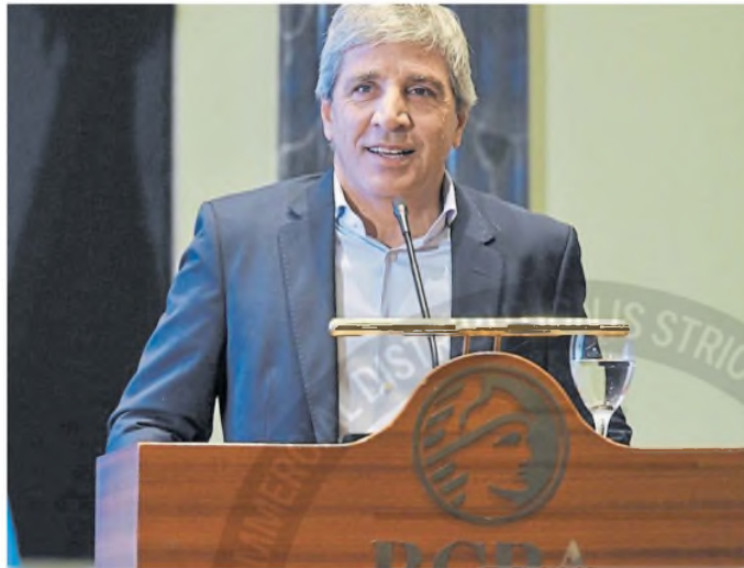
El ministro de Economía, Luis Caputo, durante su discurso de ayer

Antes de dar a conocer oficialmente la cifra, Caputo hizo un largo descargo para intentar disipar los ruidos en los mercados y habló de un plan orquestado de la oposición para "según su visión" intentar "desestabilizar" la gestión. "A veces escucho a algún periodista o leo en los diarios de la 'corrida cambiaria', la 'crisis' y demás. Bueno, me sorprende. Hay que ponerlo en perspectiva. Los mismos que militan esto, hace cuatro años recibieron un