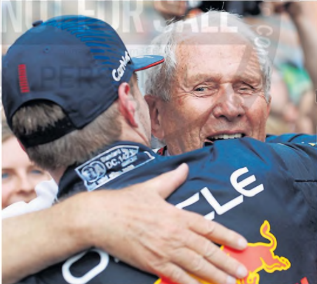
Helmut Marko, principal asesor de Red Bull, se estrecha en un abrazo con Max Verstappen