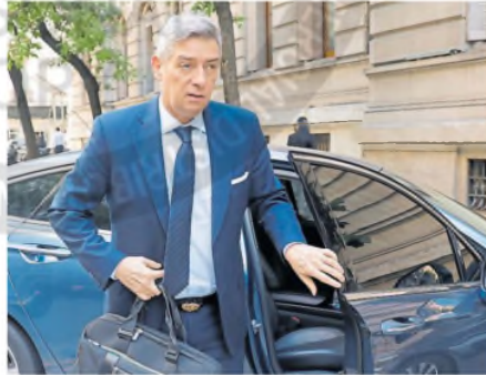
Horacio Rosatti, presidente de la Corte Suprema

La Cámara Nacional Electoral confirmó la decisión del magistrado federal de La Plata. Destacó que 79 personas señaladas como aportantes negaron su contribución; mientras que las otras 19 que admitieron los aportes, solo uno presentó el comprobante.