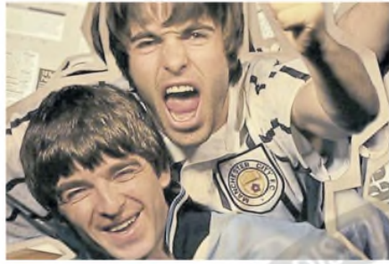
Supersonic , de Matt Whitecross, sobre el dúo Oasis

En la sección Rescates, Luchino Visconti se mide con un autor maldito de la prosa italiana como Gabriele D'Annunzio, repudiado por sus filaciones fascistas y luego reinventado en la mirada crepuscular del maestro del melodrama italiano, ya lejos de sus años neorealistas. El inocente (1976) es también una película inspirada en el matrimonio de los padres de Visconti, donde los temas de la infidelidad y el matrimonio, los roles domésticos de varones y mujeres, y el deseo y el sexo desbordan como nunca en la obra del milanés. En cambio, Hot Milk de Rebeca Lenkiewicz, presente en la sección Óperas primas, captura a la perfección la atmósfera de los relatos de Debora Levy en un camino de consciente depuración, y afirmado en la exquisita triada de actrices que forman Vicky Krieps, Emma Mackey y Fiona Shaw.