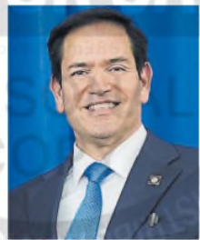
Marco Rubio

Washington ofreció apoyo militar al pequeño país sudamericano en medio de la disputa territorial y el aumento de las sanciones estadounidenses contra Venezuela.