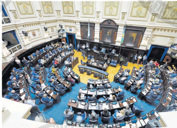
El oficialismo evitó ayer tratar en el recinto el proyecto de suspensión

El gobernador fracasó en un nuevo intento de aprobar la suspensión en la Legislatura bonaerense; fuerte interna en el PJ