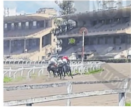
Tres caballos corrieron la única carrera de ayer