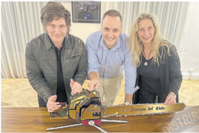
Javier Milei, Manuel Adorni y Karina Milei, ayer, tras el anuncio

El vocero encabezará el armado libertario para desafiar a Pro en su principal distrito: lo acordó la mesa partidaria, a pesar de la resistencia inicial que había mostrado Karina Milei