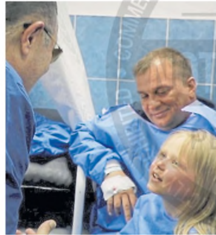
Tres de los sobrevivientes, en el hospital de Hurghada

Gran Bretaña será la anfitriona de la próxima reunión de la “coalición de voluntarios por Ucrania” en una fecha a determinar. ●