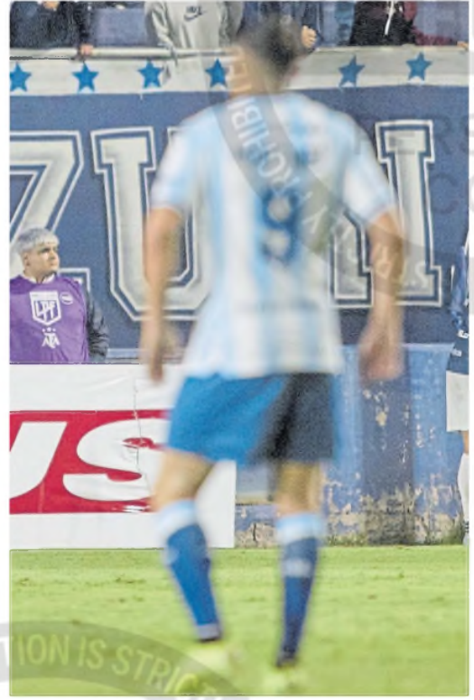
La desilusión de Maravilla Martínez y el festejo de los jugadores de Independiente