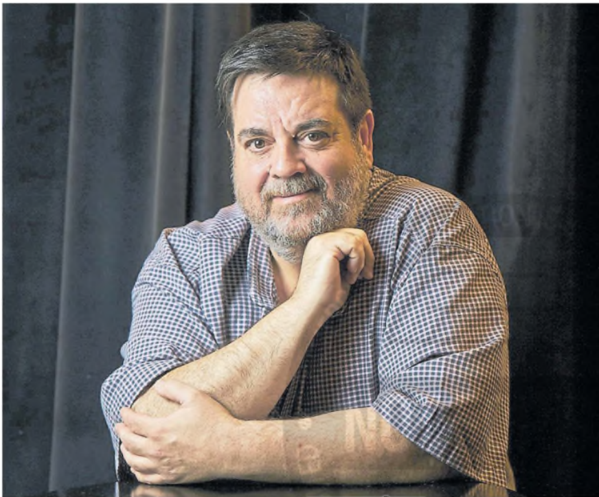
Portaluppi es uno de los intérpretes más convocados en teatro y le dio vida a recordados personajes de ficciones en TV.

Versátil en TV y en las tablas, el actor es parte del elenco de Druk , la exitosa adaptación en calle Corrientes del film Otra ronda , que protagonizó Mads Mikkelsen | PÁGINA 2