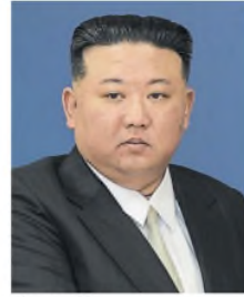
Kim Jong-un

Pero si Trump no quería enojar al presidente Vladimir Putin para que se sentara a la mesa, no ha demostrado ningún miramiento en enojar a la persona que debe sentarse enfrente, el presidente de Ucrania, Volodimir Zelensky; mientras que se negó a cri-