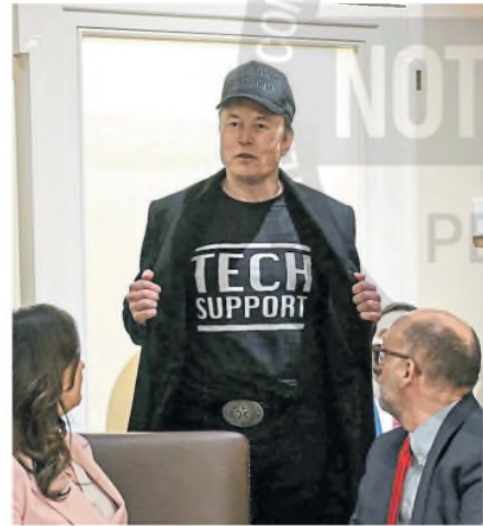
Musk intervino ayer en la primera reunión de gabinete.