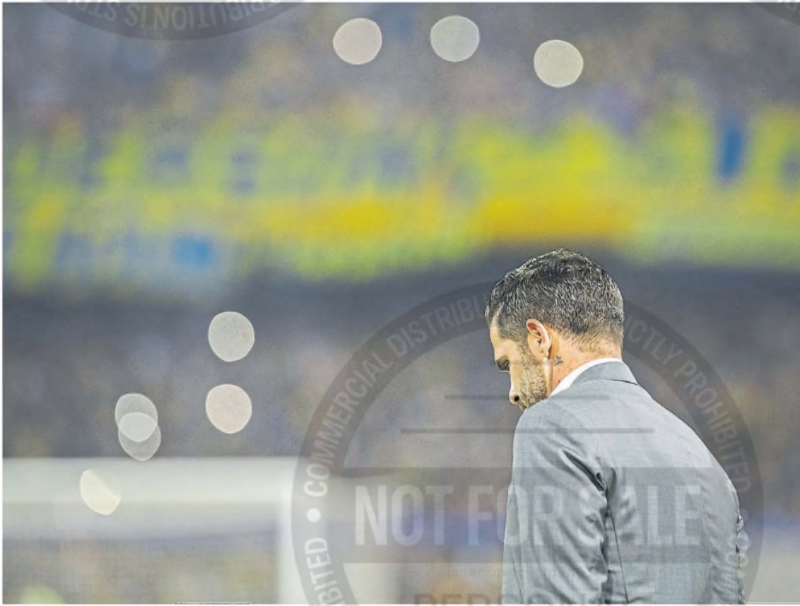
Fernando Gago, en su momento más crítico en Boca cuando apenas pasaron 22 partidos de su ciclo; mañana dirigirá en la Bombonera ante el entonado Rosario Central MANUEL CORTINA

Edición de hoy a cargo de Claudio Cerviño www.lanacion.com/deportes X @DeportesLN Facebook.com/Indeportes deportes@lanacion.com.ar