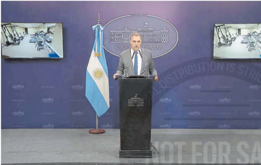
El vocero presidencial, Manuel Adorni, informó sobre los cambios ayer en su conferencia de prensa

Lo anunció ayer el vocero presidencial, Manuel Adorni, que señaló que es el equivalente al 27% de la estructura; negaron despidos; polémica por un gimnasio exclusivo para jefes