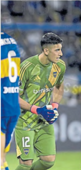
con la variante