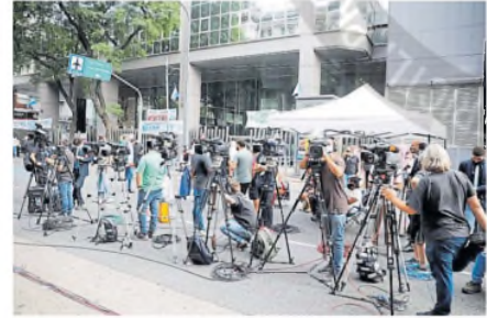
Buscan reducir el accionar de los medios en el Congreso

TRABAS. Por orden de Karina Milei, se limitó el tradicional acceso a los palcos por parte de reporteros y periodistas