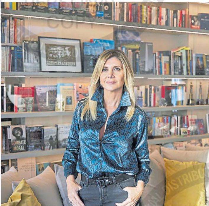
En su casa de Belgrano, donde vive entre libros junto a su familia