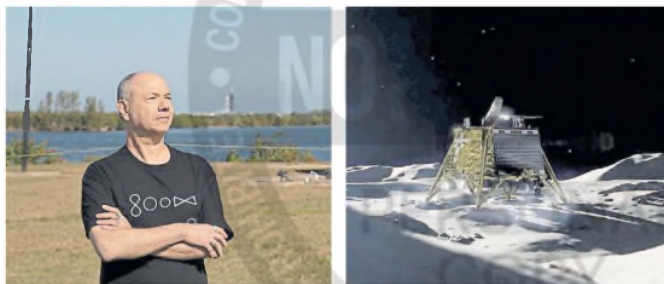
Adsum, de Eduardo Kac, viaja en un módulo de la NASA y alunizará el domingo