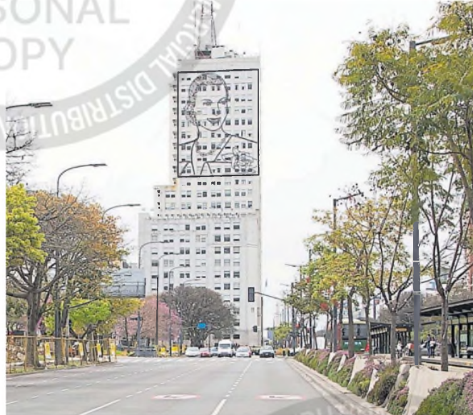
El Ministerio de Salud, punto de encuentro de la marcha federal

bia previsión del alcance que tendrá la convocatoria en el centro porteño.