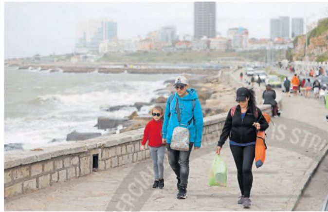
El clima otoñal se asentó en las últimas horas en Mar del Plata

El objetivo de repetir un pico de ocupación de casi el 85%, como se dio en los mejores momentos de finales de enero, por lo menos por ahora aparece bastante lejano. La fecha turística llega con otros dos agravantes: coincide con el arranque de mes, que es período de bolsillos flacos para un importante segmento de viajeros, y con el regreso a clases en la provincia de Buenos Aires y otros distritos.