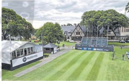
El Jockey Club se prepara para recibir el Abierto

El Abierto arranca hoy en el Jockey Club y pone en juego una plaza para el Major más antiguo