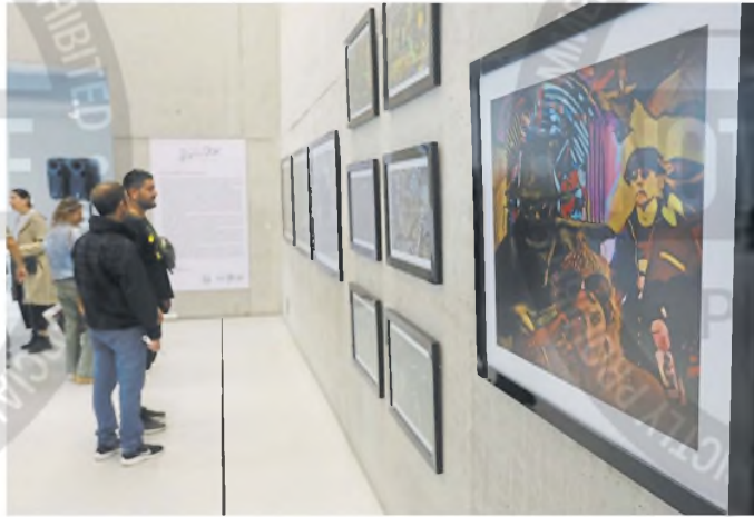
El músico firma sus obras como “Indio” y su figura aparece en algunos cuadros

Brutto se ha bautizado esta muestra de arte digital con la que el ex líder de Patricio Rey y Los Redonditos de Ricota y de Los Fundamentalistas del Aire Acondicionado vuelca una de sus vertientes en el mundo de la cultura. Desde las imágenes se presenta incluso como una escala previa y hasta un disparador para su destacada carrera musical.