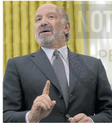
Howard Lutnick, secretario de Comercio