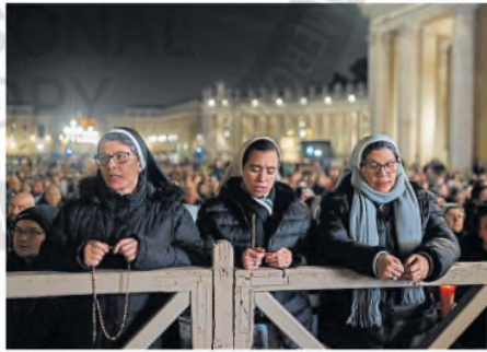
Monjas rezan por el Papa en la Plaza San Pedro.

"Continúa la fisioterapia respiratoria", añadió el parte, aportando un dato que muchos se imaginaban, pero que nunca habían dicho. "Aunque ha habido una ligera mejoría, el pronóstico sigue siendo reservado", siguió.