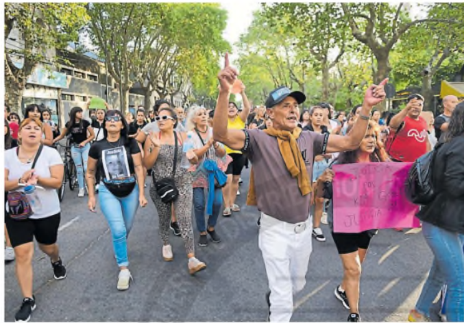
Una numerosa marcha recorrió las calles de La Plata en reclamo de justicia