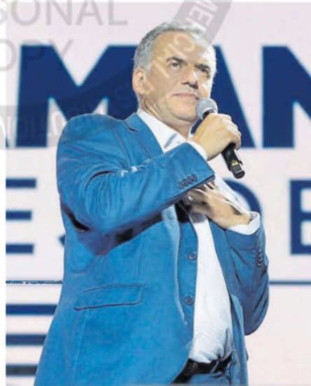
El presidente electo de Uruguay, Yamandú Orsi

Orsi argumentó que "Uruguay seguirá estando donde está, geográficamente hablando, y la Argentina lo mismo, entonces ¿es inteligente, es lo procedente, es de