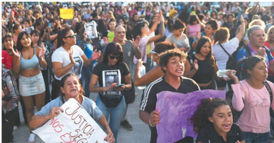
Los manifestantes se concentraron en la Plaza Moreno, frente al palacio municipal de La Plata, adonde intentaron ingresar

Según IDEA, la decisión del presidente Javier Milei "debilita la calidad de nuestras instituciones y contradice los valores republicanos". La AmCham consideró que una medida así "representa un riesgo potencial para la seguridad jurídica y el equilibrio institucional". Página 9