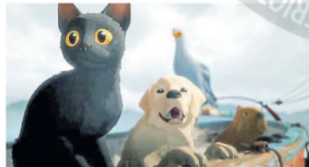
Animales animados que interpelan más allá de la niñez

Aunque utiliza el caído característico de ascenso, caída y vuelta ascender no una historia auto-indulgente sino de como se volvió su peor enemigo y cómo conquistó a sus propios demonios. ■ Hernán Ferrelrés