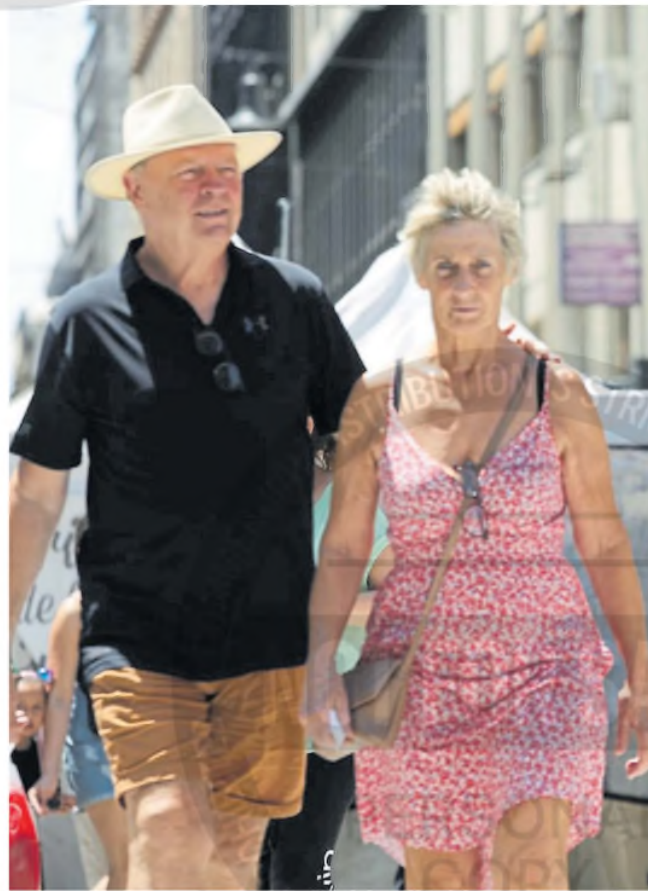
La duda aún es cuánto se puede adaptar el organismo a las subas de temperatura