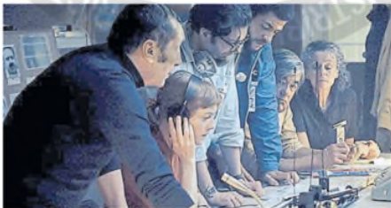
El reto de los cronistas deportivos frente a los hechos