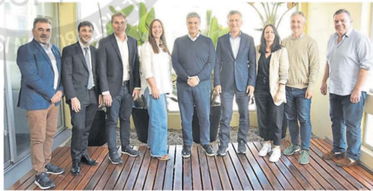
La última reunión de la mesa ejecutiva de Pro; ayer el partido no difundió fotos y Vidal estuvo ausente

Las divergencias en la cúpula de la fuerza sobre el magistrado impidieron un pronunciamiento institucional: Macri mantiene su negativa original