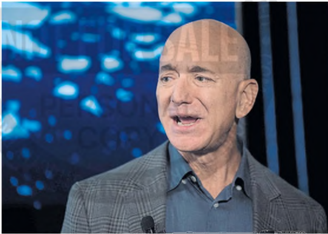
Jeff Bezos, dueño de Amazon y del diario The Washington Post