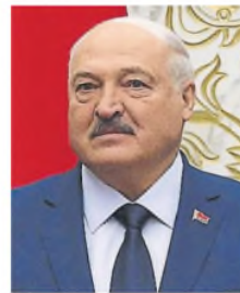
Alexander Lukashenko