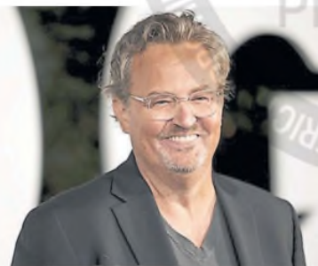
El actor de Friends murió a los 54 años

Desde ya, en esa afirmación se lee mucho más que puntualidad y compromiso, sino también una mirada lúcida sobre el acontecer de la actualidad. Lleva 25 años haciendo televisión en vivo todos los días. Sin embargo, reconoce: “Nunca doy nada por sentado, no me relajo, siempre siento que es el primer día y con un examen a pasar”. Continúa en la página 2