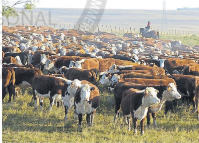
Hay expectativas respecto de la apertura de nuevos mercados para la exportación

"Australia, Francia y Canadá exportan cada uno más de US$100 millones por año de ganado en pie. En nuestra región Uruguay exporta 250.000 cabezas por año y Brasil, 750.000. El ganado en pie, además, es importante porque es un