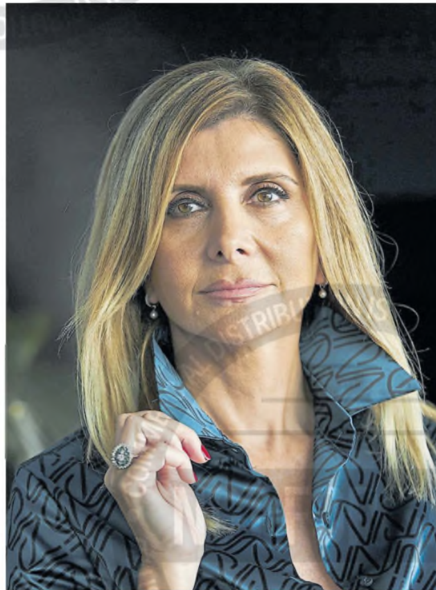
"Me molesta muchísimo el descrédito que se intenta hacer de este oficio", dice

Con una vasta trayectoria, la periodista, de 55 años, es una de las figuras de LN: su mirada de la profesión, los riesgos y el desencanto sobre la inmediatez de las nuevas tecnologías