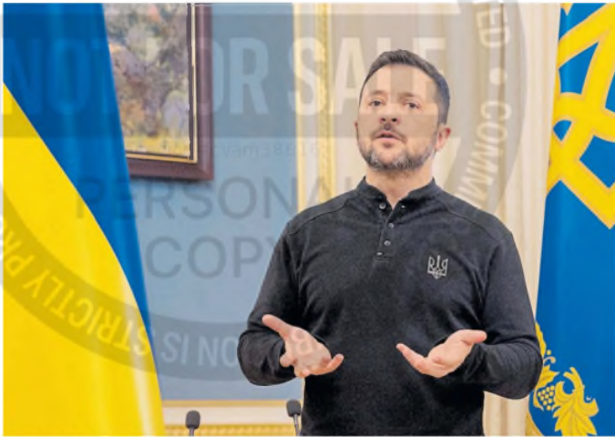
El presidente Volodymyr Zelensky, ayer, en una conferencia de prensa en Kiev.