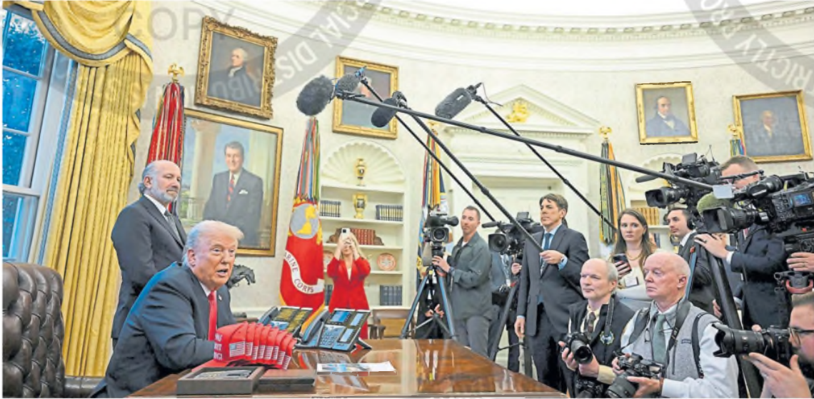
Trump recibió ayer a la prensa en el Salón Oval después de firmar varias órdenes ejecutivas

Nueva era en EE.UU. | AMENAZAS A LA LIBERTAD DE EXPRESIÓN