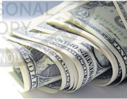
Los tipos de cambio financieros operaron dispares

Tampoco fue una rueda positiva para el mercado accionario. La Bolsa porteña cayó un 2,8% y cotizó en 2.282,898 unidades (US$1889 al ajustar por el dólar CCL). En el panel principal, las mayores bajas se registraron en las acciones de Central Puerto (-5,1%), Transener