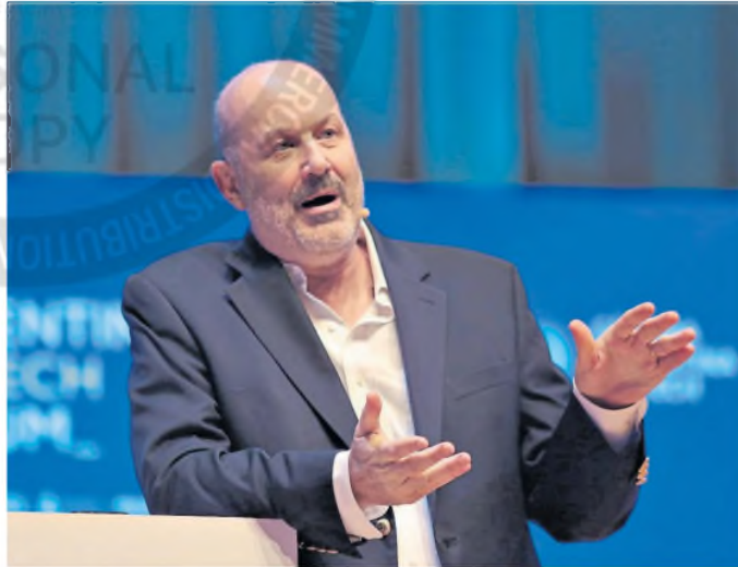
Sturzenegger afirmó que a una firma le pidieron "una colaboración informal" en 2021

"Había medidas para arancelarias que te demandaban tiempo y plata y cuando llegabas al final del camino pasaban esas cosas. Nunca pude im-