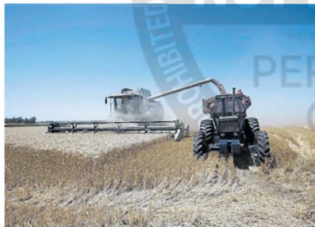
La baja de retenciones se extiende hasta el 30 de junio

El decreto presidencial bajó la alícuota al poroto de soja del 33 al 26%; a sus derivados, aceite y harina, del 31 al 24,5%; al trigo, maíz, sorgo y cebada, del 12 a 9,5%, y al girasol, del 7 a 5,5%. Pero, con una condición pri-