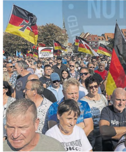
Partidarios de la AfD en un acto de campaña en Turingia

"Las personas con capital humano se iban, y las que se quedaban a tras quedaban realmente rezagadas", explicó.