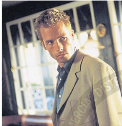
En Memento , de Christopher Nolan

Claro que el gran impulso llegó gracias al cine de su país con la película Las aventuras de Priscilla, reina del desierto , un enorme éxito local que consiguió dar el salto hacia el mundo y puso a Pearce en el radar de Hollywood gracias a su interpretación de Adam, integrante de la troupe de Drag Queens que recorren los caminos australianos presentando su show de cabaret.