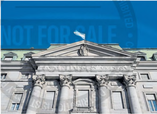
Un juez suspendió el DNU que convirtió el Banco Nación en una sociedad anónima