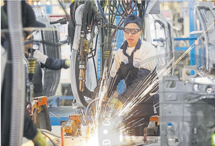
La industria manufacturera es uno de los sectores que incidieron positivamente

ACTIVIDAD. Es una baja más moderada que la que se proyectaba; en diciembre creció 5,5%, respecto de igual mes del año anterior; en 2023, se había producido una retracción de 1,6%