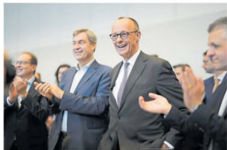
Merz y su socio de la CSU bávara, Markus Söder