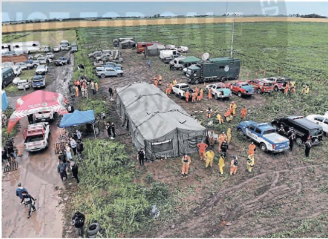
Se estableció un puesto de comando para coordinar la búsqueda