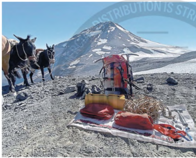
Los objetos que estaban en la mochila que quedó entre la nieve en 1985

Así, aclararon que esta experiencia fue mucho más que buscar su mochila. "Fue sobre todo entender que nunca estamos solos frente a la muerte, que siempre hay un lugar, un momento del día, algún olor, un barrio, algo que nos devuelve al abrazo de esa persona que ya no está, y en mi caso ese lugar es el Tupungato", sostuvo.