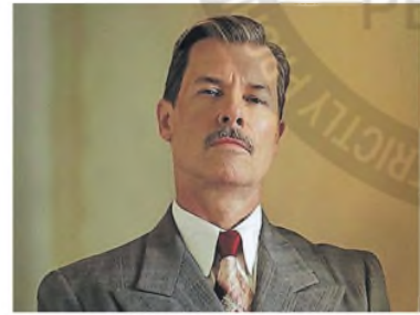
Un actor que recorrió un largo camino