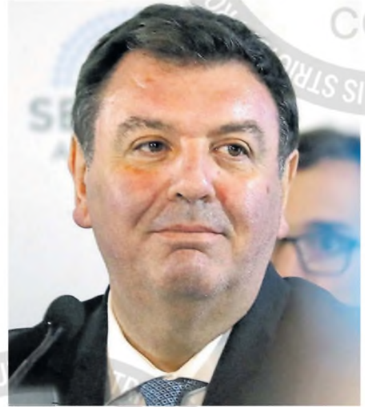
El juez federal Ariel Lijo

En el Gobierno no desconocen que habrá una cerrada oposición al nombramiento de Lijo por decreto. Así lo reiteró ayer el bloque de Unión por la Patria. También el expresidente titular de Pro, Mauricio Macri, ha manifestado públicamente su oposición a Lijo, que arrastra sospechas y denuncias por su patrimonio y el manejo de causas sensibles para el poder, particularmente con el kirchnerismo, en sus 20 años como juez de Comodoro Py. ●