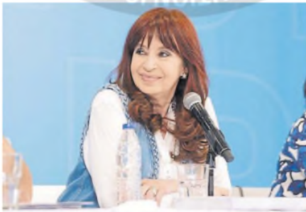
La expresidenta decidió la conformación de equipos

PRIORIDADES. Puso la mira en el escándalo $LIBRA, la interna con Kicillof y el armado partidario con vistas a las elecciones