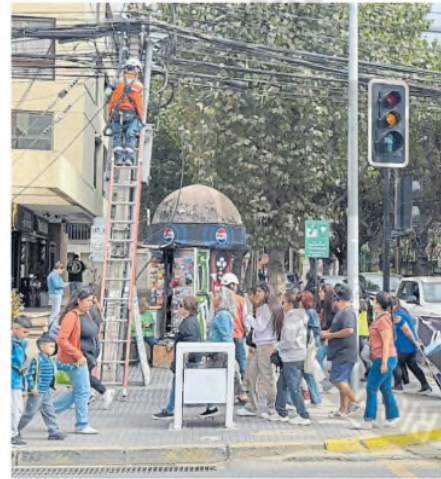
La gente vuelve a casa a pie en Viña del Mar