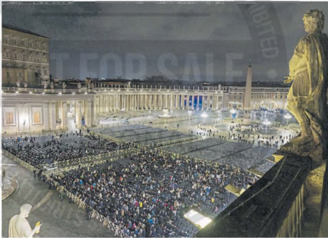
En la noche de Roma, fieles rezaron ayer el rosario por la salud de Francisco