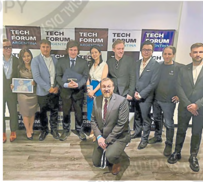
Milei, en el evento Tech Forum; en el extremo derecho, Novelli y Lipinsk

EMPRESAS. En octubre, la plataforma Cube anunció "una carta de intención" con el Gobierno y usó la imagen del Presidente en un spot promocional; el papel del hermano de Hayden Davis