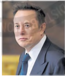
Elon Musk

Las renuncias se conocieron después de que Trump respaldara anteayer la exigencia de Musk de que los empleados federales respondieran a un correo electrónico detallando sus logros de la semana anterior, bajo amenaza de despido.