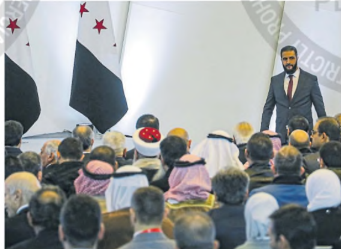
Ahmad al-Sharaa, ayer, en la conferencia que busca la unidad de Siria

CONFERENCIA. En un gesto destinado a lograr un alivio en las sanciones, el gobierno islamista realiza una reunión multisectorial