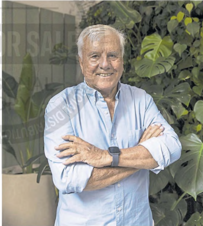
"No extraño la tele, y cuando la miro, no sé dónde ubicarme", dice

-Una época, la primera. Después tuvimos un entredicho y dejó de