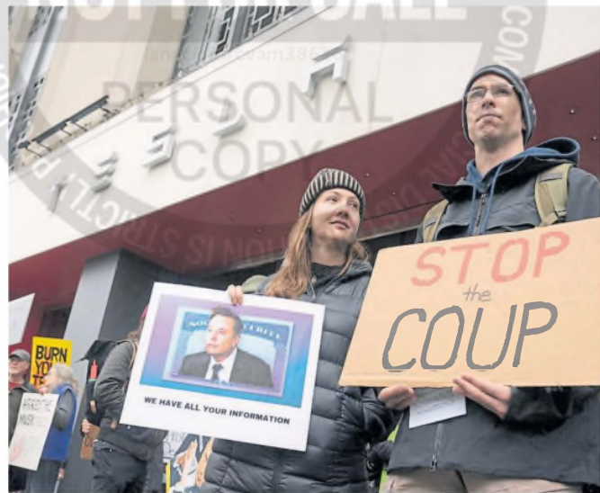
Protesta contra Musk en un local de Tesla en Seattle