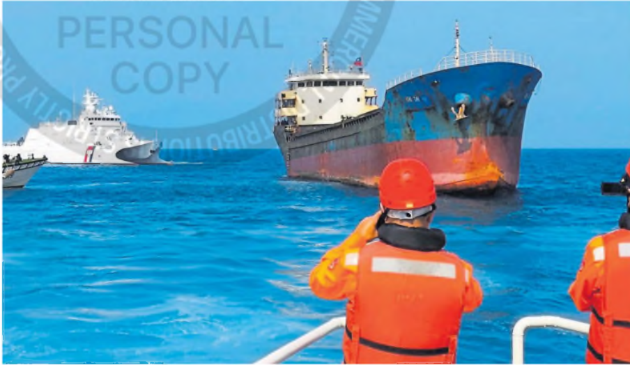
El carguero Hontai, escoltado por la Guardia Costera de Taiwán

SEGURIDAD La tripulación, que estaba a bordo de un barco de bandera de Togo, fue detenida en el contexto de una investigación por la violación de un cable submarino de la isla