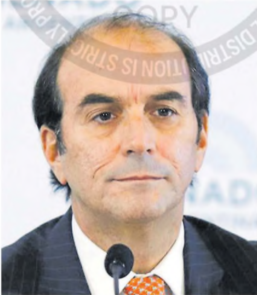
El catedrático Manuel García-Mansilla