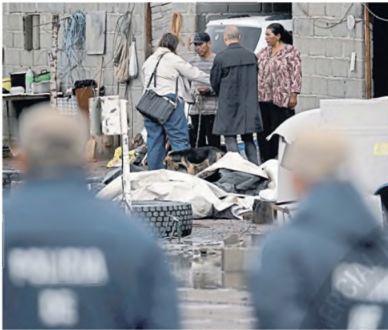
Los padres de Lian, con funcionarios judiciales

El padre del chico de tres años sembró nuevamente dudas sobre sus vecinos, aunque los investigadores consideraron que careció de precisiones ese testimonio dado a los fiscales que encabezan la búsqueda