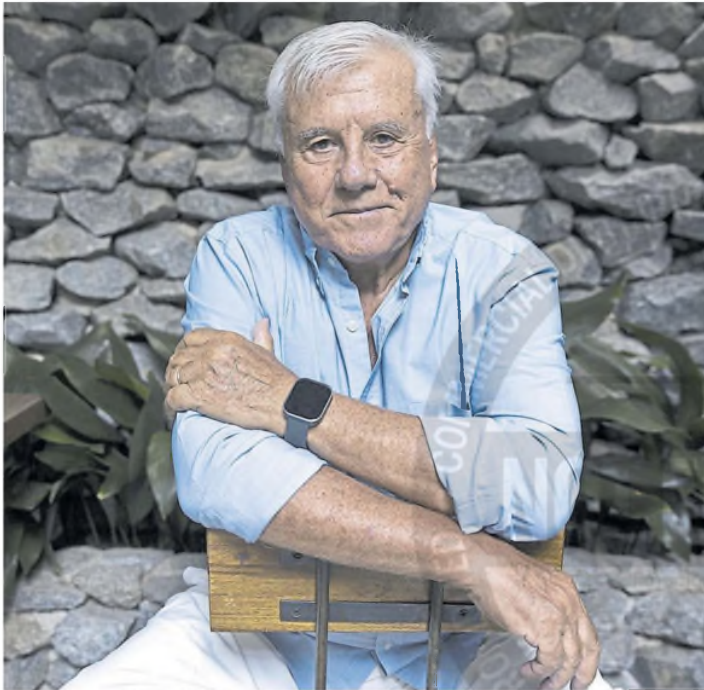
Con una trayectoria de más de 40 años, es uno de los locutores icónicos de la AM