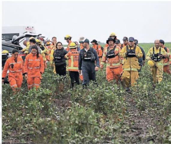
Fuerte operativo de búsqueda en Córdoba