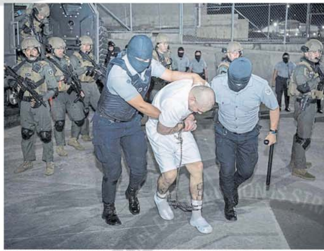
La llegada de los deportados por EE.UU. al centro de detención en El Salvador

Para deportar a los migrantes, Trump invocó la Ley de Enemigos Extranjeros, una legislación de 1798 para épocas de guerra. El juez federal James Boasberg bloqueó su uso el mismo sábado en que se estaban llevando a cabo los vuelos. "Ups... demasiado tarde", se burló Bukele, con un emoji de risa, en su cuenta en X minutos antes de compartir el video de la llegada de los deportados. Trump, por su parte, amenazó a Boasberg con un juicio político, mientras que el mandatario salvadoreño entró en la discusión al afirmar que "Estados Unidos se enfrenta a un golpe de Estado judicial".