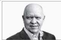
Jorge Fernández Díaz —LA NACION—

Sobre llovido, mojado: el Presidente quedó envuelto en una estafa cripto de resonancia global. Y el episodio mostró otros dos defectos: su negligencia en un territorio que presuntamente dominaba, y el carácter actuado y artificial que le imponía a su discurso el rey de la espontaneidad televisiva. El punto más inquietante, sin embargo, tiene que ver con que la retaguardia económica no estaba ni de lejos garantizada: de pronto la inflación es más rebelde de lo que se suponía (sostenida en el tiempo va deteriorando la vida de todos) y el atraso cambiario huele a la "plata dulce" viajera y al "demedos" de antaño. Cada vez que hubo fiesta después hubo velorio. A eso se suman un repentino apuro por un rescate multimillonario del Fondo Monetario Internacional y un súbito desgobierno del dólar, con el consabido y peli-