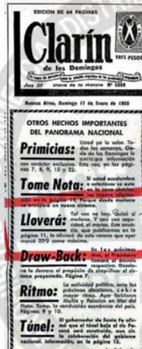
Recorte de la tapa de Clarín del 17 de enero de 1960

Tampoco en LA NACION hemos estado exentos de gazapos. Tiempo después de comenzar el servicio de Accu-Weather, informamos en una edición: “Precipitaciones para hoy: probabilidad del 50 por ciento”. El jefe del Servicio Meteorológico Nacional, un comodoro con algo de sangre en el ojo porque hubiéramos contratado a Accu-Weather, se apersonó ese día en mi oficina de secretario general de Redacción. Sin sentarse, puso la mano en el bolsillo del saco, lanzó una moneda al aire y, mientras la atrapa entre las palmas, se ufano triunfalmente, ignorando todavía si había salido cara o ceca: “Cincuenta por ciento es esto. ¿Por esto pagan ustedes?”. Pagábamos a Accu-Weather unos cuantos miles de dólares por mes. Nunca más eso de cincuenta por ciento. ●