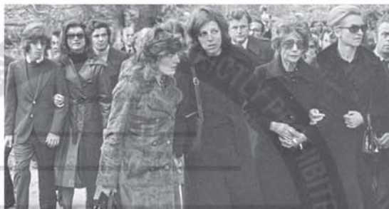
Christina, en el entierro de su padre. Detrás, Jackie O. y su hijo John Jr.