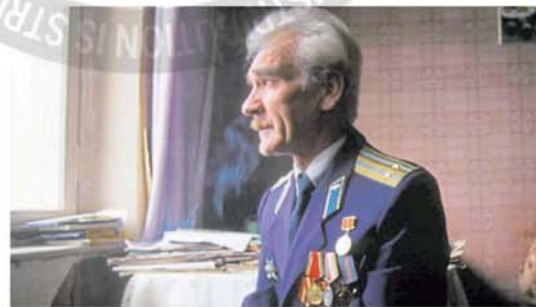
El teniente coronel ruso Stanislav Petrov

Petrov murió en un pequeño pueblo de las afueras de Moscú, el 19 de mayo de 2017, tenía 77 años. Su deceso fue informado de manera oficial por el Ejército ruso; se supo de casualidad meses después, cuando un documentalista llamó a su casa para felicitarlo y el hijo de Petrov le contó la triste noticia. ●