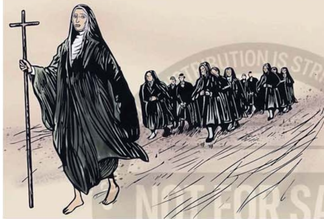
El documental sumó ilustraciones sobre momentos claves de Mama Antula