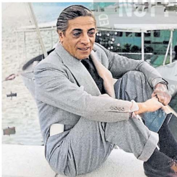
Aristóteles Onassis vivió diez años en el país, desde 1923 hasta 1932

Dicen que el punto de inflexión en la vida de Onassis lo marcó su ingreso a la River Plate Telephone Company. Para entrar mintió sobre su edad y su lugar de nacimiento: se agregó seis años y dijo que era de Atenas. El mito asegura que un compañero le comentó que por las noches se podían filtrar las conversaciones de los pasadores de apuestas y de los corredores de bolsa. Ari inmediatamente pidió ser transferido al turno nocturno y allí escuchó conversaciones de accionistas de Estados Unidos, Inglaterra y Suiza. En una de esas escuchas se enteró de la inminente compra de un importante frigorífico del país por capitales norteamericanos. Entonces compró acciones de esa empresa, que tuvieron una fuerte alza y eso le permitió ganar una buena cifra en dólares. El comisionista