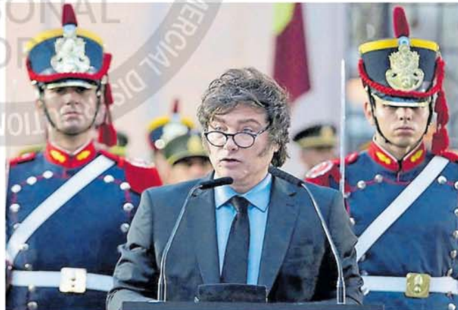
El Presidente construyó una red de gobernadores dispuestos a ayudarlo

El momento vital de desarmar la trampa cambiaria encuentra a Milei con el ánimo crispado y la tro-