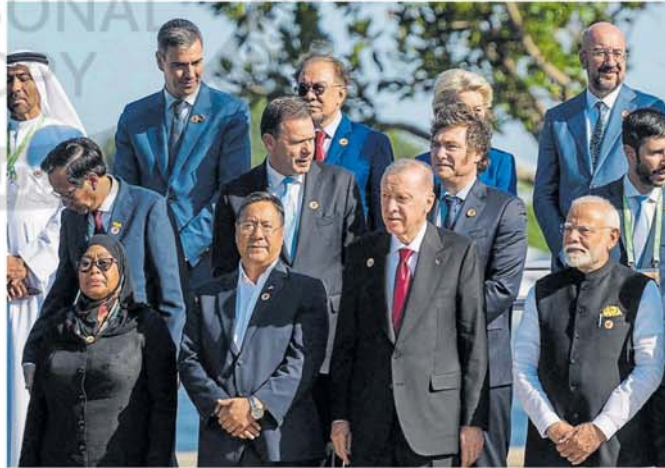
Sánchez, Milei, Arce, Erdogan y Modi, entre otros líderes, en la Cumbre del G-20 en Río, en noviembre

Un repaso del peso del PBI sudamericano en el mundo muestra con contundencia cómo la pesadilla del bajo crecimiento boicoteó la influencia de la economía sudamericana en el mundo. En 2005, América del Sur representaba el 5,4% de la economía global; en 2015, sin mucho cambio, significaba el 5,6% y en 2025, comprende el 4,8% del