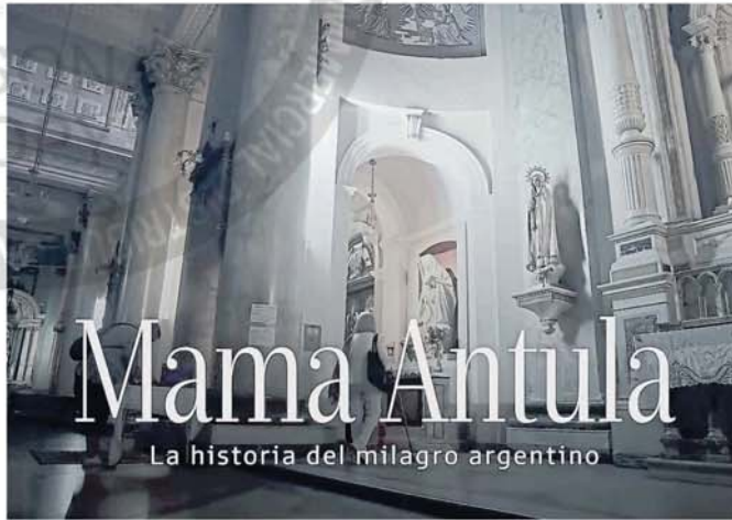
El documental, un trabajo extenso sobre la vida de la santa argentina

Y agregó: "Elegimos hacer un trabajo en profundidad, y creo que no nos equivocamos, no solo porque estamos contentos con el resultado, sino porque ese tiempo que nos tomamos para investigar