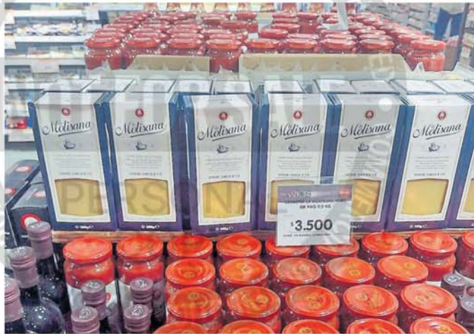
Los productos importados tienen una presencia parcial en las góndolas