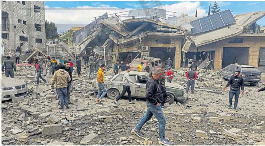
Los daños en la localidad libanesa de Toulne tras el ataque israelí