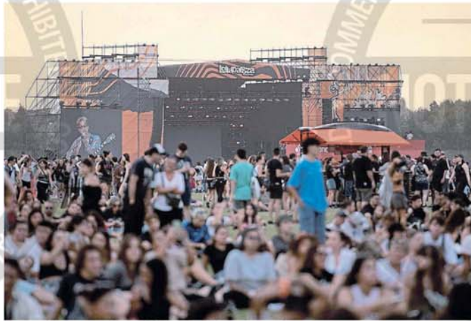
Mucho público asistió a la segunda jornada del festival musical

Mientras los surcoreanos Wave To Earth mantenían a sus fans cautivos, en el Flow Stage los californianos The Marias capitalizaban el atardecer ya un poco más despejado con su indie amigable. La inclusión de "Lovegool" —el hit modelo 1996— en medio del repertorio funcionó como guñito y relajo.