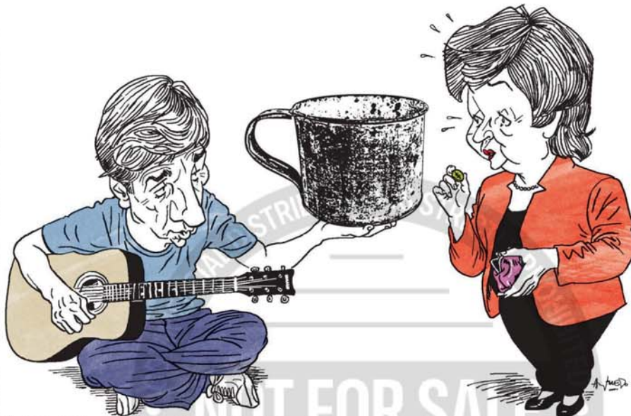
El ministro Luis Caputo y la directora del Fondo, Kristalina Georgieva

En la agenda del directorio del FMI todavía no se fijó la fecha formal para la votación del acuerdo con la Argentina. El board tiene previstas reuniones en los últimos