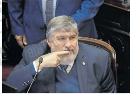
El kirchnerista Mayans no pudo retener a los rebeldes

A la implosión silenciosa de Juntos por el Cambio, ahora se suma la lenta disolución del conglomerado peronista que supo mantener amalgamado Cristina Kirchner a fuerza de mano dura. Esto explica