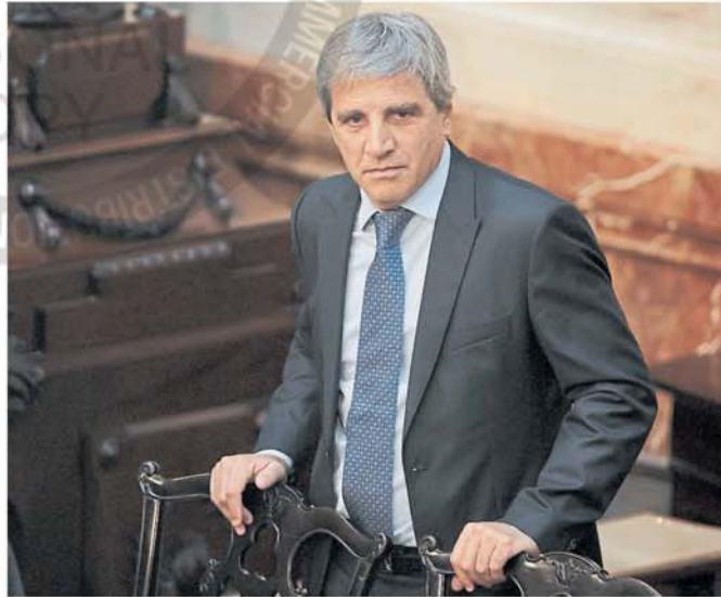
Luis Caputo afronta un momento decisivo para su programa

Daza, con su tono calmado, fue directo al momento de plantear el carácter de urgencia que supone para el Gobierno resolver la foto actual del Banco Central. "Agarramos un país que estaba al borde de una crisis muy grande. No es un cliché político. Poco a poco fuimos desarmando las fuentes de crisis: el déficit fiscal, los pasos monetarios, el exceso monetario. Nos queda una sola vulnerabilidad que nos ha obligado a mantener el cepo cambiario... La urgencia es dar un paso adelante para terminar de estabilizar la economía y salir de la pobreza. La solvencia del Banco Central es fundamental para avanzar en el desarrollo de la Argentina. Esa es la urgencia", agregó ante pocas escuchas tras la demora de más de dos horas producto del raid poli-