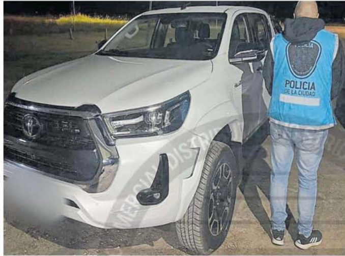
Uno de los vehículos que fueron recuperados tras un rastreo satelital

"Más allá del cambio de la chapa de identificación de la camioneta, se determinó de forma rápida que era uno de los vehículos sustraídos de la concesionaria de San Cristóbal porque los números de los cristales coincidían con los que figuraban en la denuncia", explicaron las fuentes