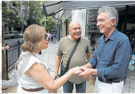
Mauricio Macri, ayer, retomó las recorridas

Por esa razón, los estrategas de Pro se aprestan para una batalla de identidad. No solo quieren exhibir la efectividad del artefacto de poder de la ciudad, sino que preparan una campaña con ADN amarillo.