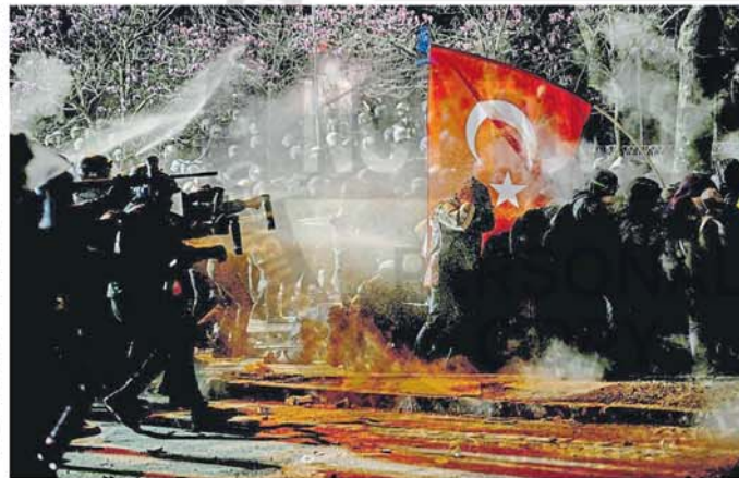
En Estambul hubo enfrentamientos entre la policía y los manifestantes

Los manifestantes también se enfrentaron a la policía en la provincia costera occidental de Esmirna y en la capital, Ankara, por tercera noche consecutiva, y la policía disparó con cañones de agua contra la