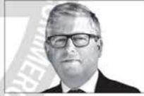
Jorge Liotti —LA NACION—

Dos factores alteraron esa calma. Uno, la llegada de Donald Trump al poder, con su repertorio arancelario