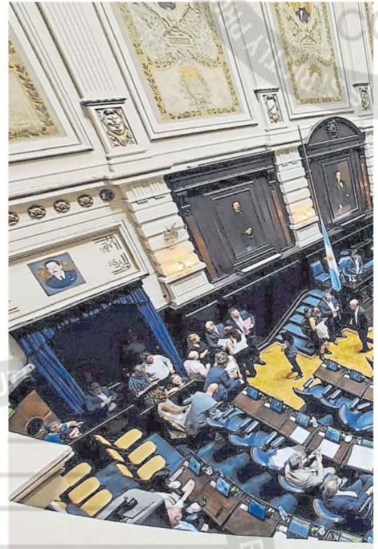
El recinto de la Cámara de Diputados bonaerense, ayer, semivacio

Desde la conducción del bloque de UP que lidera Facondo Tignaneli (aliado a Máximo Kirchner) dijeron a LA NACION: "El proyecto que está en comisión es el de Esclaman. Se va a debatir la semana que viene. Hoy (por ayer) no daban los números". Al parecer, tampoco hubo mucha intención del kirchnerismo de apoyar al gobernador. ●