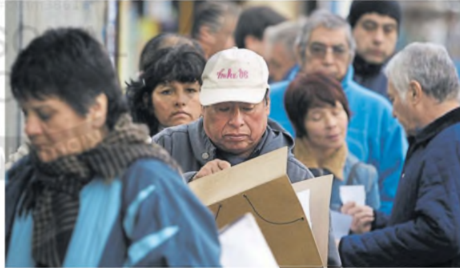
Se estima que en el país hay más de 6,7 millones de personas con problemas laborales

En el informe del Indec se indicó que la tasa de subocupación resultó del 11,3% de la población económicamente activa (PEA), mientras que los ocupados que son demandantes de empleo y los ocupados no demandantes, pero disponibles para trabajar alcanzaron, en conjunto, el 16% de la PEA. Consecuentemente, la presión sobre el mercado laboral, conformada por el universo de desocupados, subocupados, ocupados