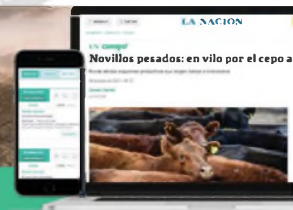
Novillos pesados: en vilo por el cepto