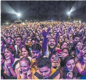
El año pasado, el festival fue una fiesta

Desde el indie de Foster the People y el metal de Sepultura hasta Olivia Rodrigo