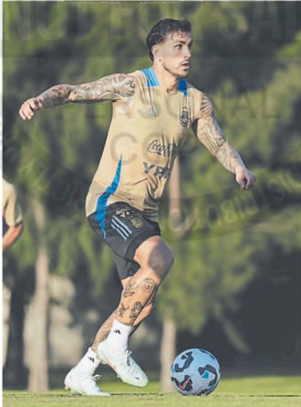
Paredes, experiencia en el medio para reemplazar a De Paul