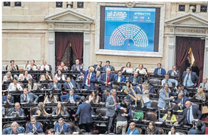
Diputados aprobó el DNU del acuerdo con el Fondo anteaer

"La menor liquidación por el blend, producto de que los exportadores no tienen incentivos a liquidar divisas ante una tasa en dólares (vista en pesos efectiva) muy por encima de la tasa en pesos, habría forzado al BCRA a suplantarse esta oferta automática de dólares e intervenir en los dólares financieros. A modo de referencia, la liquidación del agro por el mercado de cambios (80%) desaceleró desde US$39 millones el lunes y US$58 millones el