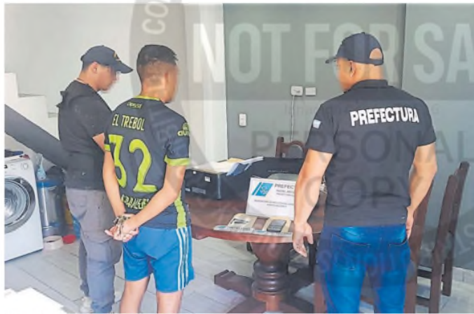
Uno de los siete policías detenidos por la misma investigación que Piccirillo