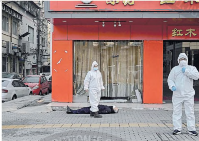
Hace cinco años, en Wuhan comenzaba la pandemia de Covid-19