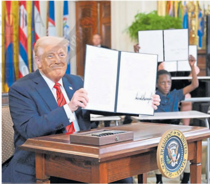
Trump, rodeado de alumnos en pupitres, tras firmar el decreto

Trump dice que la medida permitirá ahorrar dinero y mejorar los niveles educativos en Estados Unidos que, según él, están por detrás de los de Europa y China.