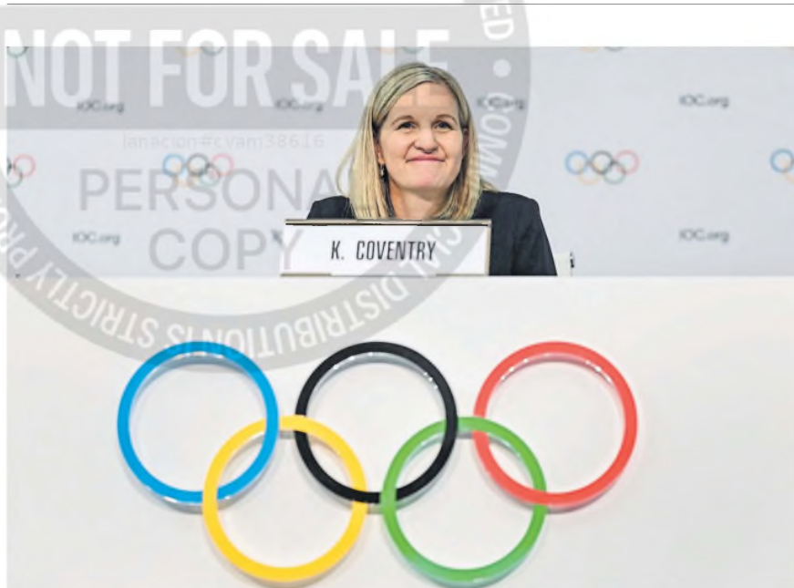
Kirsty Coventry, flamante presidenta del COI, tuvo un exitoso pasado como nadadora olímpica