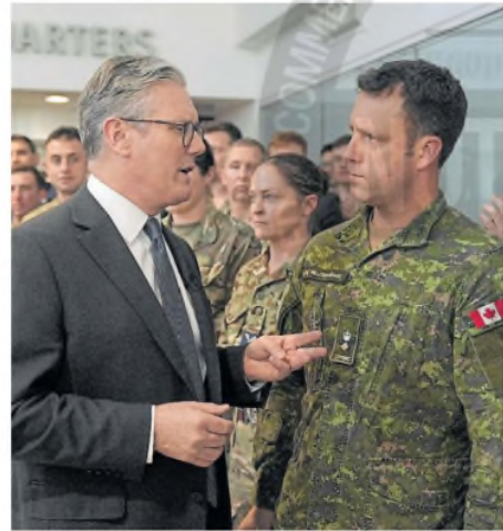
Starmer habla a militares en la base de Northwood