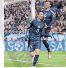
Japón ya está en la Copa