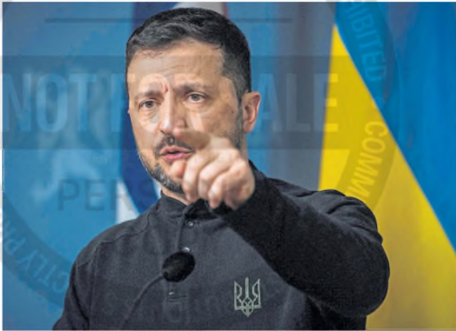
Zelensky participó ayer de una cumbre de la UE por teleconferencia