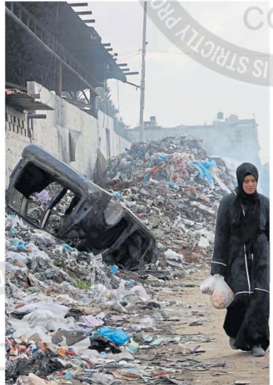
Una madre y su hija caminan en el barrio de Yamuk, Ciudad de Gaza