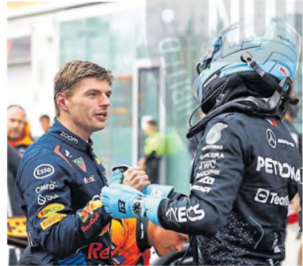
Los caminos de Verstappen y Red Bull podrían dividirse