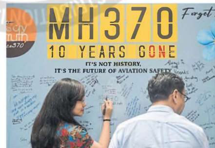
El mural que recuerda al MH370, en Kuala Lumpur