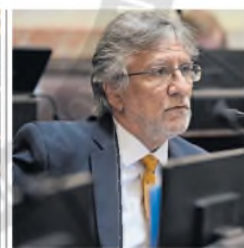
Guillermo Andrada SENADOR NACIONAL POR CATAMARCA

Del riñón del exgobernador Alberto Rodríguez Sáa, el senador dijo que no se referenció nunca en el comando de Cristina Kirchner y aseguró ayer que era hora de marcar el "pensamiento distante" con sus colegas. "Es evidente que dentro de nuestro espacio hay quienes están más cerca de Cristina Kirchner y quienes no estamos tan cerca", dijo ayer, en radio La Red. Aunque aclaró que "de ninguna manera" significa desconocer lo que fue el gobierno de la expresidenta.