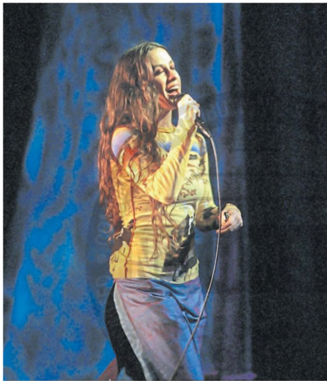
"Vivo para servirle a las personas y conectar con ellas", dice

Más allá de alcanzar el primer puesto en los rankings de Billboard, ser Disco de Platino y contar con grandes temas como "Thank U", "Joining you" y "That I would be good", la respuesta del público para con este álbum fue mucho más moderada en relación al anterior. Por su parte, la crítica especializada objetó la ausencia de hits aunque ponderó la madurez de sus letras. De todos modos, su fama continuaba en ascenso. Al punto tal que en