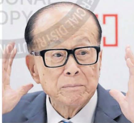
Li Ka-shing, presidente de la compañía CK Hutchison Holdings

La influencia de Li trasciende el ámbito empresarial. Mantuvo reuniones con altos líderes chinos y formó parte del comité de élite encargado de seleccionar al jefe ejecutivo de Hong Kong. Durante años, el Partido Comunista Chino entendió que el respaldo del sector empresarial era clave para sostener el sistema capitalista de Hong Kong, una pieza fundamental para la economía continental. En este contex-