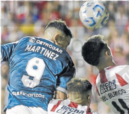
Maravilla Martínez marca el 1-0 de cabeza