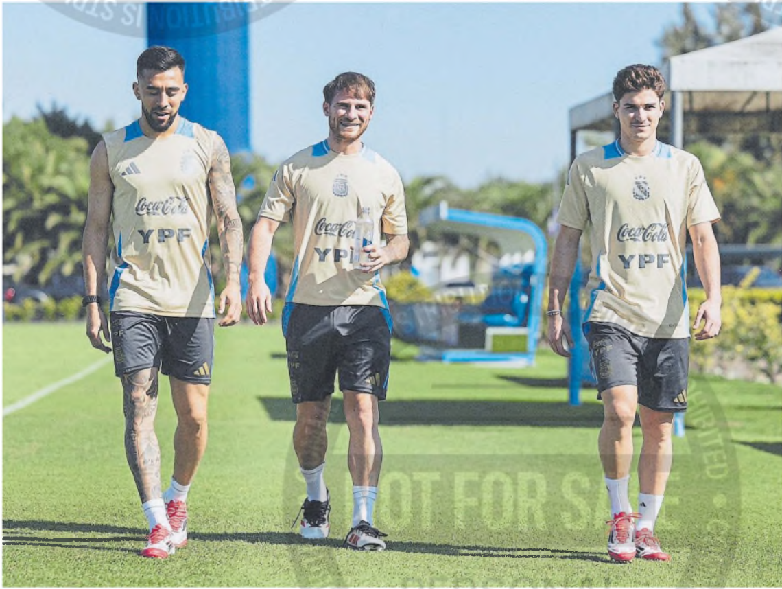
Nico González, Mac Allister y Julián Álvarez, tres piezas titulares de la Argentina para jugar esta noche en el Centenario; Messi, Lautaro y De Paul serán bajas sensibles