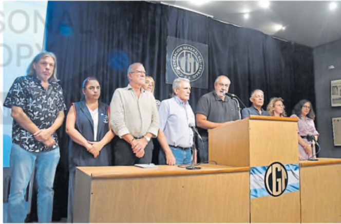
El consejo directivo de la CGT se reunió ayer durante tres horas y media

El consejo directivo se reunió desde las 15 en la sede de Azopardo,