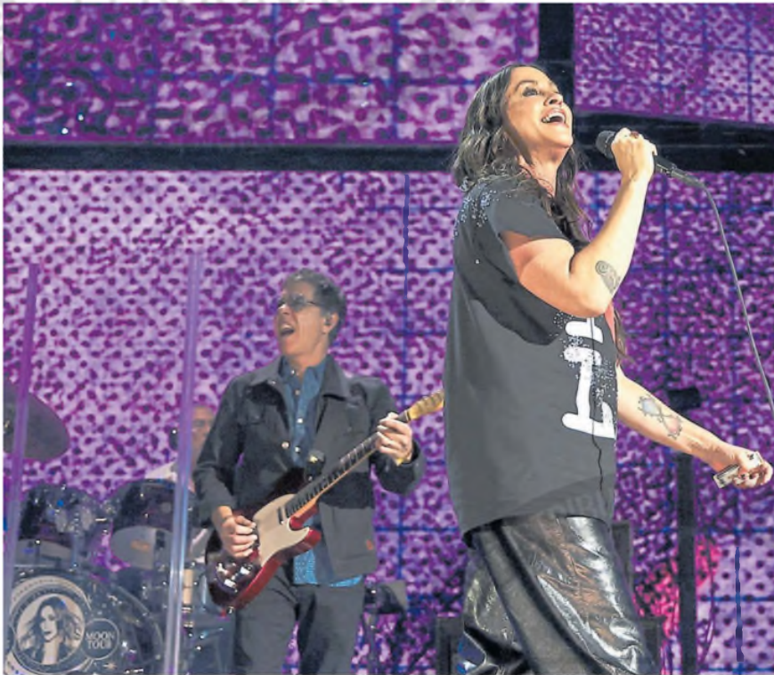
Con su disco Jagged Little Pill (1995) pateó el tablero y colocó a las artistas femeninas en un nuevo lugar