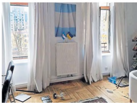
Vidrios rotos en la embajada argentina