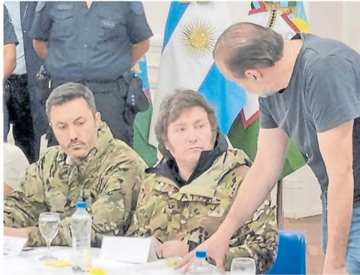
El presidente Javier Milei firmó un decreto con el ministro Luis Petri

PATRULLAJE. Un decreto del presidente Javier Milei habilitó a que las Fuerzas Armadas colaboren en la seguridad de áreas limítrofes