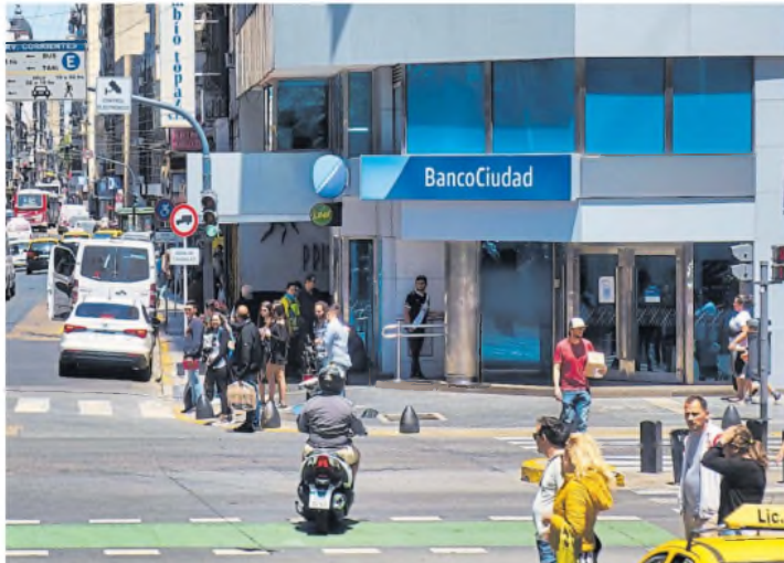
Los bancos tienen dólares en sus activos y opciones limitadas para hacerlos rendir