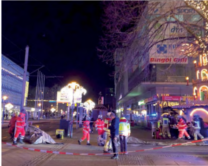
Policías y rescatistas trabajan en la zona del incidente

CONMOCIÓN. El incidente dejó dos muertos y más de 60 heridos; el conductor, un médico de nacionalidad saudita, fue detenido