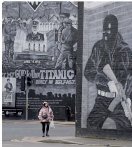
Un mural que representa a un paramilitar en Belfast

makers Museum, la retoma exactamente ahí.