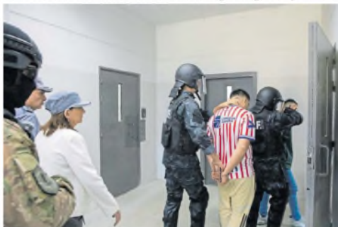
Ayer fueron trasladados los primeros presos al penal de Coronda

completar estudios o avanzar en la práctica de oficios. El complejo carcelario alojará a adultos varones, condenados y procesados, y fue denominado Eusebio Gómez en homenaje al jurista que entre 1923 y 1928 dirigió la Penitenciaría Nacional de Buenos Aires. Las camas y otras partes del mobiliario fueron fabricados por presos, en talleres ubicados en otros presidios.