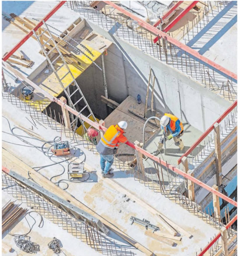
La actividad económica tuvo un repunte de 0,6% en octubre, luego de haberse estancado el mes previo

También es palpable el deterioro si se compara el período de enero a octubre de este año con el mismo