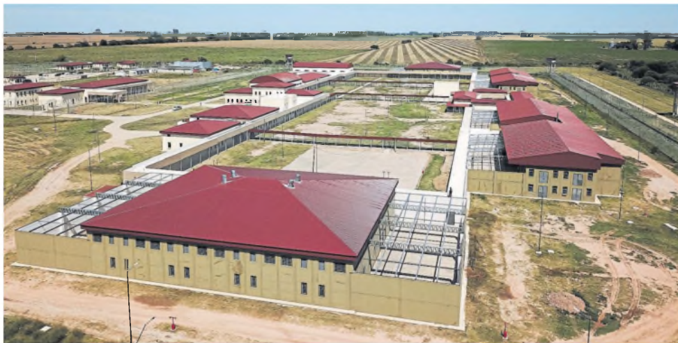
La cárcel de Coronda alojará, especialmente, a presos vinculados con delitos de narcotráfico

CEREMONIA. La ministra Patricia Bullrich encabezó en Santa Fe el acto de apertura de la nueva unidad del Servicio Penitenciario Federal, que tiene capacidad para alojar a 464 presos