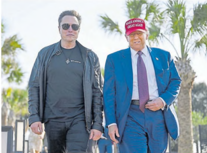
Elon Musk y Donald Trump, una relación cuestionada

La indignación repercutió en X, donde “Presidente Musk” se convirtió en tendencia. La representante demócrata Zoe Lofgren publicó