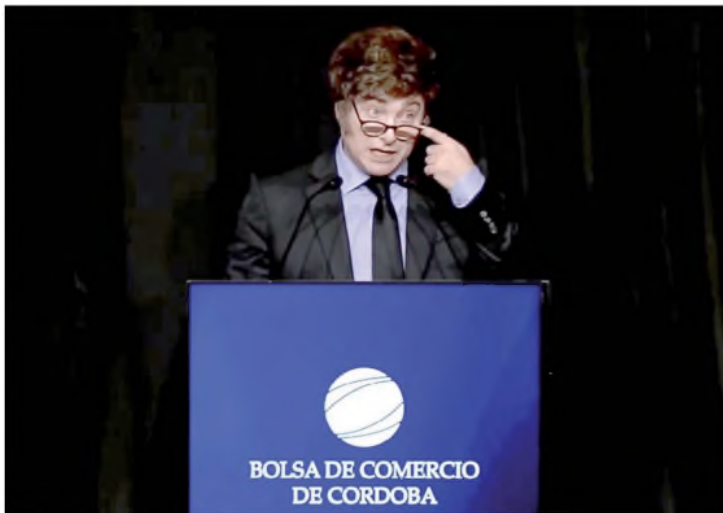
Javier Milei expuso ayer en la Bolsa de Comercio de Córdoba

En su segunda visita en dos meses a la ciudad de Córdoba y la cuarta desde el inicio de su gestión, el presidente Javier Milei usó una hora y media para describir los “logros” de su gestión, mechándolos con agravios a quienes lo cuestionan. “Me convertí en un portador de buenas