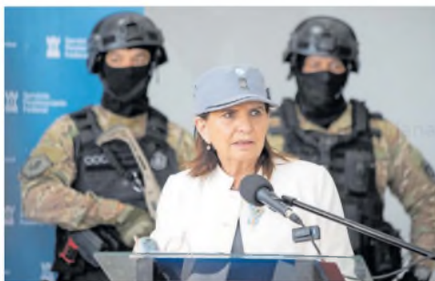
"Esta cárcel es un símbolo de nuestra estrategia integral", dijo Bullrich

La Unidad Penitenciaria Federal N° 36 Eusebio Gómez se compone de cuatro pabellones, dos con celdas colectivas y los restantes con alojamientos separados de dos plazas, además de patios internos para actividades recreativas y seis aulas para que los internos puedan