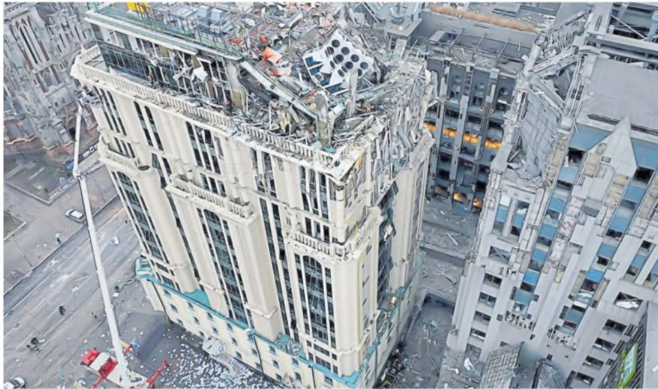
Un edificio golpeado por el bombardeo ruso en Kiev