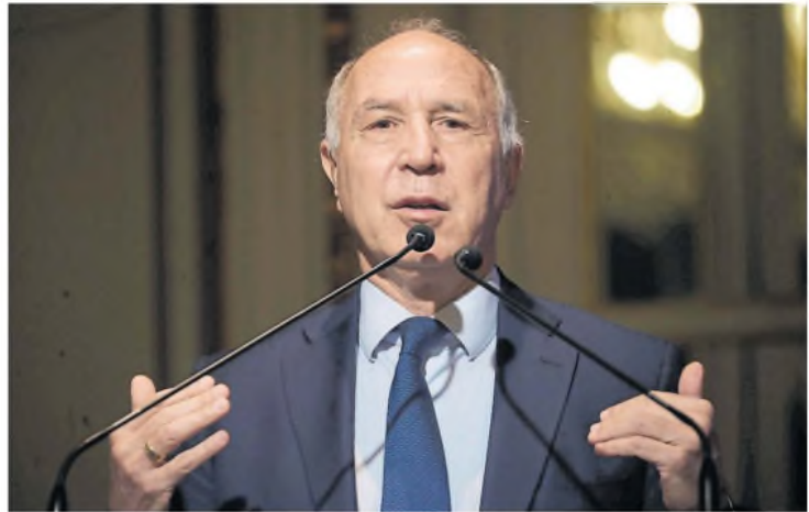
Lorenzetti acusó a Rosatti, Rosenkrantz y Maqueda de carecer de "principios morales"

El enfrentamiento de Lorenzetti con los jueces Rosatti, Rosenkrantz y Maqueda se agudizó el último año. El choque llegó a tal punto que Lorenzetti no concurrió al multitudinario homenaje que se realizó el