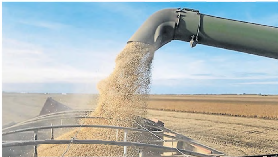
La producción de soja en Sudamérica y Estados Unidos crece a niveles récord

RIESGO. Estados Unidos y Brasil están incrementando la oferta de este producto por las políticas de incentivo a los biocombustibles; nuestro país exporta por US$10.000 millones