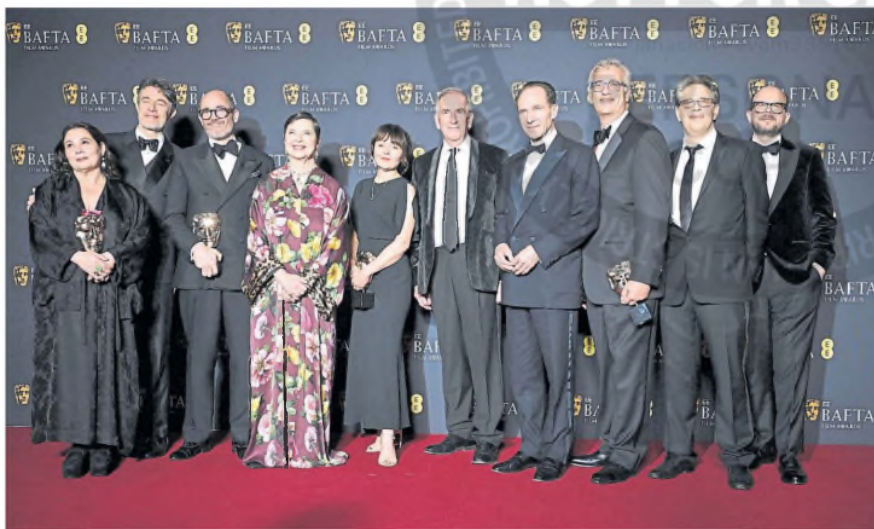
El elenco y el equipo de dirección de Cónclave , que se coronó como la mejor película de la noche