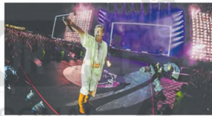
Babasónicos y un cierre de sábado impecable