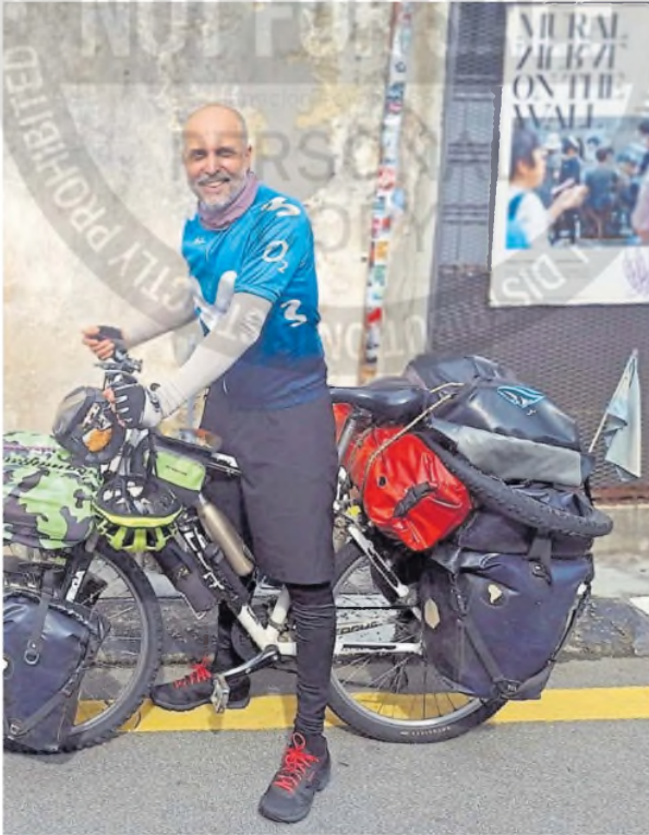
de su bicicleta