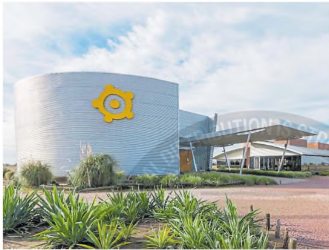
La sede de Los Grobo en Carlos Casares, en la provincia de Buenos Aires

Según pudo reconstruir LA NACION, el acuerdo comercial implicaría que con quien sea que se termine cerrando el grupo concursado brindaría su servicio de logística y acondicionamiento de granos. A la empresa le serviría para mostrar que hay una garantía de pago atrás y, además, para poder cumplir sus contratos.