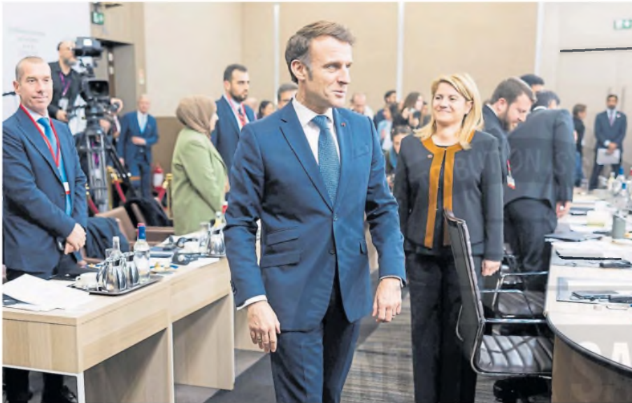
Macron, que será el anfitrión del encuentro de hoy en París, en una reciente cumbre por Siria en la capital francesa

Tras las duras posturas de Vance y otros enviados de Trump en Múnich, varios mandatarios del continente se encuentran hoy con Macron como anfitrión: la seguridad del bloque, otro eje