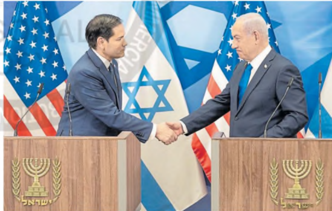
Rubio y Netanyahu, ayer, en su encuentro en Jerusalén

Netanyahu advirtió ayer que Israel abrirá "las puertas del infierno" en Gaza a menos que todos los rehenes sean liberados, al retomar una declaración de Trump. El premier