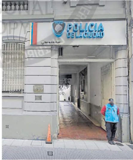
La comisaría situada en la calle Lavalle al 400