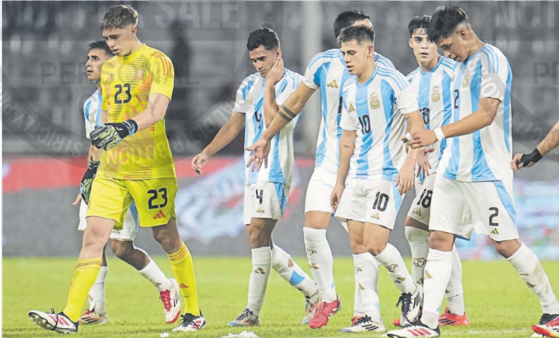
Los rostros de dolor y tristeza del final no se conciben con el gran torneo que jugó el seleccionado argentino Sub 20