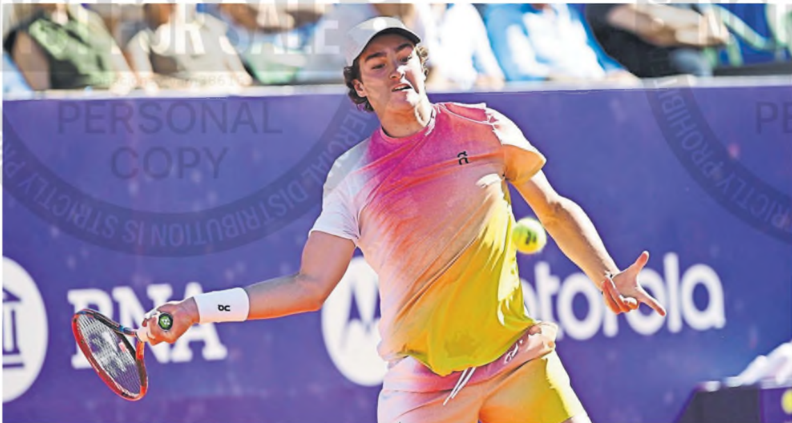
Aunque flaqueó en el cierre del segundo set, João Fonseca demostró tener mentalidad de campeón