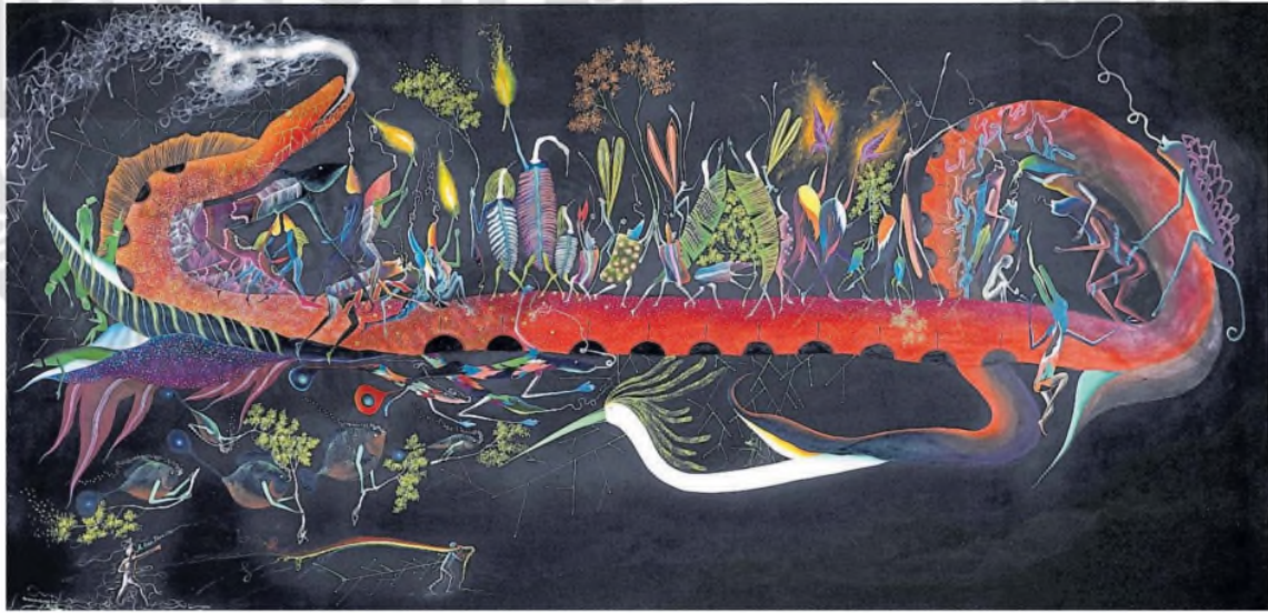
Mis abuelos (2024), obra realizada especialmente por Rember Yahuarcani para exhibirla en el Marco

Edición de hoy a cargo de Celina Chatruc www.lanacion.com/cultura | @LNCultura Facebook.com/lanacion cultura@lanacion.com.ar