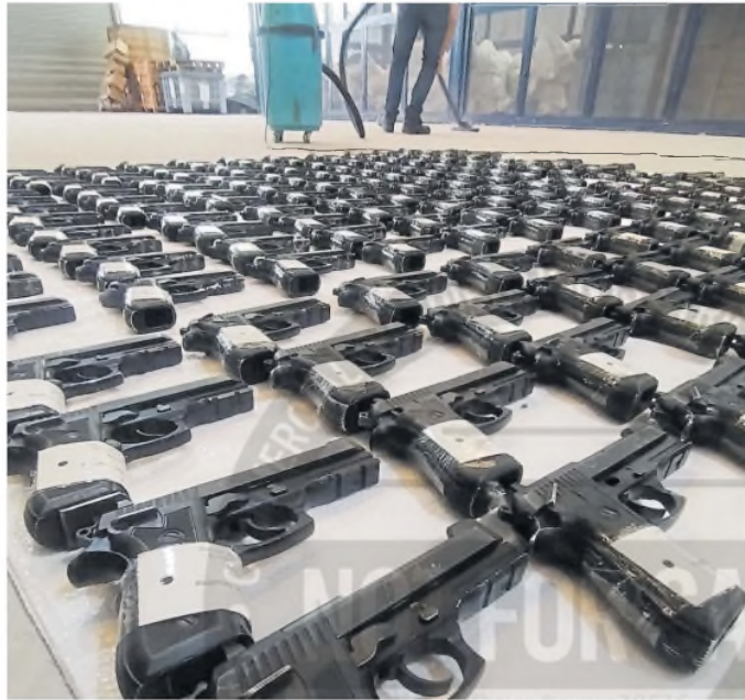
Cientos de pistolas 9 mm nuevas, incautadas en Rosario

"La reutilización de las armas decomisadas por parte de las fuerzas