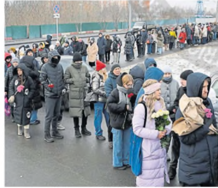
La fila para rendir tributo a Navalny, ayer, en Moscú.