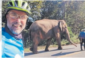
Se encontró con un sinfín de curiosidades