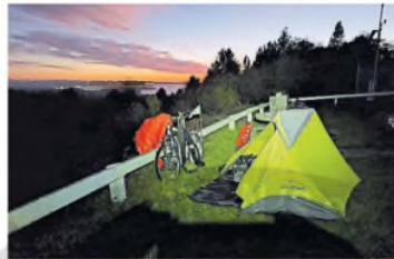
Con el equipamiento para acampar donde sea

jero que estoy conociendo lugares y tengo que mirar, aprender y aceptar todo lo que uno ve". Yo estoy de paso, si ellos eligieron vivir de esa manera hay que respetarla y aprender. Nos han metido que los occidentales estamos en un nivel superior y perdemos de ver otras culturas y costumbres que aportan muchísimo. El budismo e hinduismo aportan otra mirada".