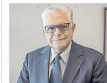
Ricardo López Murphy DIPUTADO NACIONAL