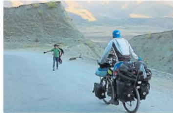
Recorre el mundo en bicicleta y con sus bártulos