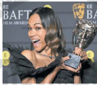
Zoe Saldña, mejor actriz de reparto