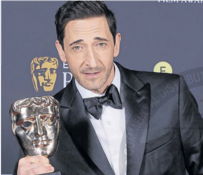
Adrien Brody ( El brutalista ) con el galardón por mejor actor protagonista

Ambas películas se llevaron ayer los galardones a mejor película y actor protagonista; interrogantes sobre la suerte de Emilia Pérez ; se anticipa una competencia reñida para la gran fiesta de Hollywood