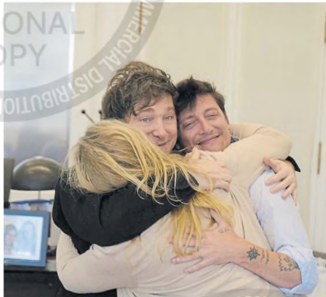
Karina y Javier Milei y Santiago Caputo, en una foto que difundieron hace diez días

Sin embargo, la magnitud del escándalo, cuyos efectos y daños trascienden las fronteras, y que el excluyente protagonista sea el mismísimo Presidente demandan más