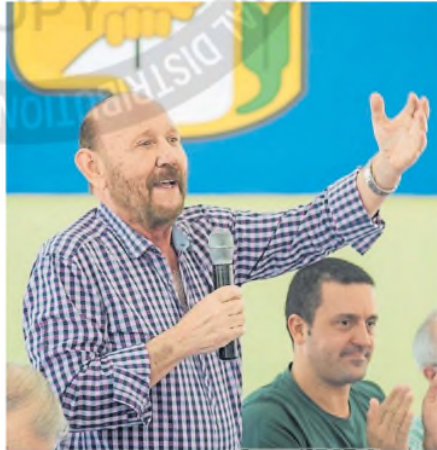
El gobernador de Formosa, Gildo Insfrán

Además de gobernar Formosa desde 1995, Insfrán es el presidente del Congreso Nacional del Partido Justicialista, mientras