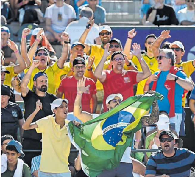
Los brasileños llegaron con sus camisetas y tuvieron duelos futboleros con los argentinos M. CORTINA