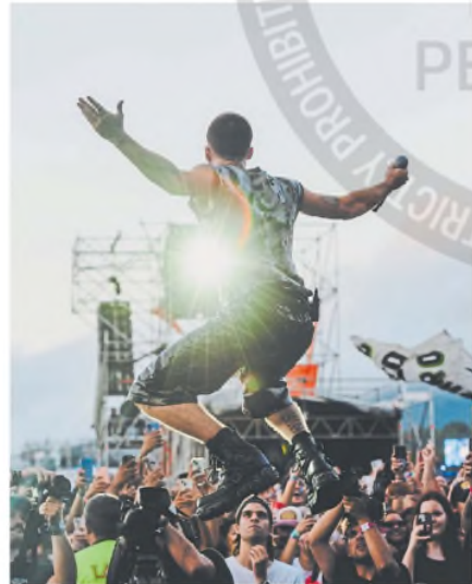
Wos arengó a su público y se llevó aplausos

En el principal puesto de venta de merchandising de Cosquín