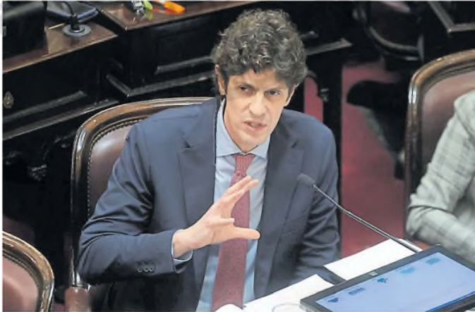
Martín Lousteau apoya que una comisión investigue la operatoria detrás de $LIBRA

CRÍTICAS. El oficialismo analiza si le conviene abrir el recinto de la Cámara alta para que se convierta en caja de resonancia del affaire; la oposición podría pedir la citación de Karina Milei, Francos y Caputo