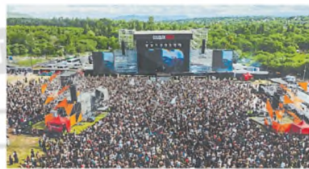
Una vista de la multitud en las sierras cordobesas