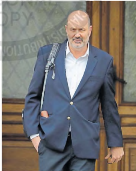
El ministro Federico Sturzenegger

"Entre diciembre de 2023 y diciembre de 2024, la reducción en el personal del sector de APN generó un ahorro total a largo plazo de US$4412 millones de dólares. Esto equivale a un ahorro promedio mensual de largo plazo de aproximadamente US$367 millones", indicaron en el Ministerio de Desregulación y Transformación del Estado, y precisaron que el recorte se manifestó de manera más pronunciada en los contratos regidos por la Ley Marco, con un ahorro total de US$2118 millones. En cuanto a la modalidad permanente y transitoria, el ahorro total alcanzó los US$1533 millones, mientras que en la modalidad de contratos LOYS fue de US$761 millones.