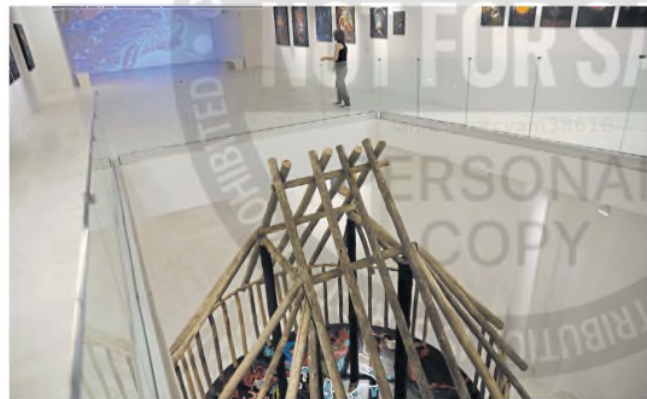
La muestra incluye su primera instalación: la recreación de una "maloca"

ARTE. El museo Marco sorprende con una gran exposición de Rember Yahuarcani, artista indígena nacido en Perú, que expuso con su padre en la última edición de la Bienal de Venecia