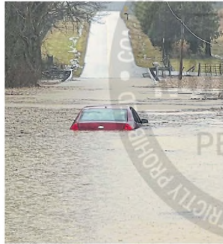
Un auto sumergido en Bowling Green, Kentucky

Según Alerta Río, es probable que febrero de este año sea uno de los más secos registrados. La precipitación media hasta ahora es de 0,5 mm. ●