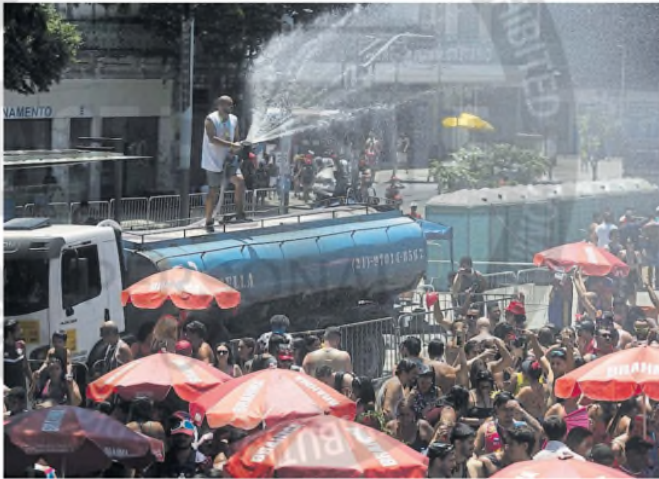
Pese al calor, en Río continuaron con los desfiles callejeros previos al carnaval