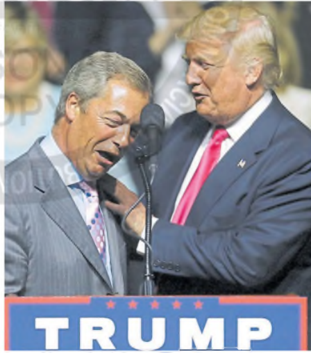
Farage, líder populista de Reform UK, con Trump, en 2016

El vértigo diplomático del primer ministro Keir Starmer –que trata de reunir una fuerza europea de paz para Ucrania y al mismo tiempo intenta salvar la alianza con Washington– ha recibido elogios de todo el espectro político británico. Y después de sus desenfadados primeros seis meses de gobierno, las cifras de Starmer en