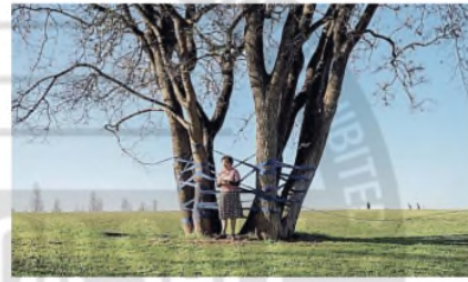
La memoria futura, una de las propuestas.