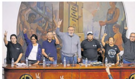
Ayer la CGT oficializó el ingreso de la UTEPE a la central

Anteayer, en tanto, tras los incidentes en el Congreso, la CGT dio alguna pista de la definición que se viene. "Frente a nuestros mayores jubilados, que gritan su sufrimiento reclamando cuidado y atención, un gobierno nacional irresponsable e insensible devuelve crueldad, desprecio, odio y violencia. Ante lo que está sucediendo, la CGT evaluará en la próxima reunión de consejo directivo medidas de acción en repudio de la represión". Cuando la CGT oficialice el llamado al paro, se plegarán a la medida las dos vertientes de la CTA y el sindicalismo trotskista, que presionaba por una reacción de la corporación sindical mucho antes de los incidentes en el Congreso. ●