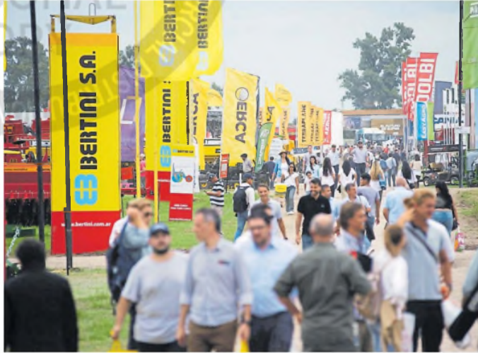
Productores recorren el predio de Expoagro durante la tercera jornada de la muestra

Luego indicó que una señal del Presidente para el sector agropecuario, obviamente, debe ser la eliminación de las retenciones. “Hay que sacarlas. Tienen que hacer obras viales, ferrocarriles y facilidad para llegar a los puertos o el almacenaje. Si bien hoy se hace