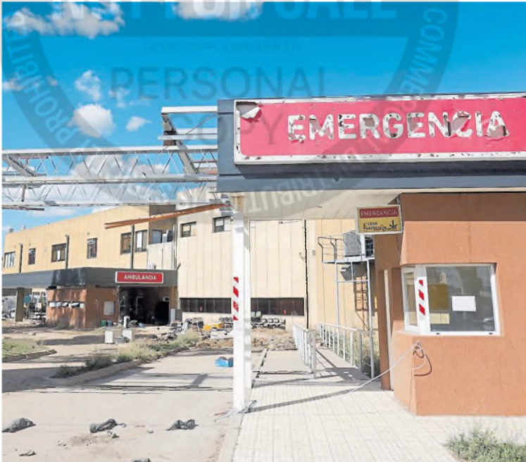
Los daños más graves sucedieron en el subsuelo y la planta baja