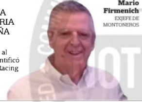
Mario Firmenich JEFE DE MONTONEROS

Llamó a marchar al Congreso y se identificó como hincha de Racing