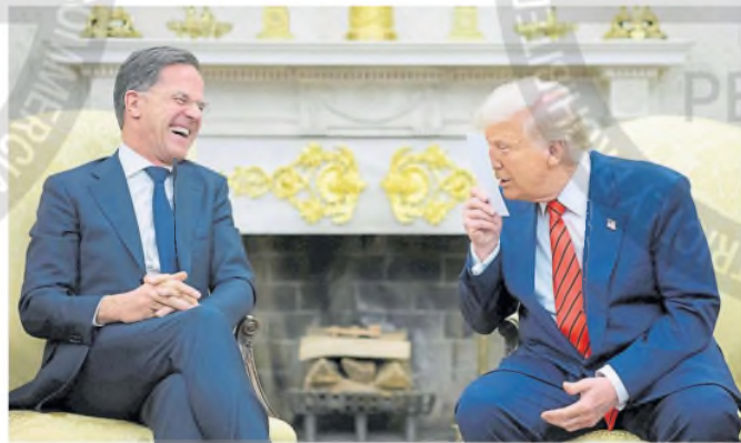
Trump se reunió ayer con el líder de la OTAN, Mark Rutte, en el Salón Oval

En la guerra de tarifas, europeos y norteamericanos se amenazan mutuamente con más aranceles sobre las bebidas alcohólicas