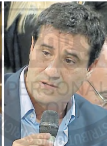
Abad le recordó su pasado kirchnerista

no seguía mascullando en voz alta su enojo. "Se llenan la boca hablando de la Constitución y ahora buscan cualquier excusa para justificar al Gobierno", agregó Lousteau, en réplica a la postura de algunos senadores que defienden la designación de García-Mansilla por decreto presidencial.