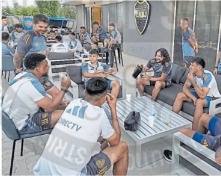
Gago empezó a mostrarse más próximo a los jugadores