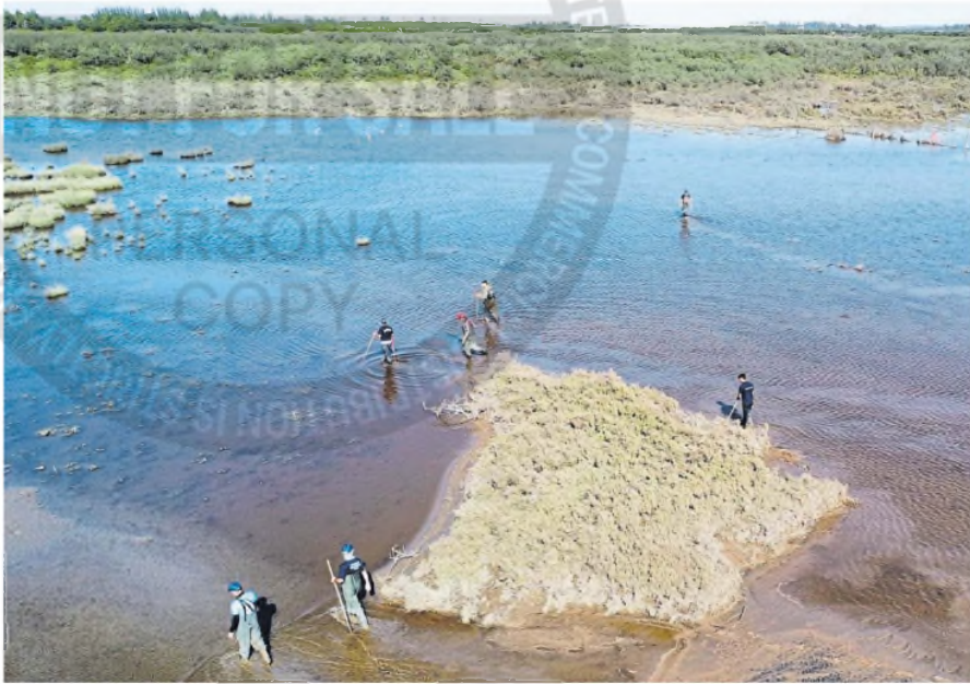
Todavía siguen los operativos de rastreo en busca de personas perdidas durante el temporal