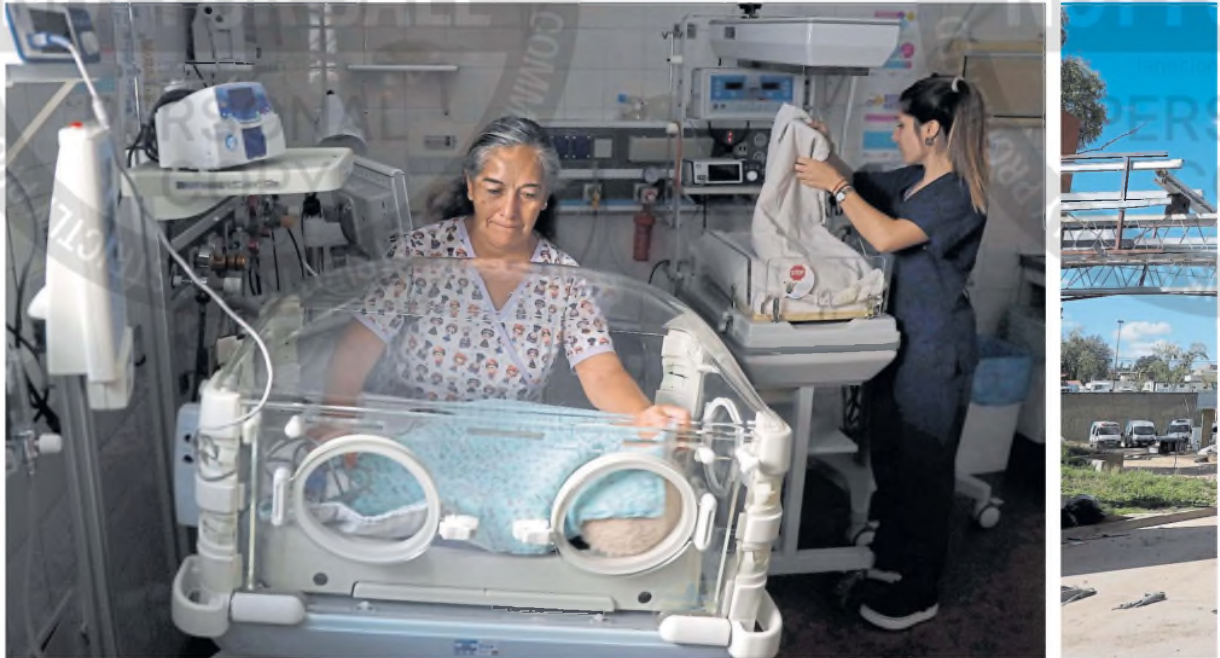
El Hospital Privado del Sur es una de las instituciones especializadas en maternidad y neonatología

Tragedia en el sur bonaerense | DIFICULTADES A UNA SEMANA DEL TEMPORAL