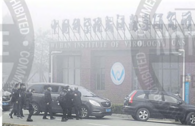
Delante del Instituto de Virología de Wuhan, China

La teoría de la “fuga de laboratorio” ha sido una de las explicaciones más destacadas, aunque controver-