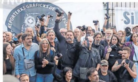
La manifestación, con las cámaras en mano

En señal de protesta, los reporteros gráficos levantaron sus cámaras mientras entonaron cánciones en contra de la gestión libertaria. "Fuera, fuera, fuera", cantaron. El gremio había anticipado que se presentaría en la Justicia para pedir que se investigue la agresión a Grillo. ●