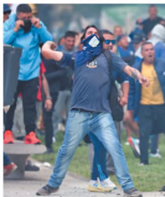
Un proyectil contra el Congreso