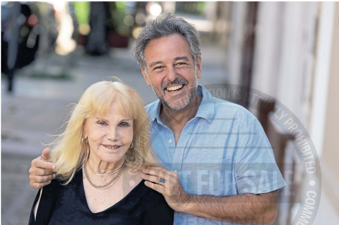
Madre e hijo, una relación que se fortaleció y que proyectan trasladar a los escenarios