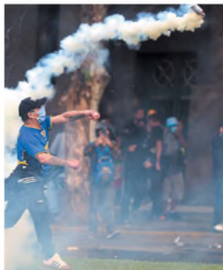
Ataque frente a la policía