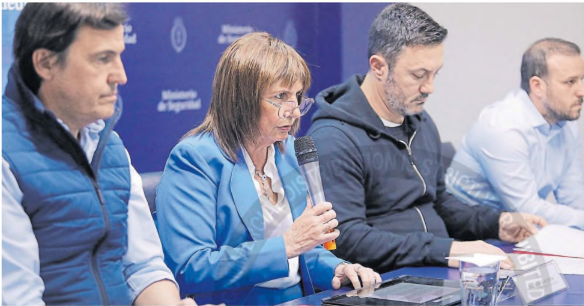
La ministra Patricia Bullrich, ayer, en conferencia de prensa en Bahía Blanca junto a su par de Defensa, Luis Petri

El Gobierno cuestionó con dureza a la jueza que liberó a los detenidos durante la marcha del miércoles; cuestionó a los jefes comunales de La Matanza y Lomas de Zamora por fogonear la movilización