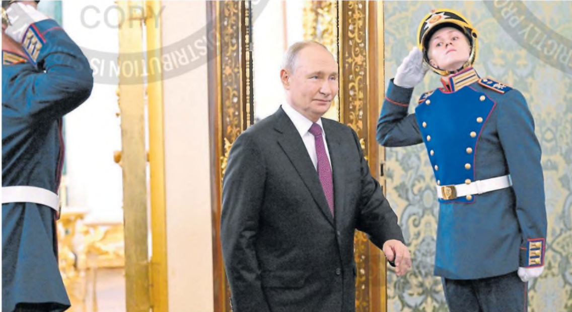
Putin ingresa en uno de los salones del Kremlin antes de reunirse ayer con su aliado bielorruso Alexander Lukashenko

La invasión rusa | EL JUEGO DEL JEFE DEL KREMLIN