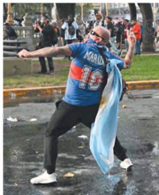
Otro hincha "en acción"

LOS ATACANTES, EN LA MIRA. Un día después de los graves incidentes frente al Congreso, el Gobierno denunció una acción coordinada entre sectores de la política y barras bravas que les responden con el objetivo de generar acciones de desestabilización. El registro fotográfico muestra la participación en los disturbios de individuos que cometieron actos de violencia identificándose con camisetas de distintos clubes de fútbol. Las imágenes permiten reconstruir el accionar delictivo de personas que atacaron con elementos contundentes la sede legislativa y a efectivos de fuerzas de seguridad. Muchos lo hicieron con sus rostros tapados, pero otros, a cara descubierta. Página 14