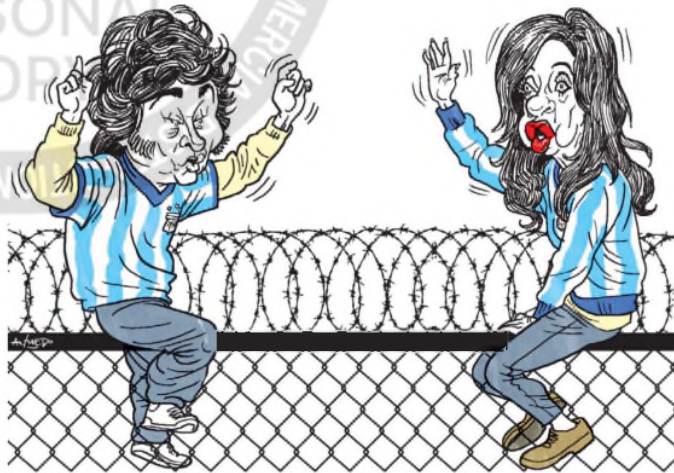
Javier Milei y Cristina Fernández de Kirchner

Después de la indignación, el espanto y el dolor pertinentes por las escenas que dejó la violenta jornada de anteayer en el Congreso, una pregunta se instaló entre quienes son parte o siguen de cerca las dinámicas políticas: "¿Beneficia a alguien lo que pasó?"