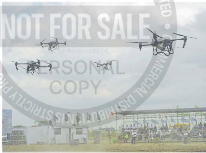
Los drones en acción durante la muestra