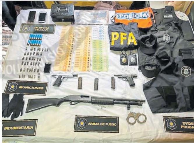
Los secuestradores usaban ropa similar a la utilizada por policías

Todo empezó el 20 de febrero pasado, cuando el dueño de un ne-