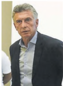
Mauricio Macri

"Ayer, en una escena idéntica, se movilizaron con el nombre de 'hinchadas argentinas' a barrabrazas de distintos equipos de fútbol para ejecutar una nueva desestabilización de la democracia. Escudados en algunos pocos jubilados, los barrabrazas pusieron en práctica los tres movimientos que repiten en estas situaciones: provocar a la policía, atacarla, victimizarse", enumeró.