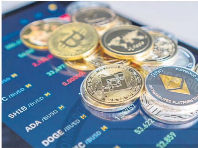
El Gobierno dice que busca garantizar la transparencia y proteger a los usuarios

El artículo 37 no pasa desapercibido, tras el escándalo cripto. En un tire y afloje con las empresas del sector, entre prohibiciones y libre albedrío, finalmente la CNV definió que las billeteras digitales podrán ofrecerle a sus clientes activos virtuales que se lanzaron con una antigüedad menor a los 90 días. Sin embargo, tendrán que hacerlo en una sección especial de la plataforma, y