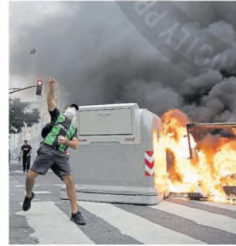
Hubo 89 contenedores destruidos