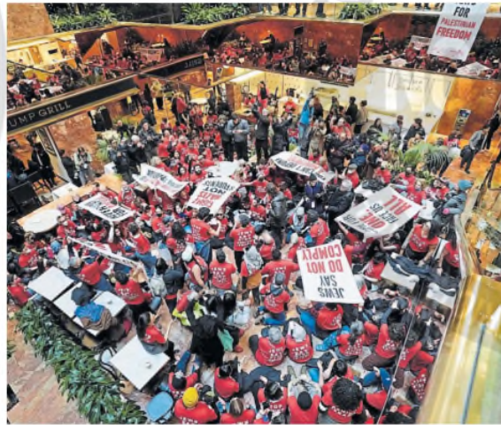
PROTESTAS. Musk y Trump, ayer, fueron blanco de movilizaciones contra los recortes de DOGE, la agencia a cargo del empresario, y de activistas judíos por la paz, en la Trump Tower