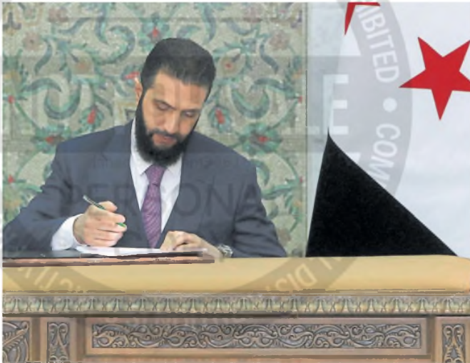
Al-Sharaa firmó ayer en Damasco la nueva Constitución siria