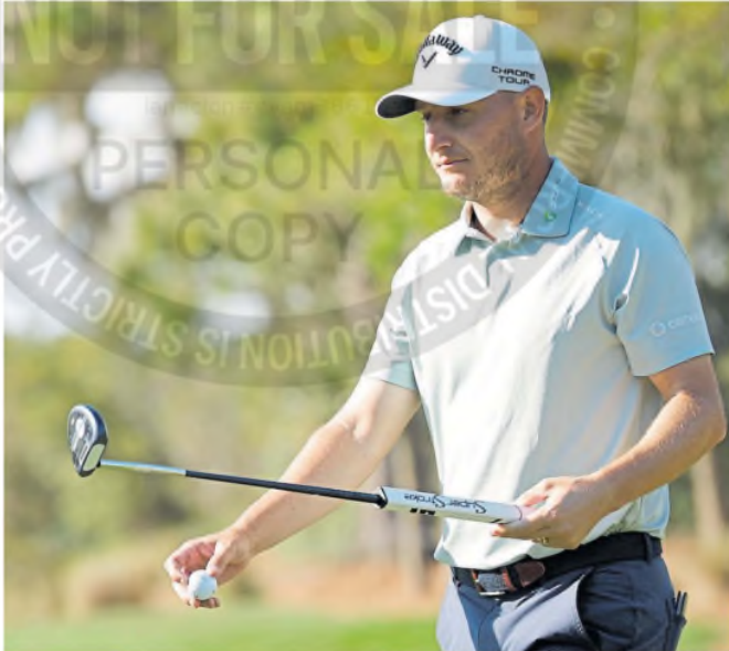
Grillo cerró una gran tarde con 68 golpes (-4) y quedó en la 9ª ubicación