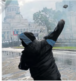
El instante en que arroja un pedrazo H. ZENTENO

La mayoría de los protagonistas de los incidentes se cubrieron la cara: la reconstrucción costará 260 millones de pesos