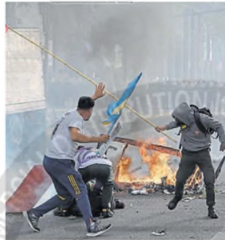
Se armaron fogatas en las calles