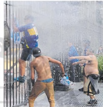
Los ataques llegaron a la Casa Rosada

El gobierno porteño informó que la mitad de los 94 detenidos durante los incidentes frente al Congreso tienen "graves antecedentes penales" y que del total cinco serían barrabravas.