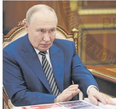
Putin, ayer, durante una reunión en el Kremlin

Los gestos del magnate Trump ha dejado de financiar la Fundación Nacional para la Democracia, que el Kremlin odia porque apoya a grupos que denuncian la tiranía y la corrupción de Putin. Ha suspendido las operaciones cibernéticas ofensivas contra Rusia. Votó con Rusia (y con regímenes rebeldes como Corea del Norte y Bielorrusia) en las Naciones Unidas contra una resolución que censuraba a Rusia por su invasión de Ucrania. Ha dicho que no defenderá a las naciones de la OTAN que supuestamente no pagan lo suficiente por su defensa