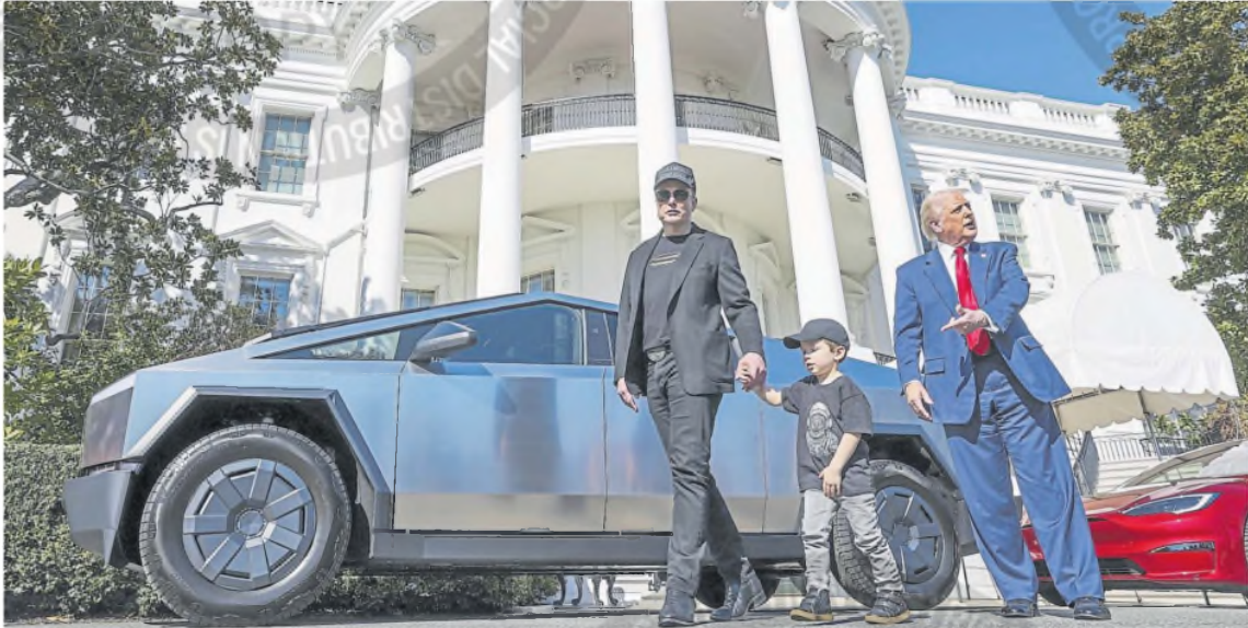
Donald Trump, junto a Elon Musk y su hijo, hablan con la prensa rodeados de vehículos Tesla en los jardines de la Casa Blanca