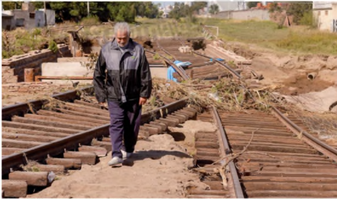
Casi toda la infraestructura de Bahía Blanca quedó arruinada por la inundación.

El gobernador dirigió su mensaje a Milei, a quien le pidió una reunión: Petri rechazó las críticas por la ausencia presidencial