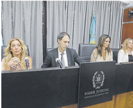
El juicio está a cargo del Tribunal Oral N° 3 de San Isidro