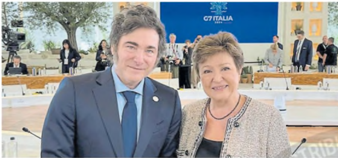
Javier Milei y Kristalina Georgieva

El organismo aclaró que la aprobación del Congreso no es una exigencia del acuerdo, sino de la legislación argentina