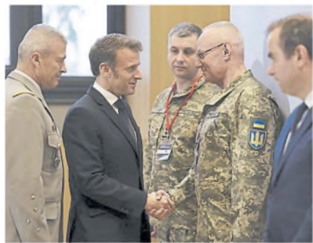
Macron saluda al general ucraniano Ruslan Khomchak