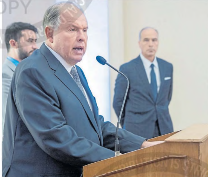
Gerardo Werthein, a cargo de la Cancillería, mantiene reserva sobre las negociaciones