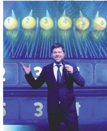
Un maestro de ceremonias con astucia y oficio CAPTURA

se recupera una inversión tan grande si no se puede contar con las entradas vendidas en salas tradicionales? En primer lugar, se buscan caras conocidas para dar vida a los personajes en la pantalla. La protagonista de esta historia es Michelle, una adolescente que perdió a su hermano menor y vive con un padre adicto a la realidad virtual. Su papá no es el único que prefiere ponerse un casco para vivir en un mundo de fantasía en vez de enfrentar una existencia miserable. Continúa en la página 2