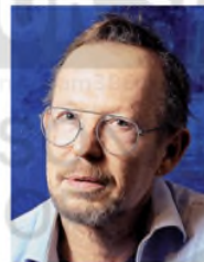
Guillermo Kuitca BUENOS AIRES, 1961