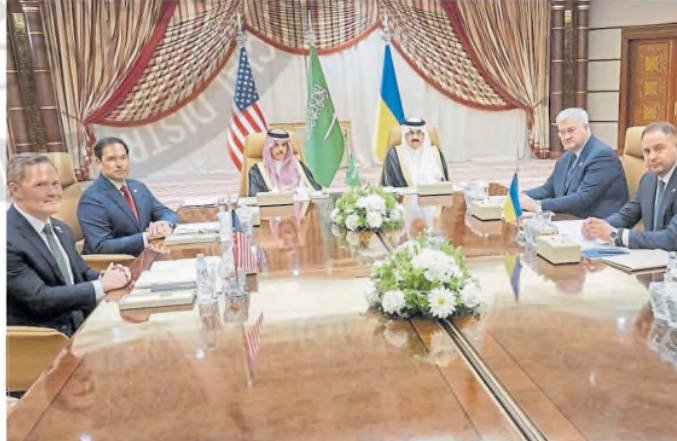
Las delegaciones de Estados Unidos y Ucrania, ayer, en el palacio en Jeddah, Arabia Saudita.

"Ucrania expresó su disposición a aceptar la propuesta de Estados Unidos de promulgar un cese del fuego inmediato e interino de 30 días, que puede ser prorrogado por acuerdo mutuo de las partes y que está sujeto a la aceptación y aplicación simultánea por parte de la Federación Rusa. Estados Unidos comunicará a Rusia que la reciprocidad rusa es la clave para lograr la paz", dijo un comunicado conjunto de las delegaciones.