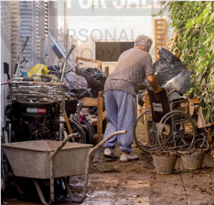
Un geriátrico devastado por el temporal en Cerri