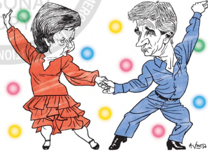
Kristalina Georgieva y Luis Caputo

Las reservas actuales son negativas, aunque mucho menos negativas que las que dejaron Alberto Fernández y Sergio Massa. Es probable que ni Francos ni el Caputo ministro logren eludir esa citación legislativa cuando el decreto de necesidad y urgencia sea tratado por la comisión bicameral, que debe dictaminar sobre los DNU antes de que estos sean tratados por los plenarios de las dos cámaras del Congreso. Pero un DNU necesita solo de la aprobación de una de las dos