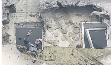
Un perito ruso analiza daños en un edificio de Moscú.

Las regiones más afectadas fueron Kursk, donde se reportó la destruc-