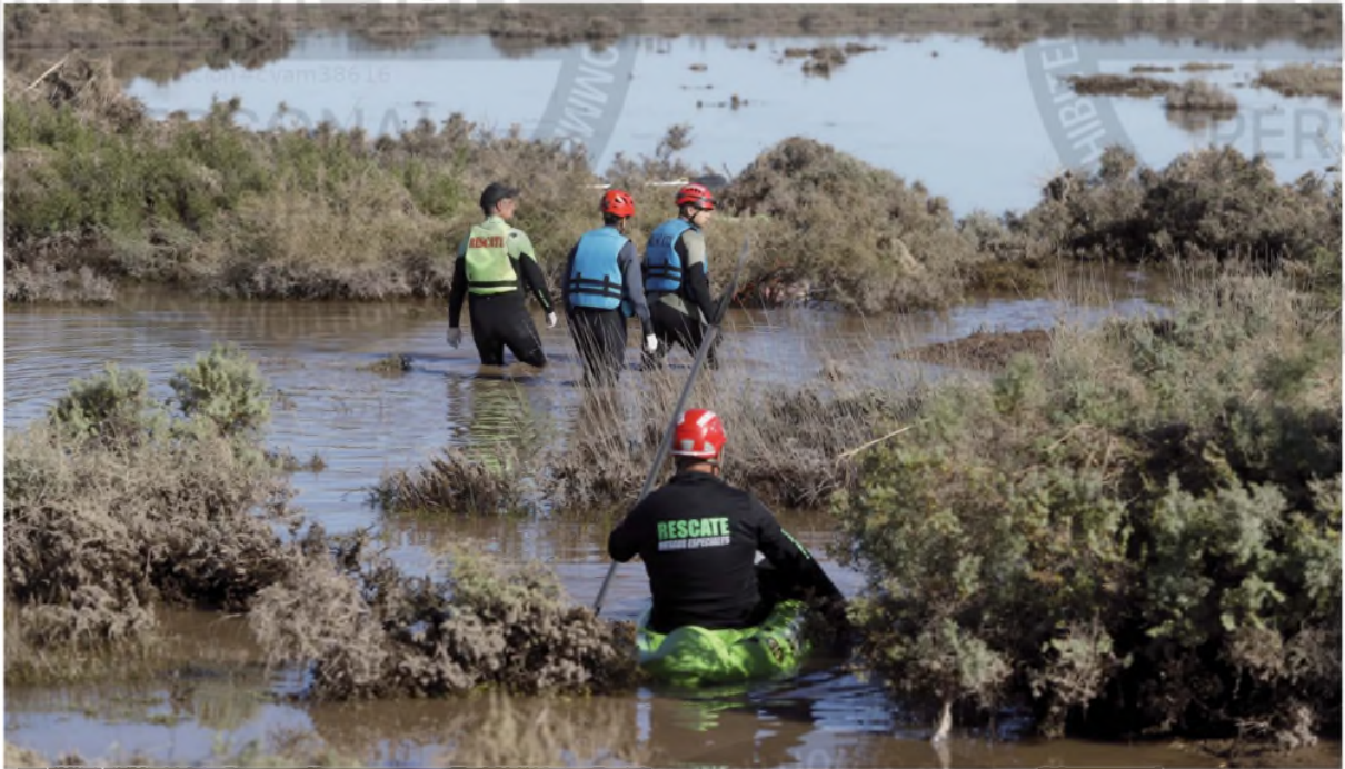
Sigue la búsqueda de personas en diversas zonas donde el agua aún no escurrió