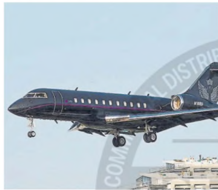
El avión usado para el vuelo

y partió a Francia, previa escala en Tenerife, España, para cargar combustible.