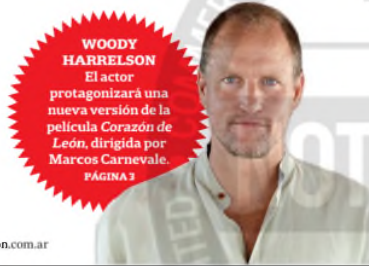
WOODY HARRELSON El actor protagonizará una nueva versión de la película Corazón de León , dirigida por Marcos Carnevale. PÁGINA 3