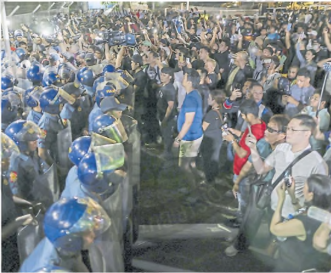
Partidarios de Duterte, en la base aérea Villamor, donde estuvo detenido el exmandatario. G. CARRERONIA