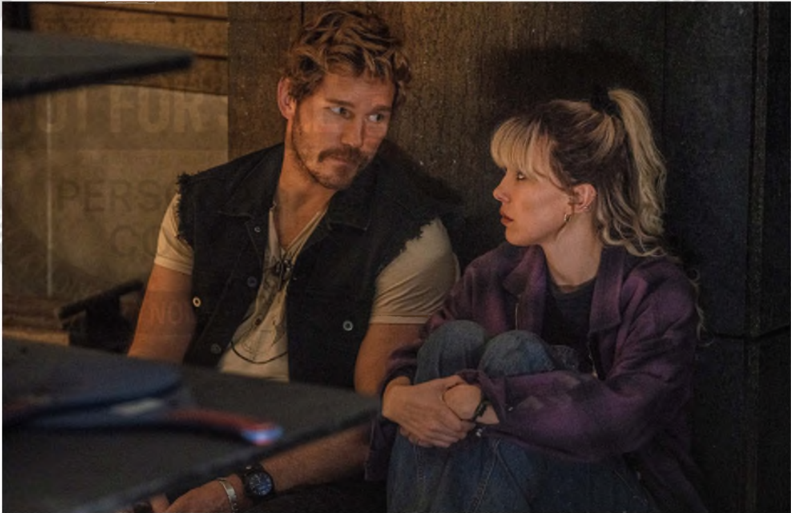
Chris Pratt y Millie Bobby Brown son los protagonistas de esta megaproducción que va directo al streaming