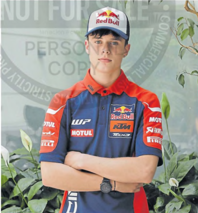
"No es algo que haya elegido, lo sentí así", dice Perrone sobre la bandera argentina. RICARDO PRISTUFLUX