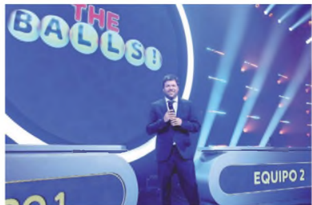
Un nuevo programa en las noches de Eltrece

Entre la posibilidad de jugar del otro lado de la pantalla desafiando a las audiencias con sus propios conocimientos y el morbo de ver caer impetuosamente a una persona vestida al agua pivotea este nuevo espacio de eltrece, ameno y en la línea del canal, nuevamente apostando por quien, en las últimas temporadas, es su figura más estelar. ●