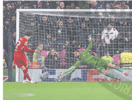
Donnarumma ataja el penal de Curtis Jones

Siendo un futbolista más técnico que físico, con dinámica y pase como sus características más destacadas, Castaño ya está apuntado como el refuerzo más necesario del mercado ante la im posibilidad de poder consolidar otro nombre fuera del de Enzo Pérez. River sufre en un puesto clave del campo. Y lleva 30 millones de dólares invertidos para corregir un problema de difícil solución. ●