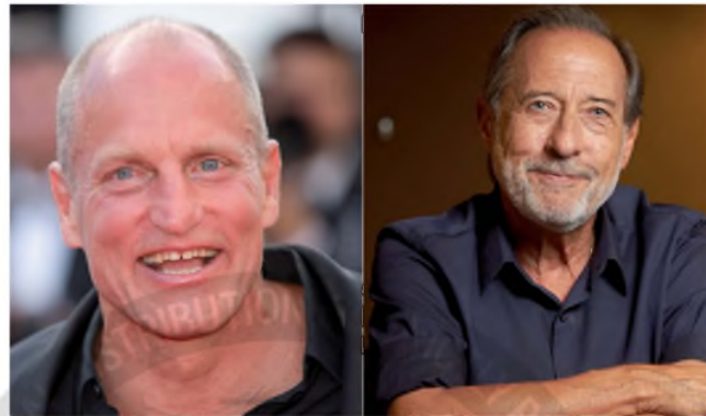
Dos grandes actores para un mismo papel: León

CINE. Marcos Carnevale dirigirá una versión de Corazón de León (2013), originalmente con Guillermo Francella y Julieta Díaz