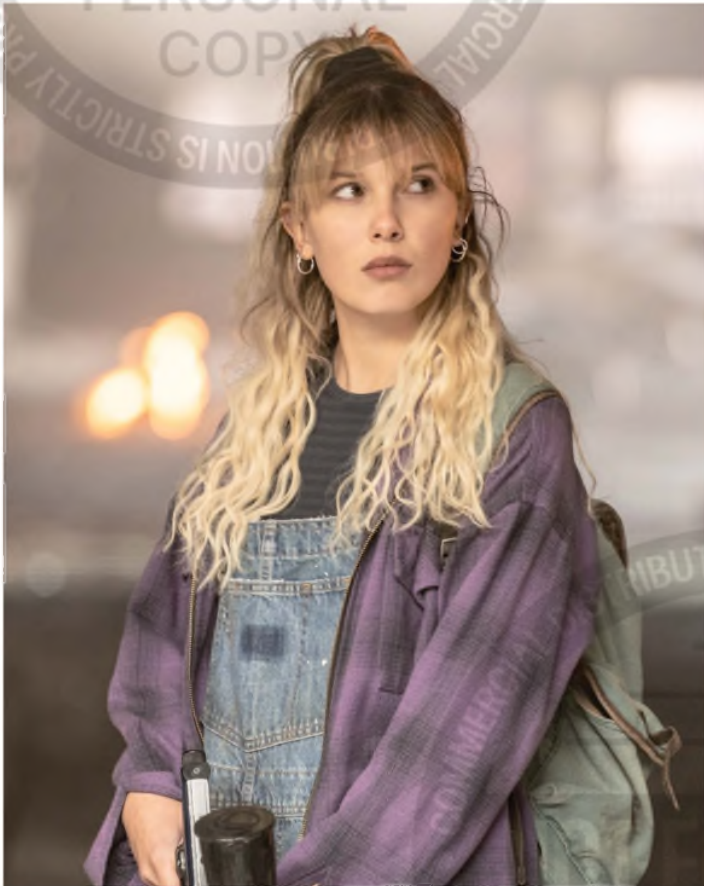
La actriz, en un papel maduro y dramático