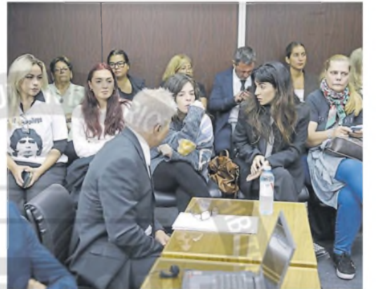
La familia de Maradona siguió de cerca el debate

imputar el hecho de la muerte. No hay un solo elemento que indique que Díaz tenga que ver con la muerte de Maradona. Podrán ser más o menos antipáticos los WhatsApp, pero ninguno tiene relación con el resultado de la muerte de Maradona, al que todos lloramos”.