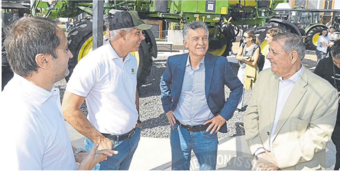
Mauricio Macri y el senador De Angeli, ayer, en Expoagro

La negociación por la deuda | EL PAPEL DEL PARLAMENTO