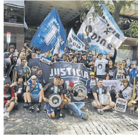
Hinchas se sumaron ayer al pedido de justicia

El chico, de 12 años, compartió en las redes sociales su mensaje antes de la audiencia