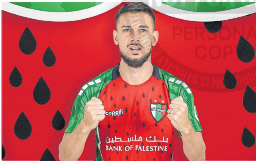
La camiseta de Palestino, con la sandía, símbolo de la resistencia

16.40 » Arnold Palmer Invitational. La Pª vuelta. ESPN 3 (CV 104 HD - DTV 1623 HD)