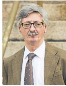
El fiscal Eduardo Taiano

El movimiento se da en el marco de una segunda batería de me-