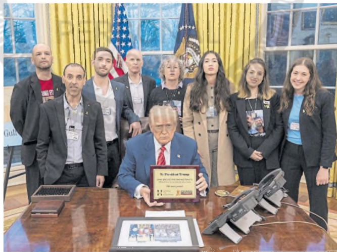
Horn, con remera roja, en el Salón Oval con Trump