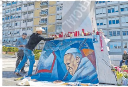
Un artista coloca un retrato del Papa frente a la clínica

"Normalmente si una terapia con antibióticos es correcta en una