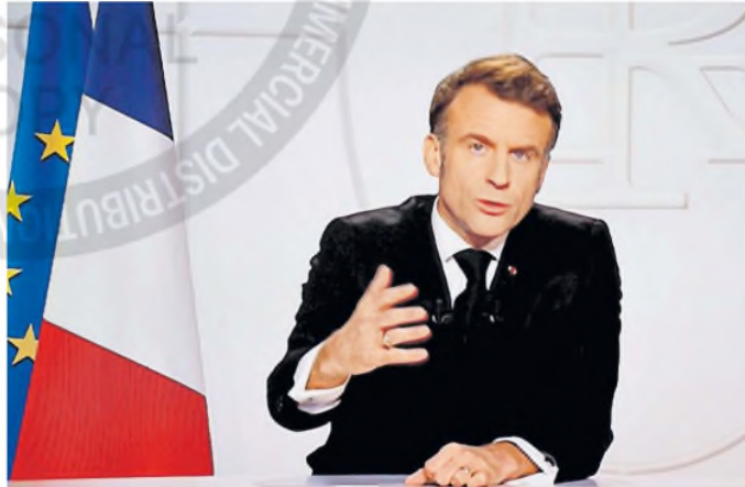
Macron participará hoy de una cumbre de líderes europeos en Bruselas

Tres años después del comienzo de la guerra en Ucrania, Macron recordó que el conflicto, que "provocó cerca de un millón de muertos y heridos, continúa con la misma intensidad", y deploró que "Estados Unidos, nuestro aliado, haya cambiado su posición sobre esta guerra y apoye menos a Ucrania permitiendo dudar de lo que sucederá después". En claro, "nuestra prosperidad y nuestra seguridad" en Europa "se han vuelto inciertas", dijo, reconociendo que