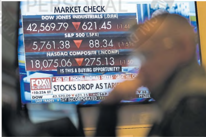
Las acciones argentinas que cotizan en Nueva York registraron alzas

MERCADOS. Los bonos soberanos de deuda operaron con alzas de hasta 4%, el CCL subió $18 y el BCRA compró US$245 millones