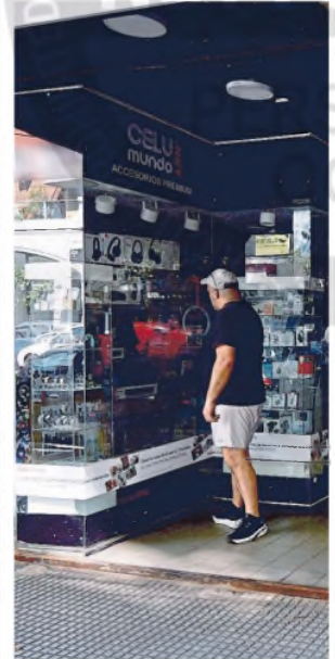
Un comercio a oscuras en Almagro