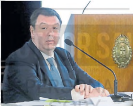
El juez federal Lijo, a la espera de la aprobación