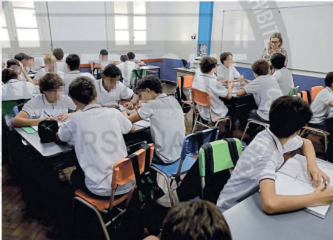
El Colegio Los Robles, en Monserrat, uno de los que participan de la prueba piloto RICARDO PRISTUFLUK