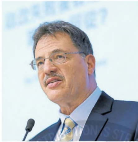
Larry Diamond, experto en sistemas autocráticos

Algunos republicanos en el Congreso algunos funcionarios electorales están preocupados por su seguridad física. No entiendes el fascismo si no entiendes el papel de la amenaza de violencia física para intimidar a las personas e inutilizar su resistencia. Trump ha retirado la protección del Servicio Secreto para aquellos que lo cuestionaron en su gobierno anterior. Manda una advertencia, como un capo mafioso.