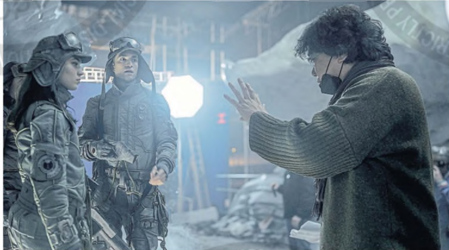
El director en el set de filmación de un largometraje de ciencia ficción que interpela al presente

"A medida que fui haciendo más películas me di cuenta de que si vas a la zona donde estás filmando y te permitis encauzar lo que sea que te interese en ese momento de alguna manera todo se conecta con el proyecto. En este caso sucedió así. Un día estaba caminando y escuchando una entrevista con Steve-O, uno de los integrantes del programa de dobles de riesgo Jackass . y al mismo tiempo pensando en cómo interpretar a Mickey y la verdad es que no tenía idea de qué iba a hacer. Lo escuchaba contar cómo era hacer las distintas pruebas de riesgo en el ciclo de TV del que yo era fanático cuando era chico. Él decía que sin pensar lo mucho siempre aceptaba hacer las pruebas más peligrosas y de alguna manera lo conecté con Mickey. Porque el personaje está básicamente en el infierno pero hace