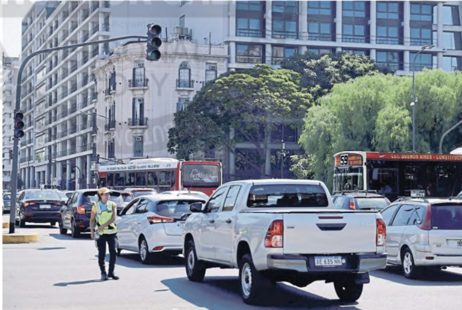
Embotellamientos en la avenida 9 de Julio por el corte, que afectó más de 255 semáforos

Calor extremo y falta de luz | OTRA JORNADA CON MÚLTIPLES TRASTORNOS