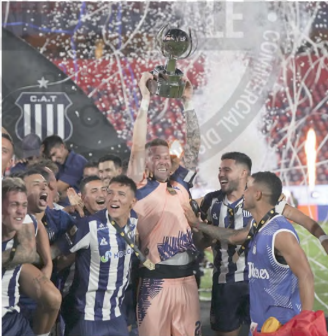
La noche que Talleres tanto tiempo esperó: campeón de un título nacional