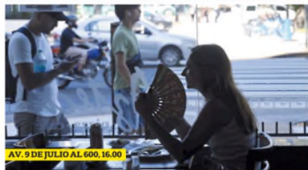
AV. 9 DE JULIO AL 600, 16.00