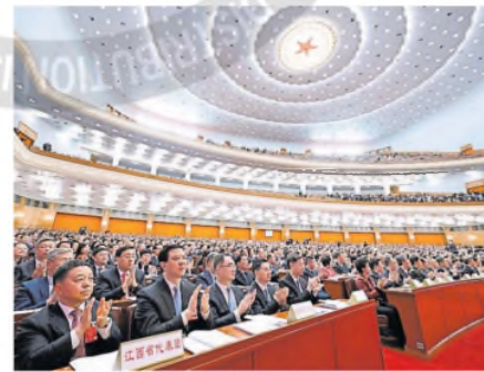
Los delegados comunistas, ayer, en Pekín