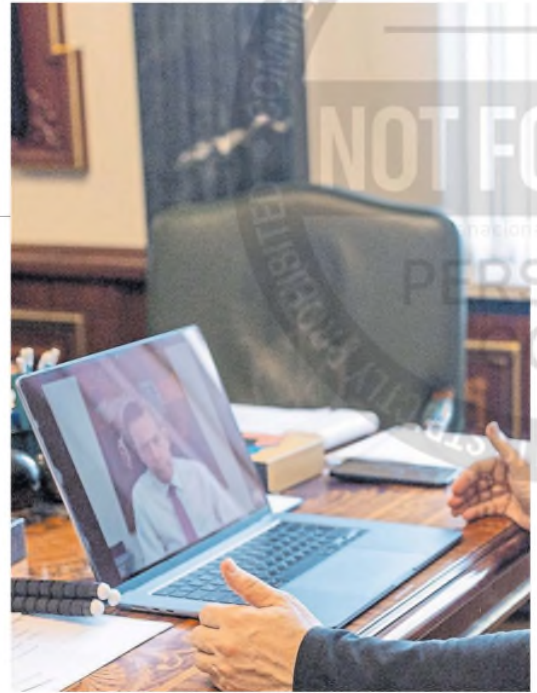
Zelensky dialogó ayer con el premier portugués, Luis Montenegro

Luego de la suspensión de la ayuda militar y de la inteligencia de Estados Unidos y del intercambio de gestos y el reseteo de la relación bilateral, Zelensky ahora se muestra mucho más proclive a discutir un punto final al conflicto, tal como quiere Trump. •