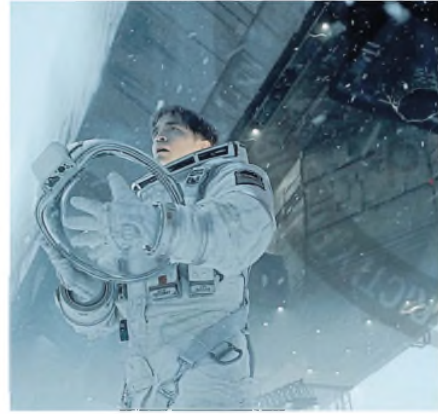
Pattinson en una de sus versiones de Mickey