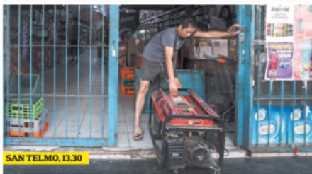
SAN TELMO, 13.30