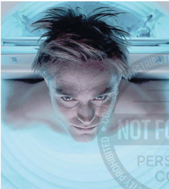
Pattinson interpreta a un humano en el espacio que es fotocopiado para seguir con vida

El actor británico es el protagonista del nuevo film del realizador surcoreano Bong Joon-ho, ganador de varios Oscar en 2020 por su película Parasite