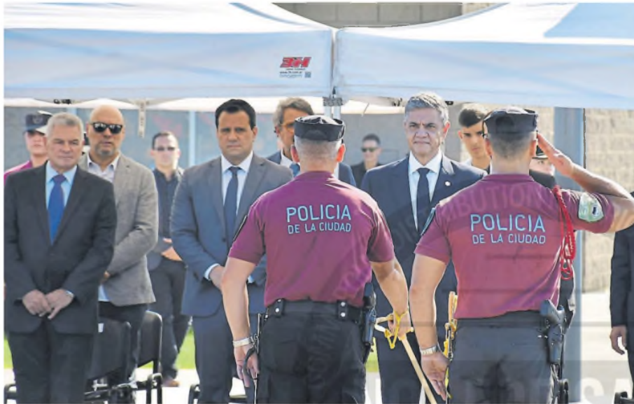
Jorge Macri encabezó ayer la ceremonia de inicio de clases en el instituto de formación de policías y bomberos

DECLARACIONES. Jorge y Mauricio Macri reclamaron el traslado a cárceles federales de 2434 detenidos y Patricia Bullrich respondió con duras críticas a la gestión porteña