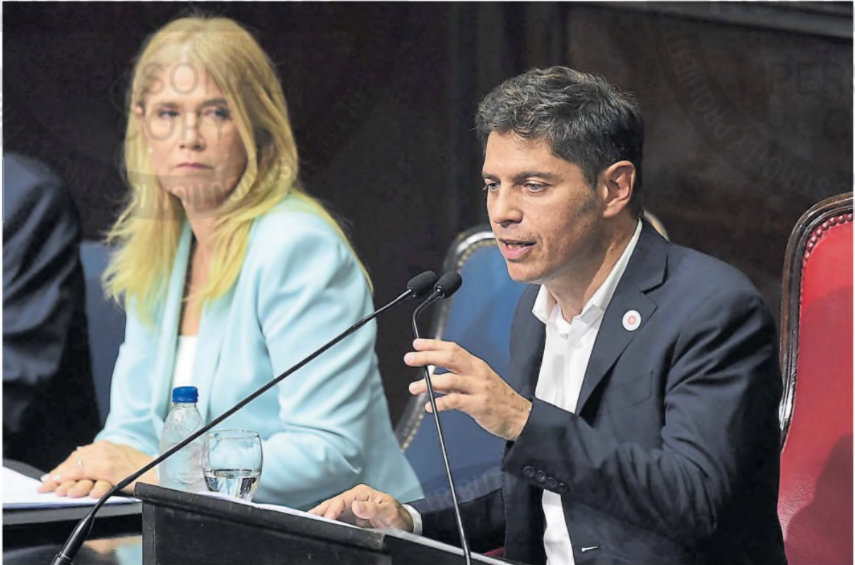
El gobernador Axel Kicillof, ayer, junto a la vice, Verónica Magario, en la Legislatura