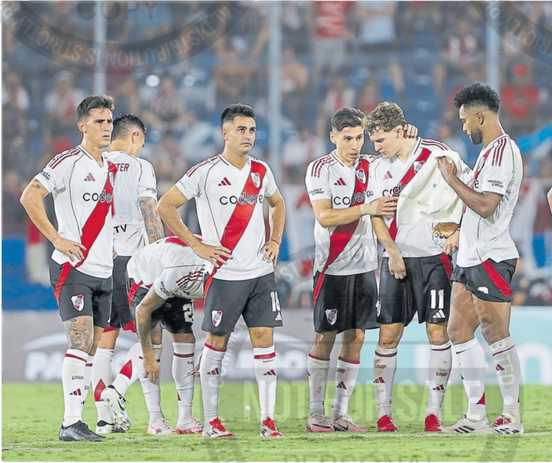
River perdió con Talleres en una electrizante definición por penales: Colidio tuvo la chance de ganar la Supercopa, pero falló su remate y le dio vida a los cordobeses