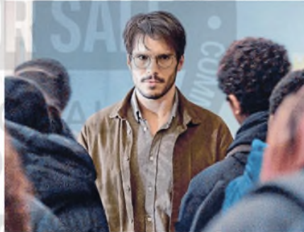
François Civil en una interpretación de alto voltaje