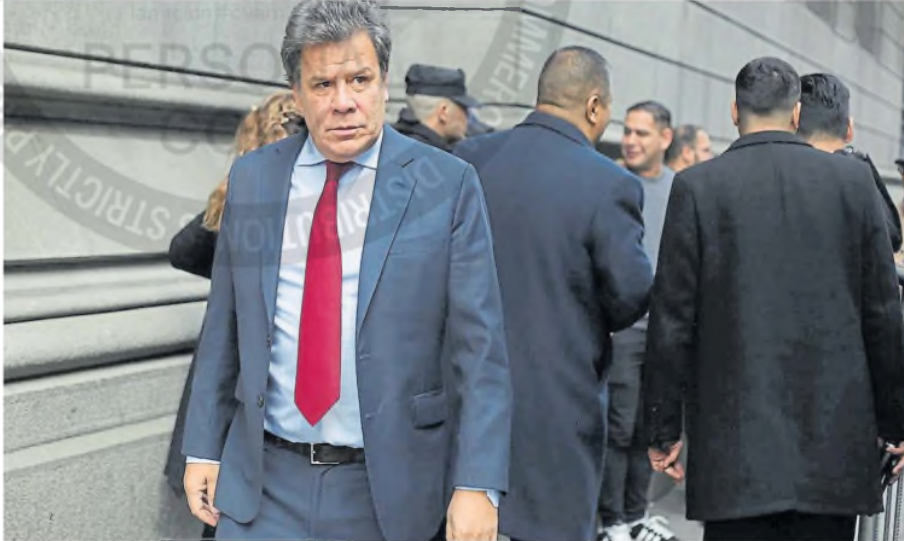
Facundo Manes, en la salida del Congreso

PRESENTACIÓN. El diputado acusó al asesor presidencial de haberlo increpado de forma “sorpresa y violenta”; pidió ser querellante en la causa; la jueza del caso es Capuchetti