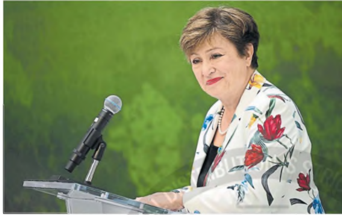
La directora del FMI, Kristalina Georgieva, el acuerdo con la Argentina, en su etapa final

En el Gobierno confirmaron a LA NACION además que lo que se enviará al Parlamento para ser debatido por los legisladores será la autorización para negociar un nuevo programa con el Fondo y no un staff level agreement (el acuerdo con los detalles técnicos). "Muy especialmente porque es deuda para cancelar deuda", contaron las fuentes oficiales. Esto porque los fondos que llegarán se usarán para comprar letras intrasferibles del Banco Central (BCRA) con el objetivo de sanear el balance de la entidad financiera y dar así más credibilidad al proceso de desinflación que impulsa el Gobierno. En el Ministerio de Economía, que dirige Luis Caputo, no confirmaron ni desmintieron la novedad. Allí solo se atuvieron a las declaraciones públicas que hizo el Presidente sobre el tema en el discurso de apertura de las sesiones ordinarias del Congreso el sábado. "Queremos anunciarles que en los próximos