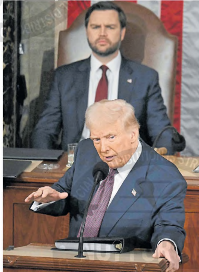
Trump, anteanoche, en el Capitolio