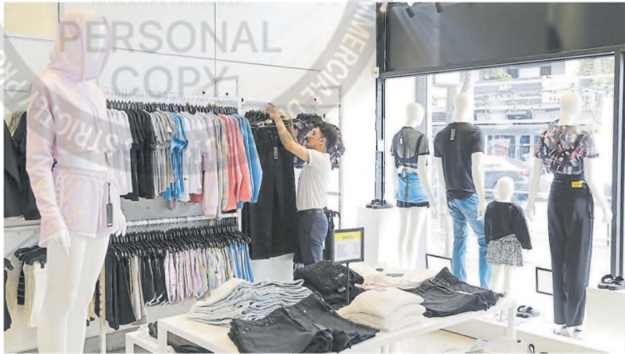
Los comercios pagan $70.000 millones al año para financiar un instituto de capacitación sectorial

DECRETO. Los convenios colectivos de trabajo ya no podrán imponer contribuciones de empleadores a organismos de las entidades; no se tocan beneficios similares de los gremios