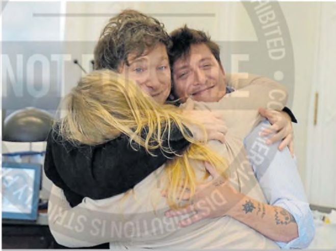
Karina Milei, el Presidente y Santiago Caputo