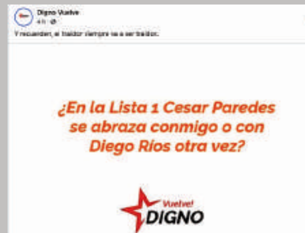
Va subiendo de tono las internas coloradas en Minga Guazú.