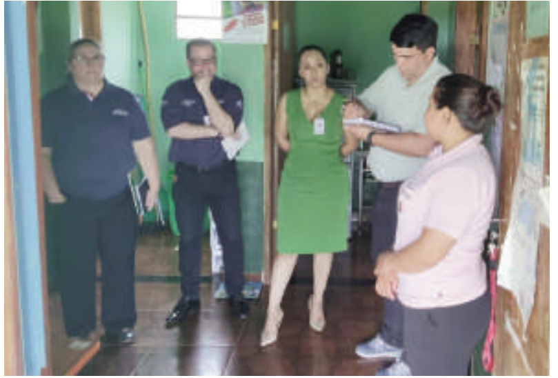
Visitaron todas las USF del distrito.