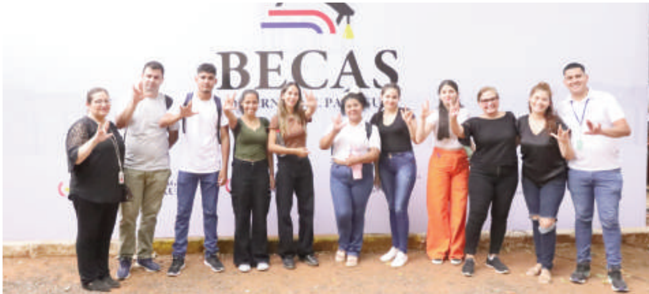
Los cupos para este grupo de estudiantes estarán disponibles incluso si se llegaron a adjudicar la totalidad de becas habilitadas en la presente convocatoria.

y tarde. En el transcurso de la jornada, además de las aulas exclusivas destinadas a los estudiantes con discapacidad, los mismos fueron acompañados por intérpretes en lengua de señas o acompañados por