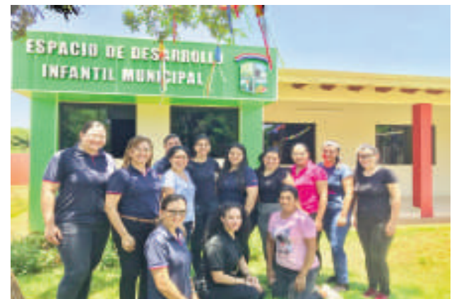
Las funcionarias en el EDI de Franco.