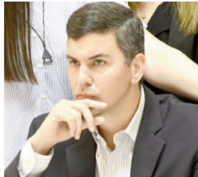
El presidente Santiago Peña sufre fuertes críticas, a raíz de su pésima gestión al frente del Gobierno.

El Programa Hambre Cero, una iniciativa destinada a erradicar la desnutrición infantil en Paraguay, en 2024 solo llegó a tres distritos del