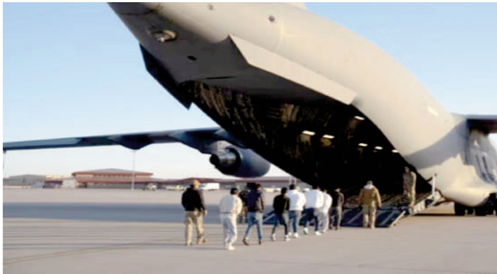
Ciudadanos deportados de Estados Unidos suben a un avión.

Como respuesta, el presidente estadounidense dispuso un aumento del 25% en los aranceles de Colombia, así como revocaciones de visa a funcionarios y otras medidas de represalia. El país cafetero también anunció medidas similares contra