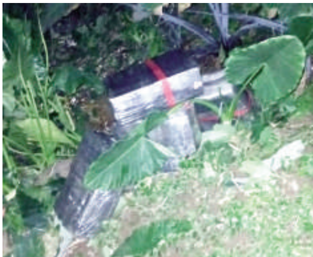
La droga fue hallada abandonada a orillas del río Paraná.

Las autoridades continúan las investigaciones para determinar el origen del cargamento y sus posibles responsables. Se espera que los resultados del análisis confirmen la naturaleza y el peso exacto del estupefaciente.