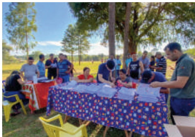
El proceso de firma se extenderá durante toda esta semana.

En este contexto, la Dirección Nacional de Catastro habilitó en el 2024 unas 23 colonias con 8.817 títulos de propiedad, que serán entregados este año y un número superior para el presente ejercicio, de modo de responder al reclamo constante de los ocupantes de tierras fiscales propiedad del INDERT.