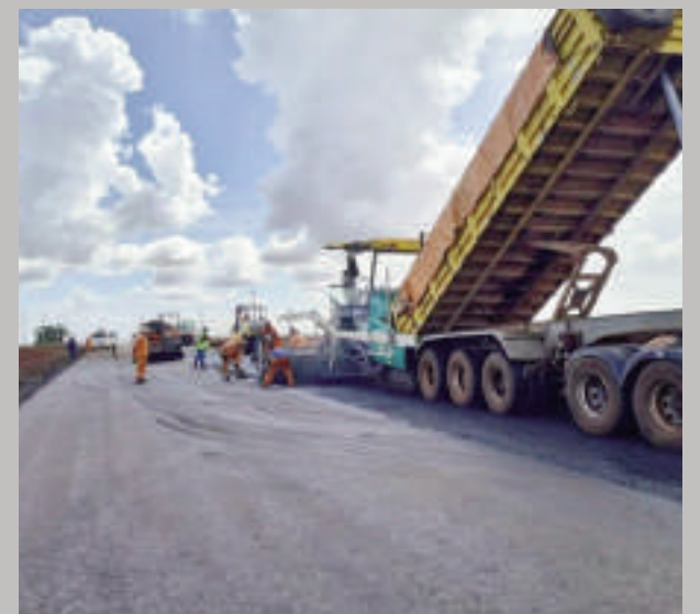
Aspecto de las obras realizadas en Mbaracayú.

Las obras abarcan un tramo total de 60,3 km y se ejecuta en dos lotes mediante un Contrato de Construcción y Mantenimiento de Carreteras por Niveles de Servicio (Ccoma). El Lote 1 se extiende desde el kilómetro 0 hasta el kilómetro 27, con fiscalización del Consorcio Grimaux - Electroconsult. Por otro lado, el Lote 2 cubre el tramo desde el kilómetro 27 hasta el kilómetro 60,3 en Puerto Indio, bajo la responsabilidad de LT SA., con fiscalización del Consorcio Tyspa - AII. Todas las labores son supervisadas por el MOPC.