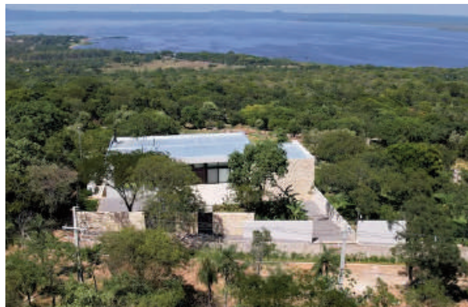
Lujosa mansión en San Bernardino, propiedad del jefe de Estado, quien "ya está mejor".

El contraste entre las promesas electorales y la realidad actual en el Alto Paraná pone de manifiesto una brecha cada vez más amplia entre el discurso oficial y las necesidades reales de la población. Mientras el patrimonio de las autoridades cercanas y del propio presidente Peña crece de manera exponencial, las obras y mejoras prometidas continúan en espera, generando un creciente descontento en uno de los departamentos más importantes del país.