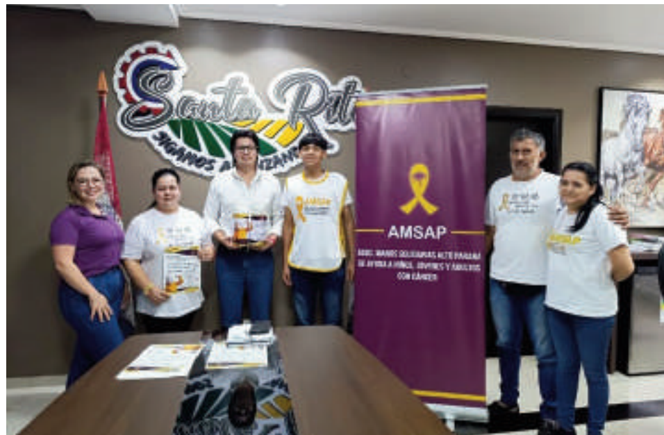
Santa Rita se suma a la colecta anual.

Eva Méndez aprovechó la ocasión para agrade-