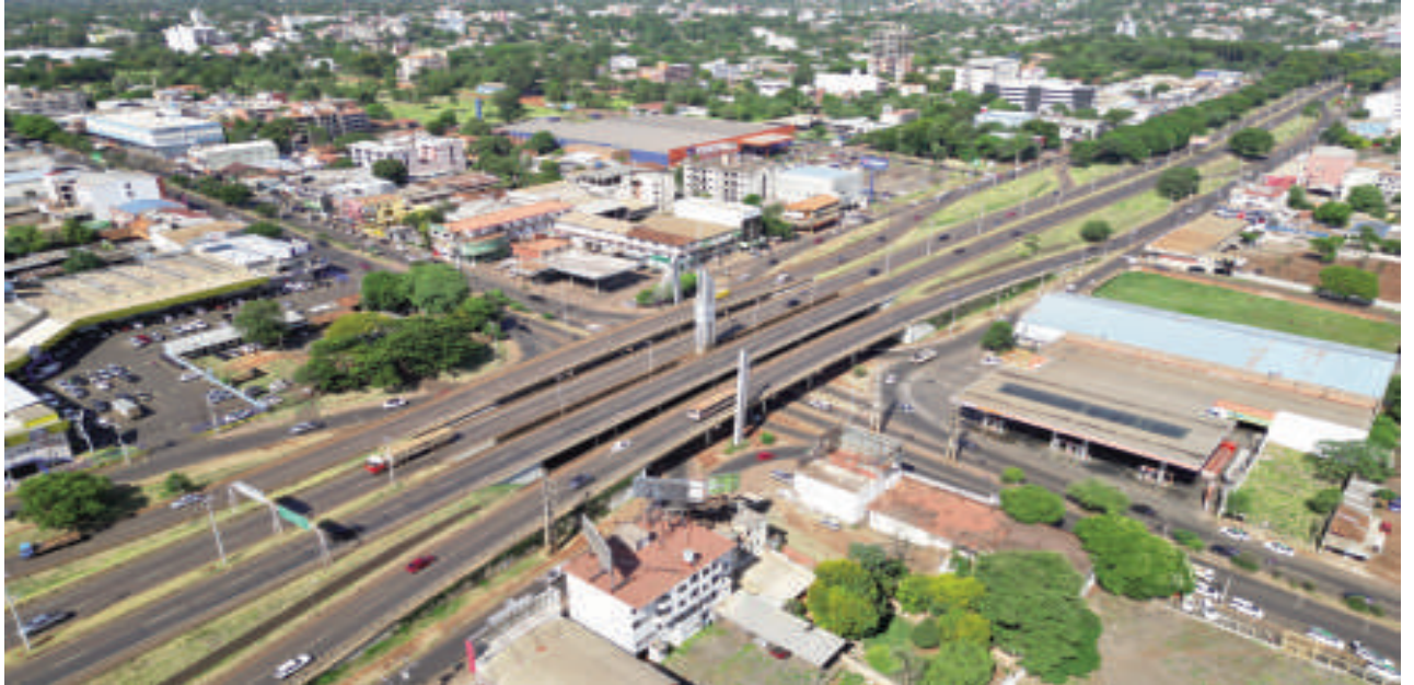
En la gráfica se observa el desarrollo de CDE.