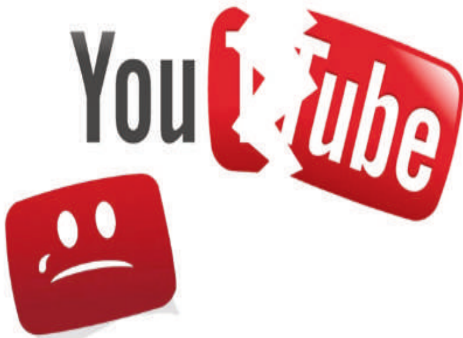
YouTube es una de las plataformas más utilizadas.

que, desde que comenzó a luchar contra el uso de bloqueadores de anuncios, como Adblock o AdGuard, en 2023, la plataforma de Google implementó anteriormente otras medidas para frenar el uso de este tipo de programas, como es el caso de ralentizar el funcionamiento la página en general, así como inyectar anuncios directamente en la transmisión de vídeos para que estos no se puedan bloquear.