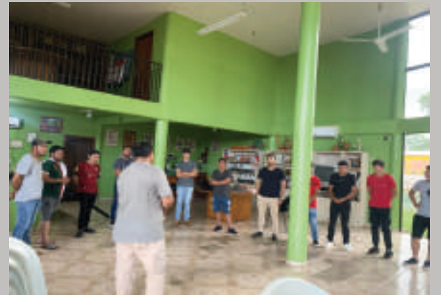
Jóvenes que se inscribieron ya iniciaron el curso en la comuna.

Al finalizar, los participantes estarán en condiciones de reparar y mantener equipos, lo que les permitirá acceder a un mercado laboral en constante crecimiento o incluso iniciar sus propios negocios.