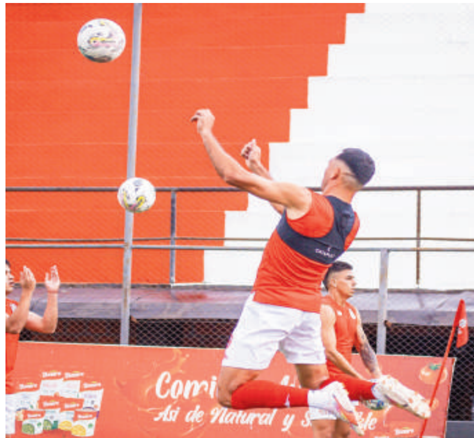
El conjunto mallorquino ya entrena de nuevo de cara a su segunda presentación en el Torneo Apertura.

Jueves 30 de enero: Sportivo Ameliano vs. Olimpia, Estadio: Luis Salinas, Horario: 20:30, Árbitro: Mario Díaz de Vivar, Asistentes: Eduardo Britos y Héctor Medina, Cuarto árbitro: César Rolón, VAR: Juan López, AVAR: Milciades Saldívar.