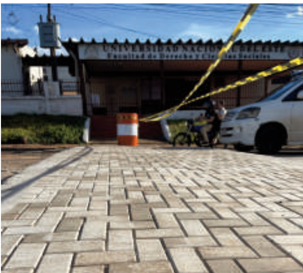
La construcción de lomadas se lleva a cabo para mejorar la seguridad y accesibilidad de personas frente a instituciones educativas y hospitales.

La Municipalidad de Ciudad del Este avanza en la construcción de cruces peatonales elevados diseñados para mejorar la seguridad y accesibilidad de las personas frente a instituciones educativas y hospitales. El proyecto, adjudicado mediante la licitación pública nacional N° 05/24 (ID 448671), tiene un monto total de G. 1.183.413.207 y contempla la construcción de 41 lomadas elevadas estratégicamente ubicadas.