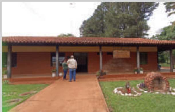
La Escuela Agrícola está ubicada en el km 30 de Minga Guazú.

El traslado abarca desde la rotonda ex-Oasis de Ciudad del Este hasta la Escuela Agrícola.