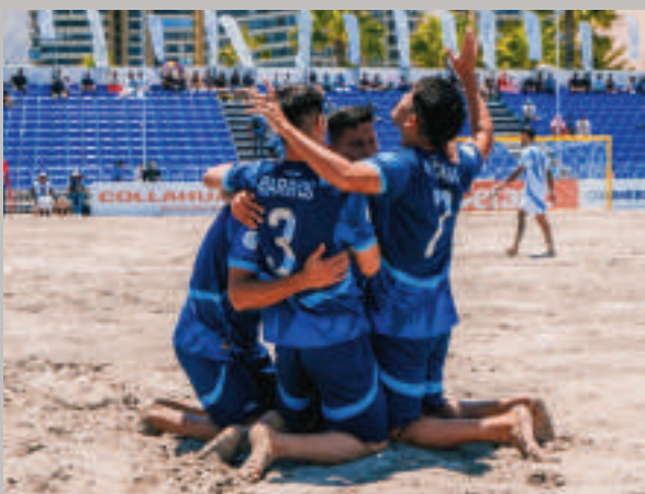
Paraguay derrotó a Argentina en la tercera fecha de la CONMEBOL Copa América Fútbol Playa 2025.