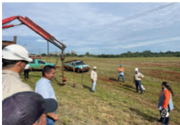
El trabajo está a cargo de técnicos de la estatal.

Además de la estabilidad y la calidad del servicio, el proyecto también busca aumentar la seguridad y eficiencia del tendido eléctrico. Los nuevos postes y conexiones cumplen con los más altos estándares de calidad, lo que reduce el riesgo de accidentes y averías.