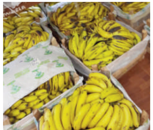
Sin refrigeración ni almacenamiento adecuado, las frutas proveídas por Copacabana y Fasv rápidamente se pudren, refrieron.