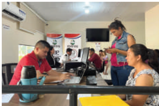
La primera feria del año se realizó el fin de semana.