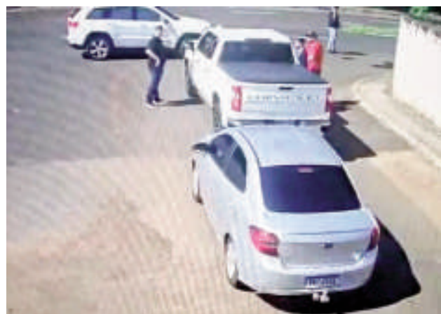
La captura de pantalla del video del procedimiento será presentada como evidencia del procedimiento irregular para una denuncia formal ante las autoridades paraguayas.

Un grave caso de secuestro irregular de vehículos pone en evidencia la existencia de una red mafiosa que