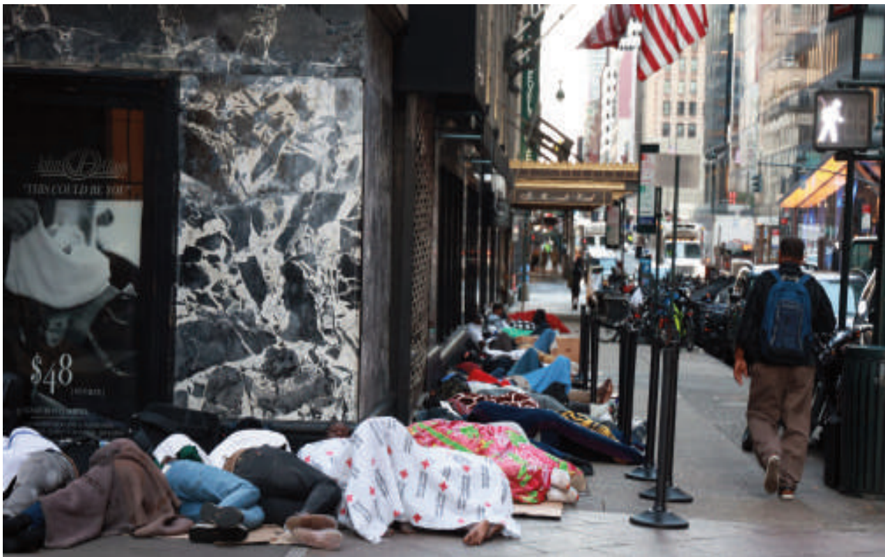
Miles de inmigrantes llegaron a Nueva York.

El domingo por la noche, el alcalde de Nueva York, Eric Adams, informó que el hotel dejará de ser-