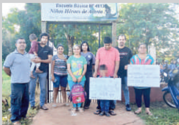
Un grupo de padres anunció ayer la toma de escuela en el km 12 y espera respuestas.

En el primer día del año lectivo, un grupo de padres del km 12,5 Acaray de Ciudad del Este tomó una escuela e impidió que se desarrollen las clases. La medida de protesta es por falta de respuesta del Ministerio de