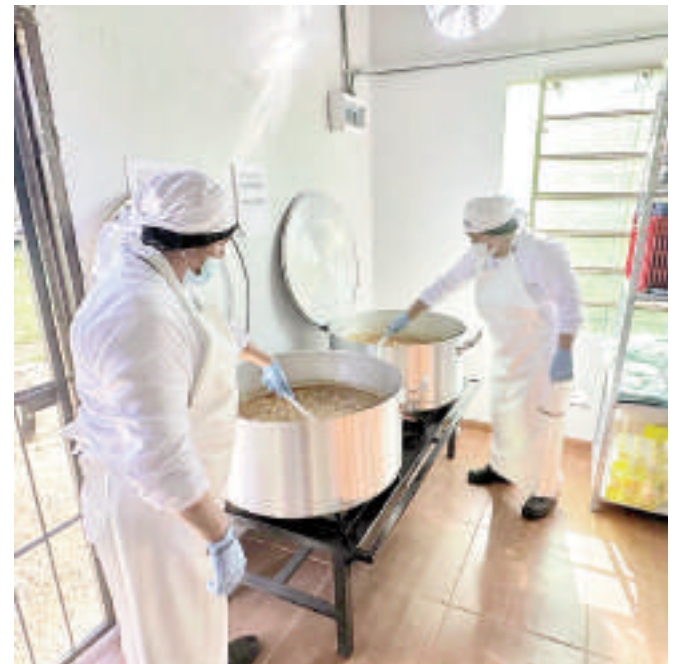
La empresa agrega profesionalismo, calidad e inocuidad en cada alimento servido en las instituciones educativas.

La llegada de Comepar a Ciudad del Este se da en el marco del Programa Hambre Cero, con el objetivo de aportar valor agregado al servicio de alimentación escolar.