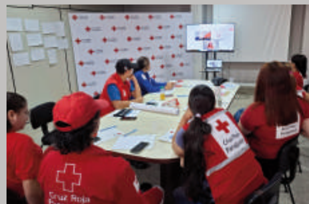
La capacitación se realiza en Asunción.

ticas de la Cruz Roja, y su labor es esencial para mantener la dignidad y el bienestar de las personas afectadas por situaciones de crisis. La capacitación de los voluntarios de Alto Paraná es un paso importante para fortalecer esta labor en la región.