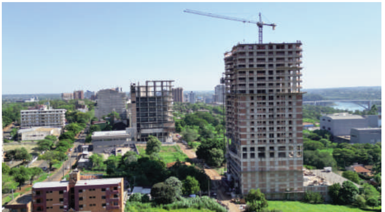
Vista aérea de un edificio en construcción en CDE.

En el 2022, el número de emprendimientos alcanzó los 26, de los cuales 20 fueron edificios de