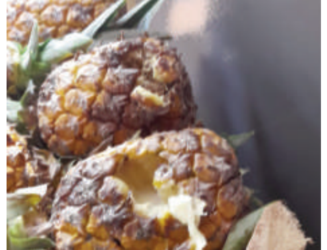
Las frutas enviadas a la Escuela Dr. Peña de Franco ya estaban parcialmente podridas, según denunciaron padres de familia.