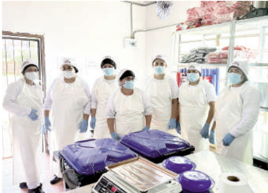
La llegada de Comepar a CDE se da en el marco del Programa Hambre Cero, con el objetivo de aportar valor agregado al servicio de alimentación de los niños.

Comepar, unidad del Grupo Comepar, inicia sus operaciones en Ciudad del Este, departamento de Alto Paraná, consolidando su compromiso con la alimentación saludable y segura para los estudiantes. A partir del 24 de febrero, la empresa brinda el servicio de almuerzo escolar en 18 instituciones educativas de la zona.