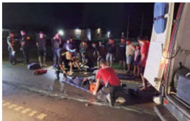
Intervención de paramédicos en el fatal percance.