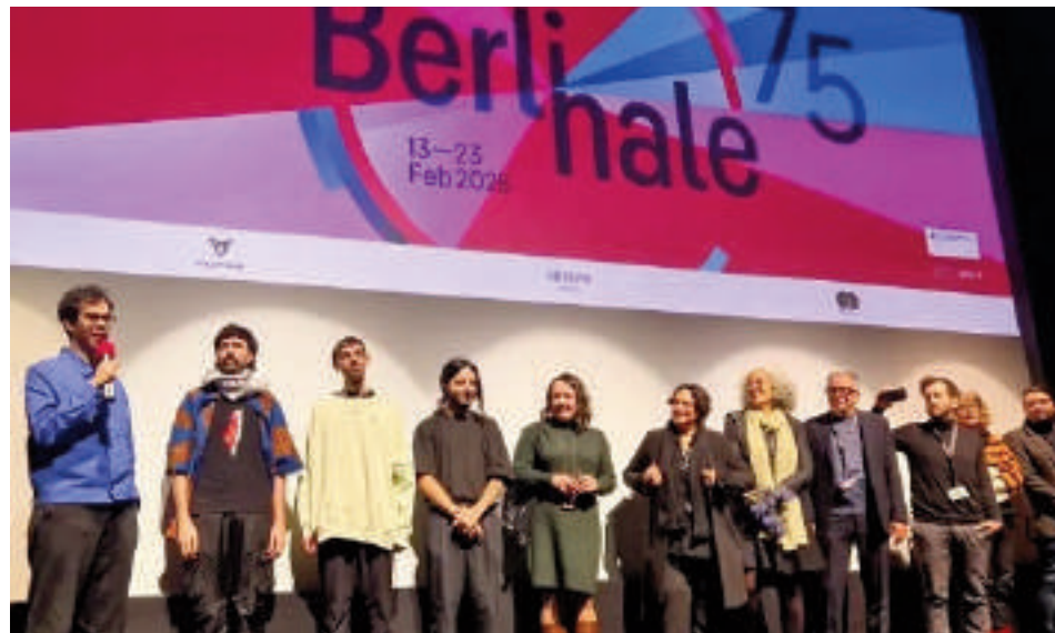
La película transcurre en Paraguay, entre 1954-1989

La película recorre este periodo cronológicamente, intentando analizar, aunque de manera superficial, cómo Stroessner y el Partido Colorado llegaron al poder con un método de manual, consistente en amenazas, fraudes electorales y legitimación del poder mediante el alarmismo sobre el comunismo. Todo ello avalado por la administración estadounidense y su política de control sobre América Latina, también conocida como Doctrina Monroe".