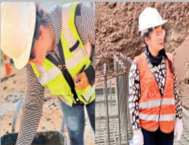
Las mujeres que forman parte de la construcción.

En el Día de la Mujer Paraguaya, celebrado ayer, se resaltó la participación femenina en la construcción del puente sobre el río Monday, proyecto que conectará Presidente Franco con Los Cedrales.