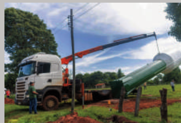
Momento de la llegada del tanque elevado.

El acceso a agua potable es un viejo reclamo no solo de estas dos comunidades, sino de tantas otras que están a la espera de seguir avanzando en el desarrollo de un sistema que les permita acceder de forma segura y permanente al vital líquido.