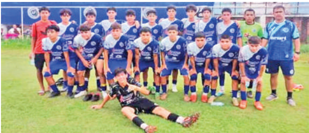
Plantel de la categoría 2007 de Alto Paraná, que obtuvo un importante triunfo en el torneo hernandariense.