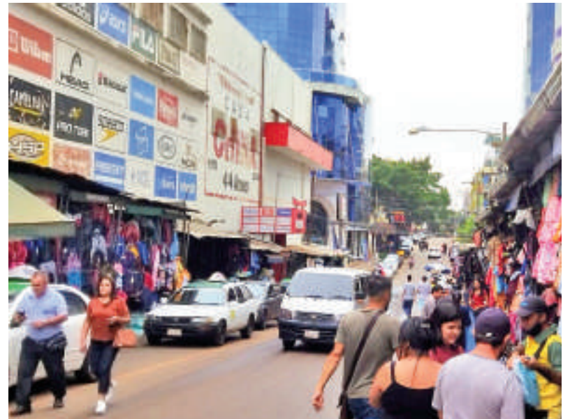
En octubre del 2020, el Gobierno dispuso la apertura de fronteras.

conecta Paraguay con Brasil, se convirtió en un símbolo de desolación. El bullicio diario en las tiendas de la capital departamental, repletas de turistas, se desvaneció. Hoteles, restaurantes y comercios en general, que antes reboaban de actividad, cerraron sus puertas.