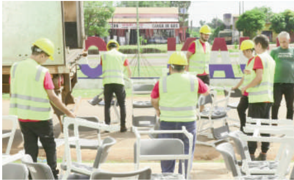
Los muebles ya están en el país y ya se inició su distribución en los distritos priorizados.

Los mobiliarios escolares antiguos serán reutilizados o reciclados según su estado. La inversión en mobiliario es la más grande en los últimos años, asegurando un impacto posi-