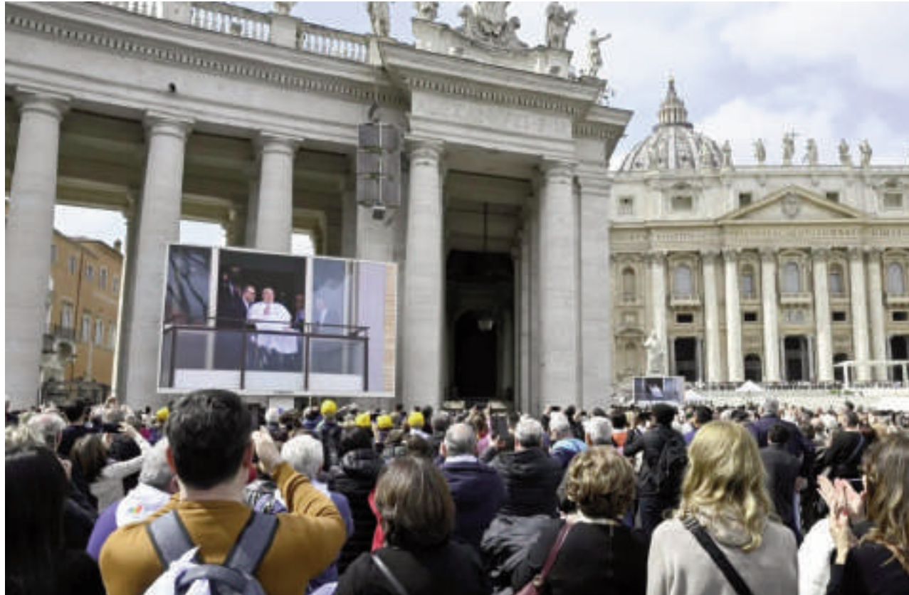
La Plaza de San Pedro del Vaticano se llenó este domingo de emoción y júbilo, cuando miles de fieles se congregaron para presenciar el saludo del papa Francisco.

Gritos de "¡Viva el papa!", aplausos y lágrimas se mezclaron en la Plaza de San Pedro cuando la imagen de Francisco apareció en las pantallas gigantes instaladas para los fieles. En silla de ruedas