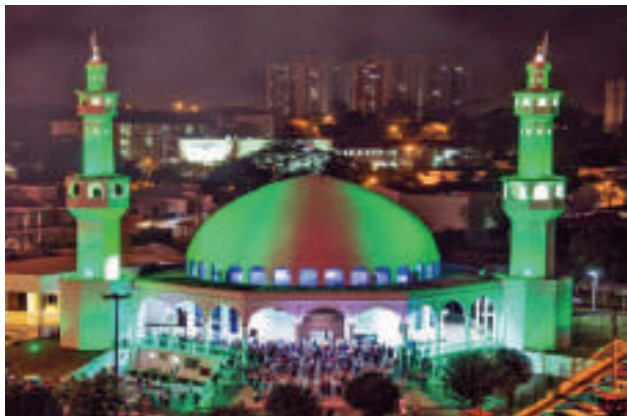
La región reunirá a delegaciones venidas de diversos puntos de Brasil.