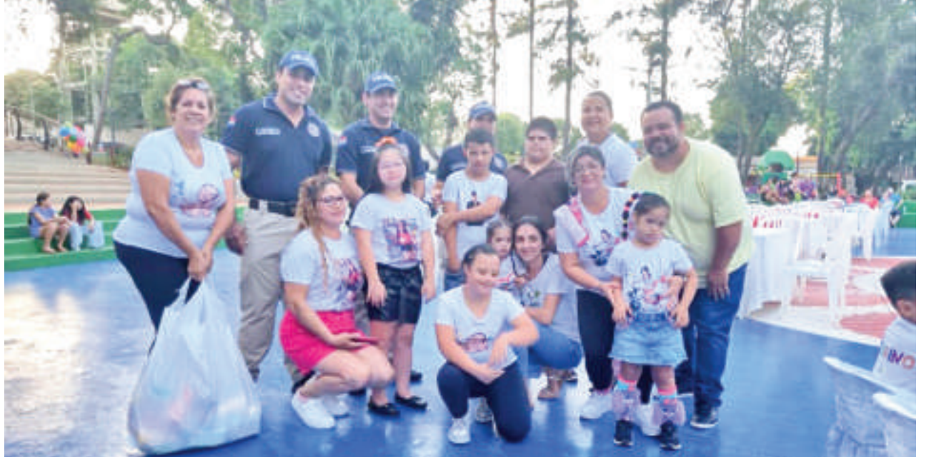
Compartieron una actividad el fin de semana último en Pdte. Franco.

Unas madres explicaron que APADOWN se formó hace nueve años en busca de conseguir más beneficios para sus hijos que sufren de síndrome de Down. Son especiales e indefensos que necesitan el apoyo de la sociedad y del Estado para sus tratamientos. Solicitan mayor consideración en los lugares de Estado y reconocen que son ignorados por ese derecho.