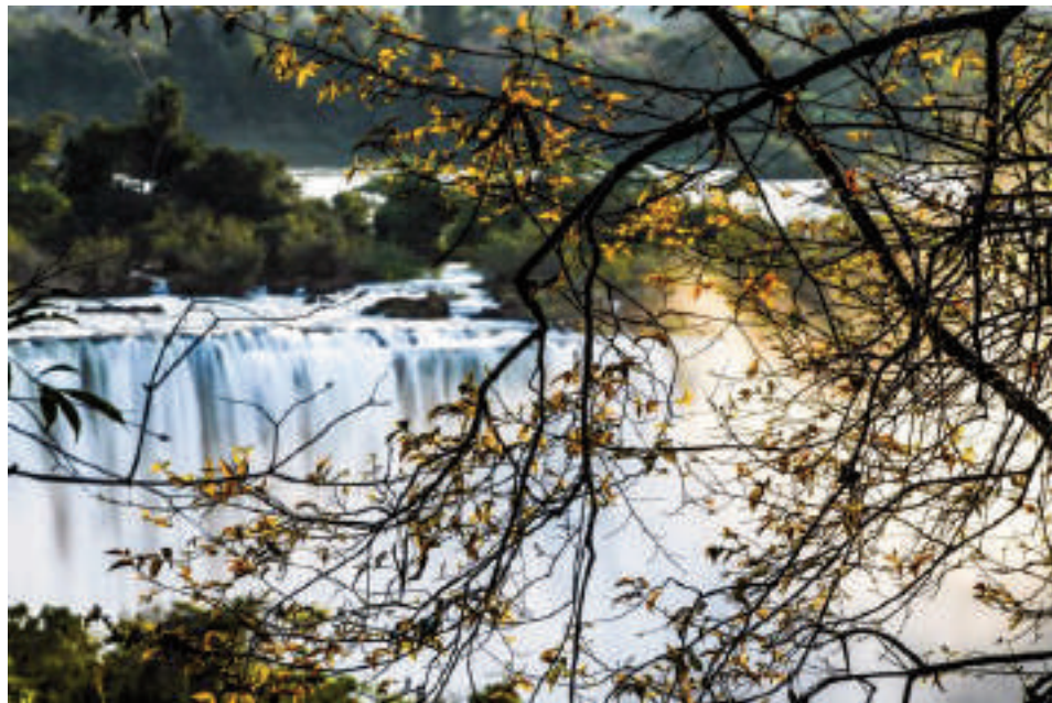
Visitantes disfrutan de una hermosa postal.

La llegada del otoño también trae consigo una oportunidad ideal para los amantes de la naturaleza y la fotografía. Con la disminución del número de visitantes tras la temporada de verano, las condiciones climáticas más amenas permiten recorrer los senderos con mayor tranquilidad.