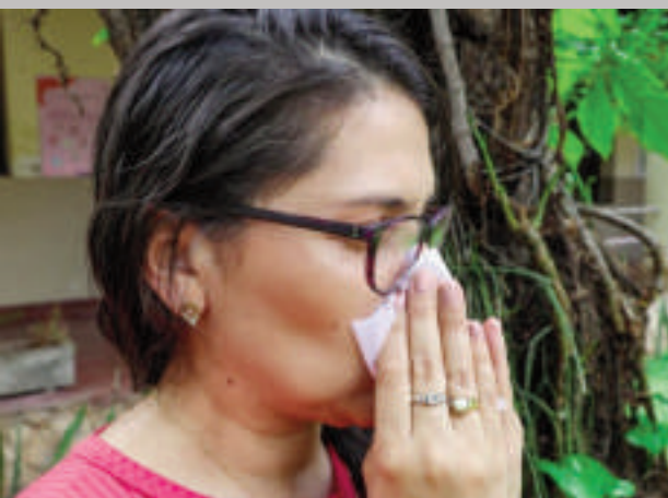
Ante la presencia de síntomas respiratorios como tos, dolor de garganta u otro, se recomienda tomar las medidas para su tratamiento y evitar contagio.

El Ministerio de Salud registró un crecimiento del 40 por ciento en consultas por síntomas respiratorios. Además, el porcentaje más alto de hospitalizados