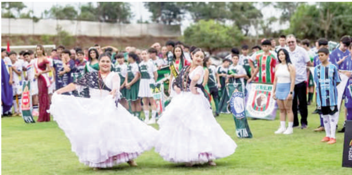
Aspecto de la jornada inaugural del torneo paranaense de fútbol mayores y juvenil.

Corrales, campeón vigente, Charleston, Acaraymí, Sol del Este, IW Sport, y 13 de Junio debutaron con triunfo en el torneo de la categoría mayores que organiza la Liga Deportiva Paranaense. En dos partidos se registraron empates. Todos en el marco de la primera fecha.