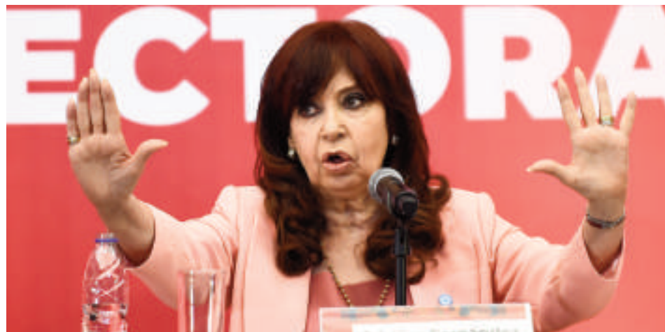
Cristina Fernández, expresidenta de Argentina.

Milei, a quien el presidente estadounidense, Donald Trump llama “amigo”, compartió el comunicado en la red social X. “Che, Cristina”, escribió en una burla por las usuales diatribas contra el Gobierno que escribe la expresidenta y que suelen comenzar con un “Che, Milei”.