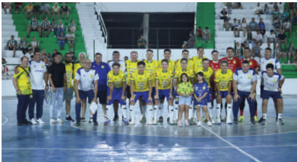
Plantel de Franco, que se impuso a Ypacaraí en el cierre de serie de amistosos.

La selección Presidente Franco superó de visitante 4-3 a Ypacaraí en su último partido amistoso de cara al campeonato nacional de fútbol de salón. El duelo tuvo como escenario el polideportivo Bicentenario de la ciudad de Ypacaraí, el viernes pasado. El conjunto franqueño se tomó la revancha, puesto que en el cotejo de ida había perdido de local 3-1.