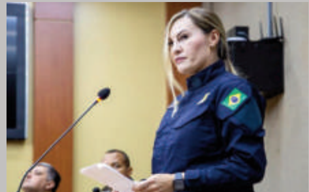
El acto se cumplió en la sede del legislativo de Foz de Yguazú.

Este logro refleja el trabajo y la dedicación de muchas policías que estuvieron antes que yo y que demostraron su capacidad para asumir grandes responsabilidades en igualdad de condiciones", expresó Regene.