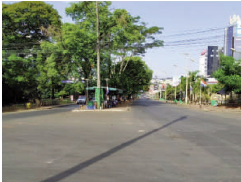
El microcentro estaba vacío por el cierre de fronteras.

Desde la segunda quincena de marzo hasta octubre de 2020, el Puente de la Amistad, arteria que