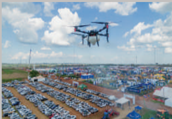
Cada año, el evento recibe a miles de visitantes.

La 7ª edición de la Feria Innovar atrajo a aproximadamente 25.000 visitantes y albergó a más de 300 expositores, del 18 al 21 de marzo en el predio de Cetapar, en Yguazú. A pesar de los desafíos que enfrenta el sector agropecuario, como la sequía y la baja en los precios de los granos, la expolgró generar un volumen significativo de negocios y expandir sus espacios para ofrecer mejores servicios, según informó la comisión organizadora.