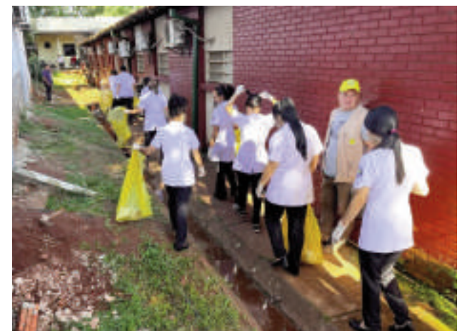
La actividad se realizó entre funcionarios de Salud, SENEPA y estudiantes.

Con el resultado obtenido se prevé realizar con frecuencia, al menos una vez a la semana, para mantener aislada cualquier posibilidad de contaminación de la enfermedad. El Hospital Regional es referencia de cabecera y se debe mantener libre de criaderos. Se insta a los usuarios y médicos de servicios que colaboren con la limpieza.