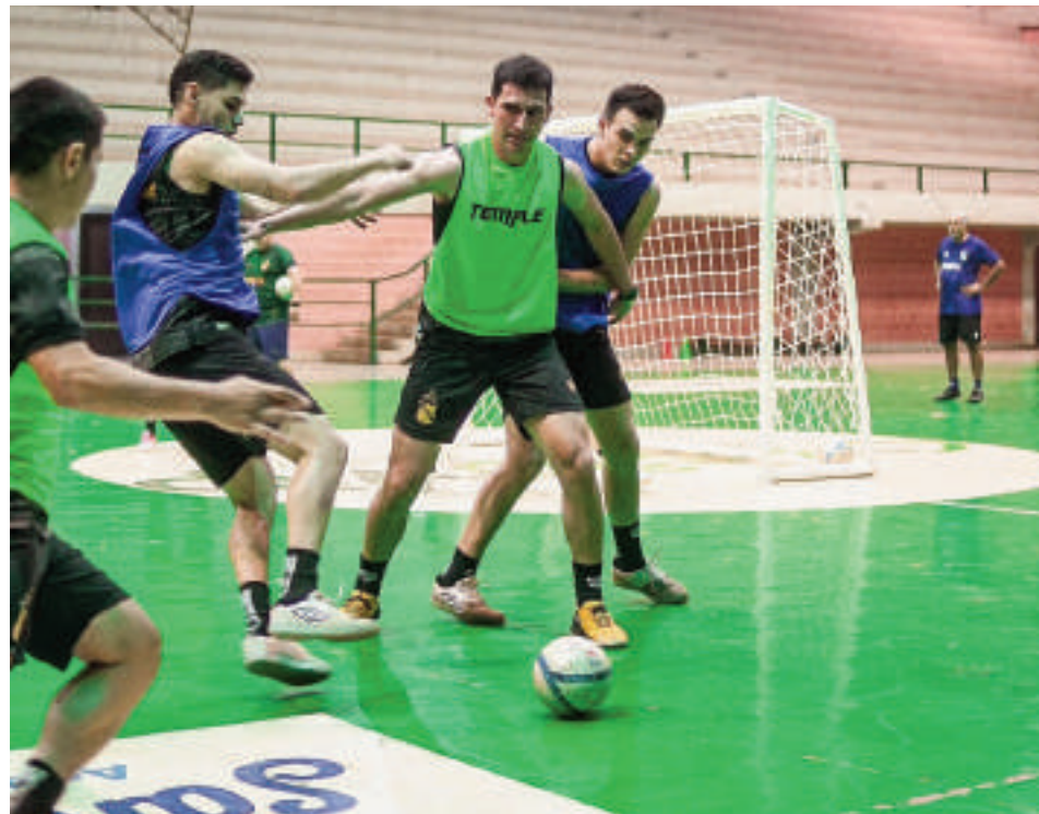
Los jugadores de Paranaense realizando práctica futbolística de cara al nacional de salonismo.

En los octavos de final, el primero del grupo A medirá al segundo de la serie B, y el primero de la serie C confrontará con el segundo de la llave A, los dos mejores del Grupo B, cruzarán con los del Grupo D.