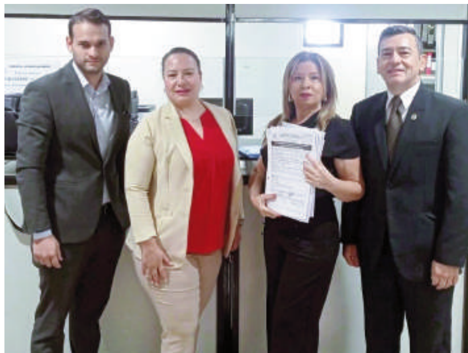
Representantes de la Comunidad Jurídica de Alto Paraná (COMJURAP), al momento de presentar la denuncia contra la cuestionada magistrada franqueña por excesiva morosidad.