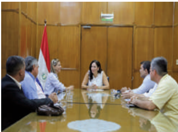
Durante la reunión de la semana pasada, la ministra Claudia Centurión anunció el cobro de peaje, a 500 metros del Puente de la Integración.

intendenta, presentó un proyecto de ley en el Congreso para exonerar a los ciudadanos de