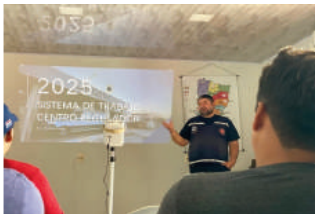
Las capacitaciones buscan mejorar el servicio a la comunidad.

Uno de los pilares de la capacitación es el conocimiento y la aplicación del sistema de trabajo y las normativas vigentes, incluyendo la resolución 93/2018. Esta resolución establece los lineamientos y protocolos que rigen el funcionamiento de los servicios de ambulancias, y su correcta aplicación es esencial para asegurar la calidad y la seguridad de la atención.