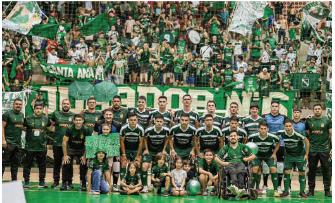
Plantel de Paranaense que se apresta para jugar en el selectivo de salonismo categoría mayores.

Paranaense, Franco, Minga Guazú y Hernandariense realizan los últimos ajustes para el inicio de las eliminatorias zona Este del campeonato nacional de fútbol de salón categoría mayores, que será mañana. El selectivo otorgará dos cupos para el certamen en el que competirán selecciones de diversos puntos del país.