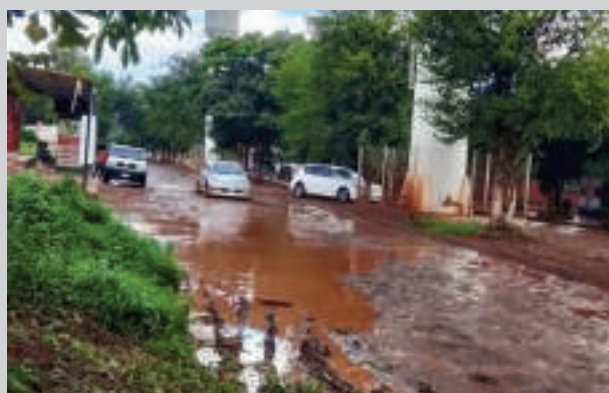
La avenida del km 14 Acaray se ve inundada en cada lluvia.

Los moradores de Minga Guazú, en la zona del km 14 Acaray, se sienten abandonados por el intendente, Diego Ríos. Las calles se inundan con cada lluvia y desde hace tiempo la Municipalidad no realiza limpieza para que el agua pueda drenar. Los afectados reclaman a través de las redes sociales y califican de "inútil" al jefe comunal.