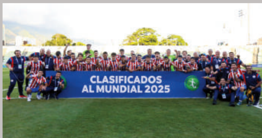
La Albirroja dirá presente por décima vez en la Copa Mundial Sub 20 de la FIFA.