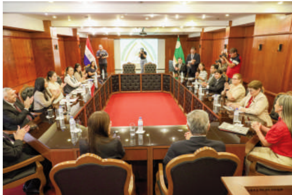
Reunión llevada a cabo en el Rectorado de la UNE. La intención es ayudar a educadores, trabajadores de distintas áreas, padres de familia y a la población toda

Vale remarcar que, además de esta colaboración con las instituciones educativas y sanitarias, Itaipu encara varias iniciativas en beneficio de la población con TEA. En setiembre de 2024 fue inaugurado el primer Espacio de Desarrollo Infantil para niños con Trastorno del Espectro Autista (TEA) en el hospi-