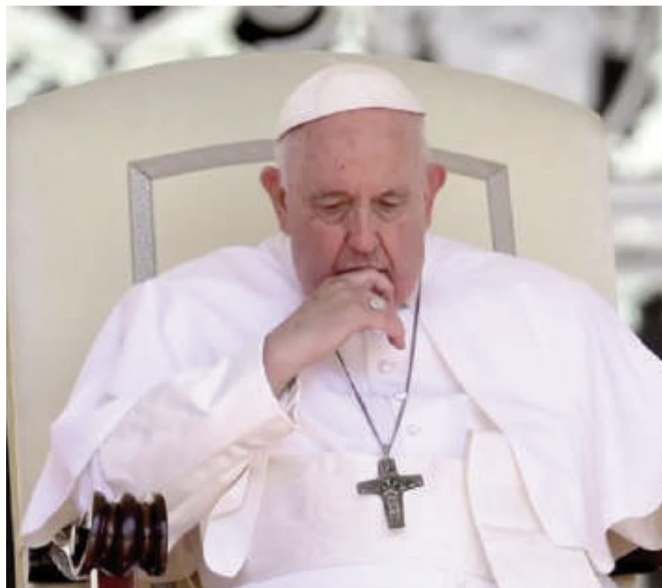
El papa Francisco también apeló al fin de las guerras a nivel mundial.

En el Ángelus, el papa quiso recordar el Jubileo "dedicado especialmente a los artistas que han venido de diversas partes del mundo" y agradeció la preparación del evento al Dicasterio para la Cultura y la Educación, cuyo prefecto es el cardenal