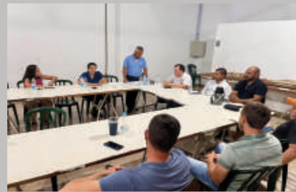
Momento de la comunicación de cierre.

Los estudiantes de la Escuela Básica n° 2220 "Los Lapachos" serán reubicados en instituciones cercanas, donde podrán continuar su educación. Sin embargo, esta transición no será fácil para los niños, quienes deberán adaptarse a un nuevo entorno, con nuevos compañeros y docentes.