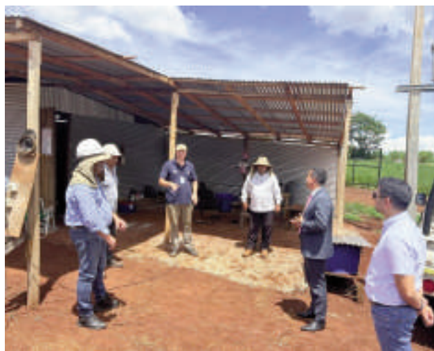
Verificación de los trabajos efectuada por representantes del Ministerio de Justicia y del PTI en la planta de tratamiento de agua potable para la cárcel del Minga Guazú.

Este organismo está presente en los 17 departamentos del país y en más de 60 ciudades, donde desarrollan capacitaciones en alianza con diferentes instituciones.