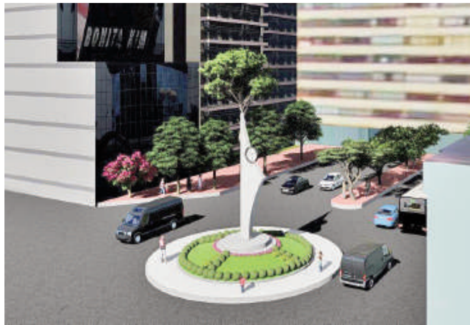
El nuevo reloj de la ciudad esta vez estará en la rotonda.

Actualmente, los trabajos de excavación para la base del monumento están en marcha, tras la realización de estudios de suelo y cálculos estructurales para garantizar su durabilidad