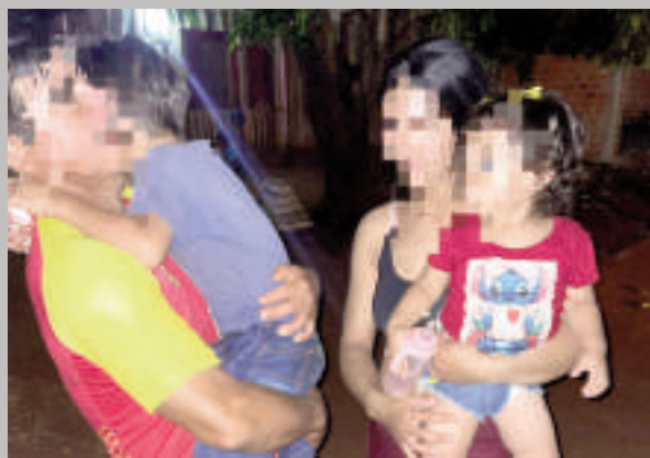
Los menores fueron rescatados anoche por la Policía y entregados a su madre.

Un hombre descontrolado irrumpió en la vivienda de su expareja, la agredió y se llevó por la fuerza a sus dos hijos menores. Antes de marcharse, lanzó una aterradora amenaza: "Voy a quemar tu casa y tirarme con los chicos al río". Afortunadamente, horas después, los pequeños fueron rescatados sanos y salvos.