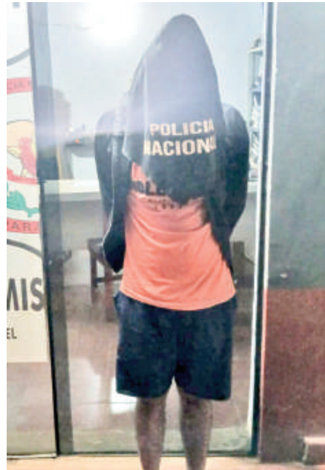
El detenido, puesto a cargo de la juez de garantías.

Fue presentado ante el órgano jurisdiccional con pedido de aplicación de medidas cautelares personales. Entre sus fundamentos, el fiscal Benítez mencionó al juzgado que el incoado es un peligroso adicto que acostumbra cometer hechos graves, por lo que resulta necesaria su prisión preventiva.