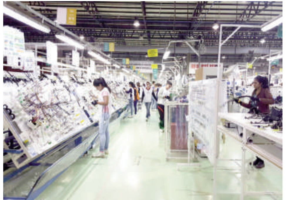
Muchas mujeres trabajan en las empresas maquiladoras.

Asimismo, las exportaciones de las industrias maquiladoras en enero de 2025 ascendieron a USD 100 millones, reflejando un incremento del 34% en comparación con el mismo periodo del año anterior. Este desempeño positivo muestra la capacidad del sector para generar valor agregado y contribuir a la balanza comercial del país, informó el Ministerio de Industria y Comercio (MIC). La balanza comercial de las industrias maquiladoras en enero de 2025 fue positiva, con las exportaciones superando a