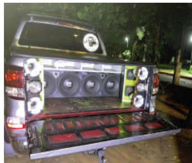
En la imagen se observa la carrocera de la camioneta repleta de parlantes de alta potencia.