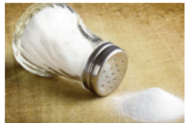
La sal o sodio es un mineral que se debe medir su consumo.

za la importancia de recordar sobre los riesgos en el cuerpo por el alto consumo de sal en la dieta diaria. Recomiendan utilizar gotas de limón para ayudar a darle el toque de sabor a los alimentos y no abusar con la sal. Además, se debe adoptar la costumbre de prepararse el propio alimento para controlar el consumo de este mineral. El efecto que se consigue en la salud es increíble y por eso insisten en ponerla en práctica.