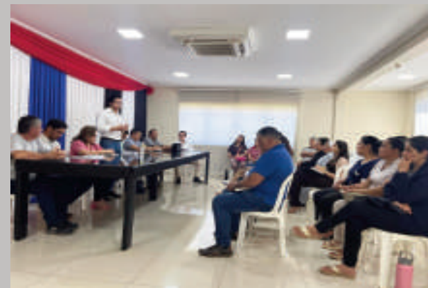
Reunión de trabajo en la Municipalidad.

abordó en la reunión fue la implementación del programa nacional Hambre Cero en las instituciones educativas del municipio. El intendente destacó la importancia de coordinar esfuerzos para garantizar que este programa llegue a todos los estudiantes que lo necesitan.