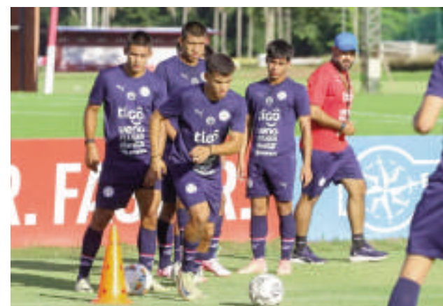
Entrenamiento de la selección paraguaya Sub 17.

exterior, recordando que para ambos lanzes la entrada será libre y gratuita.