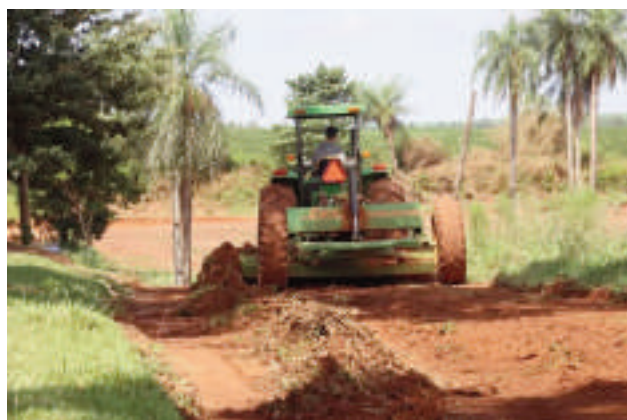
Maquinarias en pleno trabajo.

El camino, que por años se encontraba en condiciones precarias, dificultando el tránsito de vehículos y el acceso a servicios básicos, ahora está siendo ampliado y mejorado. Esta obra no solo facilitará el transporte de personas y productos, sino que también mejorará la seguridad vial y reducirá los tiempos de viaje. Además de la ampliación del camino, la Municipalidad también está llevando a cabo arreglos en diversos tramos que se encontraban deteriorados. Estas mejoras incluyen la reparación de baches, el nivelado de la calzada y la construcción de cunetas para el drenaje del agua.