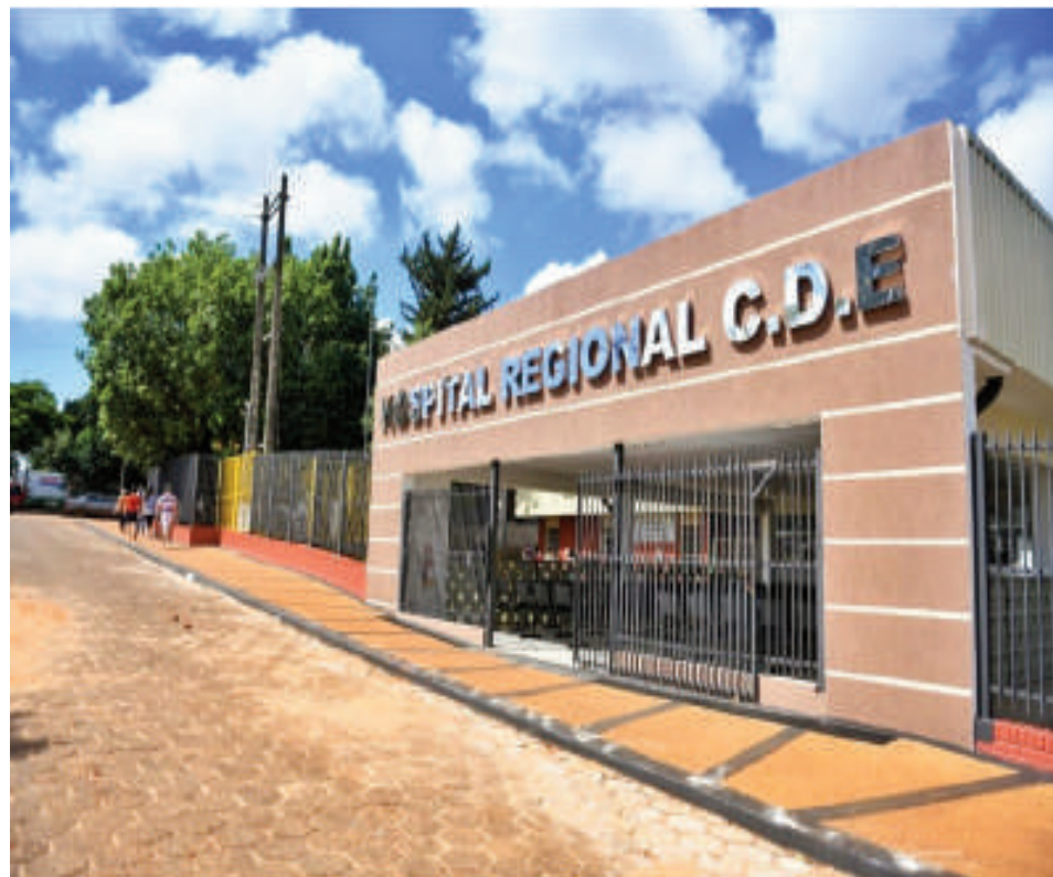
Hospital Regional de Ciudad del Este.

Finalmente, el especialista llamó a la población a reforzar la prevención y acudir a la vacunación infantil, recordando que la inmunización contra la tosferina se aplica en el esquema regular desde los primeros meses de vida.