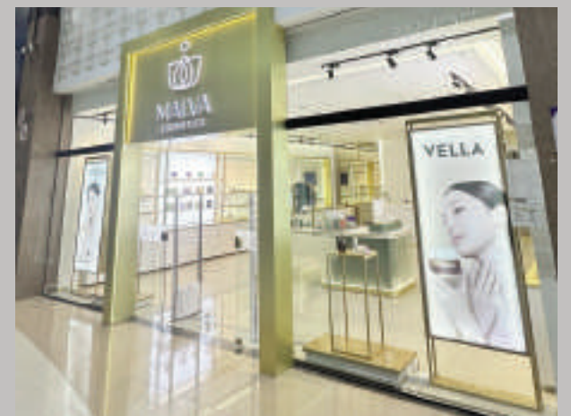
Local de Malva Cosmetics situado en el Shopping del Este. La marca apuesta por la innovación tecnológica para ofrecer productos certificados que garantizan resultados efectivos para cada tipo de piel.

Con esta sólida propuesta, Malva Cosmetics reafirma su compromiso de brindar lo mejor del cuidado facial coreano a los clientes paraguayos, ahora con una experiencia exclusiva en el Shopping del Este.