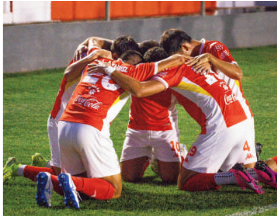
El grupo de jugadores del elenco mallorquino hizo este festejo tras uno de los goles.