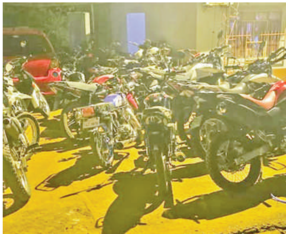
Las motocicletas incautadas quedaron en el patio de la comisaría 2ª del barrio Ciudad Nueva de Ciudad del Este.

Las 11 motos incautadas fueron trasladadas a la base de la comisaría 2ª del barrio Ciudad Nueva y todos los casos fueron comunicados al Ministerio Público.