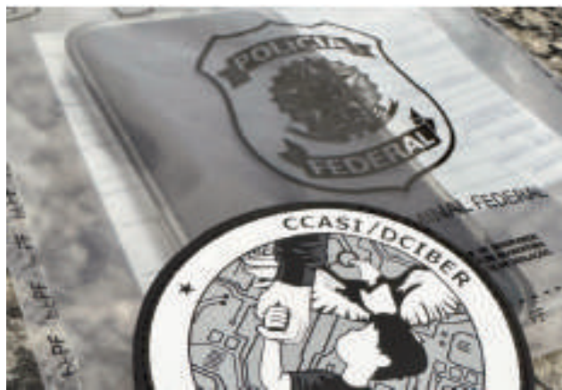
Dos allanamientos se realizaron por mandato judicial.

En una de las viviendas allanadas, los agentes federales descubrieron decenas de archivos explícitos que confirmaron los peores temores. Allí mismo, se identificó al responsable del almacenamiento, quien fue detenido en flagrante delito. El individuo, cuyo nombre no fue revelado, fue trasladado a una unidad policial, donde se le aplicaron los procedimientos legales correspondientes.