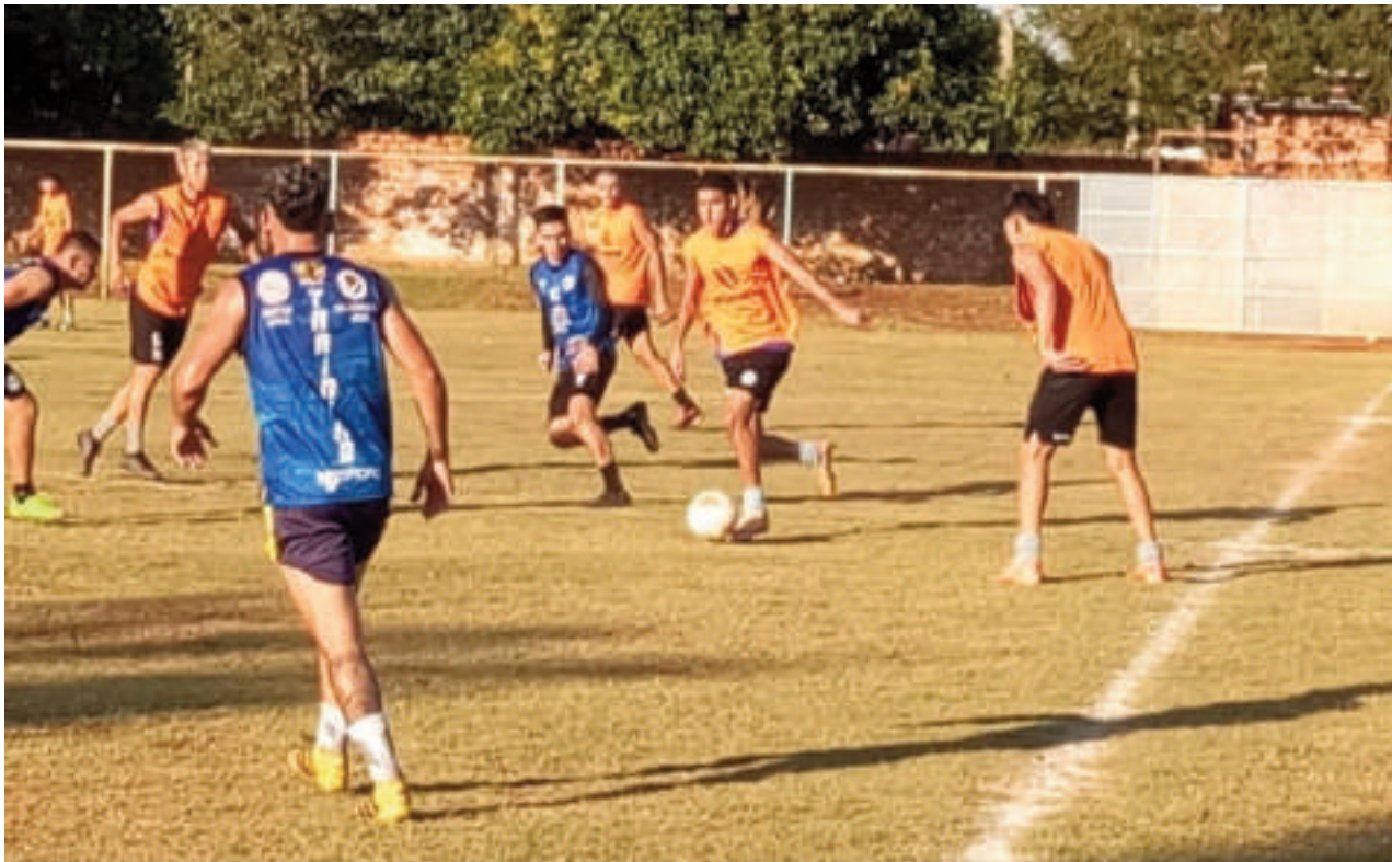
Práctica de los jugadores del 4 de Octubre de Hemandarias.

En este sentido, el equipo se encuentra a la espera de la decisión final del Tribunal de Justicia