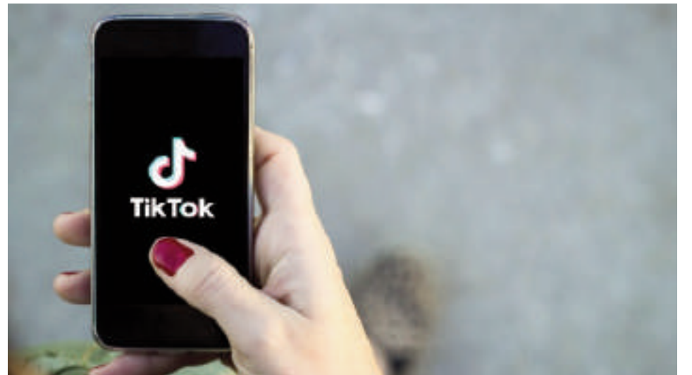
La aplicación de videos cortos es una de las más utilizadas en la actualidad.

Muchos de los usuarios estadounidenses que se mudaron a Xiaohongshu declararon no mostrar preocupación por el manejo de sus datos personales por parte de compañías chinas, el principal argumento por el cual la plataforma de videos de ByteDance enfrenta la prohibición de Washington, que entrará en vigor el 19 de enero salvo una intervención del Tribunal