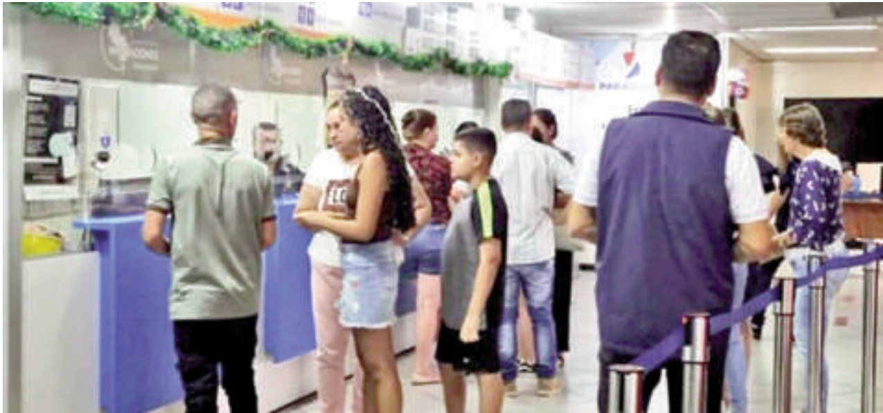
El movimiento en la aduana brasileras es intenso en esta época del año.

Muchos paraguayos expresaron su frustración tras pasar por la aduana del Puente de la Amistad al regresar de unas vacaciones familiares, debido a