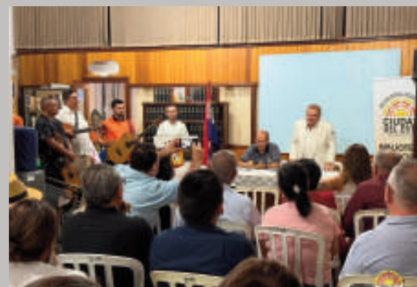
La presentación del nuevo libro se realizó en la Biblioteca Municipal.

importancia de rescatar y difundir la obra de poetas como Jiménez, quienes han enriquecido el patrimonio cultural de nuestro país. La presentación contó con la participación de invitados especiales y amantes de la poesía, escritores y amigos del autor.