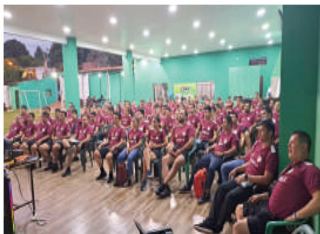
Varios árbitros participaron en la jornada de capacitación que fue exitosa.

fortalecer la preparación de los árbitros, proporcionándoles acceso a los nuevos contenidos y recursos derivados de las modificaciones en las reglas de juego para el 2025. A través de esta capacitación, los árbitros pudieron profundizar en los cambios que regirán el fútbol en la próxima temporada, con el fin de asegurar una correcta aplicación de las normas en los partidos que supervisen. Bajo la dirección del instructor Cristhian Lacour, los participantes recibieron conocimientos actualizados, destacándose el compromiso y el entusiasmo de cada uno de ellos por seguir perfeccionando su labor en el campo. Esta jornada de formación es parte del constante esfuerzo del Círculo Paranaense por mantener un alto estándar de calidad en el arbitraje, asegurando que los árbitros de la región estén preparados para afrontar los desafíos que trae consigo la nueva temporada del fútbol.