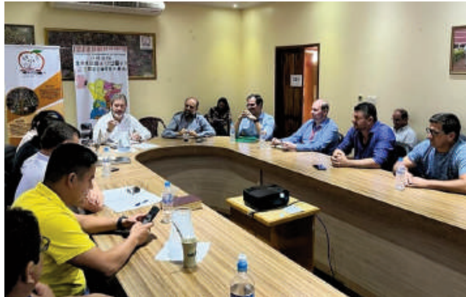
Aún no hay fecha de la primera reunión del año de la AMUALPA.

jurídico, la ley ha generado preocupación entre los ciudadanos. Empresas de transporte, por ejemplo, consideran que el sistema