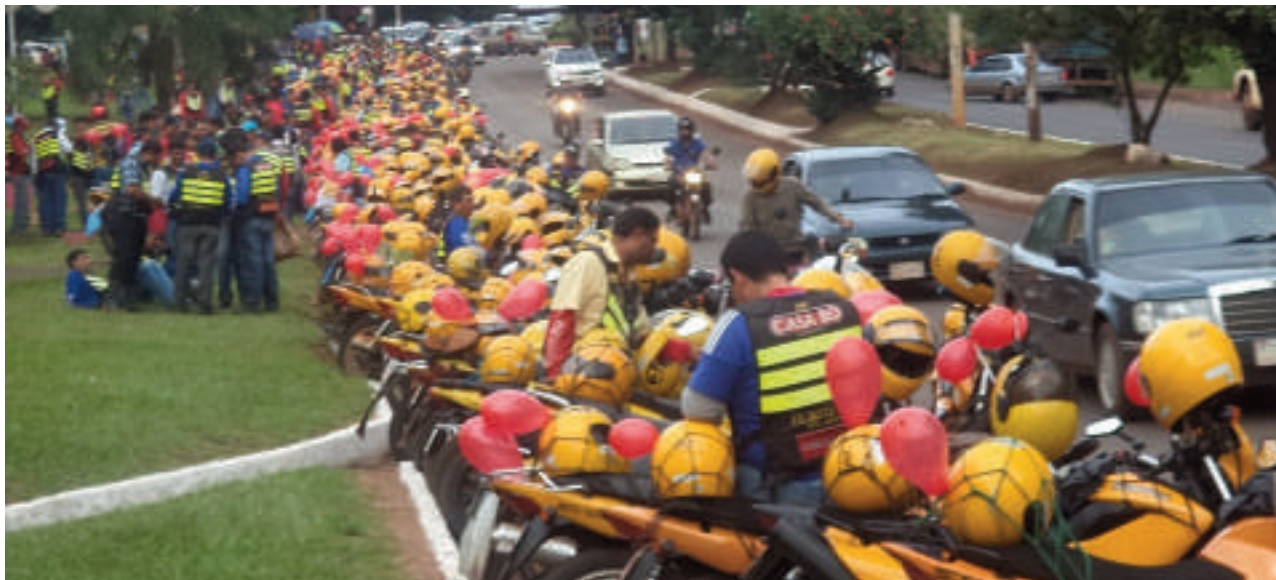
Mototaxistas se expresan en las redes sociales; los mismos se consideran perjudicados y lesionados en sus derechos y exigen a sus representantes tomar medidas.

El conflicto entre mototaxistas y conductores de plataformas, conocidos como motobolt, sube de tono en Ciudad del Este, generando tensión entre ambos sectores. El problema suscita preocupación entre la ciudadanía, ya que persisten temores de que esta situación pueda derivar en enfrentamientos e incluso derramamiento de sangre, especialmente si no se logra una solución regulatoria que equilibre la competencia. El debate sobre la reglamentación de los motobolt llegará pronto a la Junta Municipal, en lo que podría convertirse en un punto de inflexión para este lío.