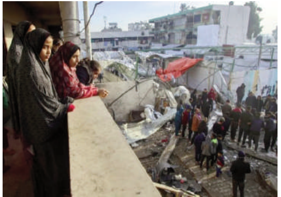
Las conversaciones se celebraron en Doha y fueron impulsadas por Catar, Estados Unidos y Egipto.

Desde que empezó la guerra sólo se había logrado una tregua, de una semana, a finales de noviembre de 2023. Y pese