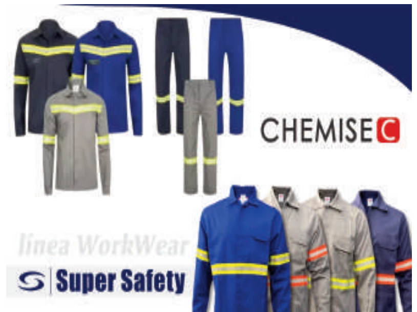
La línea de prendas de vestir antillamas que lanzó Chemise.

principal producto es una innovadora tela antillamas utilizada para la confección de diversos tipos de prendas destinadas al ambiente laboral, principalmente en el estilo workwear. Para 2025, hemos establecido como principal mercado objetivo a Brasil, país con gran demanda en el sector industrial", señaló.