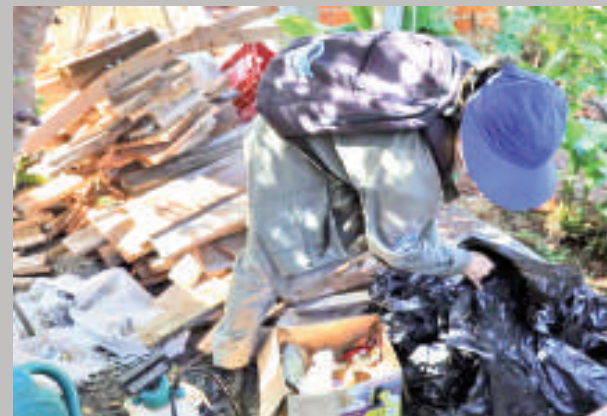
De nuevo el dengue asecha en la frontera.

DENV-4. La infección por uno de estos serotipos genera inmunidad específica únicamente para ese tipo, pero no protege contra los demás. Por esta razón, una persona puede contraer dengue varias veces, y una infección secundaria con un serotipo distinto puede resultar en una enfermedad más grave.