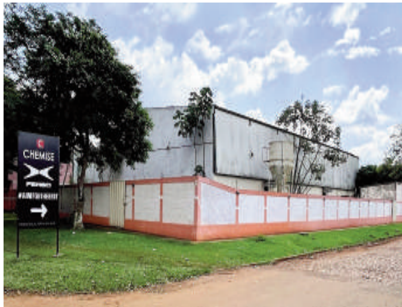
Unas 150 personas trabajan en la planta fabril.