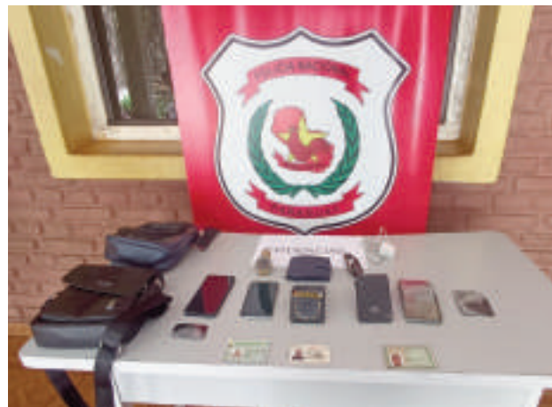
Del poder de los mismos los intervinientes incautaron teléfonos celulares, dos de ellos fueron destruidos para evitar que se pueda ver lo que había en ellos.

Agentes de Inteligencia y del Comando Tripartito tomaron intervención en el caso y procedieron a solicitar informes a sus pares del Brasil para conocer la situación de cada uno en el