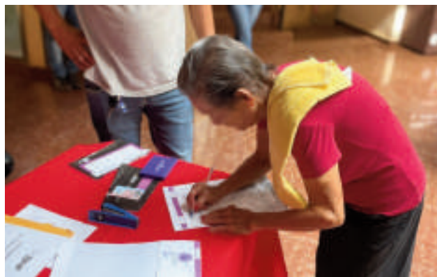
La entrega de la tarjeta se realizó en la sede comunal.

Los beneficiarios destacaron la importancia de este programa para los adultos mayores de escasos recursos. Consideran que con esta ayuda mensual, podrán mejorar su calidad de vida y tener una vejez más tranquila. En contrapartida, son muchos aún lo adultos mayores que siguen esperando ser beneficiados con esta tarjeta.