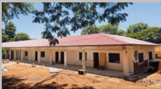
Una de las escuelas donde la Municipalidad ejecuta obras antes del inicio de clases en este 2025.

La Municipalidad de Ciudad del Este tiene previsto inaugurar un amplio conjunto de obras en diversas ins-