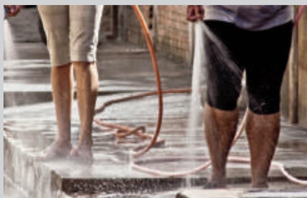
El uso del agua debe ser consciente para evitar la escasez.

En los últimos días se reportó falta de agua en el barrio Remansito de CDE y zonas de Pdte. Franco. Instan desde ahora a no regar las plantas o lavar el auto, desde los servicios. Tampoco llenar las piscinas de la casa o lavaderos, sino tratar de buscar otros recursos que no sean agua potable para desperdicios.