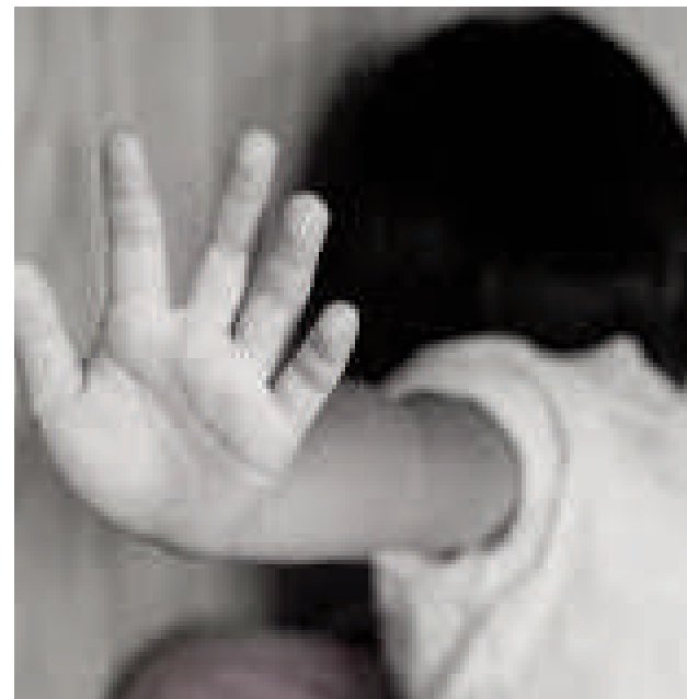
La imagen corresponde a una niña abusada. (Ilustración)

En ambos casos, la Fiscalía solicitó la declaración de rebeldía de los procesados, ya que se encuentran prófugos de la justicia, según el escrito fiscal elevado al juzgado.