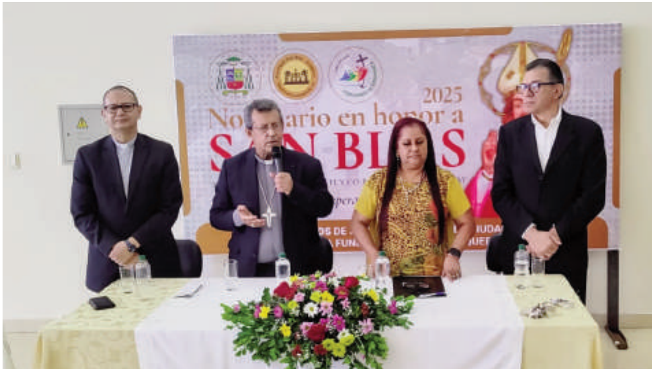
El lanzamiento se realizó ayer en el salón parroquial de la Catedral San Blas.

Collar. Las misas serán a las 19:00 hasta el 2 de febrero. Durante los últimos cinco días, desde el miércoles 29, la ceremonia religiosa se complementará con serenatas de afamados