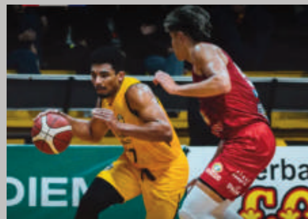
Dentro de pocos meses regresará la competencia de baloncesto.

La Comisión de Primera División de la Confederación Paraguaya de Básquetbol se encuentra trabajando en la planificación de la Temporada 2025. La principal meta de este año es contar con una mayor cantidad de equipos sin perder de vista la organización logística del certamen. Para ello, la CPB ha establecido el 20 de enero como fecha límite para la inscripción de los clubes interesados en participar.