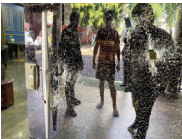
La puerta de blindex del local de comidas árabes "Abbas Líbano" quedó con seis agujeros de bala.