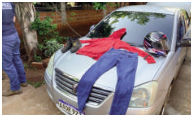
Algunas de las evidencias incautadas en el allanamiento.