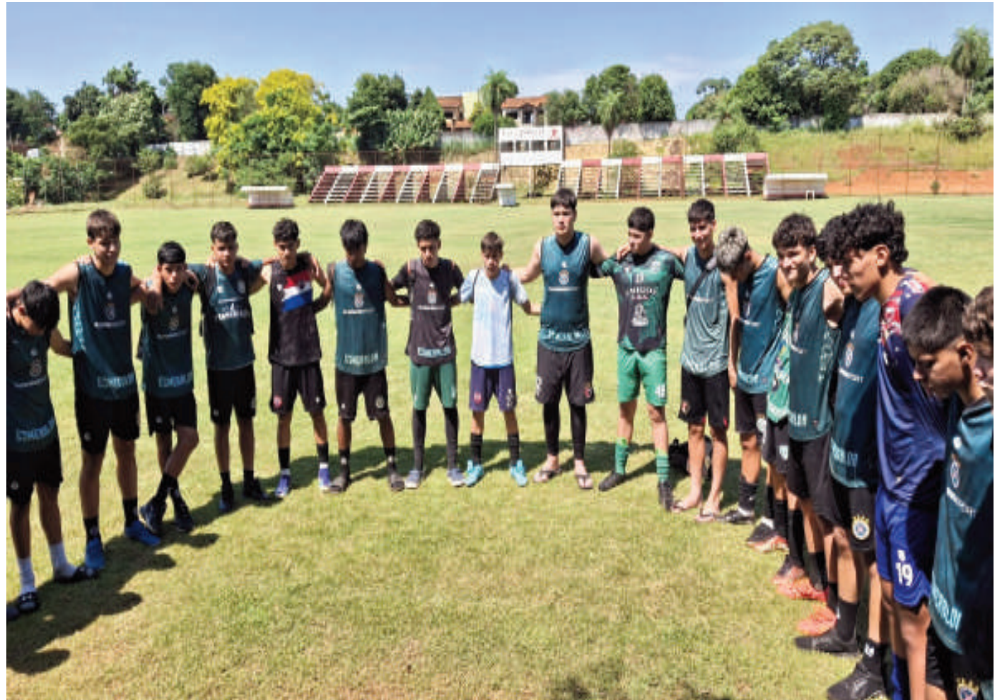
Jugadores del elenco esmeralda quienes se aprestan para el duelo de desquite.

Imponer la localía para obtener la clasificación a las finales del campeonato nacional de Interligas Sub 15 es la consigna de la selección Paranaense. El domingo recibirá la visita de Campo 9, al que deberá vencer para forzar la ejecución de penales por el pasaporte a la referida instancia.