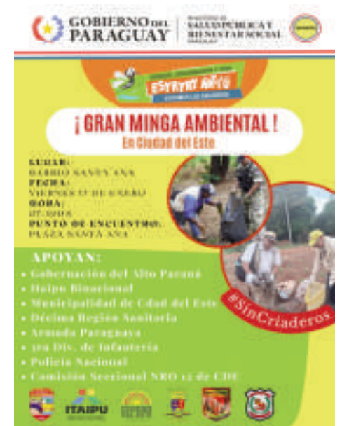
Flyer de invitación de la actividad.

PA, adelantó que se insistirá con la eliminación de los criaderos de mosquitos.