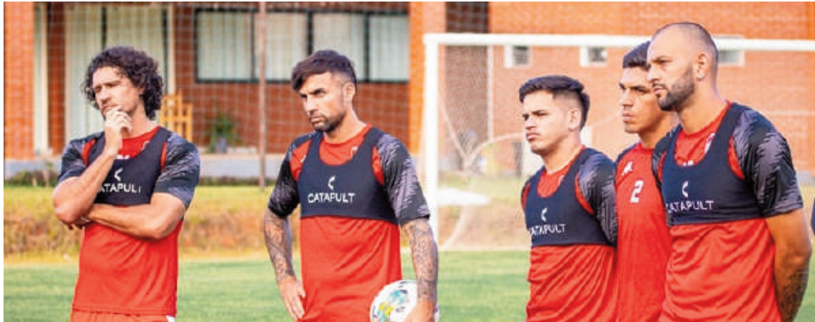
Los jugadores del elenco mallorquino están expectantes con miras a su estreno.

El primer desafío para el equipo dirigido por su cuerpo técnico será el próximo sábado 25 de enero, cuando enfrenten a Recoleta en el estadio Ka'arendy, en lo que se espera sea un encuentro de gran intensidad. Este partido, programado para las 19:30 horas, será clave para General Caballero, que buscará comenzar con el pie derecho el torneo.