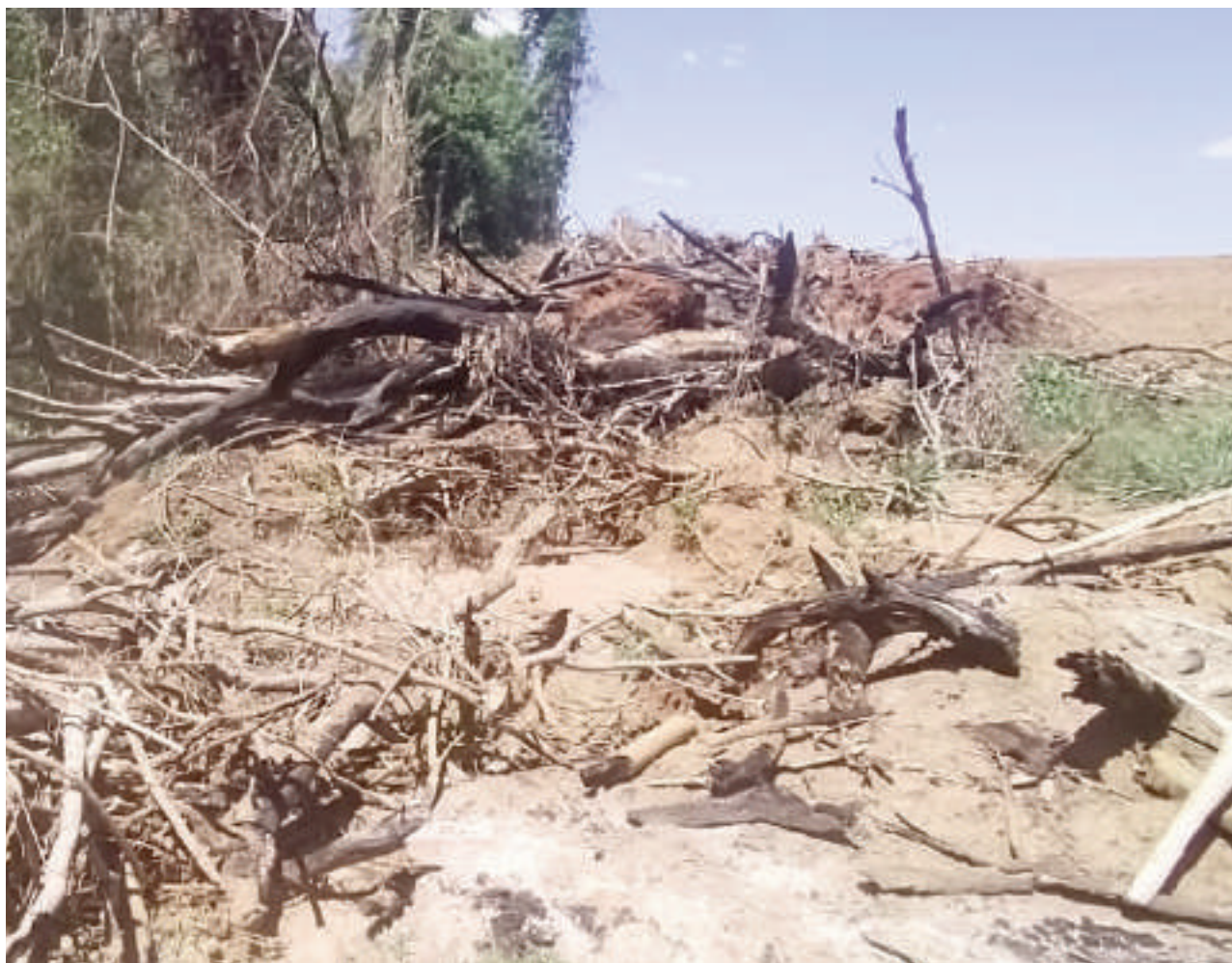
El delito ambiental se registró en la zona de colonia Sapire, distrito de San Cristóbal, según denuncia de lugareños.