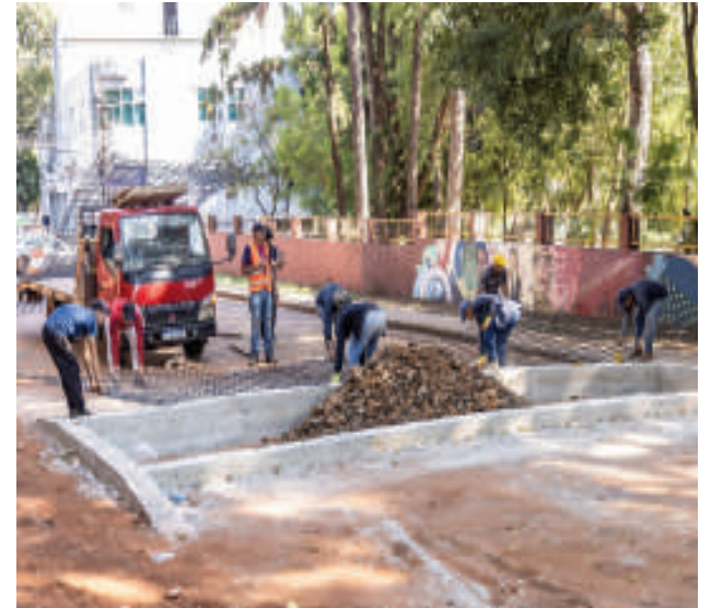
Uno de los reductores está ubicado frente a la Escuela Básica 354 San Blas.

Agregó que algunas lomadas cubrirán avenidas dobles, lo que incrementa los costos. "Hay que tener en cuenta que cada calle tiene una anchura