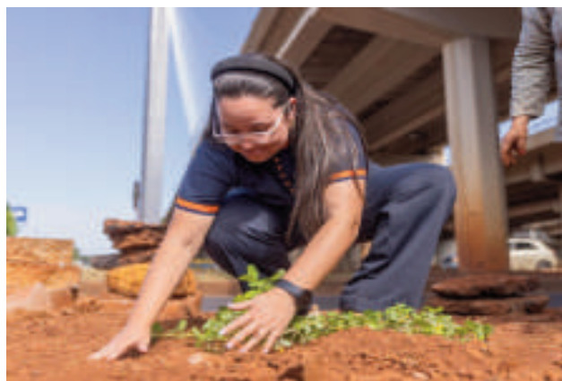
El trabajo está a cargo de funcionarios municipales.

Detrás de esta iniciativa se encuentra el trabajo del vivero municipal. Gracias a la producción constante de plantines, llevada a cabo por la división de Áreas Protegidas y Conservación Patrimonial Natural y Animal Silvestre, la Municipalidad garantiza un suministro continuo de especies nativas y florales para embellecer la ciudad.