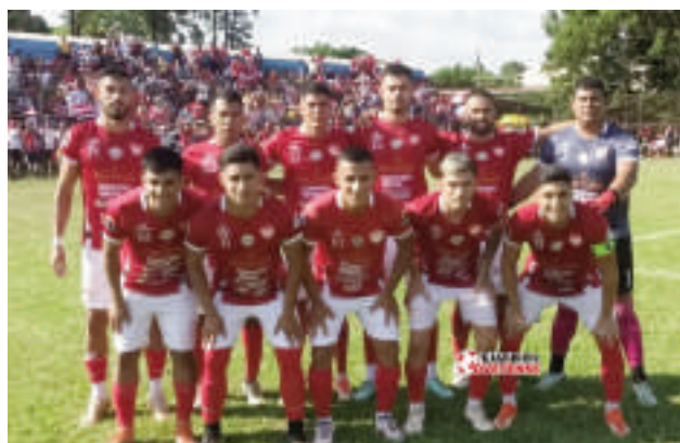
Formación de Arroyense que obtuvo medio pasaporte para disputar la instancia decisiva.