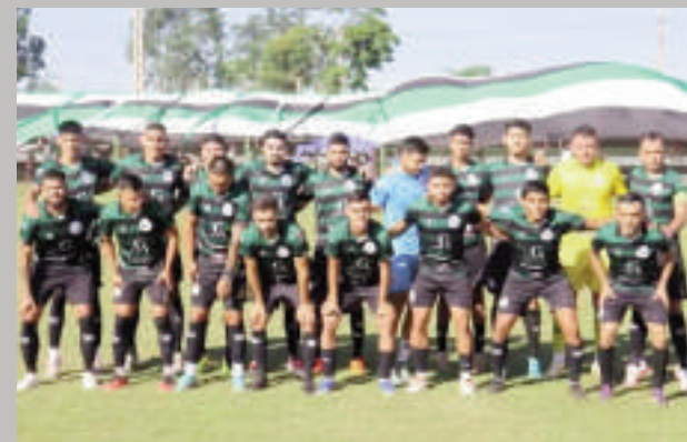
Jugadores de CEFFCA de Salto del Guairá, que se encuentra en la fase consagratoria.