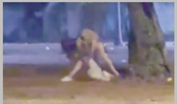
Scren del vídeo que muestra el ataque que sufrió el hombre por parte de los travestidos.

Cabe mencionar que los travestidos se colocan en cualquier punto de la ciudad pescando por potenciales clientes o víctimas. Según los datos, siempre están armados con cuchillos y son extremadamente peligrosos ya que actúan bajo los efectos de alguna droga. La Policía Nacional debe controlar y catear a estos trabajadores del sexo, para evitar que este tipo de hechos sigan ocurriendo en la zona.