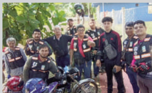
Los trabajadores de motobolt tuvieron una larga lucha para conseguir la reglamentación.

Como la moto no tiene la categoría de registros, se les requerirá la edad mínima de 24 años en adelante. También el presidente deberá presentar una lista de los trabajadores de motos, para facilitar datos al municipio. Se mostraron contentos por este logro los beneficiarios que lucharon casi un año. Alegaron que es un rubro bastante productivo y, en la región, Hernandarias es el primero en reglamentar el servicio.