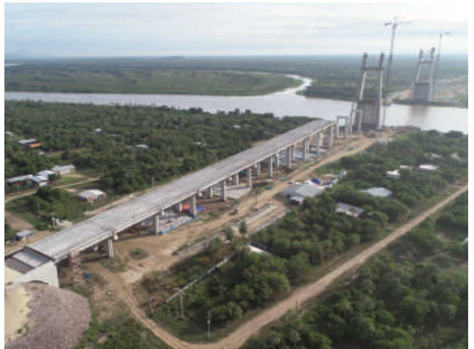
Los trabajos se centran ahora el movimiento de suelo (refulado) para la rampa de acceso del lado paraguayo y la construcción de los pilonos en ambas márgenes del río Paraguay.

íntegramente por la Margen Derecha de ITAI-PU Binacional, potenciará la logística y aumentará el