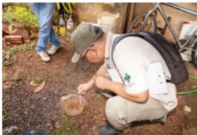
En Foz de Yguazú reformarán el trabajo de vigilancia sanitaria.

Además del soporte técnico, el Ministerio de Salud enfatizó la importancia de desarrollar campañas de educación sanitaria y movilización social para eliminar los criaderos de mosquitos. Estas acciones buscan concienciar a la población sobre la necesidad de mantener espacios libres de acumulación de agua, donde el mosquito Aedes aegypti suele reproducirse.