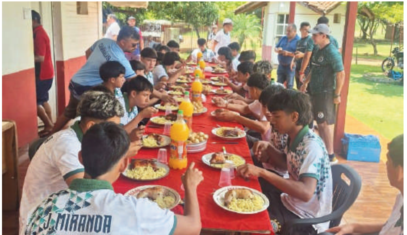
Los jugadores de Paranaense ya están enfocados en el partido de revancha del fútbol de tierra adentro.

La selección Paranaense Sub 15, con un triunfo por un tanto de diferencia, forzará la ejecución de penales por el cupo a las finales del campeonato nacional de Interligas. Es que no se lleva en cuenta diferencia de goles, por lo que el sueño continúa intacto. El cotejo de desquite se desarrollará el domingo en cancha del club Sol del Este, en el km 12 Monday de Ciudad del Este.