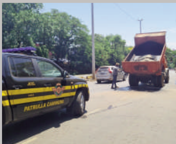
Intervenciones realizadas sobre la Ruta PY02, en CDE.