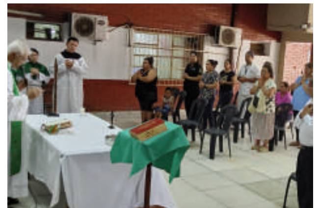
Ayer se desarrolló la celebración de la misa en el nosocomio.

La actividad religiosa se desarrolla en el salón, frente a la urgencia de pediatría y el acceso a la farmacia. Se preparan muchas sillas y se adecua el espacio para la ceremonia. Se pretende mantener por todo este año la eucaristía, los martes a las, 09:00.