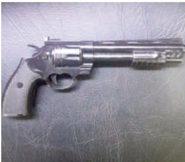
Revólver de juguete con el cual el sujeto amenazó a sus vecinos.

Como si todo fuera poco, ayer, alrededor de las 15:30, el agresor empezó a amenazar a vecinos del lugar con un arma de juguete tipo revólver, apuntándoles de forma intimidatoria, y ante esta situación, los afectados solicitaron la presencia policial. Agentes de la comisaría 8ª de Minga Guazú acudieron al lugar, procediendo a la aprehensión del sospechoso.