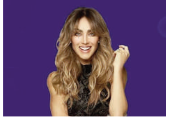
Anahí formó parte del reality "¿Quién es la máscara?".

"Yo no tengo nada que ocultar", enfatizó. "Siempre estaré a favor de que se hagan las investigaciones correspondientes y no dudaré en ejercer las acciones legales necesarias para salvaguardar mi nombre y mi reputación como mujer y como artista que me he esforzado toda la vida en construir. Lo que