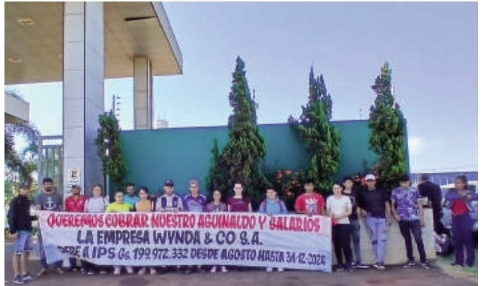
La movilización de trabajadores se realizó ayer en el parque industrial del km 11.