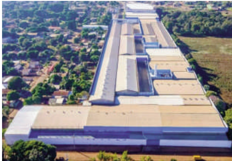
Vista aérea de la planta fabril ubicada en el barrio Don Bosco de CDE.

Una inspección realizada en julio de 2024 a la empresa Hoahi SA, ubica-