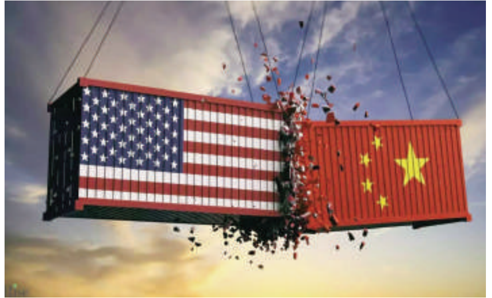
Estados Unidos estaría intentando mantener la hegemonía tecnológica

Las restricciones estadounidenses, anunciadas el pasado lunes por el Departamento de Comercio, buscan limitar el acceso de ciertos países a procesadores avanzados de IA bajo el argumento de proteger la seguridad nacional. Sin embargo, estas fueron criticadas por su impacto potencial en las