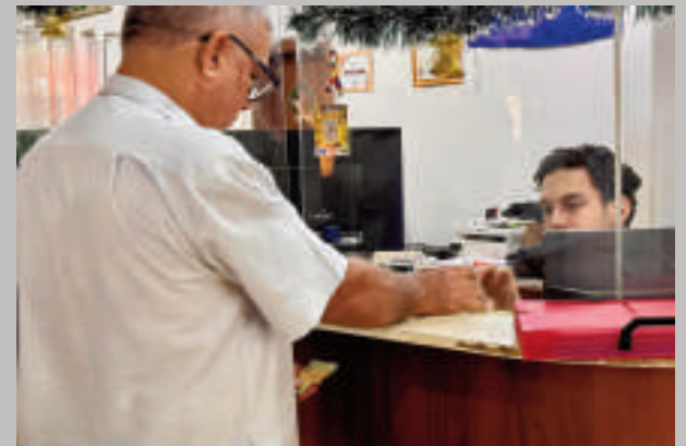
El movimiento de contribuyentes es intenso en estos días.

La presentación de balances es un requisito indispensable para mantener al día la situación fiscal de las personas y empresas. Al cumplir con esta obligación, los contribuyentes evitan acumular multas y recargos, garantizando así una relación transparente y colaborativa con el municipio.