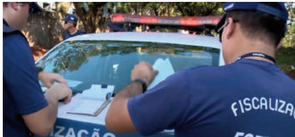
Los fiscales verifican en el sistema si los vehículos tienen multas pendientes.