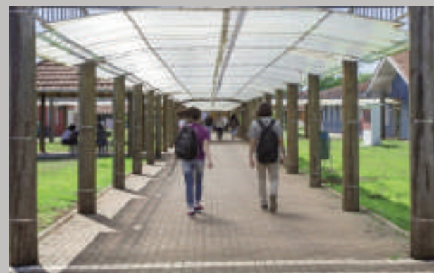
La UNILA tiene su sede en Foz de Yguazú y alberga a muchos estudiantes paraguayos.

explícita: la integración regional y la priorización de las fronteras. Ver a nuestros egresados trabajando en la ciudad y en la región nos llena de orgullo y fortalece nuestra labor", señaló al destacar el vínculo entre la universidad y la comunidad local, como uno de los pilares de su éxito, pues no solo se trata de formar profesionales, sino de contribuir activamente al crecimiento y bienestar de la región.