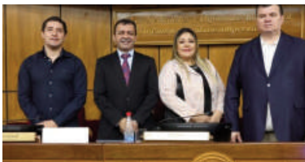
Integrantes de la mesa directiva de la Comisión Permanente del Congreso Nacional.

La mesa directiva de la Comisión Permanente del Congreso, presidida por el diputado colorado Miguel Ángel Del Puerto, estableció el orden del día para la sesión ordinaria programada para este miércoles 15 de