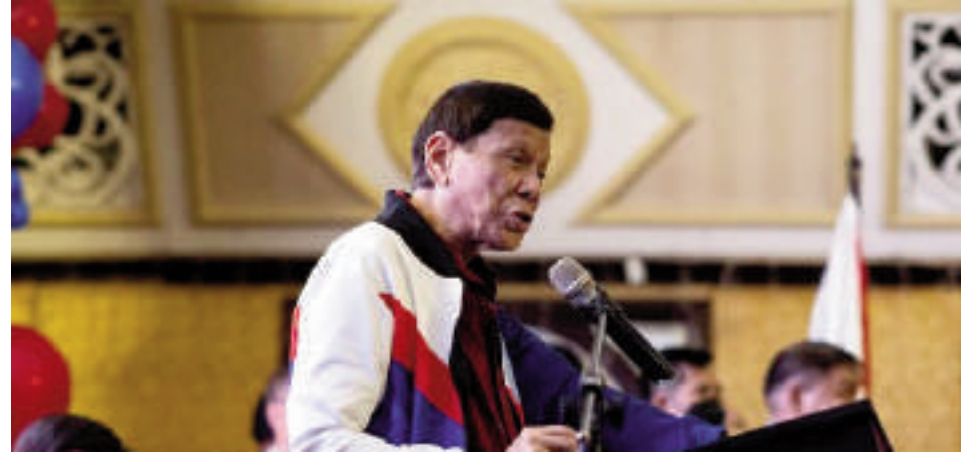
Rodrigo Duterte, expresidente de Filipinas.

La CPI comenzó su investigación sobre los asesinatos relacionados con la