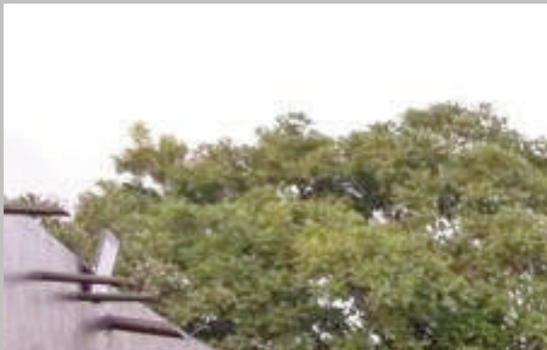
Acto de inicio de actividades, realizado el lunes último.

La Municipalidad de Ciudad del Este lanzó un nuevo ciclo de formación profesional en diversos ofi-