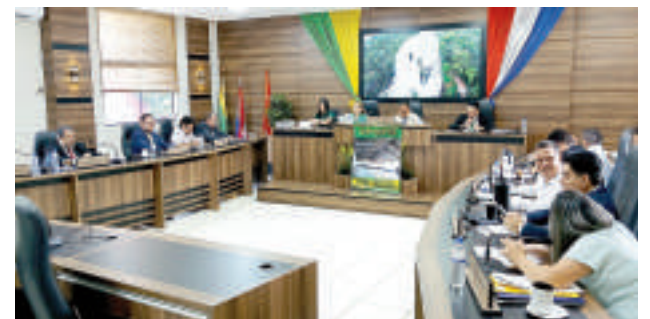
La Junta Municipal de Franco aprobó ayer el dictamen de ampliación.

Además, desde el año pasado se transfirió a los municipios, a través del Viceministerio de Economía y Finanzas la suma de G. 913 millones para usos específicos. Las transferencias, que son recursos no genuinos, se invierten mayormente en obras en instituciones educativas, y corresponde a los concejales municipales evitar que se malversen irregularmente para fines particulares, concluyó.