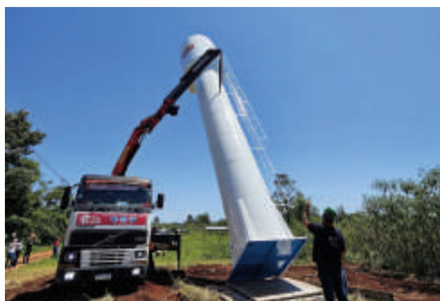
El tanque de agua llegando a la comunidad.

Vecinos acompañaron cómo la grúa elevaba el imponente tanque, símbolo de una lucha que finalmente rendía frutos. La obra, posible gracias a los recursos de Itaipu Binacional y la gestión municipal, representa mucho más que una simple mejora en la infraestructura. Es la materialización de la promesa de un futuro donde el agua, elemento vital, fluiría con regularidad por las cañerías de sus hogares.