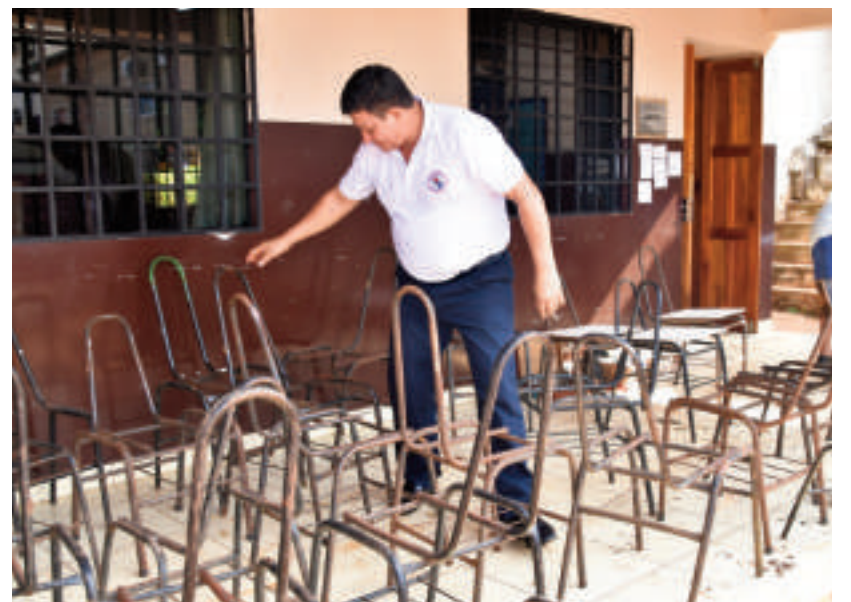
El director de una escuela de CDE observa la deplorable condición en que están las sillas utilizadas en su momento por los alumnos.

es de suma urgencia la distribución y la llegada de los mismos a esa institución. Señaló que la escuela tiene más de 1.000 alumnos y que muchas veces debieron recurrir a la asociación de padres para adquirir nuevos muebles.