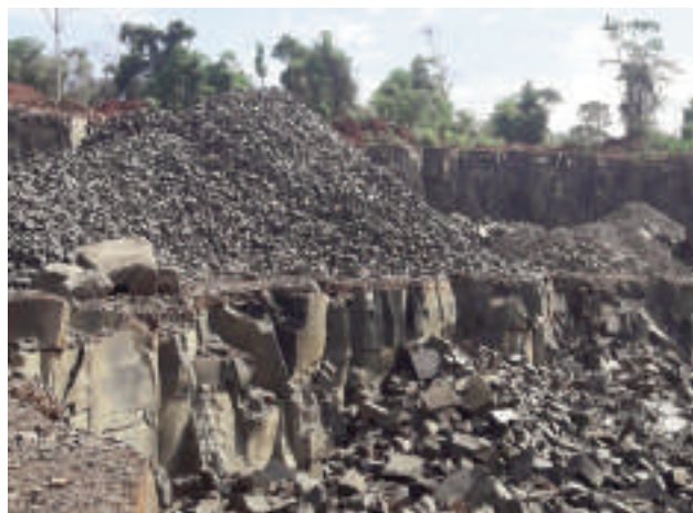
Una de las canteras a ser investigadas nuevamente.