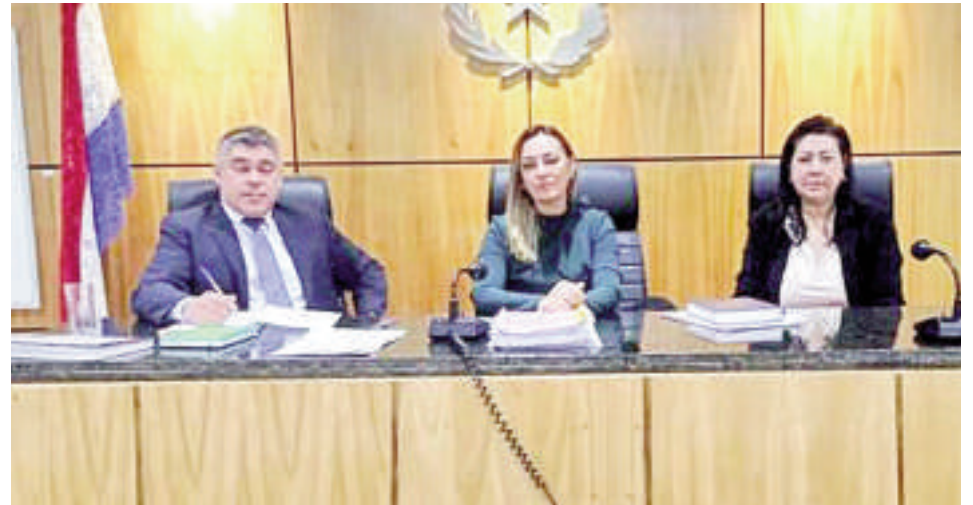
Tribunal de sentencia que juzga al "gatillo fácil".