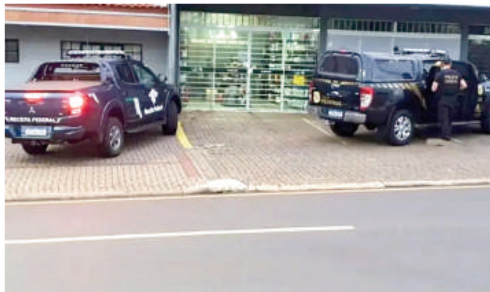
La operación demandó un gran despliegue de las fuerzas públicas.

El operativo movilizó a auditores fiscales y analistas tributarios de la Receita Federal, además de agentes de la Policía Federal. Durante los allanamientos, se ejecutaron cinco órdenes de registro y aprehensión y se detuvo de manera preventiva a cinco personas en las ciudades de Cascavel, Cielo Azul y