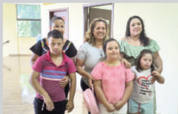
Los representantes de Apadown se presentaron ayer en Franco.

Mencionaron que tienen una idea de convertir en fundación próximamente la asociación de lucha contra la discriminación. Son chicos que siguen tratamientos costosos y, si alguna vez consiguen una sede con equipos de profesionales, los mismos podrán ser tratados en su propia organización, alegaron. De momento, aguardan recibir las visitas de todo el público en general.