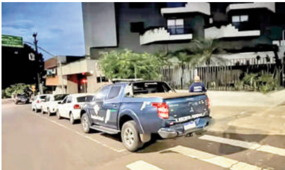
Los allanamientos se realizaron en tres municipios brasileños.

La Receita Federal (Secretaría de Ingresos Fiscales) (RF) y la Policía Federal de Brasil (PFB) llevaron a cabo la Operación Evali, con el objetivo de desarticular una organización criminal especializada en el contrabando de cigarrillos electrónicos y esencias desde Ciudad del Este, Paraguay. Cinco personas fueron detenidas; además, se incautaron bienes de alto valor.