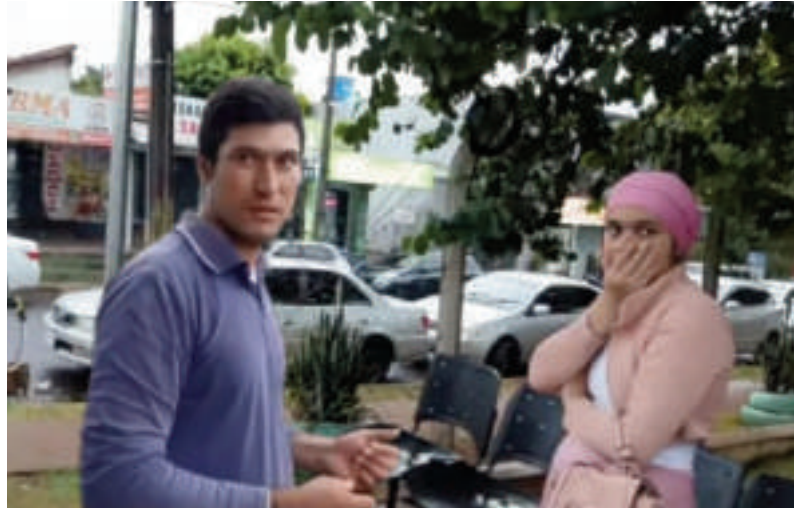
Los padres que quisieron usar la fuerza para retirar al niño del hospital en Franco.