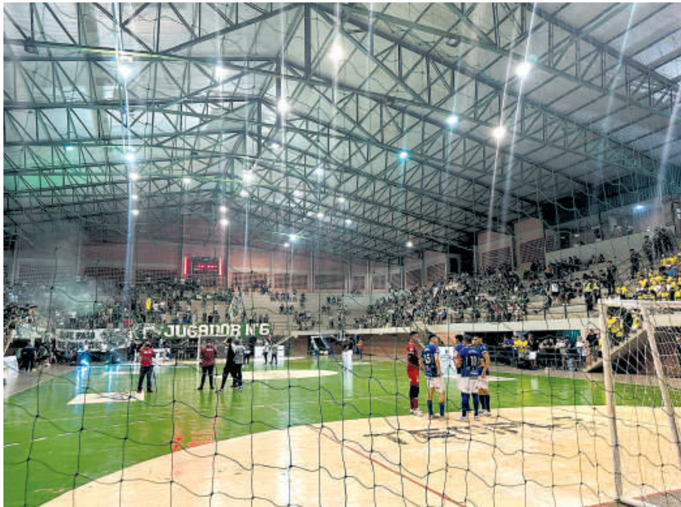
El partido entre Paranaense y Franco se disputó en el polideportivo municipal de Ciudad del Este.

El tribunal de justicia deportiva de la Federación Paraguaya de Fútbol de Salón impuso una multa de G. 1.500.000 a Paranaense y Franco tras los incidentes registrados el viernes último en el clásico entre ambas representaciones. Además confirmó el resultado de 1-1, marcador que se mantuvo hasta falta de 8 minutos para que se complete el tiempo reglamentario.