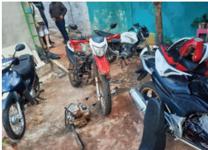
La motocicleta Kenton, modelo DKR 200 que contaba con GPS ya estaba sin el motor y el asiento cuando la Policía llegó al lugar.

La intervención policial se realizó alrededor de las 07:30, cuando agentes de la subcomisaría 13ª y los Patrulla Motorizada llegaron hasta una vivienda ubicada en el barrio Remansito, siguiendo la señal del rastreo satelital de una moto la marca Kenton, modelo DKR 200,