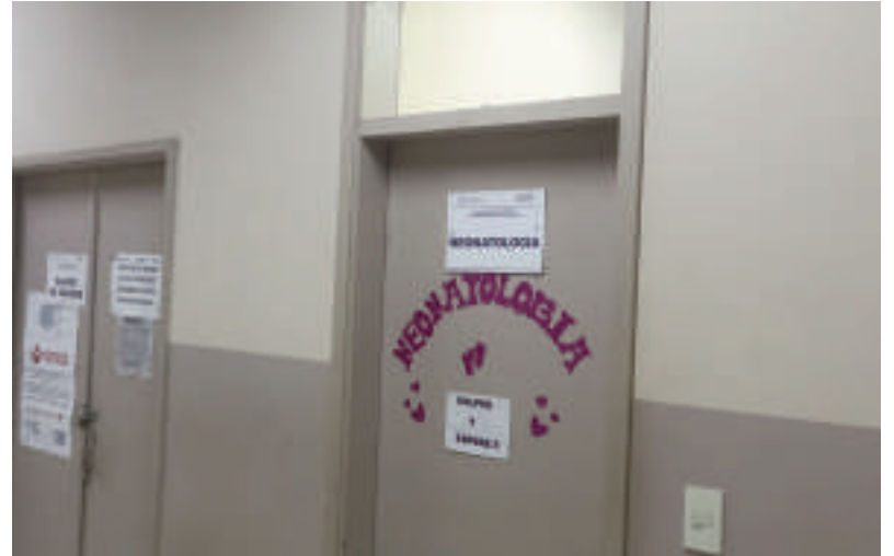
La sala de neonatología donde está el recién nacido.

en este hospital de Franco hace una semana. El niño nació prematuro y tenía 35 semanas de gestación; se encuentra en la sala de neonatología, en la incubadora. Los profesionales que lo atienden recomendaron que no está en condiciones para salir aún, ya que necesita de más tiempo para garantizar su vida fuera de la sala médica. Hasta ayer pesaba 1k y 850 gramos. De acuerdo con