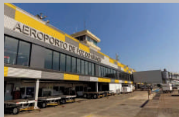
El aeropuerto de Foz opera por debajo del volumen de pasajeros registrado antes de la pandemia.

(Comtur) señala que uno de los desafíos del aeropuerto es la competencia con otros destinos. Entre los factores que influyen en la reducción del flujo de pasajeros, menciona la cotización del dólar y el aumento de los precios de los boletos aéreos, que impactan directamente en la decisión de los turistas. Para mejorar este panorama, el Comtur trabaja en conjunto con el sector turístico, aerolíneas y autoridades para fortalecer la conectividad del destino. El aeropuerto, que recientemente ha pasado por mejoras en su infraestructura, sigue siendo una pieza clave en la estrategia de crecimiento del turismo en la ciudad. Mantienen la confianza en la recuperación del crecimiento, con mayor promoción del destino, inversiones en marketing, atracción de nuevos vuelos y la consolidación de la región de las Tres Fronteras como un hub turístico cada vez más relevante.