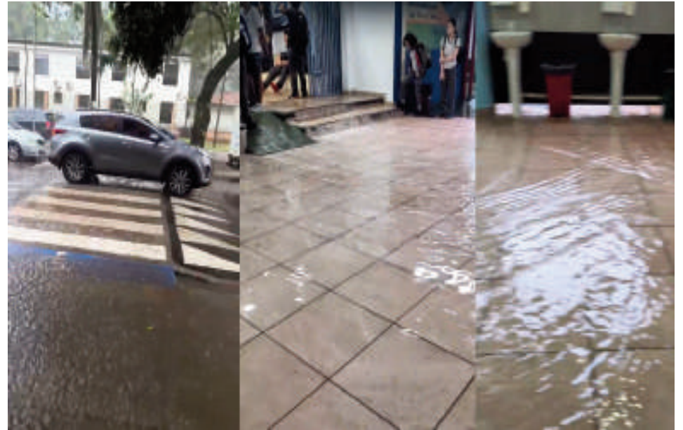
La inundación fue filmada por los padres de familia y viralizada por las redes sociales.

Se trata de un proyecto aprobado a finales del año pasado por la Junta Municipal. En total se prevé la construcción de 42 lomadas inclusivas, frente a 24 instituciones educativas. La empresa responsable es propiedad de Elvio