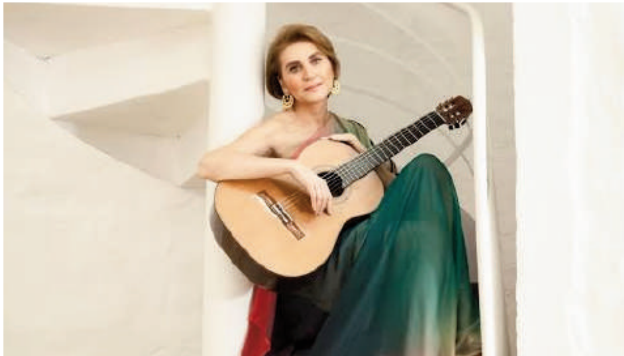
Berta Rojas, guitarrista paraguaya.