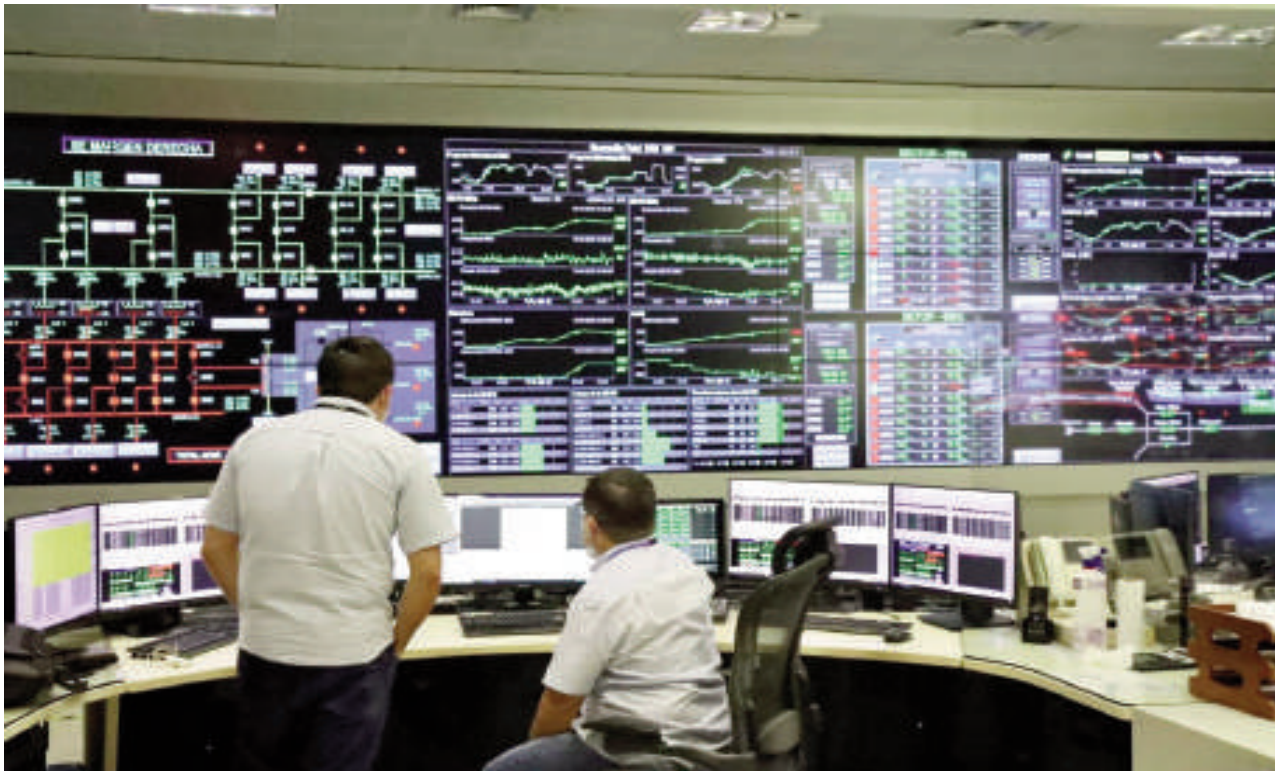
Sala de control técnico de la usina de Itaipu. La hidroeléctrica suministró a Paraguay 4.253 GWh de energía eléctrica entre enero y febrero de este año.

disponibilidad de las unidades generadoras de la hidroeléctrica, cuyo valor al mes de febrero fue de 95,64%, superando en 1,64% a la meta empresarial del 94%. Estos logros son posibles gracias a la eficiencia operacional y de mantenimiento, la calidad técnica del cuadro de empleados y de los trabajos coordinados entre los sistemas eléctricos de Paraguay y Brasil, optimizando los recursos disponibles para cubrir la demanda existente por