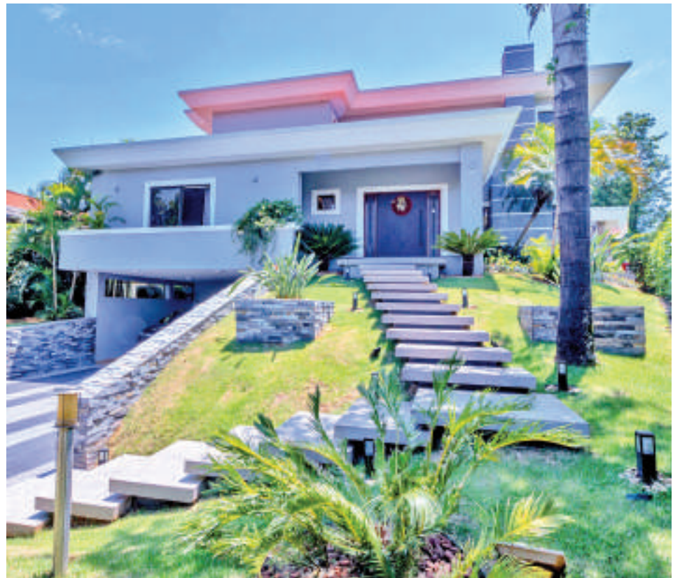
Ciudad del Este atraviesa un auge inmobiliario.

El valor de las propiedades de lujo varía significativamente, teniendo en cuenta diversos factores. Principalmente, se consideran la ubicación y el tamaño del terreno, además de las características del departamento. "La exclusividad juega un papel crucial en este segmento del mercado", puntualizó el experto.