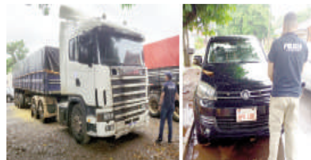
Los vehículos incautados ayer por agenes del Departamento de Automotores de la Policía Nacional.