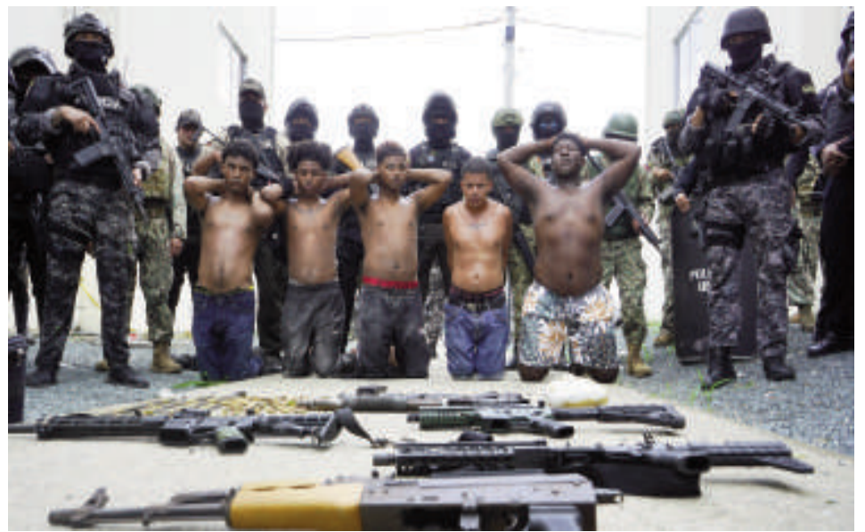
Algunos de los detenidos tras la masacre.

Tras conocerse la masacre, decenas de agentes policiales y militares se desplegaron en el sector para intentar dar con los responsables. Un helicóptero de la fuerza pública también sobrevoló la zona en busca de pistas sobre lo ocurrido. Al menos 14 personas fueron detenidas,