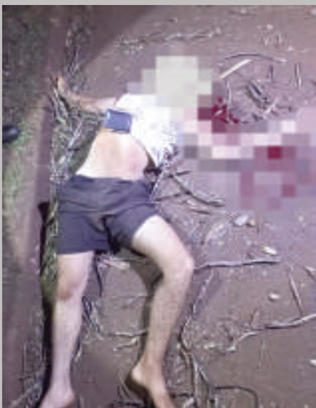
Guzmán David Benítez murió en el acto tras caer de su bicicleta y golpear la cabeza contra la capa asfáltica.

Un motociclista falleció en el cato luego de aparentemente perder el equilibrio y caer de su bicicleta sobre la capa asfáltica y golpear la cabeza. El suceso