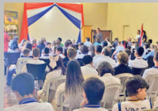
Lanzamiento del programa se cumplió en la sede comunal.

evento fue la entrega de menciones de honor a los pioneros inmigrantes sobresalientes de San Alberto. Se trata de hombres y mujeres que llegaron a la región en busca de un futuro mejor. Recibieron un merecido reconocimiento por su contribución al desarrollo social, económico y cultural del municipio y del departamento.