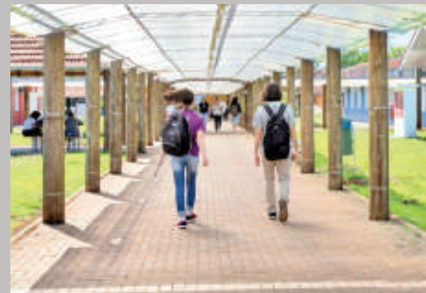
La UNILA funciona en la ciudad de Foz de Yguazú.

ve a abrir sus puertas a nuevos estudiantes y muchos de ellos son paraguayos.