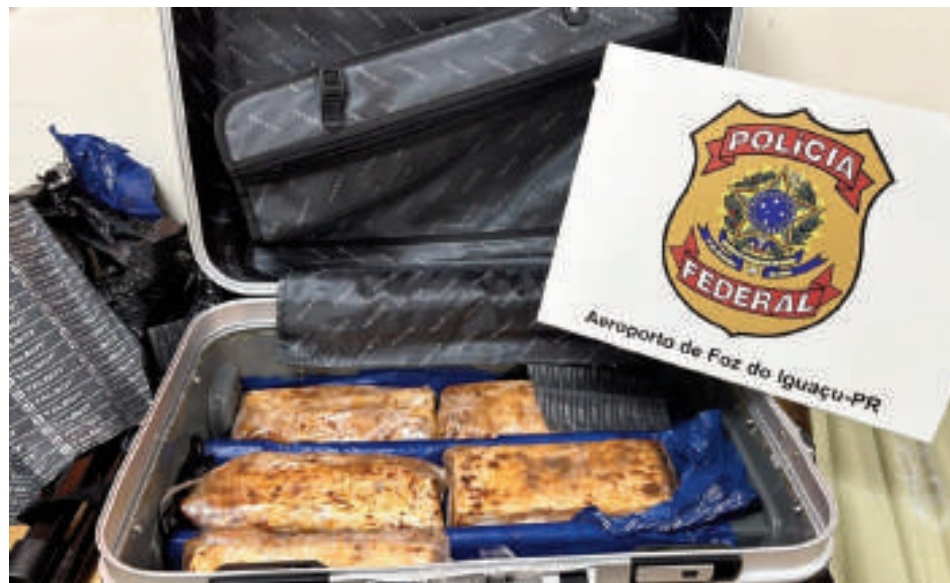
Carga de cocaína incautada en poder un paraguayo en el aeropuerto de Foz.

Las familias, muchas veces del interior del Paraguay, viajan con lo poco que tienen para tratar de entender el proceso en un idioma que no dominan. "Vienen las madres o hermanas, con lo que les cuesta trasladarse hasta acá. Son víctimas de un sistema que las supera",