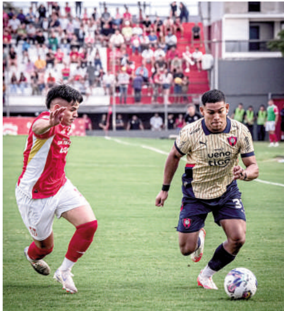
El elenco mallorquino no pudo imponer su localía frente al conjunto azulgrana.