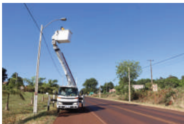
Operarios de la ANDE recuperando los alumbrados públicos en Tavapy.

Consciente de la importancia de un alumbrado público eficiente, la ANDE respondió al llamado de la comunidad y se movilizó para solucionar el problema. Los trabajos se centraron en la reparación de las luminarias defectuosas, garantizando así una iluminación adecuada en la Ruta Sexta.