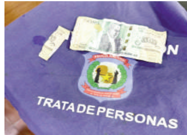
Del poder de la detenida se incautó el dinero fotocopiado para la entrega vigilada con orden judicial.

La fiscal del caso también dispuso que la adolescente sea rescatada y quede en un hogar transitorio hasta que la justicia determine con quien que-