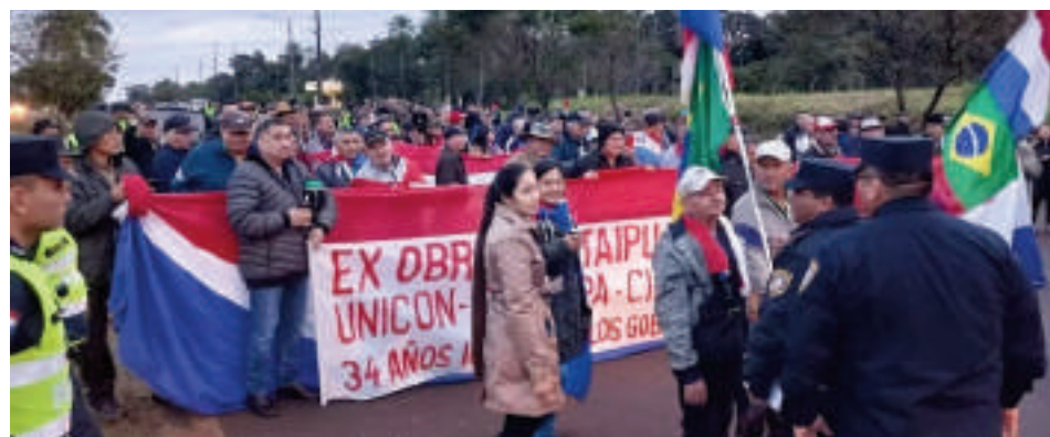
Los manifestantes violan varios artículos de la C.N. y de la Ley Nacional de Tránsito, sin embargo, la Fiscalía y la Policía se mantienen en sugestivo silencio.

Mientras miles de ciudadanos ven vulnerados sus derechos por el accionar de un grupo de manifestantes y la desidia de las autoridades, el país entero observa cómo el Estado de derecho se desmorona frente a la complacencia de quienes deberían garantizarlo.