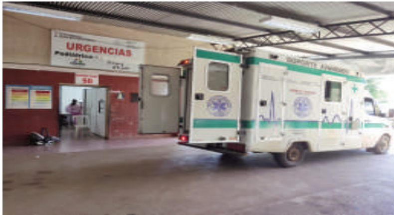
El movimiento de ambulancias es constante.