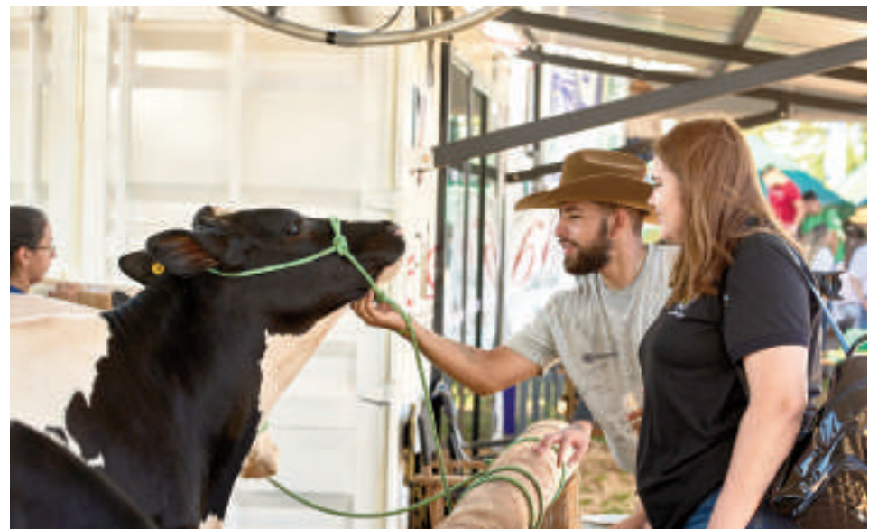
Como cada año, la Feria Innovar cuenta con varias novedades.

El miércoles 19, a las 08:00, se dará inicio al juzgamiento ranqueable de ovinos, un evento diseñado para apreciar la calidad de los ejemplares y el nota-