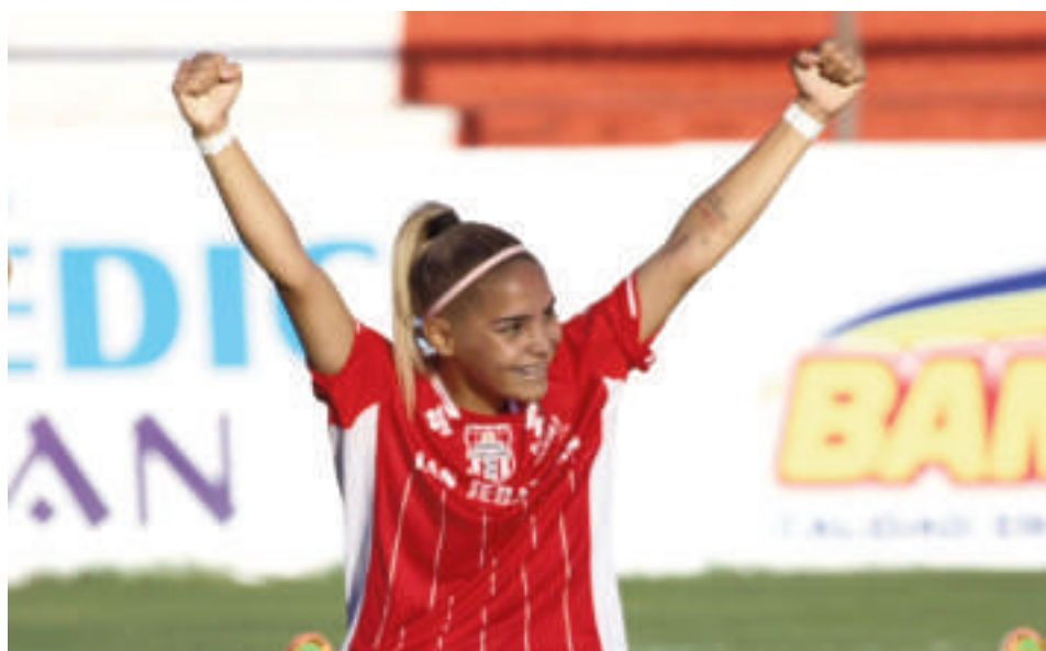
Las rojitas mostraron mucha fuerza frente a las auriazules en torneo femenino.