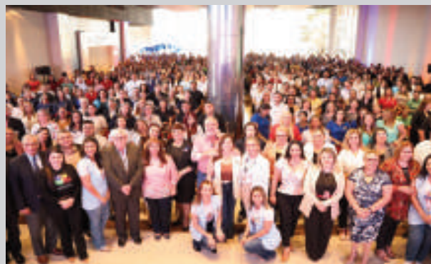
El evento se desarrolló el viernes último y tuvo mucha concurrencia en CDE.

El Ministerio de Educación y Ciencias (MEC), con el apoyo de Itaipu, llevó adelante las capacitaciones a docentes sobre el Trastorno del Espectro Autista (TEA) en Caaguazú y Alto Paraná. Corresponde al marco del Congreso TEA 2025 que se realizó en el Hotel Nobile de