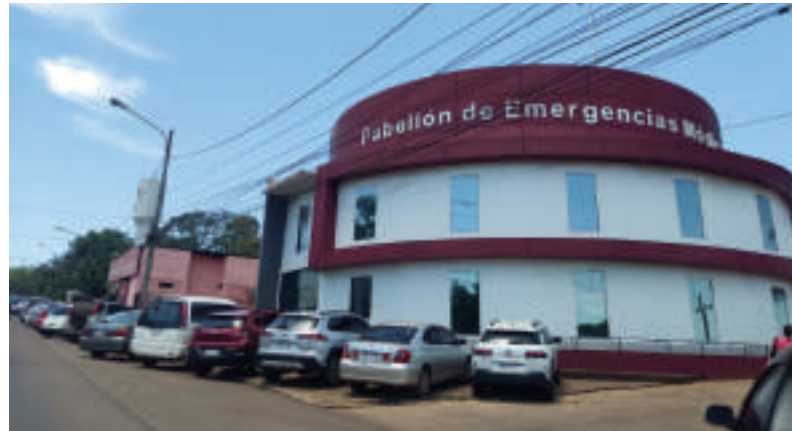
El Pabellón de Emergencias Médicas siempre está saturado.

de 11.000 hipertensos y 15.000 diabéticos registrados.