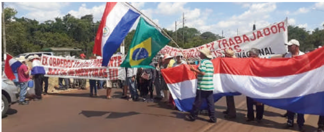
Desde el martes de la semana pasada, exobreros de la Itaipu radicalizaron su protesta, bloqueando totalmente la Ruta PY 07, a la altura de la entrada al barrio San Francisco de Hernandarias.

de rutas nacionales. Sin embargo, de manera sugestiva, tanto la Policía Nacional como el Ministerio Público han optado por la inacción, permitiendo que la ilegalidad se prolongue sin consecuencias para los responsables.