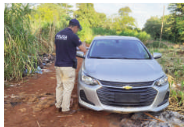
El automóvil Chevrolet Onix, robado en el Brasil, fue recuperado en el barrio San Agustín de Ciudad del Este.

Tras un rastillaje, los agentes lograron ubicar el automóvil en una zona deshabitada del barrio San Agustín, donde desconocidos lo abandonaron con la llave puesta. El hallazgo fue comunicado en tiempo y forma al agente fiscal de turno, Gabriel Segovia Villasanti, de la unidad penal n° 6, quien dispuso las diligencias correspondientes para la devolución del vehículo a su legítimo propietario.