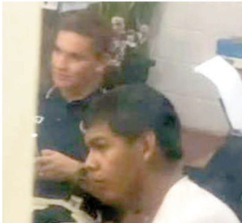
El detenido podría ir a prisión.

Con los elementos probatorios en la incipiente etapa de la investigación, la fiscal Coronel solicitó plazo de cuatro meses para la presentación de su requerimiento conclusivo.