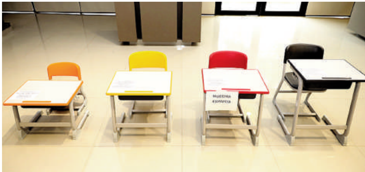
Muestras de los mobiliarios que serán entregados en las escuelas del país y colegios.

El monto total de la adjudicación fue de unos G. 248 mil millones, correspondiente a una primera etapa que comprende la compra de 330.000 conjuntos mobiliarios pedagógicos. Según informaron desde la binacional, el precio resultó ser 10% menos de lo previsto, con lo cual se ahorró unos 3,5 millones