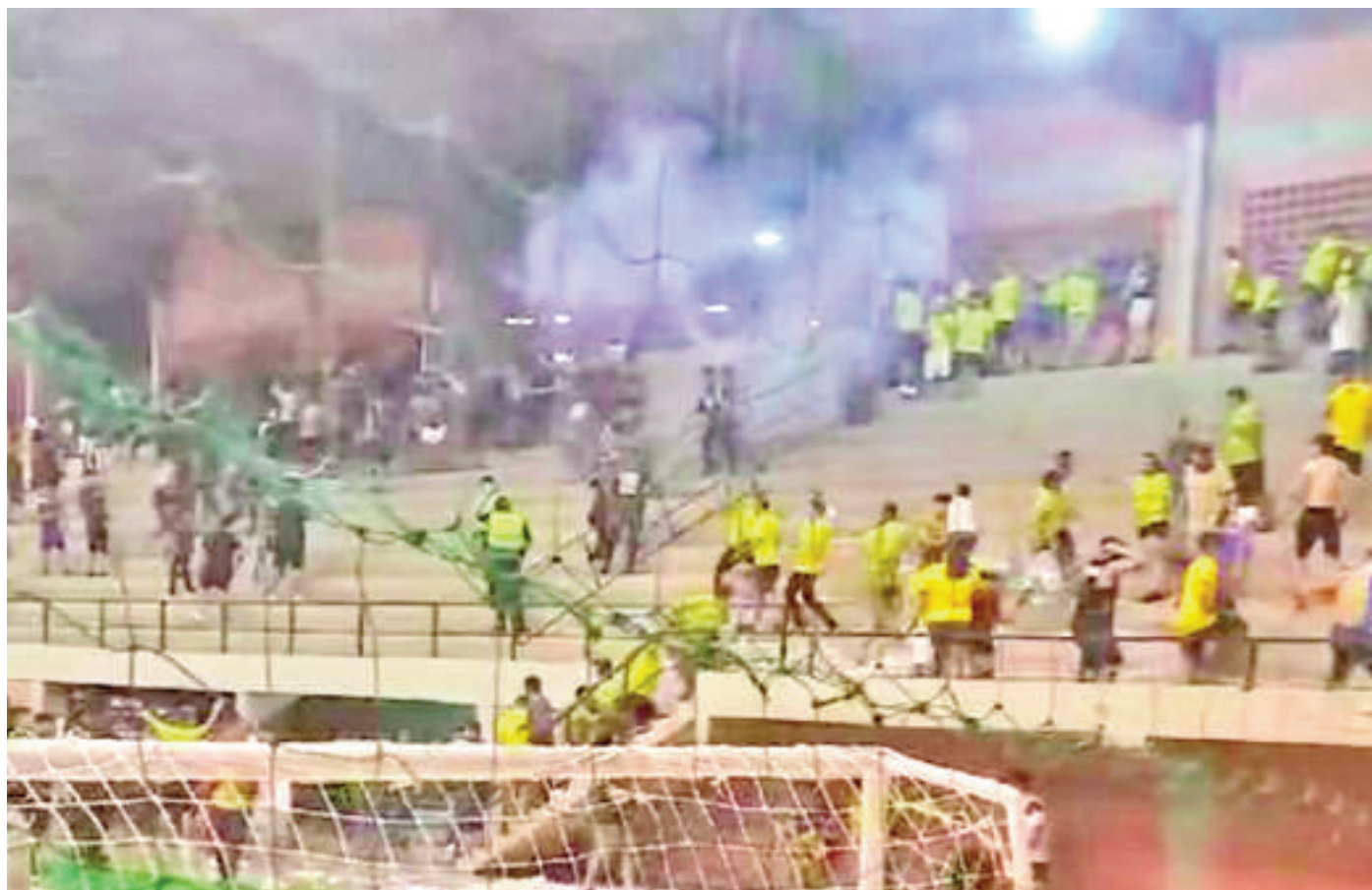
Captura de un video que muestra parte del incidente ocurrido en el polideportivo municipal de CDE.

Una bochomosa culminación tuvo las eliminatorias zona Este, grupo 7, de fútbol de salón, categoría mayores. Es que a falta de 8 minutos para el cierre del clásico entre Paranaense y Franco, unos inadaptados generaron disturbios. Los dos elencos ya habían clasificado de manera anticipada al nacional de salonismo. Además, varios comunicadores se sintieron molestos al ser retirados de su lugar destinado para la cobertura. En tanto, el duelo entre Minga y Hernandariense ya no se jugó.