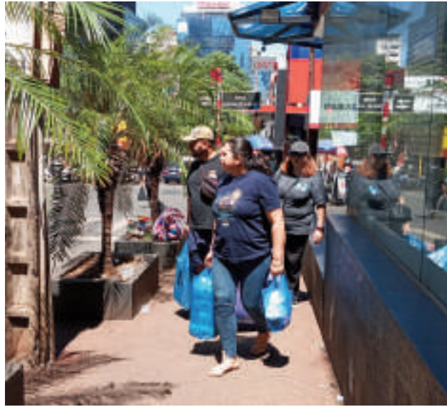
Ciudad del Este espera sacar provecho de los feriados prolongados.

El calendario de 2025 promete ser un gran aliado para el comercio en Ciudad del Este, uno de los principales centros comerciales de la triple frontera entre Brasil, Paraguay y Argentina. Con al menos nueve feriados prolongados en Brasil a lo largo del año, la región se prepara para recibir una oleada de turistas, lo que dinamizará las ventas y fortalecerá la economía local.