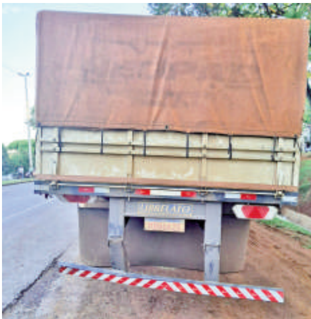
El tracto-camión de la marca Mercedes Benz con matrícula brasileña estaba estacionado al momento del impacto.

Tras el impacto, el motociclista cayó malherido y fue trasladado por Bomberos Voluntarios al Hospital de Traumas de Ciudad del Este en grave estado. Lamentablemente, cerca de las 21:30, los pro-