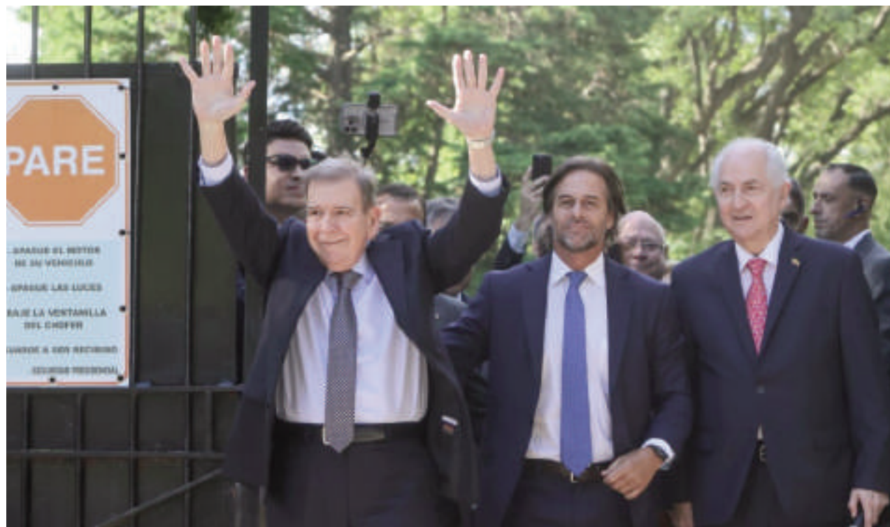
El líder opositor venezolano Edmundo González Urrutia (I) saluda a simpatizantes junto al presidente de Uruguay, Luis Lacalle Pou (C), en Montevideo (Uruguay).

La insistencia del Estado venezolano en el arresto de González Urrutia arreció al aproximarse la fecha de la toma