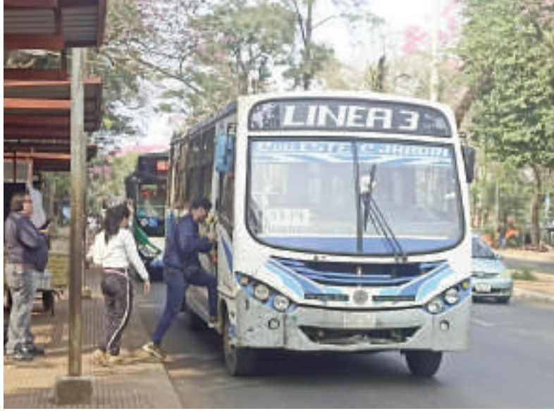
Los buses deben cobrar por tarjetas a los usuarios.