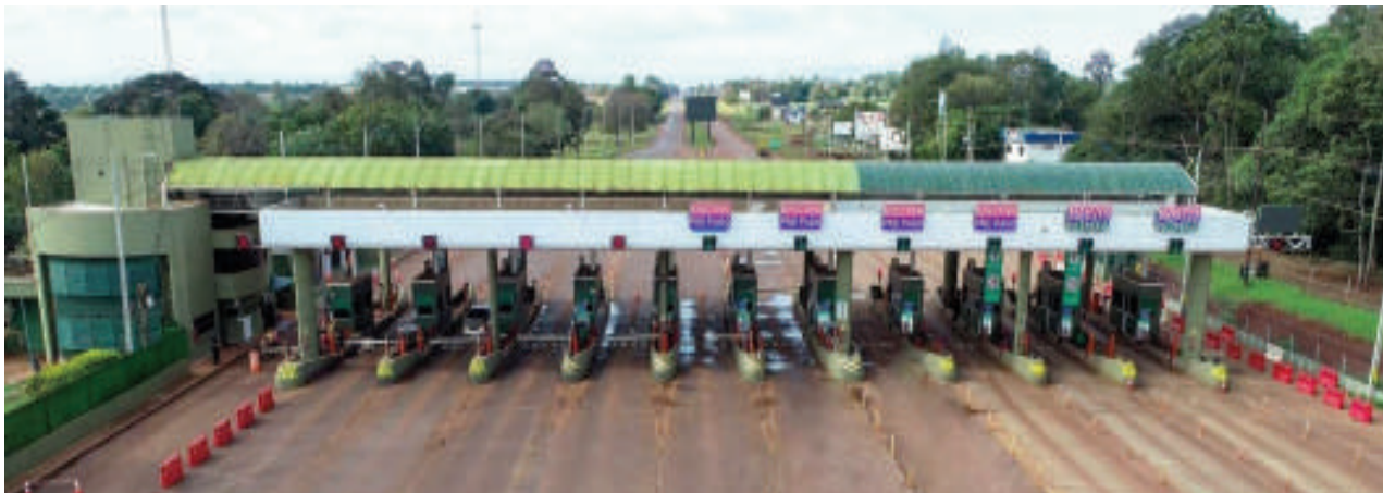
El Gobierno, a través del MOPC, autorizó un nuevo "tarifazo" de Tape Porã, en dos etapas.

La concesionaria Tape Porã logró asegurar la gestión de importantes tramos de la Ruta PY02 hasta 2053, durante el gobierno de Horacio Cartes. Actualmente, administra