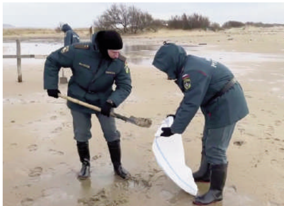
Autoridades rusas trabajaron en la limpieza de la zona.

Los petroleros Volgoneft 212 y Volgoneft 239, ambos construidos hace más de 50 años para