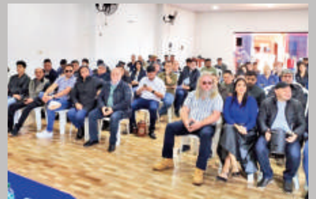
Las internas liberales sin rumbo en Ciudad del Este.