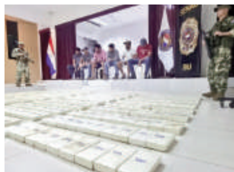
La droga incautada y los detenidos con relación al caso.