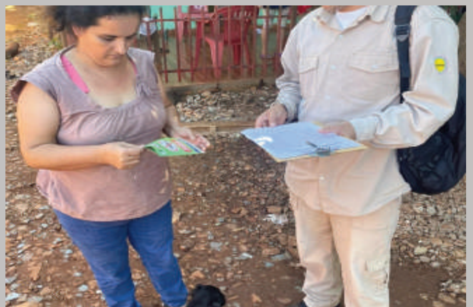
Campaña de concienciación en Santa Rita.

Comprender el ciclo de vida del Aedes aegypti es fundamental para prevenir la transmisión de estas enfermedades. Este mosquito se reproduce en agua limpia y estancada, como la que se acumula en recipientes, llantas viejas, flores y otros objetos.