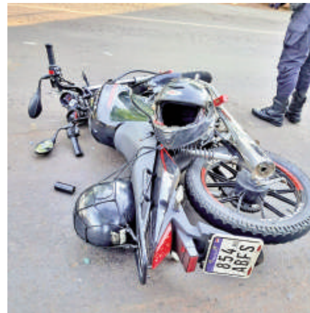
La motocicleta de la víctima quedó en medio de la ruta tras el accidente.

fesionales confirmaron su fallecimiento.