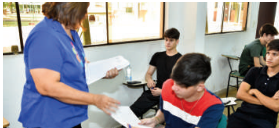
Las becas para formación docente inicial y tecnicaturas superiores van dirigidas a egresados de la Educación Media de instituciones públicas, privadas subvencionadas y privadas.

Las becas para carreras de grado están destinadas a egresados de la Educación Media de instituciones públicas, privadas subvencionadas y privadas, de todo el territorio de la República del Paraguay, correspondientes a las promociones de los años 2021, 2022, 2023 y 2024.