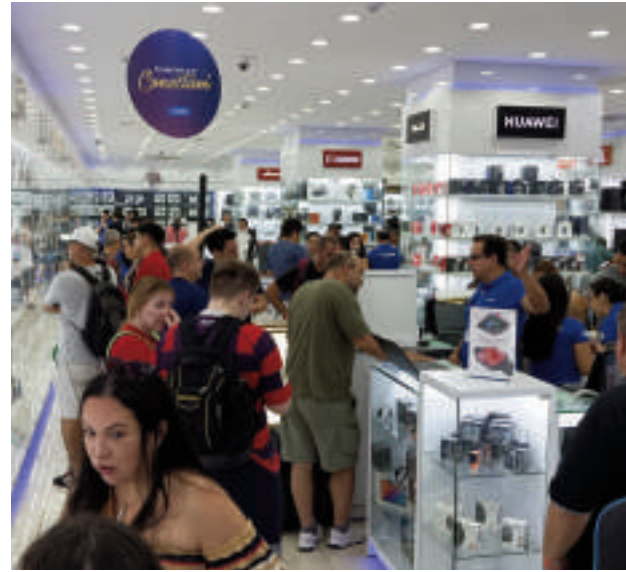
Las tiendas locales se preparan para un año sumamente positivo.

La racha de "super feriados" comenzó el 1 de enero, feriado nacional por la Confraternización Universal, que cayó el miércoles, permitiendo a los visitantes enlazar sus vacaciones de fin de semana con el primer fin de semana de 2025. Esta tendencia continuará durante todo el año, generando oportunidades para que los comercios ofrezcan promociones y atraigan compradores.