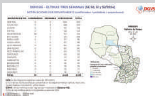
Infografía del SENEPA sobre casos de dengue país.