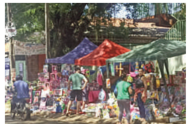
Múltiples puestos de venta se observaron en CDE.

Afirmaron que hoy estarán hasta alta hora del día para ofrecer las variedades de objetos infantiles que disponen. Existen diferentes precios que se acomodan a los bolsillos de los clientes y sus preferencias. Los costos varían desde los G. 20.000 hasta 200.000 y 500.000.