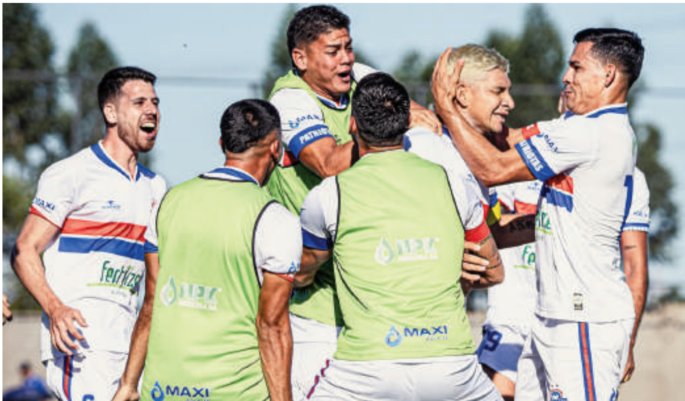
Festejo de los jugadores de Patriotas quienes vencieron en la primera pulseada por el cupo a la última instancia.

Patriotas de Hernandarias dio ayer el primer paso a la etapa final del campeonato Nacional B que es la Tercera División del fútbol paraguayo. Es que goleó de local 5-1 a CEFFCA de Salto del Guairá en partido de ida de la penúltima instancia, en la comuna hernandariense. La revancha se desarrollará el próximo domingo en suelo salteño. En tanto, en otro duelo se registró empate.