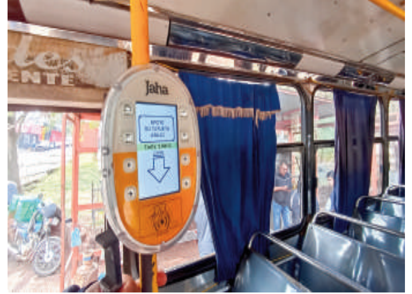
Las máquinas validadoras se instalan en los colectivos.