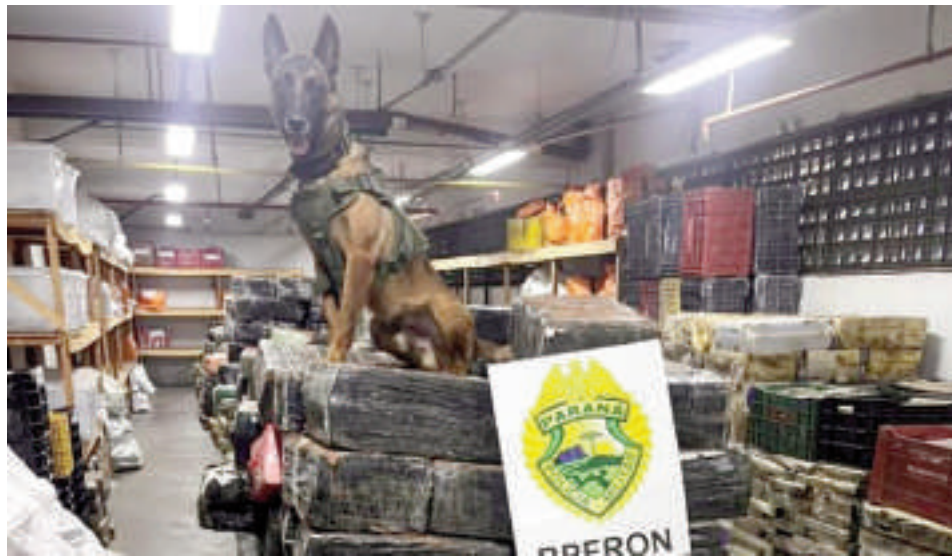
En la gráfica aparece "Ollie", el perro antidrogas que ayudó a los intervinientes a encontrar la gran cantidad de marihuana.

Este hallazgo se suma a los esfuerzos recientes de las fuerzas de seguridad en la lucha contra el narcotráfico, que ha visto un aumento en las incautaciones de marihuana proveniente principalmente de Paraguay, uno de los mayores productores de la región. Según datos oficiales, en 2024 las autoridades