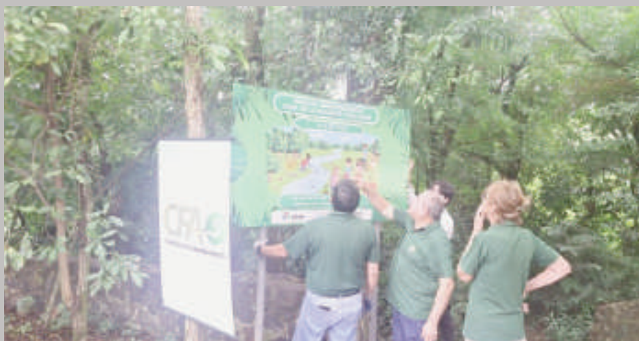
Técnicos de la Binacional en el Parque Independencia.

La Itaipu Binacional, en alianza con la comisión vecinal del Área 5, lleva adelante un proyecto para revitalizar la naciente de agua Yku Sakã, ubicada en el Parque Independencia de Presidente Franco.