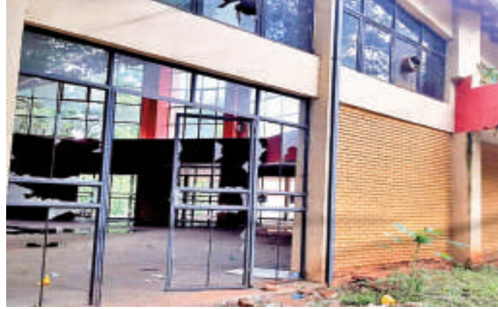
El estado de varias seccionales coloradas es lamentable.

Hay otro grupo del cartismo que pretende llegar hasta el presidente de la República, Santiago Peña,