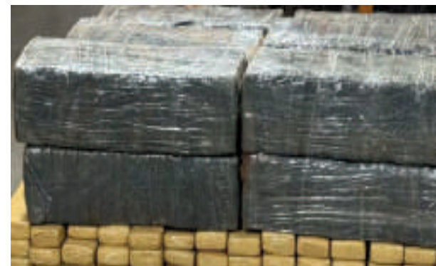
El cargamento de marihuana incautada por los federales en la cabecera brasileña del Puente de la Amistad.

Las investigaciones continúan para determinar si el conductor forma parte de una red de tráfico transnacional.