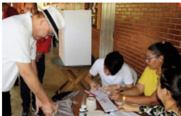
Se espera fecha para las internas.

Una vez que el TSJE dé a conocer los plazos para cada proceso, además de las fechas para las internas y las elecciones municipales, los partidos podrán comenzar con las tareas preparatorias, inscripción de movimientos y estiman que a fines de este 2025, ya podrán inscribir las candidaturas.