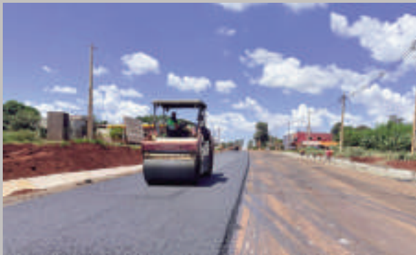
Parte del avance de las obras. Se observa los primeros kilómetros de pavimentación.

Las obras del segundo lote de la carretera que va hasta Puerto Indio, en el departamento de Alto Paraná, avanzan de forma sostenida, superando el cronograma previsto. Esta nueva infraestructura vial, con un progreso 35%, conectará Puerto Indio con la Ruta PY07, transformando la región, además de contribuir al desarrollo económico y la generación de empleo en el distrito de Mbaracayú. El Ministerio de Obras Públicas y Comunicaciones (MOPC) informó que las tareas se centran en el desbroce, el despeje y la limpieza de la zona, la excavación no clasificada, la instalación de subrasante mejorada en varios sectores y la colocación de base granular con CBR 100. También se progresó en los trabajos de drenaje, con la instalación de alcantarillas y cunetas revestidas de hormigón, así como el traslado de estruc-