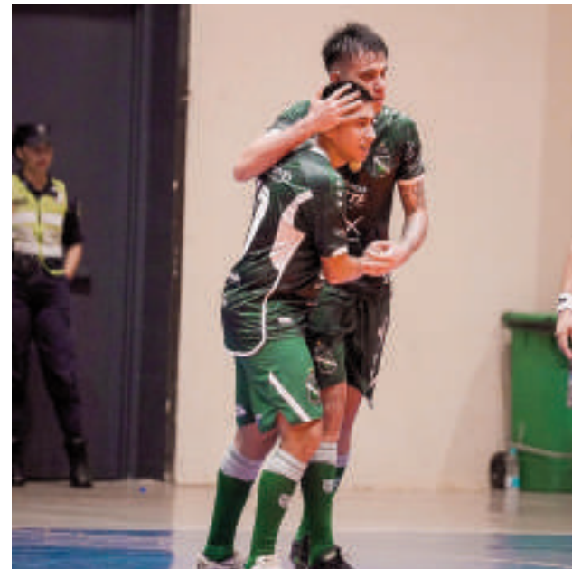
Los jugadores de Paranaense festejando uno de los goles en las eliminatorias.