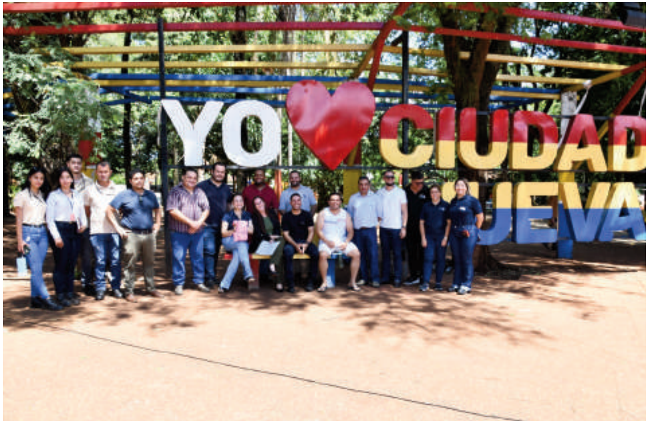
La presentación del mejoramiento de la plaza Ciudad Nueva del km 7 contó con la participación de autoridades nacionales y locales, y vecinos de la zona e invitados especiales.

“Hubo un pedido de los vecinos y recurrimos al director general de Itaipu, Justo Zacarías, para tratar de recuperar esta plaza; y no solamente ésta, sino