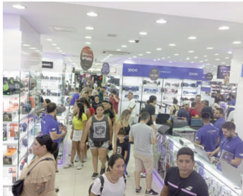
El movimiento comercial en Cellshop fue intenso este fin de semana.

Este fenómeno ha sido un respiro para los comerciantes de Ciudad del Este, quienes ven con buenos ojos la llegada de estos compradores, no solo por el impacto económico inmediato, sino también por la posibilidad de fidelizar una clientela recurrente. Con la expectativa de más fines de semana largos en la región, la ciudad se prepara para recibir nuevamente a una avalancha de compradores en busca de precios competitivos y una oferta variada de productos.