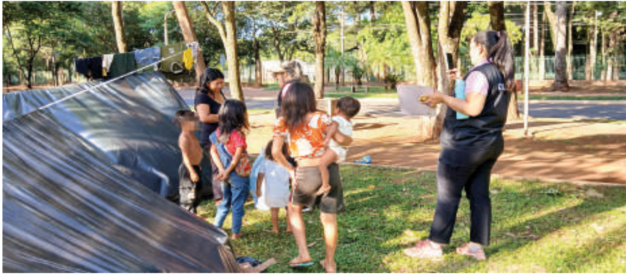
Las familias de pueblos originarios ocupan con carpas el exaeroperuero de CDE.

de nativos es una preocupación latente para los funcionarios de esta dependencia. Se está trabajando en conjunto con la Defensoría de Niñez y ya se le envió una nota al Instituto Paraguayo del Indígena (INDI), pero no hay respuesta hasta ahora.