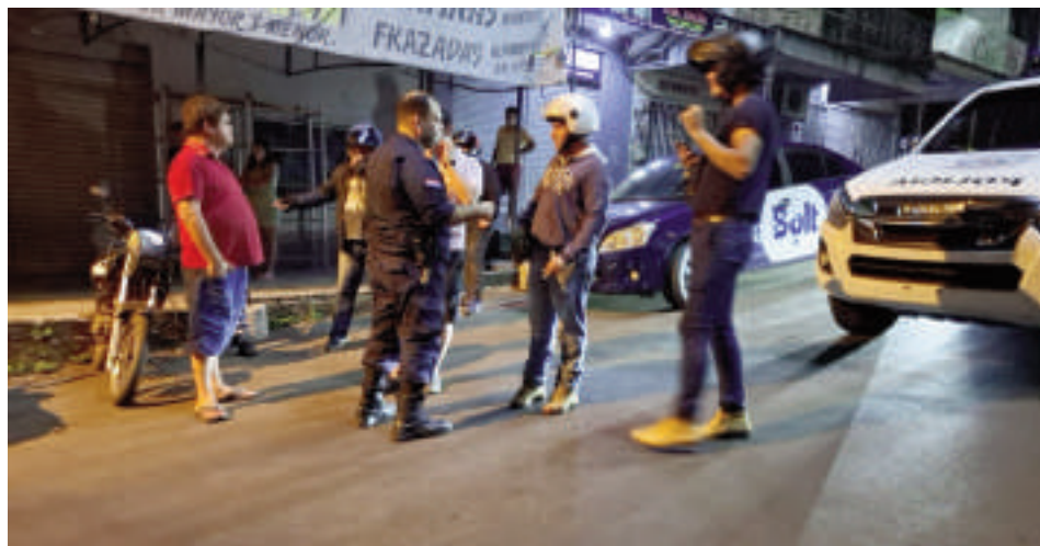
Tras el hecho, el presunto asaltante herido fue llevado al hospital, donde está internado con custodia policial.

Un presunto asaltante fue reducido tras recibir la paliza de su vida luego de intentar asaltar a un trabajador de la plataforma Motobolt. El hecho ocurrió alrededor de las 02:30 del sábado último sobre la avenida Regimiento Sauce, entrada al barrio San Rafael de Ciudad del Este. A punta de un cuchillo, el asaltante trató de despojar a la víctima de su dinero, celular y su moto, sin embargo, no se esperaba que reaccione y que sus compañeros de trabajo lo ayuden para reducir al delincuente y entregarlo a la Policía.