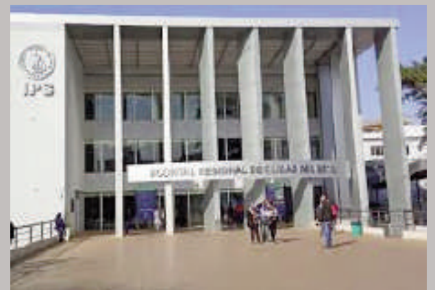
Los pacientes renales del IPS no quieren el traslado lejano.

Igualmente, ya se pusieron a averiguar y los datos que consiguieron son que los dos centros especializados de Ciudad del Este seguirán con su convenio, pero más reducidos en cuanto a cantidad. Del mismo modo, tratan de conseguir respuestas favorables desde los directivos de la previsual para no modificar el sector de estudios esenciales de los pacientes renales.