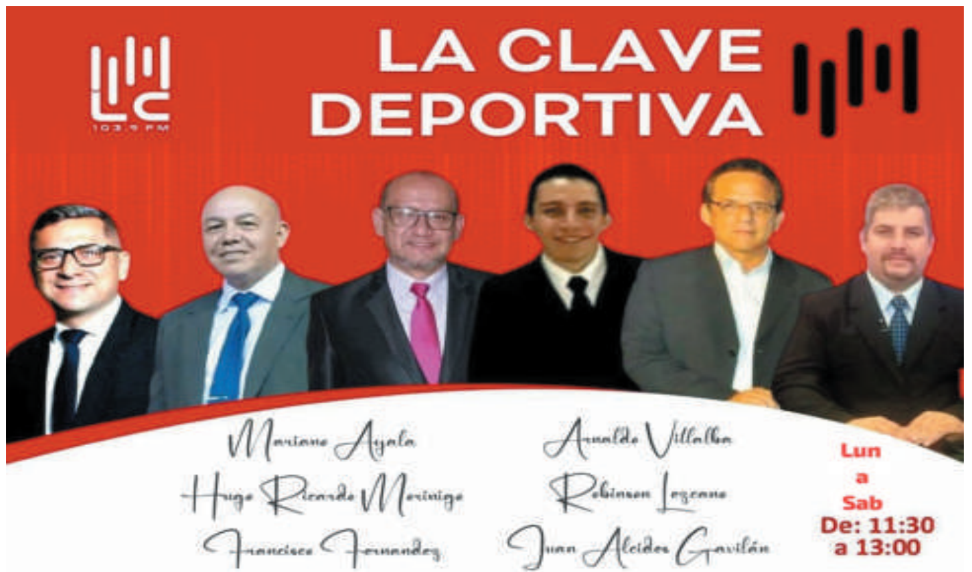
Los integrantes del equipo de La Clave Deportiva, nueva propuesta de radio La Clave.

La Clave Deportiva se convierte desde hoy en una de las propuestas más importantes en la grilla de programaciones de radio La Clave (103.9 FM). Se emitirá de lunes a sábado, de 11:30 a 13:00, con el equipo humano conformado por periodistas deportivos de primera y de larga trayectoria en el ámbito. Abordarán diversas disciplinas deportivas de la región, el país y mundo.