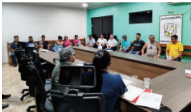
La audiencia se realizó en la sede municipal.

El intendente hizo un llamado a la comprensión de la población, explicando que las críticas recibidas por la falta de insumos y atención médica responden a una realidad compleja. Sin embargo, aseguró que se están realizando gestiones ante el Ministerio de Salud para ampliar la atención médica y garantizar un acceso equitativo a los servicios.