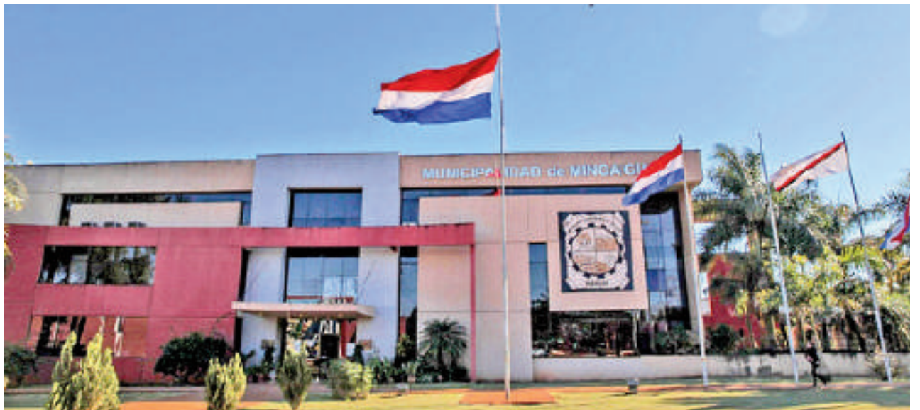
El sillón de la administración de la Municipalidad de Minga Guazú tiene varios aspirantes.