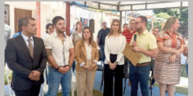
El pedido oficial se cumplió en un evento de inauguración en Franco.