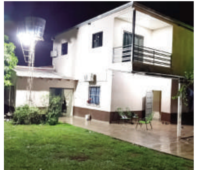
Los bandidos vestidos como policías irrumpieron en la vivienda del contratista de obras y se alzaron con el millonario botín y joyas.