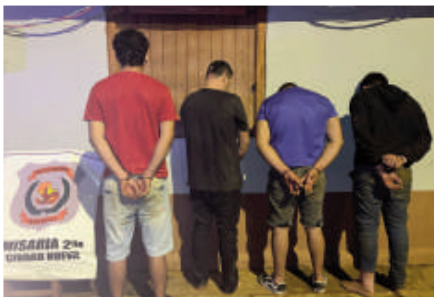
Los cuatro imputados por la Fiscalía tras provocar disturbios en un karaoke y agredir a policías.

Los sindicatos enfrentan el proceso judicial por el delito de resistencia, previsto en el Art. 296, inciso 1º, del Código Penal, en concordancia con el Art. 29, inciso 2º, del mismo cuerpo legal, debido a la resistencia al procedimiento. De igual forma, el fiscal Alcides Giménez solicitó la aplicación de medidas alternativas a la prisión preventiva.