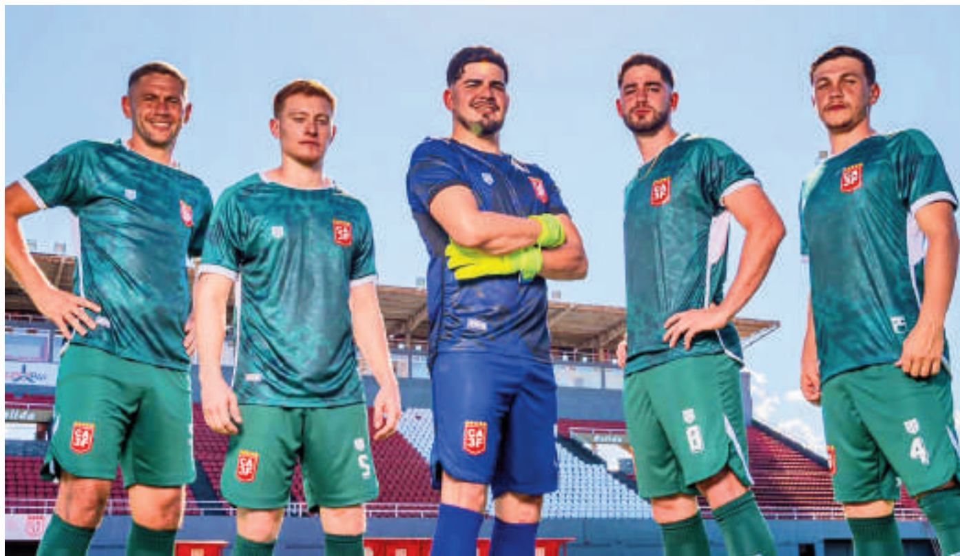
El conjunto rojo de la capital de Alto Paraná continúa en el trono como el equipo con más méritos del Interior del país.

El 3 de Febrero continúa como el equipo más grande del Interior del Paraguay, según las estadísticas que dio a conocer la paina Pasión del Interior Paraguay. En todas sus participaciones en Primera División obtuvo un total de 389 puntos y esta delante del 2 de Mayo de Pedro Juan Caballero que tiene 185 unidades.