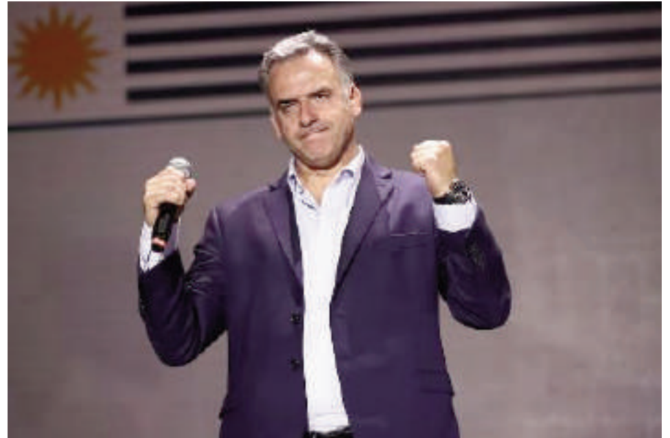
Yamandú Orsi, presidente de Uruguay.

En el ámbito de seguridad, el gobierno de Orsi promueve la instalación de un sistema de comisarías móviles y la ampliación del personal que están en las seccionales policiales. Propone implementar una campaña nacional de alfabetización en cárceles para alcanzar al menos 3.500 personas durante el período, además de la creación de 2.000 nuevos cargos policiales en el quinquenio para reforzar la capacidad operativa de la policía. El