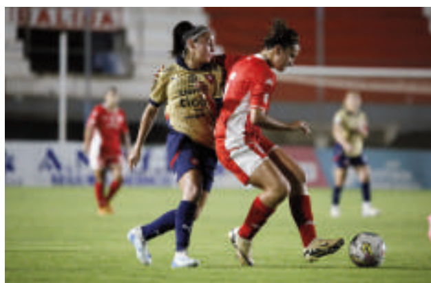
El cotejo dejó un resultado adverso para el conjunto rojo de Alto Paraná.