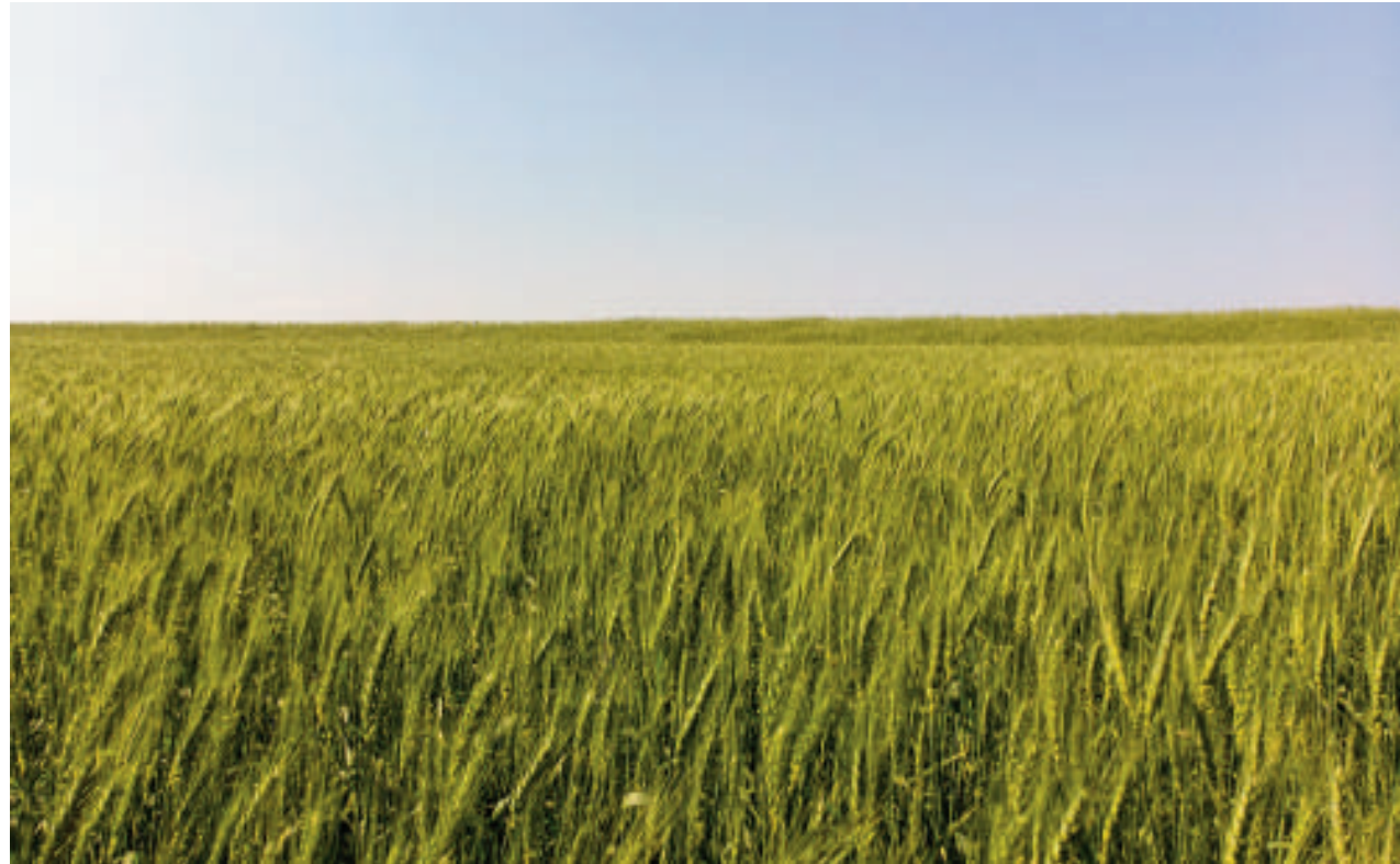
Los productores se alistan para el cultivo del cereal.

El Dr. Kohli, experto en producción de trigo, instó a prevenir el posible impacto de altas temperaturas y humedad con la utilización de variedades con mayor tolerancia a enfermedades de espigas. Con la mirada puesta en la producción de invierno, señaló que las últimas proyecciones climáticas hablan de una Niña que levantará la temperatura y junto a las precipitaciones