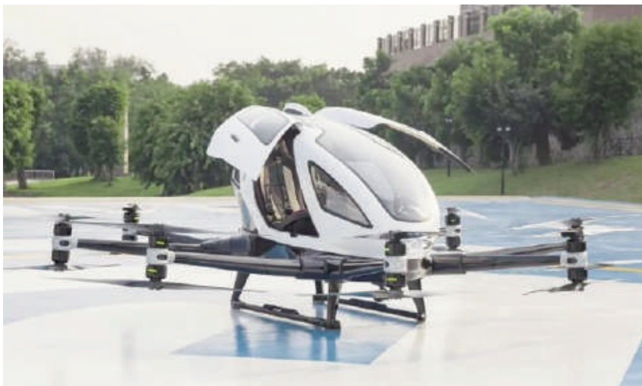
Así lucen los "taxis voladores" en China.