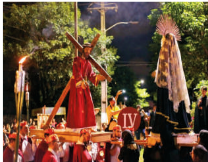
Cada año miles de feligreses participan del Vía Crucis.