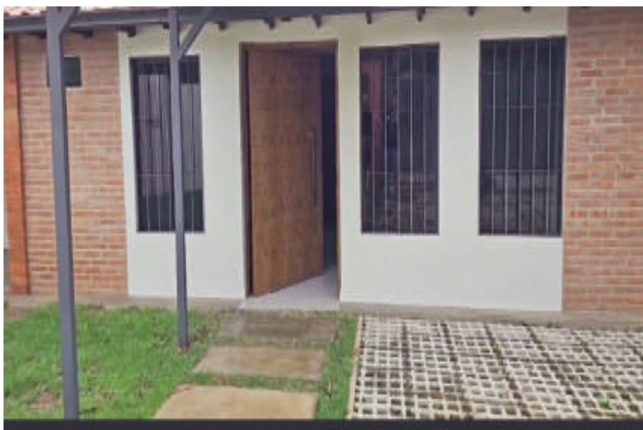
El bandido rompió una reja y abrió la ventana para ingresar al interior donde estaba el extranjero estudiando.

Un solitario delincuente ingresó a una vivienda, forzó la ventana de la parte trasera, y se encontró con el dueño en la sala, a quien a punta de un arma de fuego obligó a entregar todo lo que tenía, principalmente víveres que estaban en la cocina. El hecho se registró a las 04:00 del martes en el km 5,5 Acaray, barrio La Blanca de Ciudad del Este.