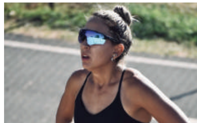
Destacadas actuaciones de los atletas de la Élite Deportiva de Paraguay que compiten en el Campeonato de Atletismo.

Mientras tanto, las competencias continúan con la participación de jóvenes atletas paraguayos que buscan consolidar su preparación con miras a los II Juegos Panamericanos Junior Asunción 2025.