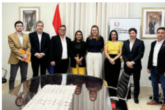
La reunión se realizó en la sede del Ministerio de Salud.

El encuentro, que tuvo lugar en la sede del Ministerio de Salud, fue el escenario donde los jefes comunales expusieron las carencias y desafíos que enfrentan sus distritos en materia de atención sanitaria. La falta de infraestructura adecuada, la escasez de insumos y la necesidad de personal médico especializado fueron algunos de los puntos clave abordados durante la reunión. Se hizo hincapié en la necesidad de fortalecer la infraestructura de los establecimientos médicos, muchos de los cuales se encuentran en estado deplorable. Se destacó la importancia de garantizar el abastecimiento de insumos médicos para evitar la interrupción de los tratamientos.