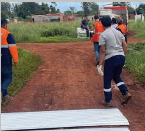
El trabajo de asistencia sigue llegando a familias afectadas.

Con el respaldo de la Municipalidad de Hernandarias y la organización de las parroquias San Francisco de Asís, Sagrado Corazón de Jesús y Nuestra Señora de la Asunción, el Vía Crucis Mayor 2025 promete ser una experiencia de profunda espiritualidad y unidad comunitaria. La invitación está abierta a todos los fieles para vivir una Semana Santa de reflexión y fe en Hernandarias.