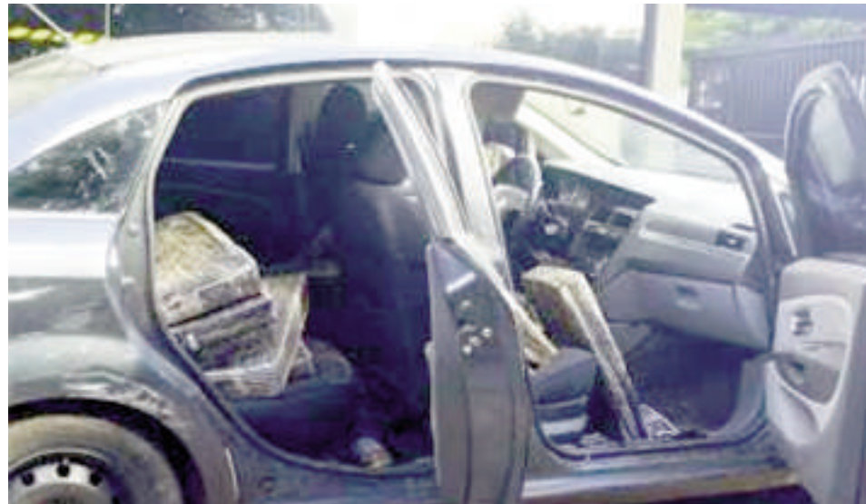
La carga estaba en un puerto clandestino e ingresó desde Paraguay.

situación, los agentes realizaron disparos contra los neumáticos del vehículo, aunque la primera tentativa de detención fue fallida. Finalmente, un bloqueo montado en la zona conocida como "Curva dos