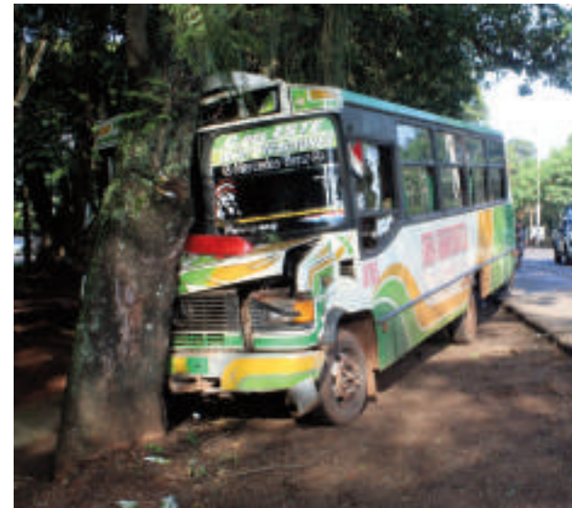
El ómnibus cruzó el paseo central hasta la Ruta PY02 y terminó incrustado en un árbol.

Por suerte, este accidente no pasó a mayores. A simple vista se puede observar que la unidad en cuestión tiene más de 30 años de uso, a lo que se suman las malas condiciones de mantenimiento. Los pasajeros afectados relataron que el bus perdió el control y cruzó de un extremo a otro el paseo