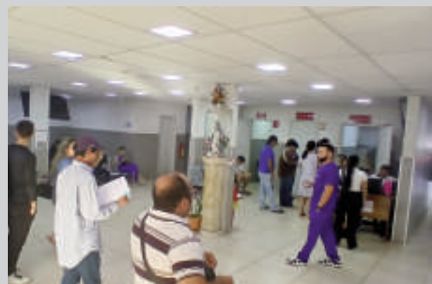
Las gestiones son intensas en Identificaciones de CDE.

El pasaporte tiene un costo de G. 240.000 y tarda entre 20 a 30 días su confección en la oficina de la capital del país. Para su entrega depende de la logística de la instrucción policial; salvo alguna urgencia del solicitante, se puede gestionar un traslado de manera particular y se gestiona para mandar traer por envíos particulares.