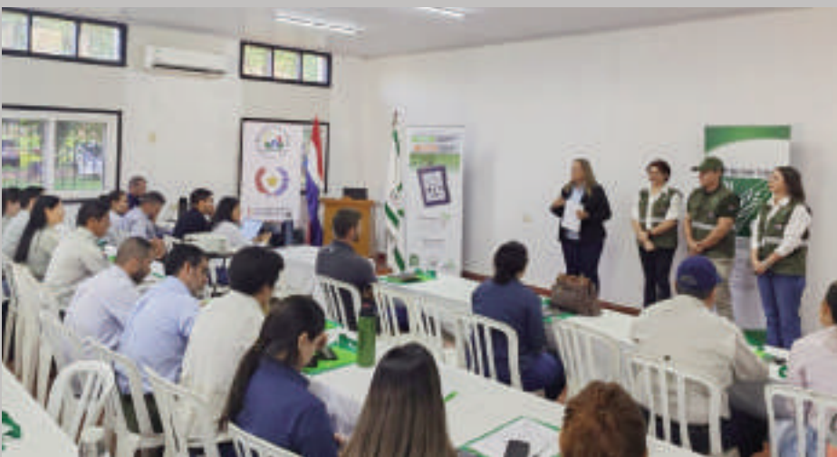
Aspecto de la capacitación llevada a cabo en Yguazú.

Unos 50 productores semilleros y responsables técnicos fueron capacitados sobre “Producción de Semillas Certificadas” en una jornada desarrollada por el Servicio Nacional de Calidad y Sanidad Vegetal y de Semillas (SENAVE) y la Asociación de Productores de Semillas del Paraguay (APROSEMP), llevada a cabo en CETAPAR, distrito de Yguazú, Alto Paraná. Los participantes llegaron desde varias localidades de Alto Paraná, así como de Caaguazú, Itapúa, y de otras zonas del país.