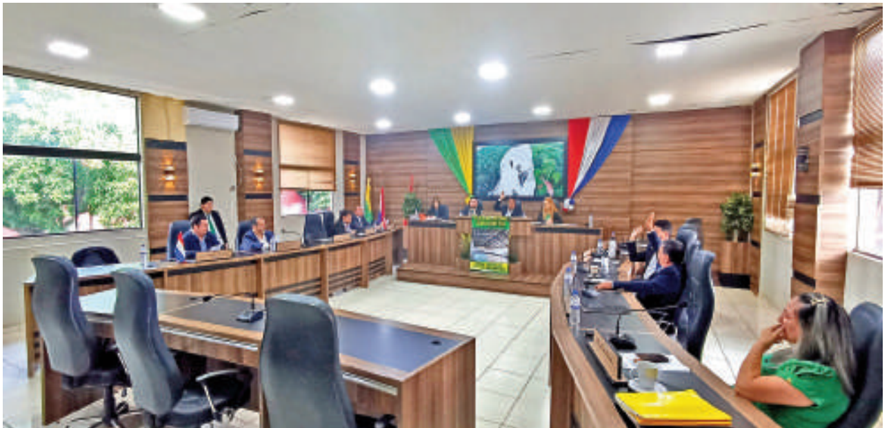
La sesión ordinaria de ayer no se desarrolló porque algunos concejales abandonaron la sala en Pdte. Franco.