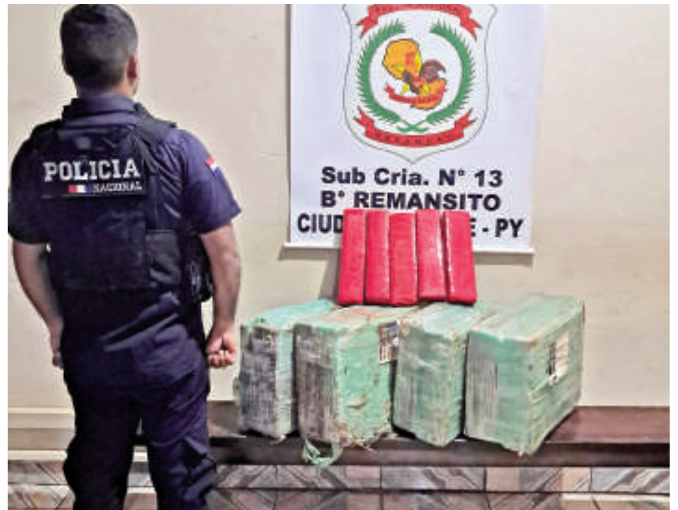
La droga fue trasladada a la base de la subcomisaría 13ª del barrio Remansito.

A esta situación se suma el hecho de que los agentes de la Armada Paraguaya, encargados de patrullar el río Paraná, tampoco logran detectar ni frenar el accionar de los narcotraficantes. El río Paraná es utilizado constantemente para el traslado de toneladas de droga hacia el Brasil, sin que las