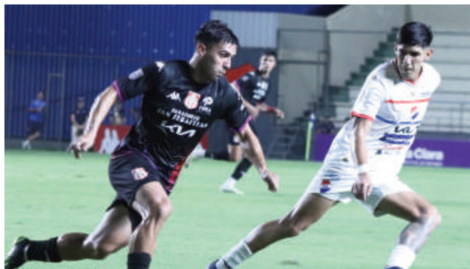
El conjunto mallorquino cayó en su visita a la Academia, en la capital del país.