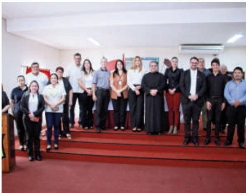
Autoridades municipales y eclesiásticas participaron del lanzamiento.

En un emotivo acto realizado en la sede de la Municipalidad de Hernandarias, se llevó a cabo ayer el lanzamiento oficial del Vía Crucis Mayor Hernandarias 2025, una de las celebraciones religiosas más significativas de la Semana Santa en Alto Paraná y el Paraguay. El evento es organizado conjuntamente por la Municipalidad local y la parroquia Sagrado Corazón de Jesús, con la participación de otras parroquias el municipio.