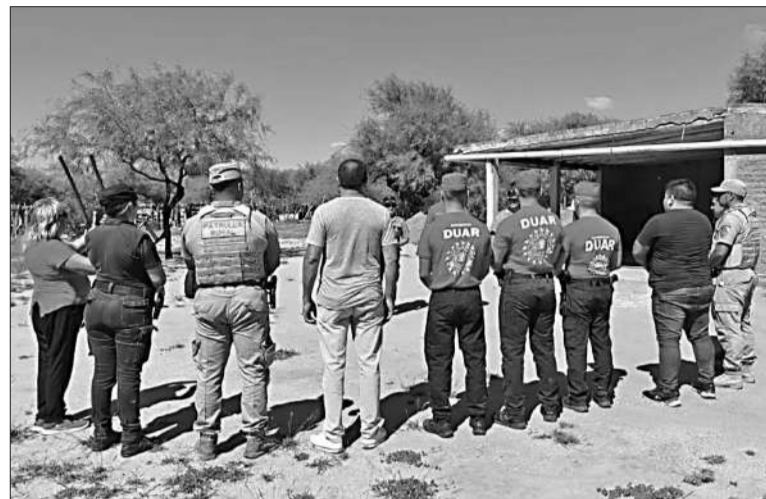
Se reforzó el operativo en Traslasierra, luego de un día sin novedades.