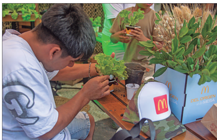
También hubo talleres de compost y huerta

- Muestra fotográfica itinerante "Del origen a la mesa": Podrá ser disfrutada por todos los clientes que visiten el local serrano. La exposición invita a descubrir, mediante imágenes, el recorrido que realizan los ingredientes desde los campos argentinos hasta cada local, destacando el trabajo de los productores para asegurar que los mejores resultados lleguen a cada mesa argentina.