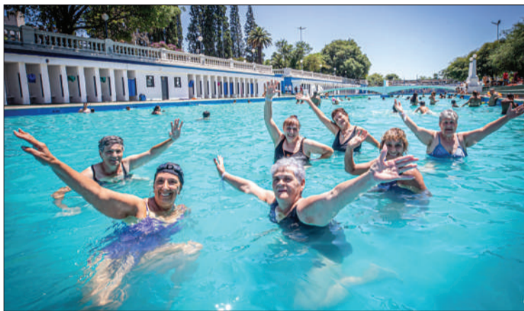
Los asistentes pueden disfrutar de la pileta libre y de actividades guiadas.

La Municipalidad de Córdoba invita a todos los vecinos que superen los 60 años a disfrutar de actividades recreativas en la pileta del Parque Sarmiento, todos los sábados hasta el 8 de febrero. Esta propuesta, perteneciente al programa "Verano para Grandes Personas", busca fomentar la inclusión social y promover un estilo de vida saludable durante la temporada estival. Los participantes podrán disfrutar de una amplia oferta de actividades al aire libre, que incluye caminatas, paseos guiados en espacios verdes, yoga, ejercicios respiratorios, baile con movimientos adaptados, juegos en el agua y talleres de manualidades. Las actividades están diseñadas y guiadas por un equipo de profesionales especializados. Para participar, es necesario que los interesados se presenten con anticipación y cuenten con una ficha médica completa o un certificado de buena salud vigente. Se recomienda llevar gorra de natación, protector solar, ropa para la pileta, toalla, calzado adecuado, y agua o merienda para el consumo personal. Las actividades se desarrollarán de 10 a 13 y los asistentes tendrán la posibilidad de quedarse a disfrutar de la pileta libre después de participar en las propuestas organizadas. Para más información, los interesados pueden consultar en los Centros de Día municipales, Centros de Jubilados, Espacio Illia, CiPEM y Cepram, donde se brindarán detalles sobre las actividades y los requisitos de inscripción.