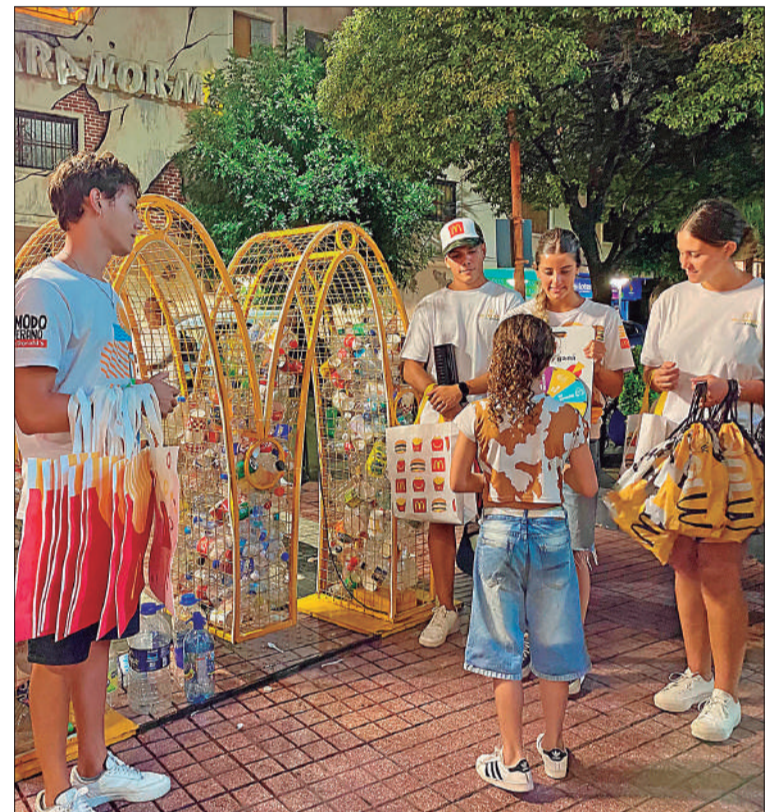
En los Eco Point hubo recolección de plástico y juegos.

Además, en el marco de su estrategia de RSE, Receta del Futuro, la marca instaló su característico punto de acopio frente al local, para promover la conciencia