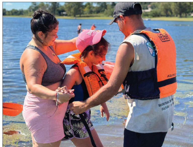
Los jóvenes participan de actividades adaptadas a sus necesidades.

Como parte de un plan maestro denominado Villa del Dique Inclusiva, en el que está trabajando la Municipalidad de dicha localidad, esta temporada se puso en marcha la primera escuela de verano para niños, niñas y jóvenes con diversas discapacidades, en recepción y apoyo de las familias. Con paseos en hidropedales, en lancha, y más juegos y deportes adaptados, la escuela de verano recibe a más de 10 chicos y chicas con todo tipo de discapacidades de la zona y pueblos vecinos, tres veces a la semana, en el renovado predio del camping y balneario municipal, con actividades totalmente gratuitas. La escuela tiene como objetivo estimular la movilidad y la independencia en entornos acuáticos, además de la fuerza y la motricidad fina a través de la práctica de deportes adaptados. El intendente Emiliano Torres remarcó que esta acción es parte de su estrategia de gestión: "Queremos que Villa del Dique sea inclusiva, que integre a todos sus vecinos y a quienes nos visitan. Por eso, incluimos rampas de acceso en el camping y balneario municipal, por eso incorporamos guías que hablan lengua de señas en varios de los recorridos, y por eso vamos a trabajar para que esta escuela, que integra a nues-