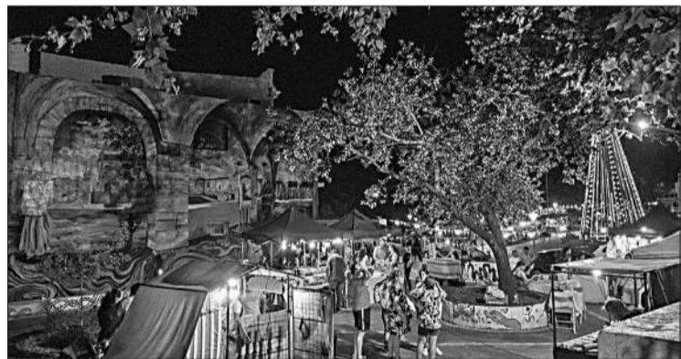
El sábado tendrá lugar una reedición de la noche de los museos.

Además se encontrarán abiertas las distintas ferias y paseos de la ciudad, con funciones de "Circo en La Plaza", a la gorra.