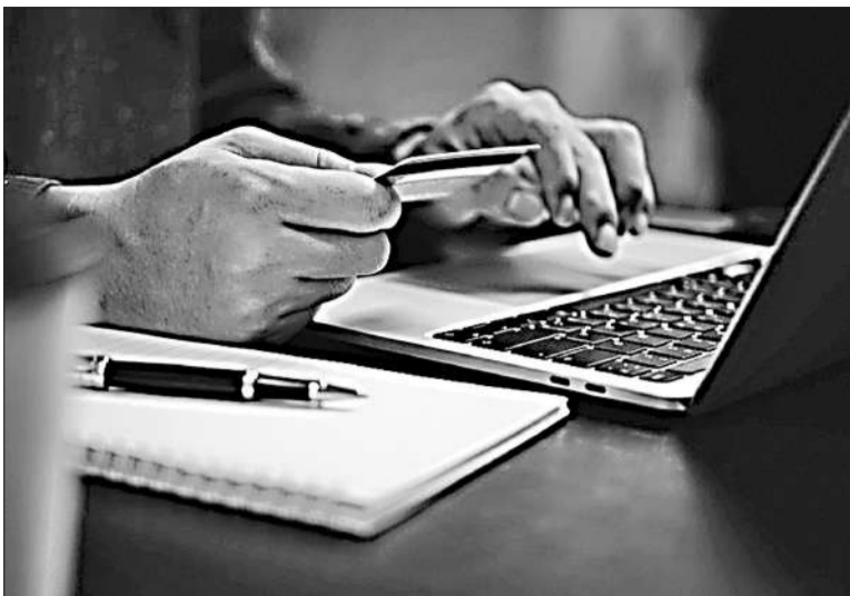
Se recomendó a los usuarios revisar sus resúmenes y reportar cualquier error.