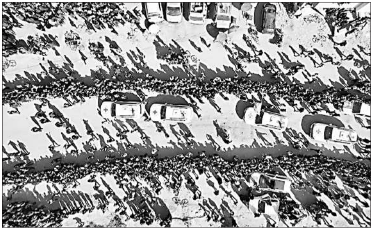
El convoy de la Cruz Roja trasporta entre la multitud a los rehenes.

GAZA.- Hamás efectuó ayer la mayor entrega de cautivos del alto el fuego en Gaza, en vigor desde el 19 de enero. En una ceremonia con la que nuevamente trató de demostrar su poder, liberó a tres israelíes y cinco tailandeses, todos secuestrados en el ataque del 7 de octubre de 2023. El primer ministro israelí, Benjamín Netanyahu, retrasó entonces su parte del canje (la excarcelación de 110 presos), en represalia por las escenas de caos durante la entrega de siete de los cautivos, "hasta que se garantice la liberación segura de los próximos rehenes" mañana. Los reclusos fueron bajados de los autobuses a los que ya habían subido. Pocas horas más tarde, Netanyahu desbloqueaba la excarcelación, al recibir las garantías. Entonces pusieron rumbo a la