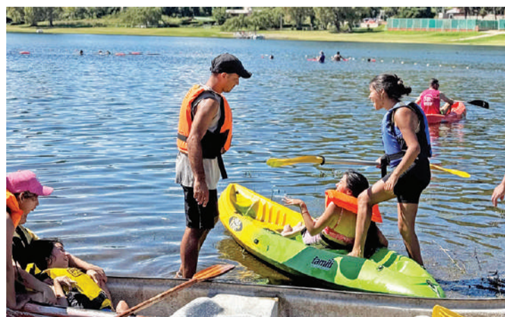
Cada una de las actividades está supervisada por un profesional.

■ Muchos provienen de la zona y de pueblos vecinos ■ Los juegos, adaptados a cada necesidad / PÁGINA 16