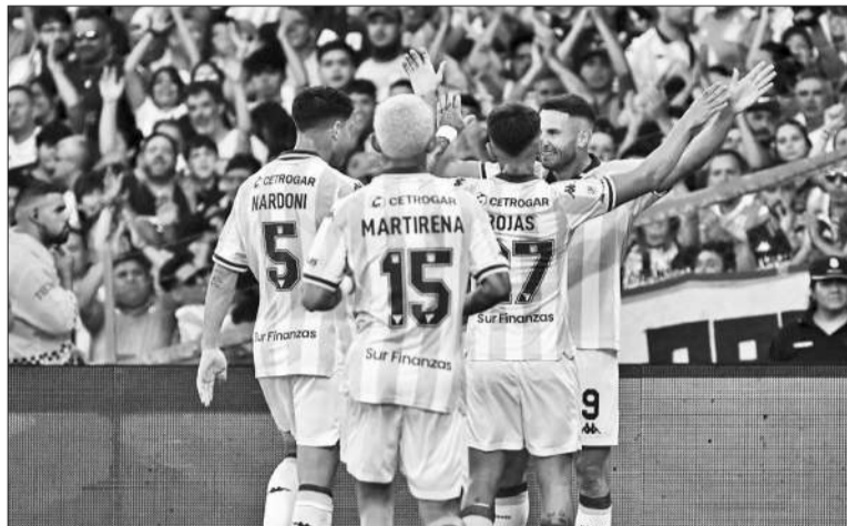
El plantel de la Academia celebra la goleada en el Cilindro de Avellaneda.

Pese al intento de Belgrano por empatar el encuentro, en una contra rápida de Racing, producto de una jugada colectiva que comenzó tras un