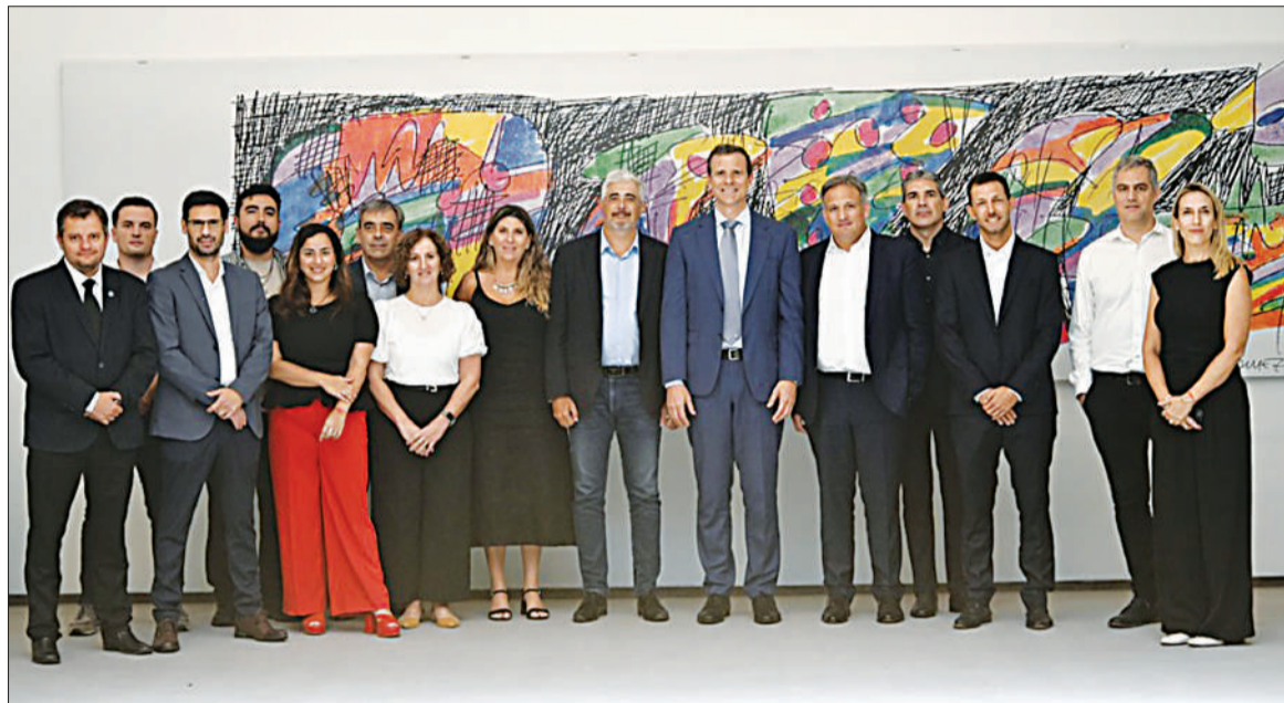
El acuerdo fue firmado por la cartera sanitaria provincial y las empresas Takeda y Amazon Web Services.

■ La iniciativa se anticipó a lo que se espera que será el brote en esta jurisdicción, previsto por los especialistas para Semana Santa, entre marzo y abril ■ Con este sistema de monitoreo se podrá centralizar la información epidemiológica en la provincia / PÁGINA 7