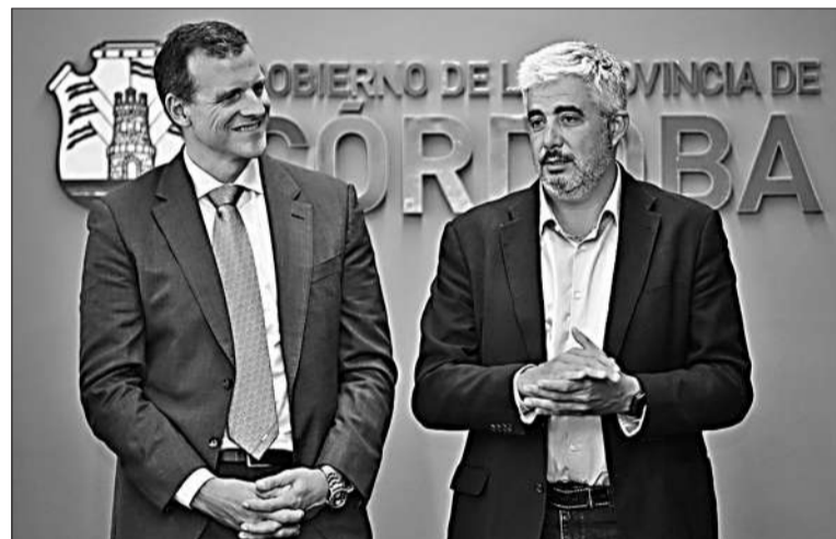
El ministro de Salud, Pieckenstainer (a la derecha), en la firma del acuerdo.

En un encuentro realizado en el Centro Cívico, el ministro de Salud de Córdoba, Ricardo Pieckenstainer, junto a autoridades de las empresas Takeda y Amazon Web Services (AWS), firmaron ayer un acuerdo que permitirá mejorar las herramientas de prevención, gestión y abordaje del dengue en la provincia. Esta alianza estratégica implica la implementación de la campaña "Dengue Navigator", a través de la cual se consolidarán datos epidemiológicos y se promoverá una gestión inteligente de la información. Esto permitirá a las autoridades tomar decisiones informadas, optimizar recursos y anticipar brotes de dengue con mayor precisión. Este entendimiento se anticipó a lo que se espera será el pico del brote de dengue en esta jurisdicción, previsto por los especialistas para Semana Santa, es decir entre marzo y abril. Asimismo, el proyecto tiene como objetivo centralizar la información epidemiológica a través de la creación de un repositorio de datos que integre aquellos provenientes de diversas fuentes nacionales y provinciales. Córdoba es la primera provincia del país en implementar esta iniciativa pionera en Latinoamérica y en el mundo. Pieckenstainer consideró el acuerdo como "un hecho