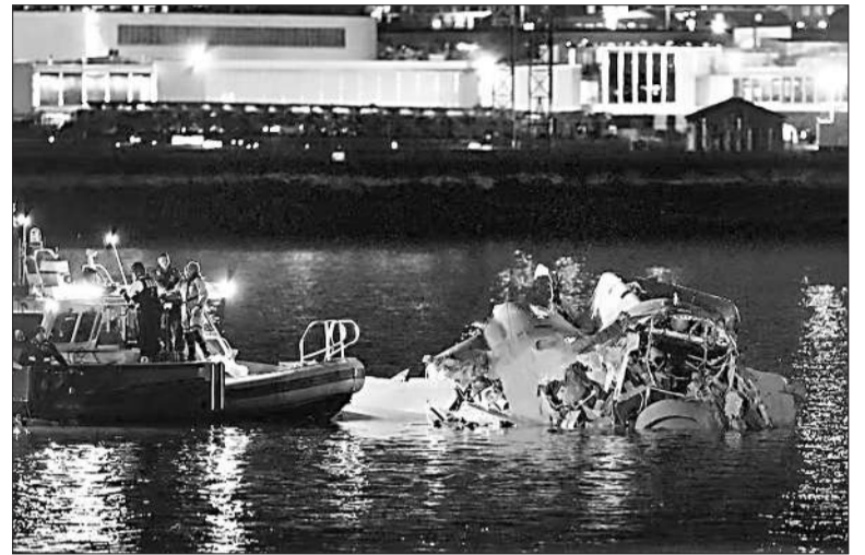
Unidades de emergencia responden cerca de los restos del helicóptero.

El accidente se produjo cuando el aparato chocó en pleno vuelo con un helicóptero Sikorsky H-60 Black Hawk que realizaba maniobras de entrenamiento con tres militares a bordo. Las autoridades confirmaron que no hay supervivientes del accidente. Los equipos de rescate recuperaron 28 cuerpos del avión y uno del helicóptero, pero ninguna persona viva. Un argentino y su hijo, nacido en Chile pero criado en una familia de argentinos, se encuen-