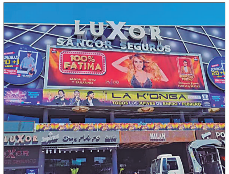
Fachada del Teatro Luxor en Villa Carlos Paz.