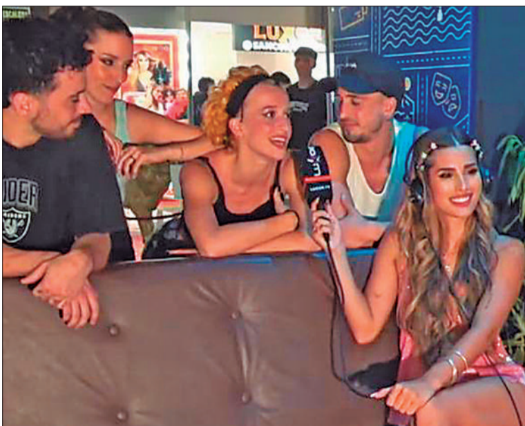
La ex Gran Hermano Julieta Poggi, con su equipo de "Zoom".