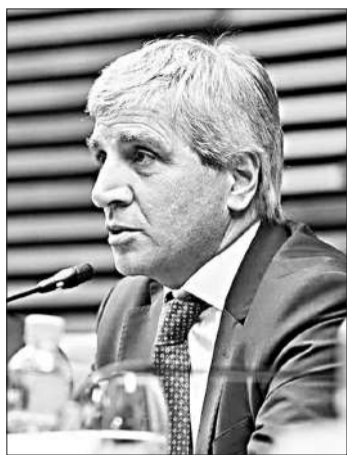
Caputo, ministro de Economía.

El ministro de Economía, Luis Caputo, renovó ayer sus reclamos a las provincias y municipios acerca de una reducción de la presión impositiva, a partir de la mejora en la recaudación que obtendrán por la recuperación de la actividad. “Redujimos a cero, y en tan solo un año, 15 puntos de PIB de déficit consolidado (Tesoro + Banco Central), bajando un 30% el nivel de gasto del Estado y terminando con la emisión monetaria”, señaló el ministro en su cuenta de “X”. Caputo afirmó que “estas medidas permitieron la baja fenomenal de la inflación (y con ella, el nivel de pobreza) y una pronta recuperación económica”. En esa línea, afirmó que “esta recuperación económica está haciendo mejorar la recaudación, generando recursos que, como prometimos siempre con el presidente @JMilei, estamos destinando a bajar impuestos, para que la gente pueda tener acceso a mejores bienes y a mejores precios”. “Quiero remarcar la importancia de reducir el déficit vía re-