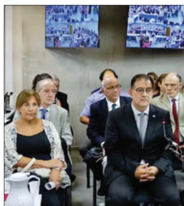
Los forenses, ayer en Tribunales.

■ "Hubo un patrón con intención criminal" ■ Descartan causa natural en los decesos / PÁGINA 6