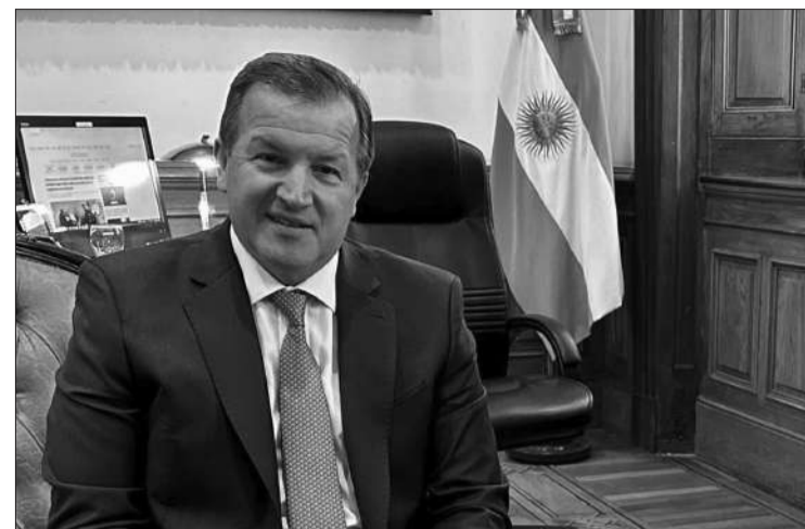
Serenellini renunció luego de mantener una tensa relación con Karina Milei.

El Gobierno realizó importantes cambios en su gabinete, con la salida de Eduardo Serenellini de la Secretaría de Prensa y la designación de Santiago María Castro Videla como nuevo Procurador del Tesoro. Serenellini presentó su renuncia “por razones personales” y expresó: “Agradezco su confianza y conservo una gran amistad”, refiriéndose a su relación con el presidente Milei. El funcionario había mantenido desde el inicio de la gestión una tensa relación con Karina Milei. En otro orden, el Ejecutivo nombró a Castro Videla, un abogado especializado en derecho administrativo, para reemplazar a Rodolfo Barra, quien dejó el cargo por diferencias con el Gobierno. Según el vocero presidencial Manuel Adorni, el presidente Milei destacó que “el mejor para cubrir ese lugar ya no es más Barra, sino Santiago María Castro Videla”. El procurador es considerado un experto en derecho constitucional y procesal, y es reconocido por su labor académica. En sus nuevos desafíos, Castro Videla tomará las riendas de una función clave en el Gobierno, encargada de defender los intereses de la Nación. La salida de Barra se produjo tras un dictamen que generó malestar por su desacuerdo con el plan de recortes de gastos del Ejecutivo, aunque el ex procurador se mostró agradecido por haber podido colaborar con la gestión de Milei. La renovación del gabinete “parece alinearse” con el objetivo del Gobierno de optimizar funciones clave y reforzar su equipo en momentos decisivos.