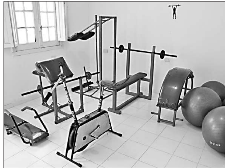
Se reacondicionó una sala para actividades físicas con nuevos aparatos.

también se avanzó con trabajos de refacción, remodelación y pintura, junto al acondicionamiento de una sala existente, para la puesta en marcha de un espacio para realizar actividades físicas. La misma se la equipó con aparatología como banco de press plano, banco scott bíceps, máquina para pantorrillas, ejercitador para abdominales, pelotas de pilates, bicicleta fija, colchonetas, discos de peso y mancuernas, entre otros elementos. Las actividades en esta nueva sala, se encuentran supervisadas por una kinesióloga y una enfermera. Asimismo, con los recursos del Fondo de Fortalecimiento se pintó e impermeabilizó una superficie de 900 metros cuadrados del área externa de la dirección, el patio de nutrición y el patio interno del área de internación. También se realizó la pintura de una superficie de 70 metros lineales, de las paredes que dan a la calle Arenales. Adicionalmente, se refaccionaron, repararon e impermeabilizaron las paredes del patio de la cisterna y se instalaron tres bombas de agua junto al recambio de cañería.