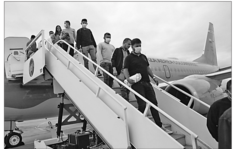
Unos 200 ciudadanos deportados de Estados Unidos llegaron ayer a Bogotá.

La medida desató una lluvia de críticas, ya que podría afectar a programas esenciales de educación y salud de los que dependen millones de estadounidenses. La Administración justificó la decisión argumentando que es necesario garantizar que todos los fondos cumplan con las recientes órdenes ejecutivas firmadas por Trump, que incluyen restricciones a los derechos de