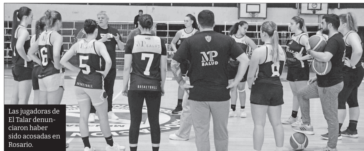
Las jugadoras de El Talar denunciaron haber sido acosadas en Rosario.