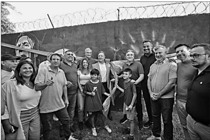
El Gobernador habilitó el espacio en barrio Benjamín Cabral.