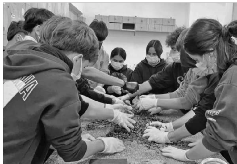
Los estudiantes ganaron con anterioridad el concurso iberoamericano de IA.

Estudiantes de quinto año de la Escuela Superior El Nacional de La Carlota lograron el segundo lugar en el III Premio de Innovación y Objetivos de Desarrollo Sostenible (ODS) de España. El equipo cordobés conquistó el segundo premio, que constaba de 5.000 euros, con un proyecto titulado "Tu colilla, nuestra agenda inteligente". Con el premio planean comprar equipos de laboratorio para continuar con el proyecto y también para desarrollar otros nuevos. A través de un procedimiento, las colillas se vuelven papel reciclado para agendas sostenibles. Estas agendas, además, integran tecnología interactiva mediante códigos QR.