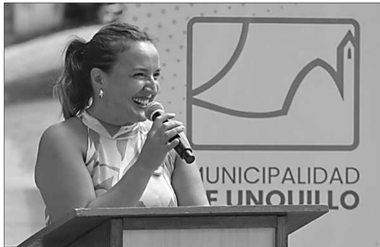
La Vicegobernadora presidió la habilitación de la guardia urbana en Unquillo.