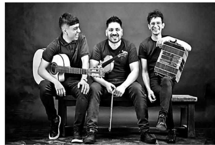
El multifacético grupo contemporáneo Átoj será el protagonista de la primera edición.

El Museo Metropolitano de Arte Urbano será el escenario los jueves de verano una propuesta que combina música y danzas