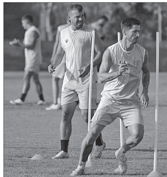
Racing necesita sumar para quedar en solitario en lo más alto de la Zona A.

El cotejo, que en un principio iba a jugarse el domingo pero debió adelantarse por el clásico entre Belgrano y Talleres, será transmitido por TyC Sports Play y el árbitro será Maximiliano Macheroni.