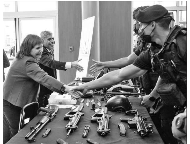
Las fuerzas de seguridad cordobesas recibieron a la ministra Bullrich.

Según la ministra, la Ley Anti Barras transformará el escenario del fútbol argentino, estableciendo un marco legal más estricto para erradicar la violencia. Al respecto, Bullrich había señalado hace unas semanas que el proyecto busca "prohibirle la entrada a la cancha permite acabar con negociados entre clubes y barras. El 2024 fue el año más importante en derecho de admisión, en gente que no pudo entrar a los estadios.