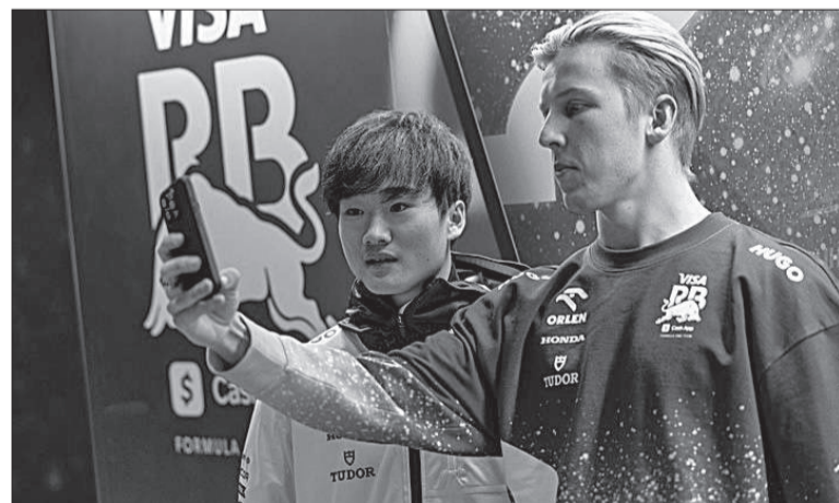
El piloto japonés Yuki Tsunoda junto al neozelandés Liam Lawson.

“Fue difícil ver a Liam luchar con el RB21 (el monoplaza) en las dos primeras carreras y hemos tomado la decisión de manera colectiva de proceder a un cambio anticipado”, explicó Christian Horner, director de Red Bull. La noticia ya se había fil-