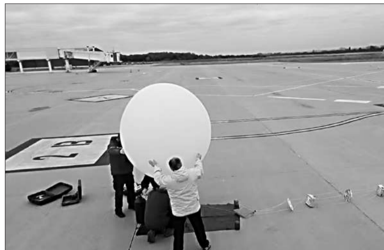
Los globos estratosféricos llevarán sensores y equipos de comunicación.

En el caso de la UNC, son usados para instalar dispositivos que a futuro estarán a bordo de un saté-