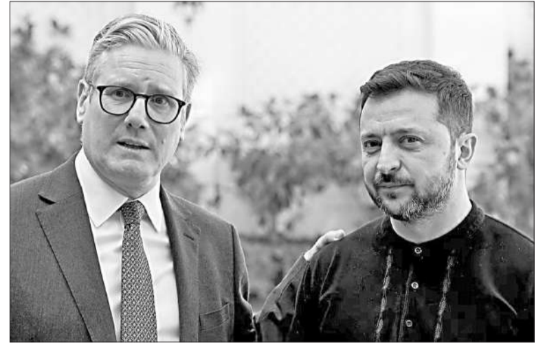
El premier británico Starmer junto al presidente ucraniano Zelenski.

Como parte de las conversaciones con mediación de Estados Unidos, Rusia había reclamado como condición para declarar un alto