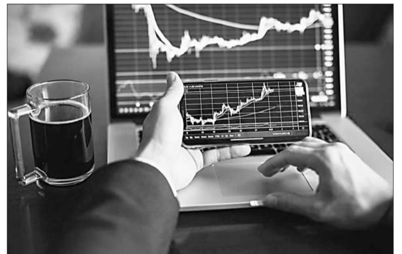
La "Intermediación financiera" fue el rubro que más creció en el año.

"Comercio mayorista, minorista y reparaciones" fue, a su vez, el rubro con mayor incidencia positiva del Emae, seguido por "Intermediación financiera" e "Industria manufactu-