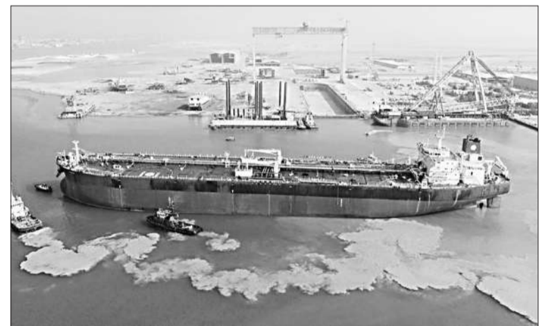
Un petrolero vendido a Venezuela se ve en la costa de Bushehr, en Irán.

Por su lado, Rubio sostuvo que "Estados Unidos no tolerará que