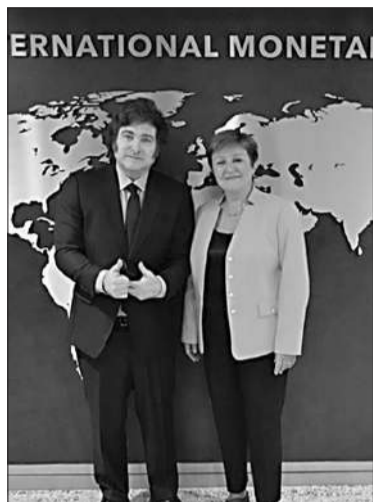
Milei con Georgieva en el FMI.

"El nivel de respaldo que en unos días tendrán los pasivos del Banco Central no lo hemos tenido nunca. Ni siquiera en la convertibilidad y además con superávit fiscal", agregó Caputo, quien enfatizó que "con esto vamos a terminar con el stress