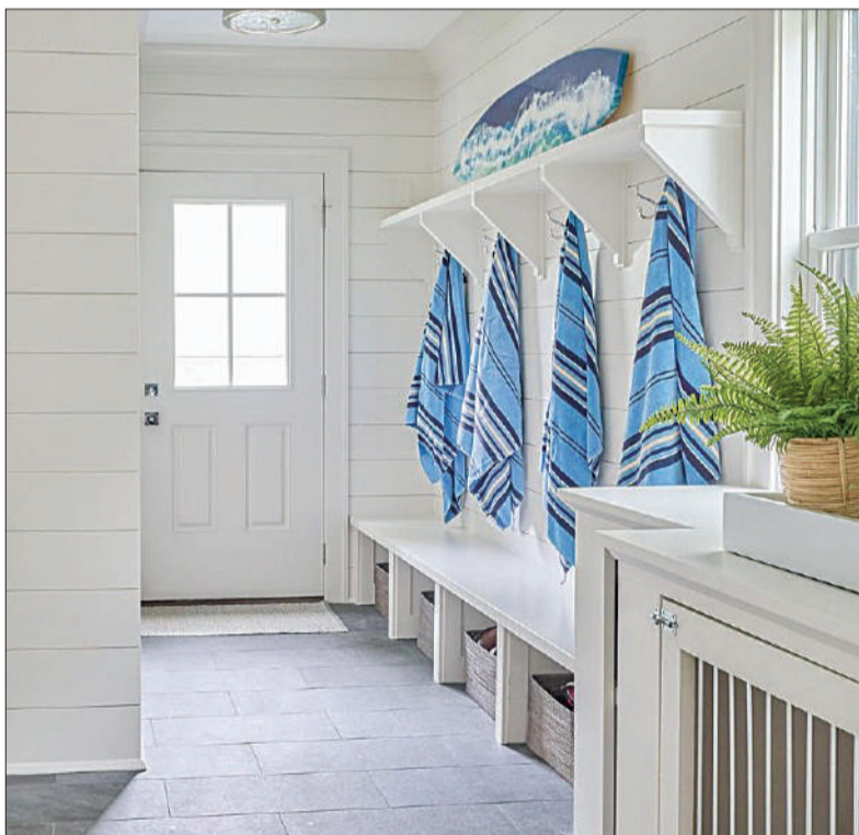
Llegan para optimizar los espacios exteriores o semicerrados como galerías, cuartos intermedios, incluso lavaderos.