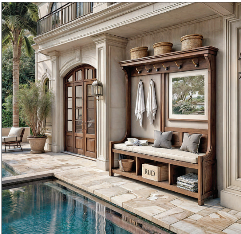
Los mudrooms o recibidores se reinventan y asumen nuevo protagonismo: ahora se adaptan a patios y jardines.