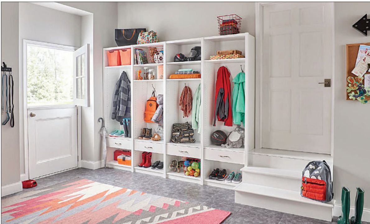
Los mudrooms o recibidores se reinventan y asumen nuevo protagonismo: ahora se adaptan a patios y jardines.

tando la vista, dan indicio de las actividades que tienen los integrantes de la familia.