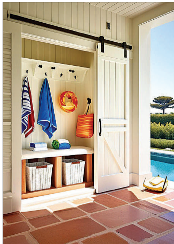
No sólo es un sitio más de la casa, además puede convertirse en un perfecto espacio de guardado.