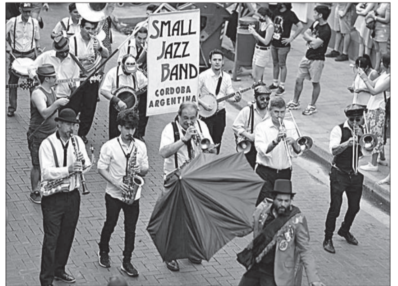
La Small Jazz Band será la atracción principal del desfile por calle Belgrano.

Refiere a que era el último día para disfrutar de los placeres tanto culinarios como musicales en sociedad, antes de la época de abstinencia que marca el inicio de la Cuaresma y la Semana Santa.