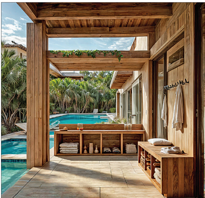
No dejan de lado la estética, pero flexibilizan sus pretensiones para acomodarse al ritmo cotidiano de la familia.