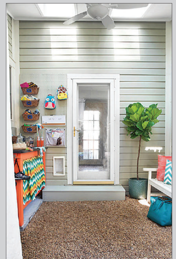
Son lugares prácticos que no renuncian a la estética y ayudan a mantener el orden y la limpieza interior.