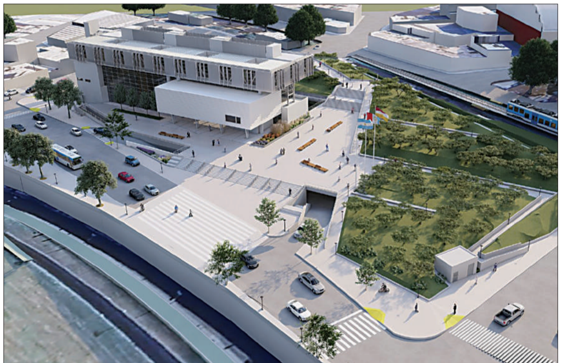
Estará emplazada junto a la nueva sede del cuerpo municipal, sobre Avenida Costanera Norte.

■ El creador del token empezó a mover el dinero recaudado ■ Mientras, Milei propone autoinvestigarse / PÁGINA 3