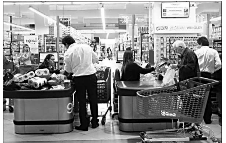
Las ventas en supermercados tuvieron caídas en todos los meses del año pasado.

En verdad, el resultado se da luego de que se registraran números negativos en todos los meses del año: comenzó con una caída del 13,9% en enero, pero siguió con caídas en febrero (-11,4%) y marzo (-9,3%), abril (-17,6%), mayo (-9,8%) y junio (-7,3%). Ya en el segundo semestre, el peor dato fue el de octubre