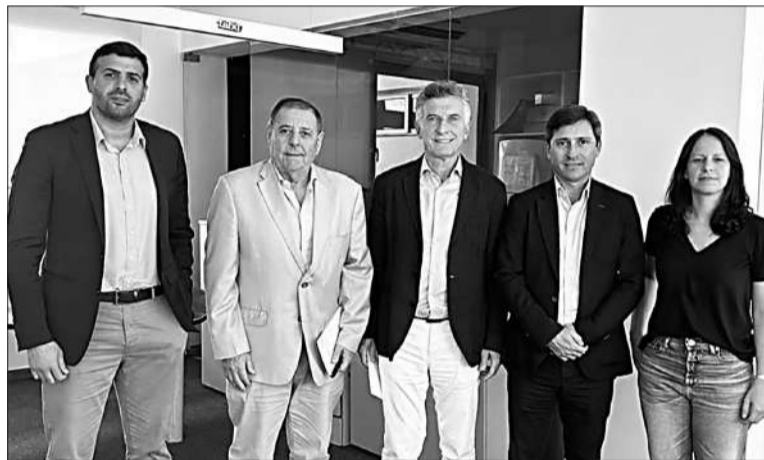
Macri con los senadores del PRO, quienes cuestionaron la medida oficial.

El especialista explicó que la potestad del Ejecutivo de designarlos "en comisión" no se aplica en cualquier caso sino "cuando se produzca una vacante durante el receso de la Cámara de Senadores, exista una situación inusual que lo justifique y