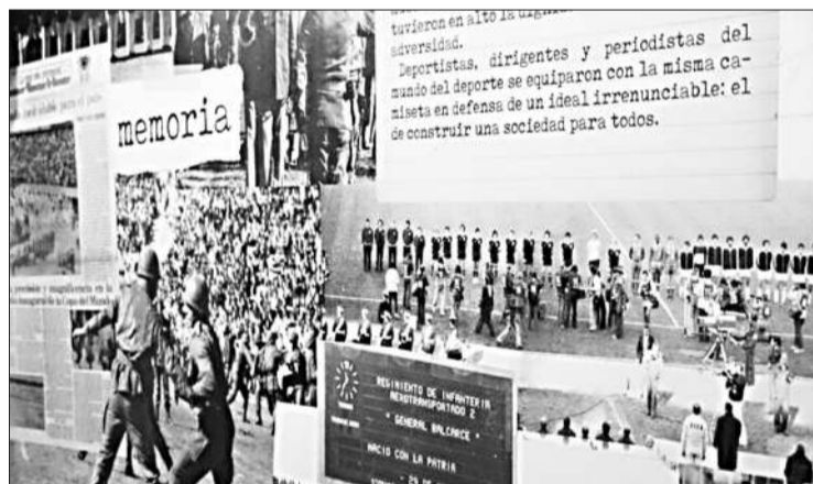
La exposición aborda notas deportivas producidas en la última dictadura.

El Museo Provincial del Deporte, en el marco de la Semana de la Memoria por la Verdad y la Justicia, inauguró ayer una exposición que explora el rol de la prensa en el contexto del último régimen militar impuesto entre 1976 y 1983. La muestra estará disponible hasta el 30 de marzo y ofrece una mirada sobre cómo los medios de comunicación, particularmente el periodismo deportivo, se vio afectado por la censura y la intervención estatal durante esos años. Durante la dictadura, la prensa fue uno de los sectores más atacados por el régimen, que no solo persiguió a opositores políticos, sino que también intervino en la cobertura mediática de todos los ámbitos, incluido el deporte. Esta exposición, organizada por la biblioteca del museo, invita a los visitantes a reflexionar sobre el impacto de este control sobre la información. A través de una selección de textos, imágenes y documentos de la época, se busca responder preguntas clave sobre cómo los medios cubrieron los eventos deportivos más relevantes de aquellos años, y de qué manera el contexto político influyó en la forma de narrar estos sucesos. Uno de los ejes principales de la muestra es la cobertura mediática del Mundial de Fútbol de 1978 y cómo Córdoba, una de las principales sedes del torneo, fue testigo de la dualidad entre la alegría popular y la opresión del régimen. La exposición, abierta al público de 10 a 13 y de 14 a 18, no requiere de reserva previa para asistir.