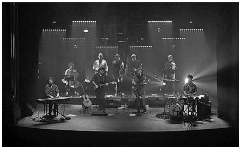
La formación tocará el viernes, en el Teatro Ciudad de las Artes.

El conjunto que rinde tributo al rock nacional presenta un espectáculo en el que interpretan obras de Soda Stereo, Fito Páez y Charly García