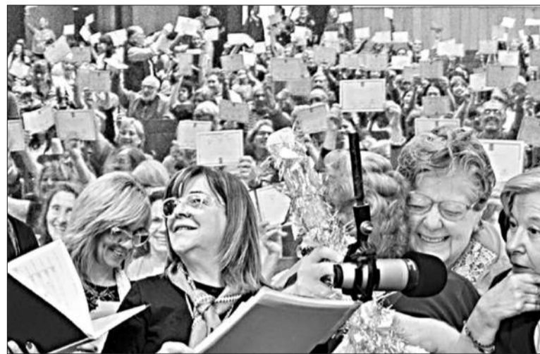
La oferta académica abarca temáticas como tecnología, idiomas, cine e historia.

Estos programas socioculturales y recreativos tienen como objetivo revalorizar la autoestima, la imagen social y los derechos de las personas mayores, promoviendo un envejecimiento activo, digno y saludable en un entorno de interacción social.