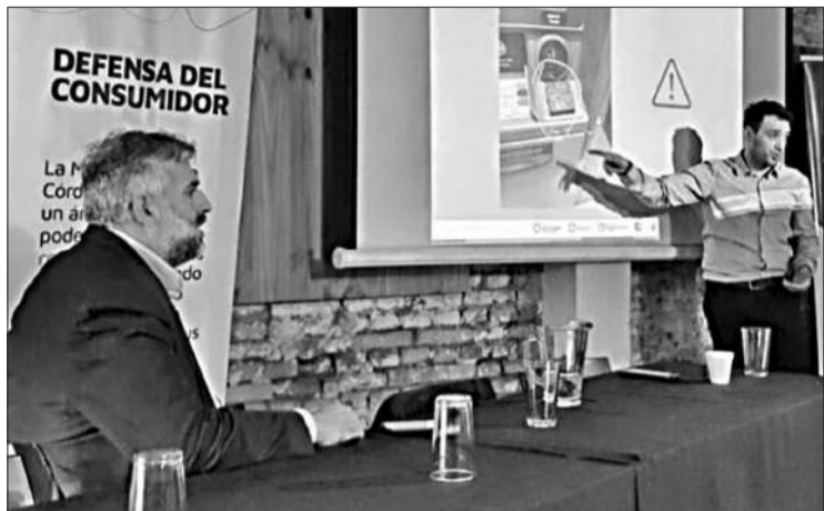
El encuentro se desarrollará en el SUM del CPC Mercado, en Oncativo 50.

Frente a las estafas virtuales y ciberdelitos que cada vez son más frecuentes en estas épocas, la Municipalidad de Córdoba ofrecerá tres talleres abiertos y gratuitos para la prevención destinados a adultos mayores. Hoy, en el SUM del CPC Mercado, ubicado en la calle Oncativo 50, se llevará a cabo el primero a las 11. Mientras que el segundo y el tercero se realizarán el 10 y 16 abril. Tales talleres brindan herramientas prácticas y sencillas para identificar y prevenir las estafas virtuales y aprender a operar en línea de forma segura. Los profesionales a cargo, pertenecientes a la Dirección General de Mediación Comunitaria y Defensa del Consumidor de la Municipalidad, compartirán estrategias y consejos sobre cómo operar en línea protegiendo los datos personales. Las próximas fechas son el jueves 10 de abril, en el CPC número 7 Empalme (avenida Amadeo Sabattini 4650) y el miércoles 16 de abril, en las Oficinas de Defensa del Consumidor de la Municipalidad (Chacabuco 737, séptimo piso). Estos talleres están diseñados para que los participantes adquieran conocimientos sobre cómo detectar mensajes sospechosos, así como también cómo proteger sus dispositivos de posibles amenazas. Asimismo, se abordarán temas sobre la importancia de las contraseñas seguras y la verificación de la identidad de los sitios web antes de realizar cualquier transacción. De esta forma, los adultos mayores podrán mejorar su seguridad digital.