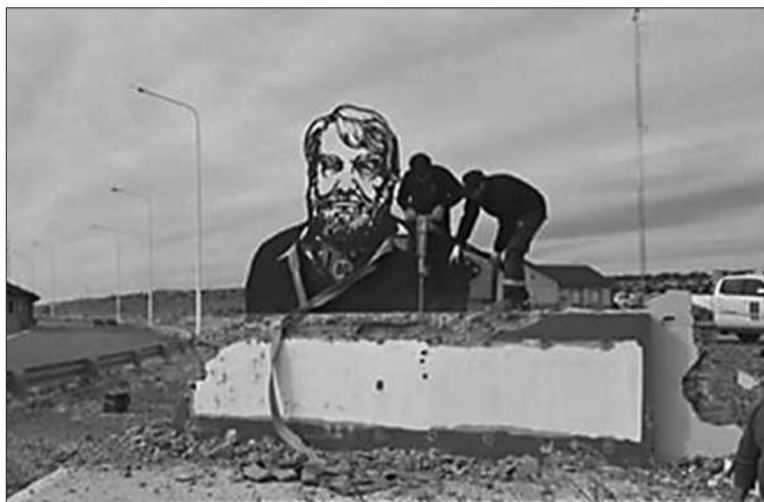
El Gobierno demolió un monumento a Osvaldo Bayer en Río Gallegos.

"No tengo dudas que el kirchnerismo es destituyente, y ha comenzado ese proceso con la marcha anterior al miércoles pasado, a partir de los errores no forzados (del Gobierno). Ellos sienten que empiezan a tener derecho a plantear algunas discusiones. No hay duda que ha comenzado un proceso destituyente, pero no van a poder lograrlo", sostuvo Espert, que aseguró que los que marcharon el Día de la Memoria son "los que reivindican a los asesinos y los terroristas que son parte del baño de sangre que se transformó la Argentina del '70, hasta que volvió