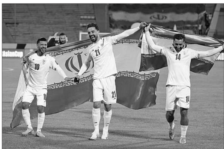
Irán buscará superar por primera vez en su historia la fase de grupos.

CON UN EMPATE ANTE UZBEKISTÁN, EL EQUIPO PERSA ASEGURÓ SU SÉPTIMA PARTICIPACIÓN MUNDIALISTA