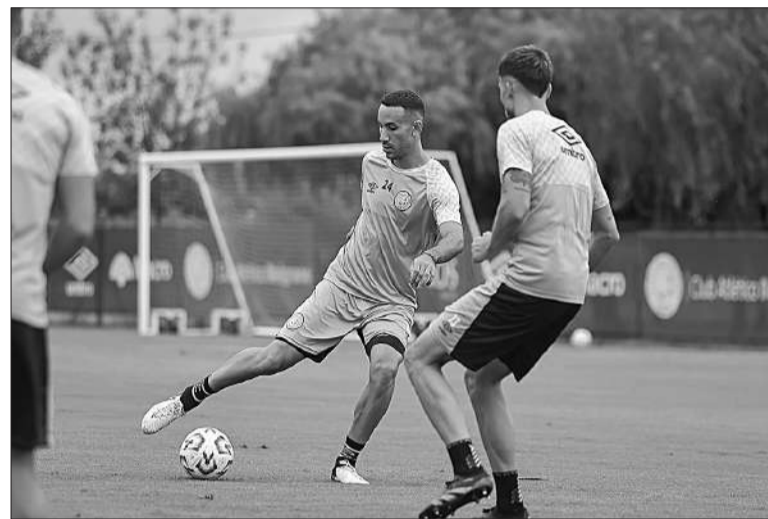
El plantel del Celeste entrenó ayer a puertas abiertas en Villa Esquiú.

Consultado en si habrá muchos cambios para el clásico, dijo: “Buscamos tener una identidad