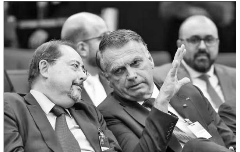
Bolsonaro asistió a la sesión de la Corte mientras se decide si irá a juicio.

Paulo Gonet, el procurador general de la República, defendió al inicio de la sesión —la primera de las tres previstas para el análisis— que Bolsonaro y Walter Braga Netto, su ex candidato a vicepresidente en 2022 y otro de los ocho imputados, "aceptaron, estimularon y realizaron" actos contra el Estado democrático de Derecho.