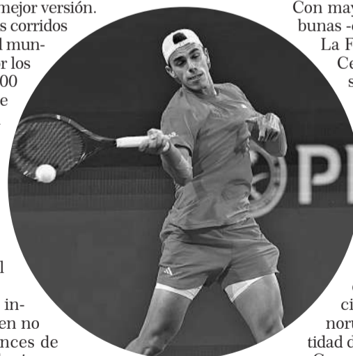
Antes de la lluvia, Cerúndolo dominó a Ruud en todas las fases de juego.

Hoy, Cerúndolo deberá medirse con el búlgaro Grigor Dimitrov (15), que el año pasado cayó en la final del torneo ante el italiano Jannik Sinner. El europeo llegó a cuartos después de haber superado al local Brandon Nakashima (32), por 6-4 y 7-5.