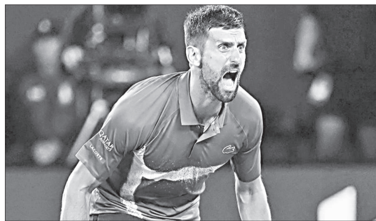
Novak Djokovic festeja tras derrotar a Carlos Alcaraz en Melbourne.

EL SERBIO SE IMPUSO POR 4-6, 6-4, 6-3 Y 6-4 EN TRES HORAS Y 37 MINUTOS