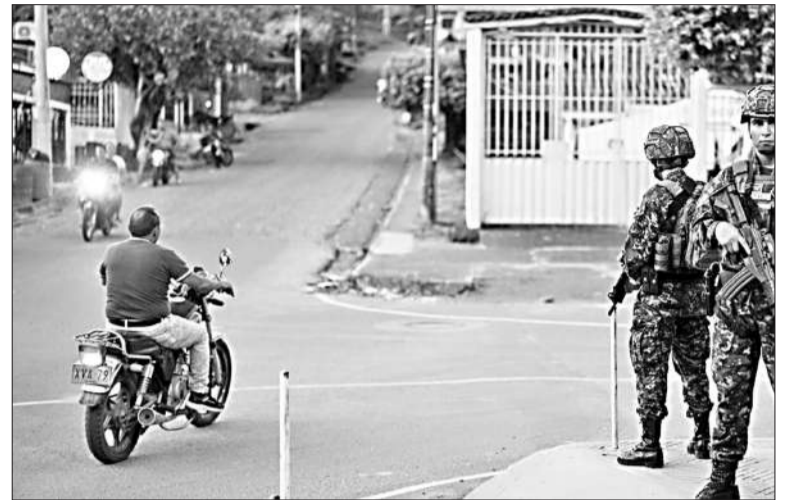
Soldados colombianos tras el sangriento enfrentamiento armado en Tibu.

El lunes, el Ministerio de Defensa informó sobre la muerte de 20 guerrilleros en el departamento amazónico del Guaviare (sur) por choques entre dos facciones enemigas de los desertores del pacto que puso fin a las FARC. Aterrorizados por la violencia,