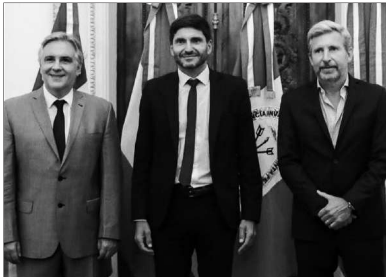
Llaryora, Pullaro y Frigerio encabezaron un encuentro en Rosario.

Junto a sus pares de Santa Fe, Maximiliano Pullaro, y de Entre Ríos, Rogelio Frigerio, el gobernador Martín Llaryora advirtió ayer que “el campo no da más, si no se bajan las retenciones de manera urgente, el campo se puede fundir”. En el marco de una nueva reunión de trabajo de la Región Centro desarrollada en la ciudad de Rosario, los tres mandatarios hicieron hincapié en la “grave situación” que atraviesa el agro, a la vez que le reclamaron a la gestión de Javier Milei que, “de manera urgente, implemente una baja de las retenciones que desde hace años afectan al sector”. Sobre el particular, Llaryora reiteró la imperiosa necesidad de contar con medidas de alivio que contribuyan a sostener el rubro “más dinámico de la economía regional”. “Necesitamos una baja urgente de las retenciones para que nuestro campo pueda volver a producir y no se funda”, reafirmó. “Acompañamos al campo y a la producción, que es acompañar a cada vecino de la Región Centro, queremos que esa plata que se va en retenciones quede en manos de nuestros productores, que invierten en sus pueblos y ciudades”, agregó el titular del Centro Cívico provincial. Al mismo tiempo, recordó que