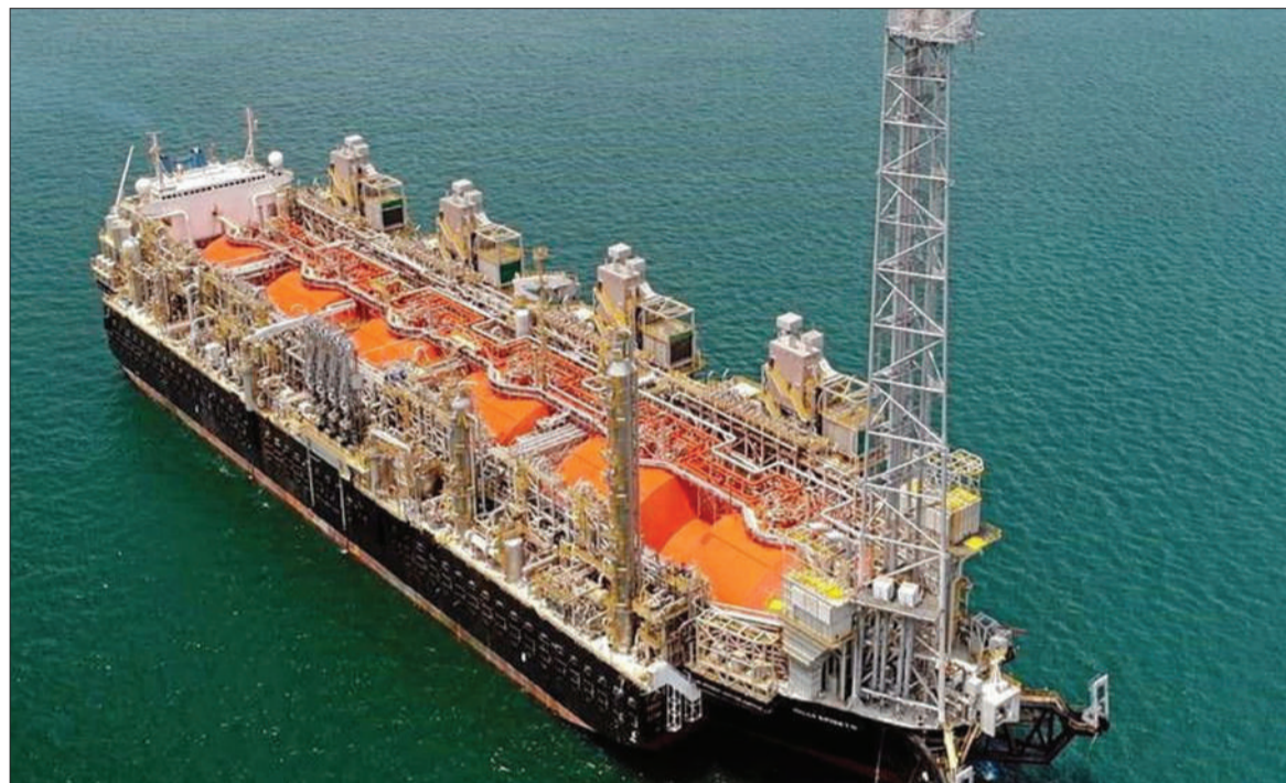
El GNL se produce en el sur del país y se transporta en barcos para su posterior utilización en otros destinos.

“Ellos nos necesitan, nosotros no”, dijo el flamante presidente estadounidense al ser consultado por cómo se vinculará con América Latina / PÁGINA 2