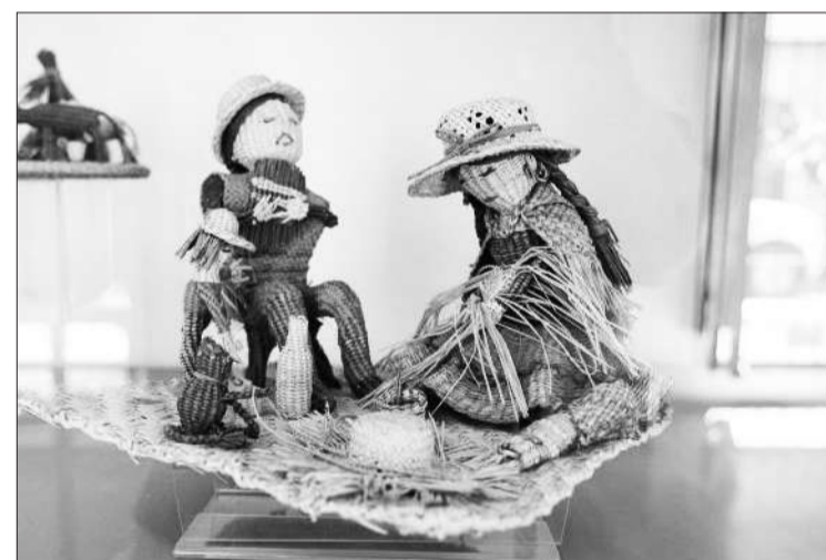
El Museo se puede visitar todos los días con un horario especial de verano.

Con su horario especial de verano, la Secretaría de Comunicación y Cultura de la Municipalidad de Córdoba invita a un circuito especial por Barrio Güemes. En ese sentido propone al público a visitar los diferentes puestos que integran las tradicionales ferias de Güemes., los sábados y domingos de 17 a 23. Las ferias ofrecen un paseo distinto al aire libre y con una diversidad de propuestas que pone al público en contacto con las artesanías y sus hacedores, quienes interactúan con los visitantes sobre sus procesos creativos de cada pieza.