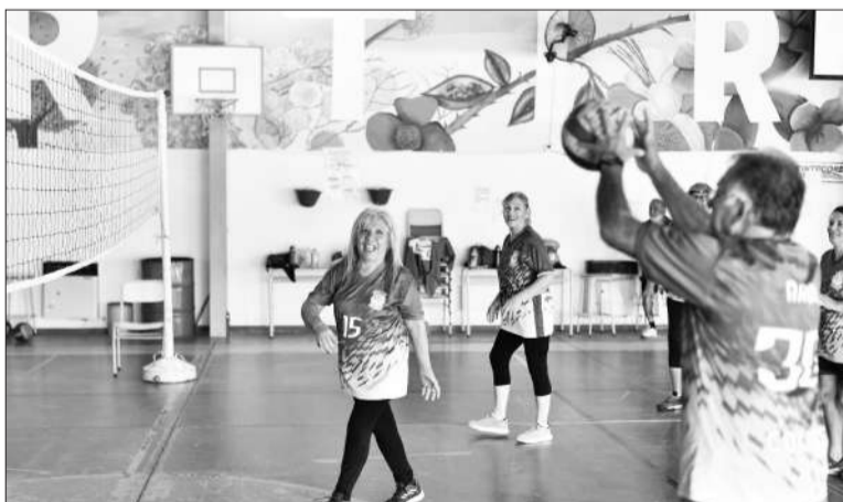
El equipo "Colibrí" de Newcom posee 30 integrantes activos.