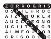
Sopa de letras