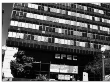
La empresa se transformaría en SA.

La CGT Regional Córdoba manifestó ayer su más “firme oposición” a la transformación de la Empresa Provincial de Energía de Córdoba (Epec) en una sociedad anónima, que “beneficiaría solo a los intereses privados y perjudicaría a los trabajadores y la sociedad”. “Nos solidarizamos con los trabajadores de Luz y Fuerza y nos ponemos a disposición de los compañeros y compañeras en las medidas que implementen para defender los derechos de los trabajadores”, remarcó la central obrera a través de un comunicado difundido en la víspera. En tal sentido, agregó que “nos mantendremos vigilantes y activos en la defensa de los intereses de los trabajadores y la sociedad, fren-