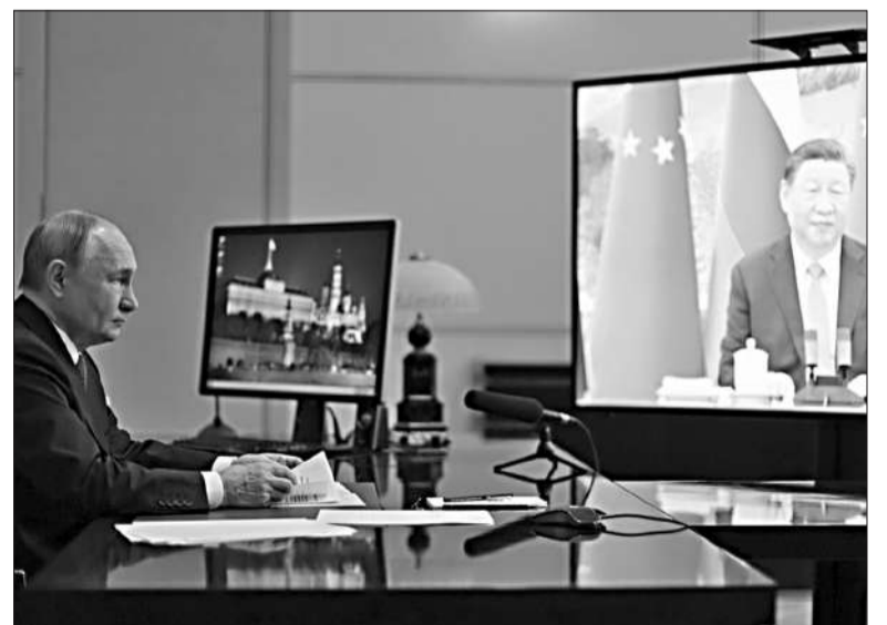
Vladimir Putin habla vía videoconferencia con su par chino, Xi Jinping.

Los líderes de Rusia, Vladímir Putin, y China, Xi Jinping, reafirmaron ayer la alianza estratégica entre ambos países en una videoconferencia. “Estoy de acuerdo con usted en que la base de la cooperación entre Moscú y Beijing es una amplia comunidad de intereses nacionales y una coincidencia de puntos de vista sobre cómo deben ser las relaciones entre las grandes potencias”, dijo Putin a su interlocutor, según las imágenes difundidas por la televisión rusa. El jefe del Kremlin destacó que “las relaciones de política exterior y el trabajo conjunto entre Rusia y China juegan objetivamente un importante papel estabilizador en los asuntos internacionales”.