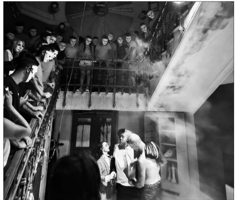
La pieza se exhibe de miércoles a domingos hasta el 2 de febrero.

Antes de ingresar al hospital, los espectadores cuentan con una breve descripción sesgada de cada uno de los jinetes y los siervos. "No hay héroes en nuestra historia. Son todos antihéroes, porque lo que a mí me interesa poner es la humanidad en escena, y la humanidad en escena implica para mí la oscuridad del ser humano", destacó Massera. Y agregó: "Esta obra lo que hace es poner el odio en escena, y lo que estamos tratando de buscar es mostrarle a la gente qué fácil de manipular que son y cómo rápidamente caen en el odio".