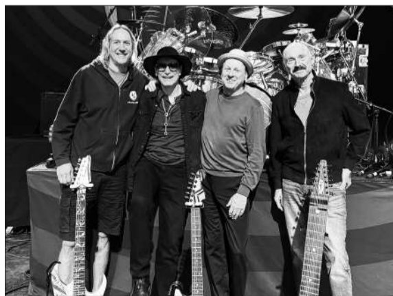
Los cuatro integrantes del grupo tributo Beat

Beat inició la gira por diferentes puntos de Estados Unidos, a finales del año pasado. Continuando con su viaje, el homenaje a King Crimson, desembarcará en