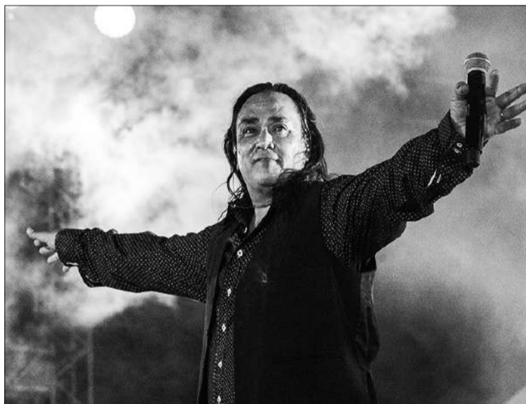
Sergio Galleguillo participará de la Gran Fiesta Chayera junto a referentes del folclore.

En la grilla artística se destaca Sergio Galleguillo quien festejará su cumpleaños durante la jornada. El reconocido músico riojano traerá al escenario su característico sonido chayero, que mezcla la tradición folclórica con una energía única. Con una extensa carrera que incluye éxitos como "Agitando Pañuelos" y "De Noche y Albahaca", Galleguillo promete un espectáculo cargado de emoción y alegría. También se presentará el dúo santiagueño