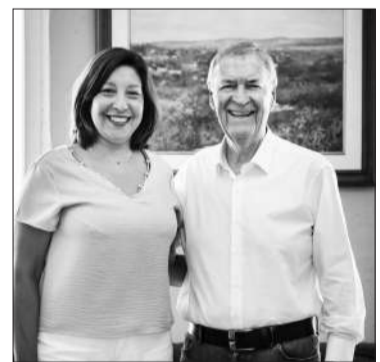
Arabela Carreras junto a Schiaretti.

El ex gobernador Juan Schiaretti reapareció ayer en la escena pública. Lo hizo a través de sus cuentas en las redes sociales X e Instagram, donde compartió una foto con la ex mandataria de Río Negro, Arabela Carreras. En el posteo, el ex mandamás cordobés destacó que coinciden “en la importancia de la producción, el trabajo, el federalismo y en una visión comprometida con la construcción de un país normal en el que se respeten las instituciones”. A su vez, Carreras compartió la misma imagen en su cuenta y expresó: “Con el gringo vamos a seguir conversando porque coincidimos en la mirada sobre el país que queremos. Producción. Industria. Trabajo para los argentinos. Por un país normal y con futuro”. De esta manera, el partido que en las últimas elecciones presidenciales llevó la fórmula Schiaretti-Randazzo, se acerca a Río Negro con la intención de conformar Hacemos Río Negro y