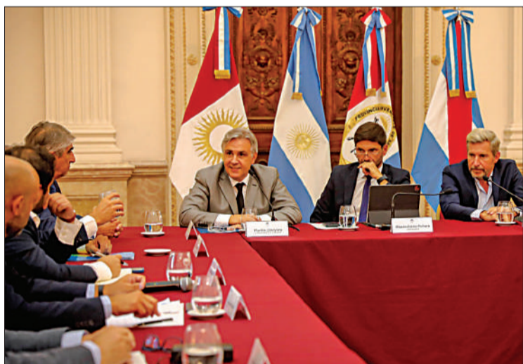
Llaryora, Pullaro y Frigerio se reunieron ayer en Rosario.

■ Junto a sus pares de Santa Fe y de Entre Ríos, el Gobernador advirtió que “si no se bajan de manera urgente, el campo se puede fundir” ■ “Hoy le toca reaccionar a la Nación, antes que sea tarde”, enfatizó ■ Pullaro pidió “mirar el interior productivo” ■ Para Frigerio, “la crisis del sector es profunda” / PÁGINA 5