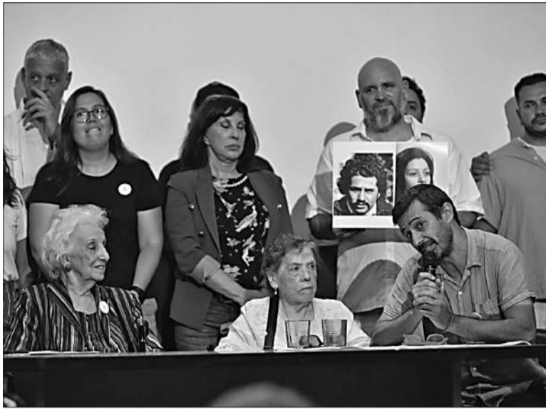
El hermano de la mujer consideró la aparición como “un acto de Justicia”.