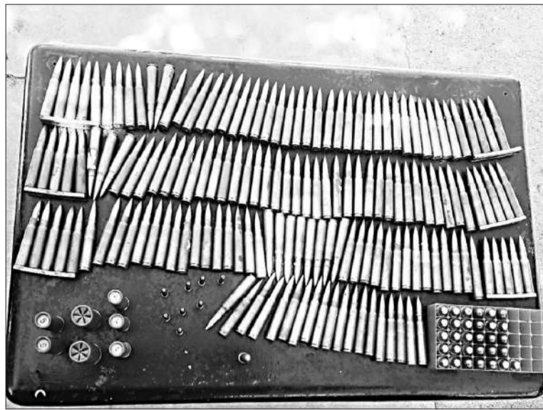
En el operativo, la Policía logró incautar cartuchos de diferentes calibres.

Una pareja fue detenida ayer durante un procedimiento en el barrio General Savio de la ciudad de Córdoba, donde el personal policial logró el secuestro de más de 200 cartuchos de diferentes calibres. En la calle San Clemente esquina Escolástico Magan los efectivos interceptaron a un hombre y una mujer de 21 años que llevaban una caja con 159 cartuchos calibre 7.65", 24 cartuchos calibre 11,25", 42 cartuchos calibre 20", entre otros objetos. Momentos antes, estas personas fueron visualizadas mediante las cámaras del 911 manipulando una caja que contenía los elementos mencionados. Posteriormente, los aprehendidos junto con lo incautado fueron puestos a disposición de la Justicia.