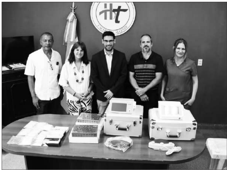
Referentes del hospital y de la Secretaría de Salud en el acto de entrega.