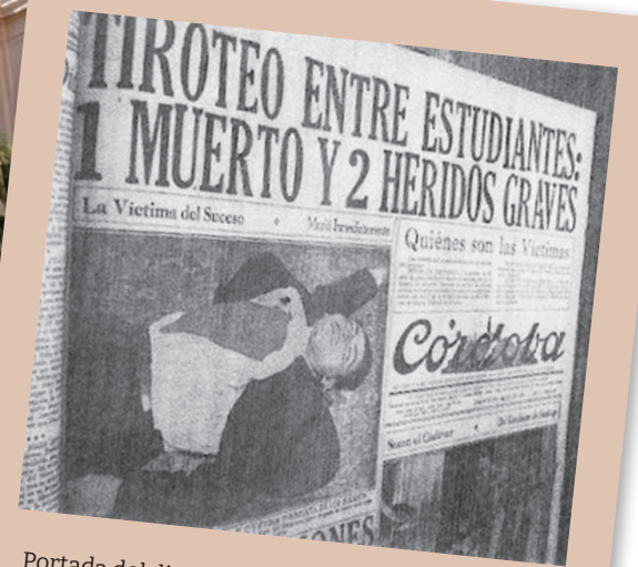
Portada del diario Córdoba

El Viejo Rectorado de la Universidad Nacional de Córdoba, Patrimonio de la Humanidad, es destino obligado del poco turismo internacional que llega a la ciudad. Nadie cuenta, ni a extranjeros ni a locales, del joven patricio de apellido distinguido asesinado a balazos en la sacra casa del saber.