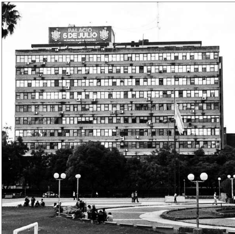
La Municipalidad dio a conocer cómo serán los aumentos de estos tributos.