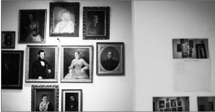
El recinto abre de martes a domingos de 9 a 19, con entrada gratuita.

El Museo Genaro Pérez presenta diferentes opciones para visitar durante el verano con entrada libre y gratuita