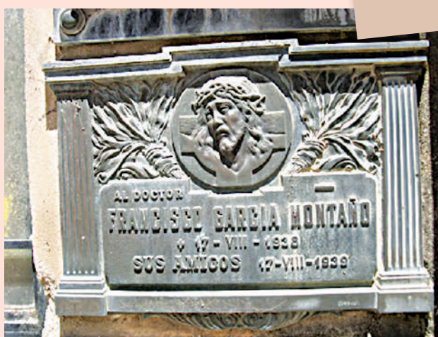
Placa en el panteón de la familia García Montaña