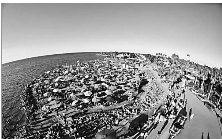
Los visitantes se quedan un promedio de dos a tres días en el lugar.