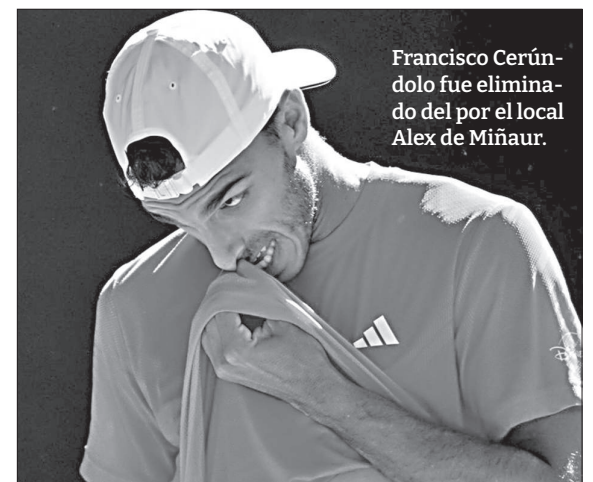
Francisco Cerúndolo fue eliminado del por el local Alex de Miñaur.

En el cuadro femenino, la estadounidense Coco Gauff