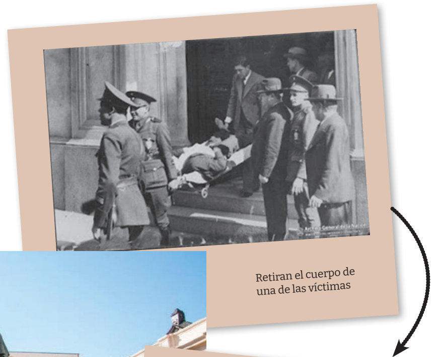
Retiran el cuerpo de una de las víctimas

JUAN CRUZ TABORDA VARELA Especial para HDC