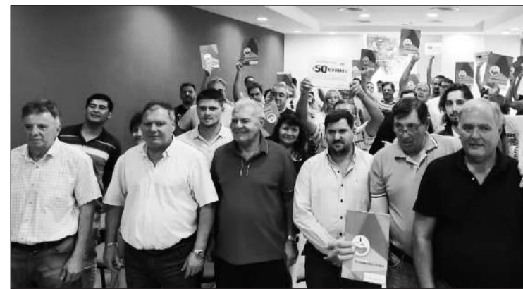
Los subsidios serán destinados a la compra de varias maquinarias viales.

El Gobierno de Córdoba, a través del Ministerio de Bioagroindustria, llevó adelante la entrega de subsidios por $ 2.300.000.000 para el equipamiento de maquinarias viales en las localidades de Río Segundo, Marcos Juárez y Laboulaye. Estas herramientas son fundamentales para la producción local, ya que posibilitan la ejecución de obras de mejoras y mantenimiento de la red vial secundaria y terciaria. Por su parte, el ministro Sergio Busso señaló que hace más de 15 años que no se hace una inversión tan fuerte en equipamiento y subrayó que mejorar los recursos es esencial para tener caminos rurales en buenas condiciones. “Estamos cumpliendo el compromiso asumido por el gobernador Martín Llaryora de entregar un subsidio de $ 50 millones para renovar maquinaria a los más de 280 consorcios camineros de la provincia”, añadió Busso. Los fondos otorgados serán destinados a la compra de tractores, motoniveladoras, niveladoras, camiones, desmalezadoras, entre otros equipos. A su vez, en los próximos días están previstas más entregas de subsidios a las distintas regionales de la provincia.