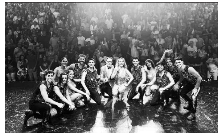
La obra "100 % Fátima" lidera el ranking semanal por espectadores.