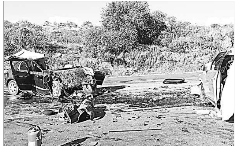
En el Camino de las Altas Cumbres cuatro personas murieron tras un choque.

Por otro lado, en la madrugada del domingo, otro choque fatal ocurrió en la ruta 28, cerca de Tanti. Un Chevrolet Agile y un Toyota Corolla protagonizaron un