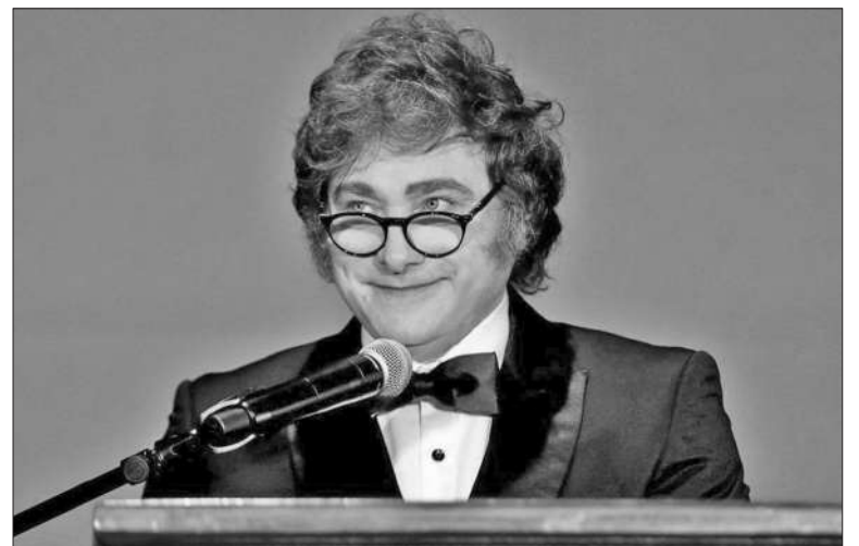
El jefe del Ejecutivo fue galardonado como “titán de la Reforma Económica”.

En segundo término, subrayó: “No consensuamos con el enemigo. (...) Si los políticos a los que uno enfrenta representan una ideología opuesta a la propia, que ha sido la causante de todos los males, no hay ni puede haber nunca posibilidad de acuerdo. No puede haber acuerdo entre el bien y el mal”. Por otra parte, en tercer lugar, destacó que asumió “en un contexto absoluta-