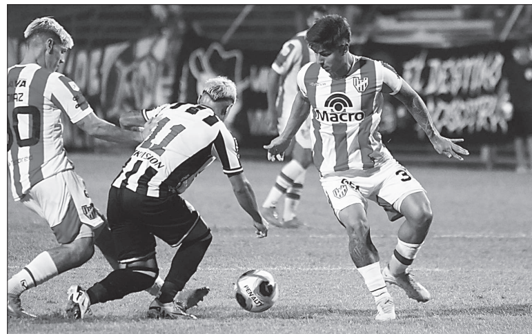
El Albirrojo se mostró falto de fútbol ante el conjunto de Montevideo.