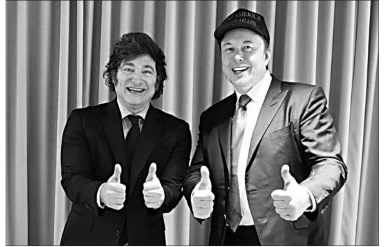
"Amo a Javier Milei", publicó el dueño de la red social X en apoyo al Presidente.

"Argentina ha hecho un tremendo progreso para bajar la inflación, estabilizar la economía y reactivar el crecimiento", ponderó la directora gerente del FMI. Incluso, vaticinó que "la gente ha empezado a ver algunos de los beneficios: la pobreza