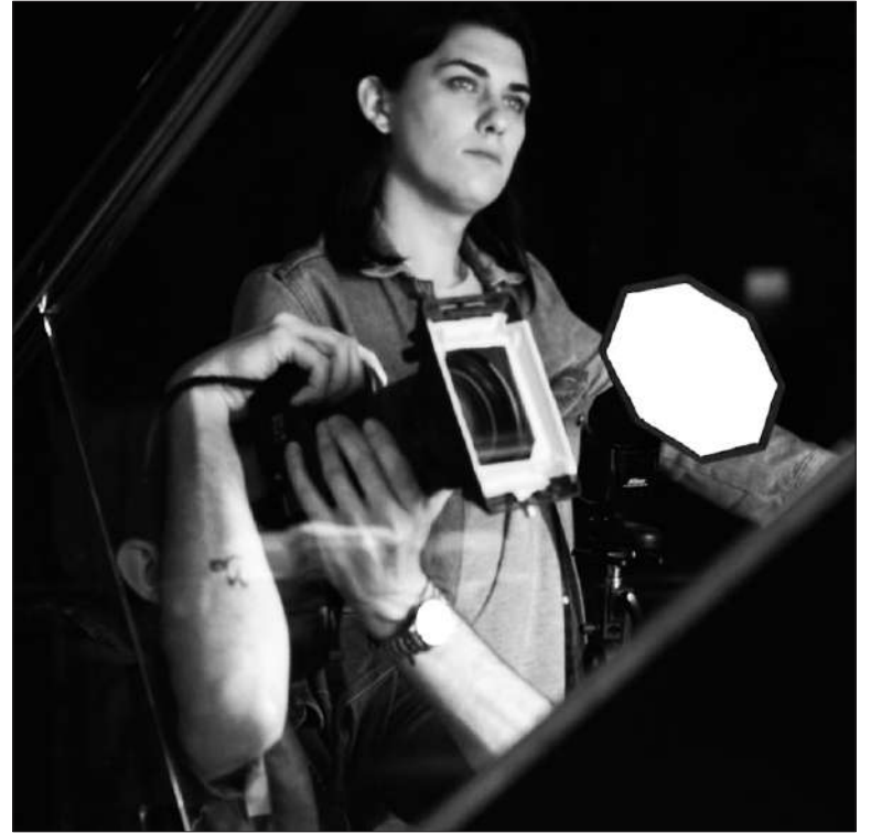
Las distintas producciones generaron un movimiento de 2.400 millones de pesos.

Entre las producciones destacadas se encuentran "Dilema Neuronal" (Ex Neuronal), galardonada como la Mejor Serie de