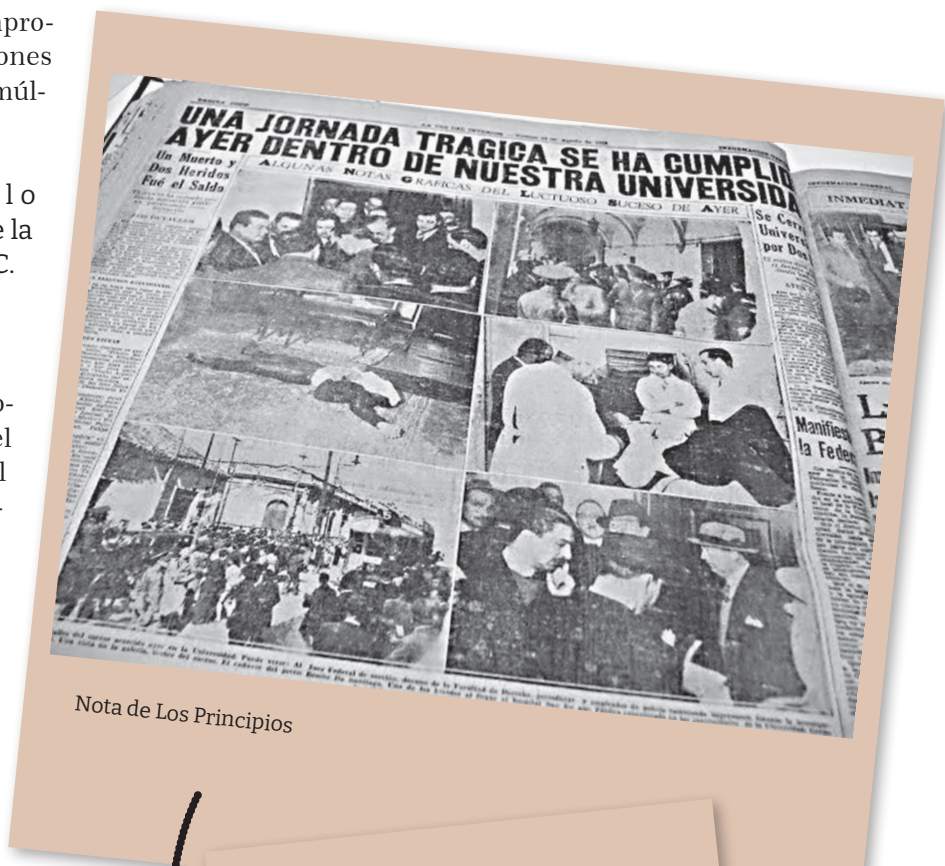
Nota de Los Principios