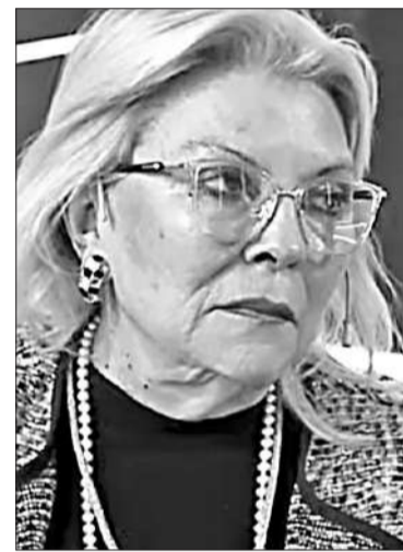
La líder de la CC, Elisa Carrió.

El oficialismo encarará estas semanas las negociaciones con los bloques dialoguistas en diputados del PRO, UCR, Innovación y Encuentro Federal, mientras se discute el DNU en la Comisión Bicameral de Tratamiento Legislativo, donde ma-