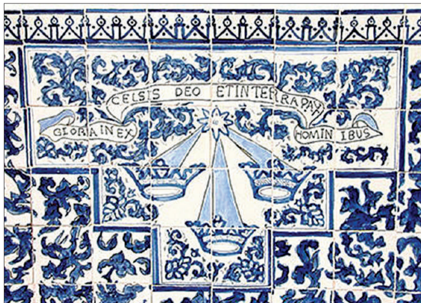
Símbolo de los Bethlemitas.

Entonces, ¿Quién nos escucha y tumba las campanas y camina dejando huellas y lleva largo traje gris y canta cantos gregorianos en las noches sin luna en la Cripta sin sol de la Córdoba subterránea? ¿Quién? No sabemos. Pero debemos aprender, de una vez y para siempre, que en las entrañas de la tierra de la ciudad sin mar jamás estamos solos.