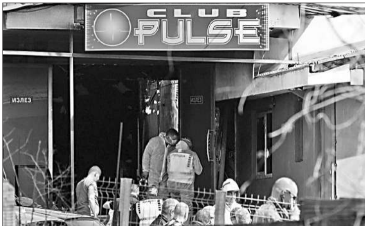
Las pericias continuaban en el boliche donde ocurrió la tragedia.

Skopie.- Al menos 59 personas murieron y 155 fueron hospitalizadas después de un devastador incendio en una discoteca en la ciudad de Kocani. Las autoridades creen que el siniestro se originó a causa de efectos pirotécnicos que prendieron fuego al material inflamable del techo del sitio, lo que ocasionó que las llamas y el humo se propagaron rápidamente. El ministro del Interior, Panche Toshkovski, confirmó que 18 de los heridos se encuentran en estado crítico. Entre los hospitalizados se encuentra Vladimir Blazevski, miembro del grupo de hip-hop DNK, quien sufrió quemaduras pero su condición es estable. La Policía detuvo a un sospechoso y emitió órdenes de arresto contra el propietario del club y otras tres personas, acusándolas de violaciones a la seguridad y de negligencia. El Gobierno de Macedonia del Norte se ha comprometido a realizar una investigación exhaustiva para prevenir desastres similares en el futuro. El primer ministro Hristijan Mickoski canceló su viaje a Montenegro y viajó a Kocani para supervisar las labores de emergencia. A su vez, el ministro de Justicia, Igor Filkov, exigió la rendición de cuentas e insistió en que una tragedia como esta no debe ocurrir nunca más. La comisaria de Ampliación de la Unión Europea, Marta Kos, también expresó sus condolencias a las víctimas y sus familias.