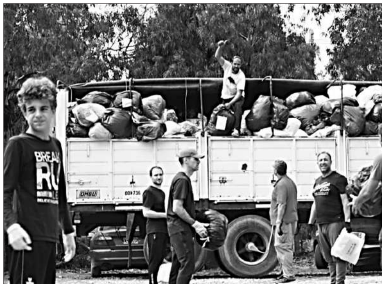
La colecta llenó tres camiones para los damnificados en Bahía Blanca.

Las donaciones de Córdoba ya llegaron a Bahía Blanca. Los camiones que partieron el viernes pasado desde la sede de la Universidad Provincial de Córdoba arribaron el sábado al campus de la Universidad Provincial del Sudoeste. A su vez, ayer continuaba el operativo para descargar y clasificar los más de 60.000 kilos de donaciones que llegaron en tres camiones con acoplado. Ropas de cama, lavandina y artículos de limpieza, toallas y toallones, alimentos no perecederos y productos de higiene personal son algunos de los elementos enviados por miles de cordobeses para los afectados por las inundaciones en Bahía Blanca.