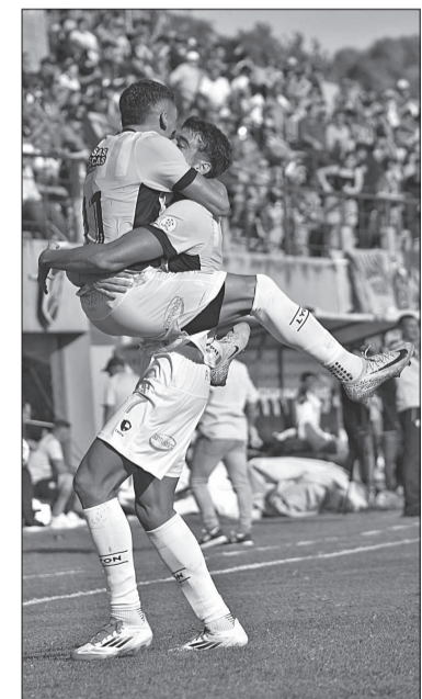
Festejo académico en Munro.

En la próxima fecha, Racing será local de Atlanta el domingo 23 a las 16, El Bohemio, que tiene nueve puntos es el único que le puede dar alcance a la Academia si este hoy derrota a Los Andes.