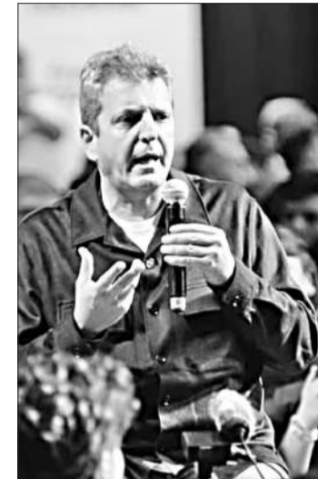
El ex ministro Sergio Massa.

Después de varios meses de silencio, el líder del Frente Renovador, Sergio Massa, cerró el sábado el Congreso nacional del partido, que reunió a miles de dirigentes y militantes de todo el país, donde aprovechó para hacer un llamado a la unidad del peronismo, en medio de la disputa entre Cristina Kirchner y Axel Kicillof. “Es un año donde tenemos la responsabilidad política de hacer primar el sentido común sin mezquindad para construir la unidad. No creo en las peleas”, sostuvo Massa, quien enfatizó que “lo que todos tenemos en claro es que aunque tengamos que ceder algún lugar personal, nuestra mayor responsabilidad es construir una alternativa que le ponga límites a este Gobierno. Nos cabe a nosotros y a cada uno de los que integran Unión por la Patria. Vamos a ganar en la ciudad, en la provincial y en la nacional”.