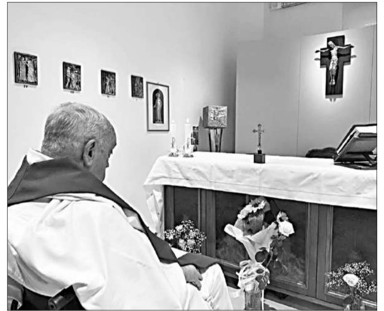
Es la primera imagen de Francisco desde que fue internado hace un mes.

El papa, de 88 años de edad y que permanece hospitalizado por una neumonía bilateral, aseguró: "Nuestro físico está débil, pero, incluso así, nada puede impedirnos amar, rezar, entregarnos, estar los unos para los otros, en la fe, señales luminosas de esperanza".