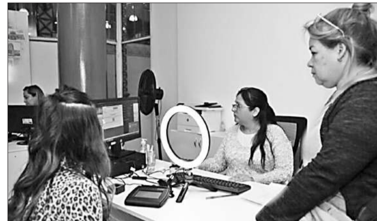
Se emitieron más de 700 licencias de conducir en todos los centros.

En una atractiva jornada de "La Noche de los CPC", más de siete mil vecinos y vecinas de nuestra ciudad se unieron para disfrutar de una experiencia única que combinó trámites y entretenimiento. Durante esta velada, se llevaron a cabo 2.270 gestiones en todos los CPC, lo que facilitó el acceso a servicios esenciales en un horario poco convencional. La propuesta no solo ofreció una oportunidad para realizar trámites, sino que también transformó el ambiente en un espacio vibrante, lleno de música, feriantes y espectáculos. Entre los trámites realizados, se destacan 702 licencias de conducir, 723 gestiones en el Registro Civil, 250 en Recursos Tributarios y 595 en otras áreas. Este esfuerzo colectivo subraya la importancia de facilitar el acceso a servicios públicos, haciendo que la burocracia sea más amigable y accesible. La jornada fue animada por presentaciones musicales y de baile, donde ritmos folclóricos y contemporáneos llenaron el aire, creando una atmósfera festiva que marcó el inicio del fin de semana. Los CPC de General Paz y Villa El Libertador también se sumaron a la celebración con nuevas ediciones de "La Peña de tu Ciudad", destacando la participación de artistas reconocidos como Huayra Muyo, Terruño, Sergio Aguirre, Laura Sánchez y Jorge Luis Carabajal. Sin duda, una noche para recordar y disfrutar en comunidad.