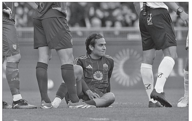
Dybala entró promediando el segundo tiempo y sólo jugó 10 minutos.

mediapunta de la Roma podrían ser Alejandro Garnacho o Claudio Echeverri, aunque obviamente habrá que esperar a la información del parte médico del equipo italiano y la posterior respuesta de Scaloni y su equipo.