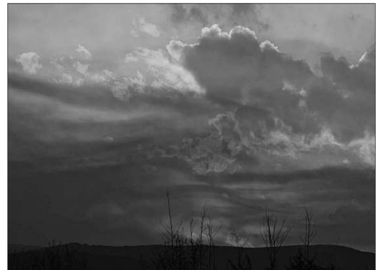
El trabajo de 16 artistas cordobesas está plasmado en esta exposición.