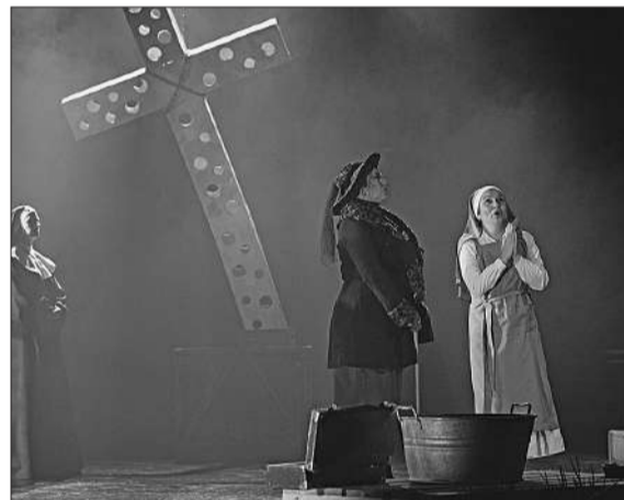
La obra estrenada en 1918 combina drama y religión.

Las entradas para el concierto están disponibles en la boletería del teatro y en Autoentrada, con valores de: Platea: $35.000, cazuela: $27.000