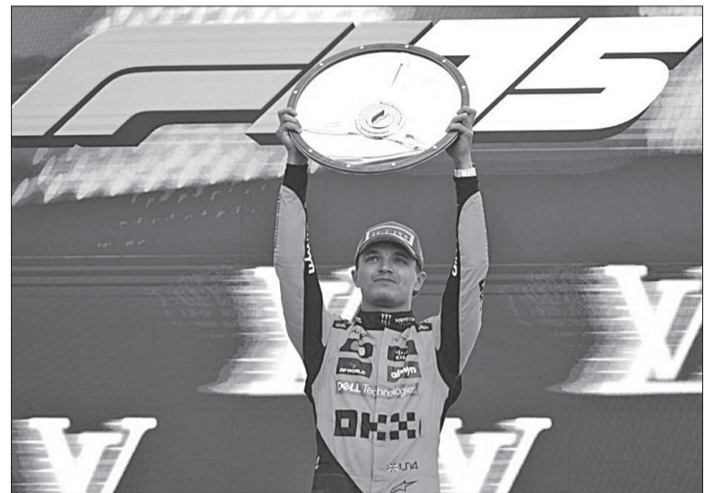
Lando Norris logró una victoria que confirma sus chances de ser campeón.

Con el correr de las vueltas, parecía que iba a ser un dominio abrumador de Norris y Piastri, llegando a sacar 18 segundos de ventaja al campeón Verstappen. Más atrás, seguían sorprendiendo Yuki Tsunoda, Alex Albon y Nico Hulkenberg, por momentos por delante de las Ferrari.