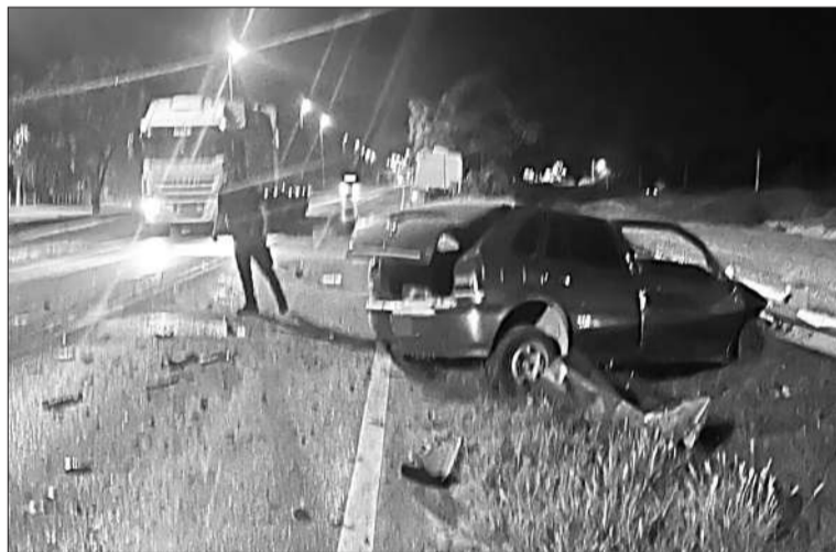
Un automóvil chocó contra un camión en Río Cuarto.

Tras el siniestro, personal del Departamento Unidades de Alto