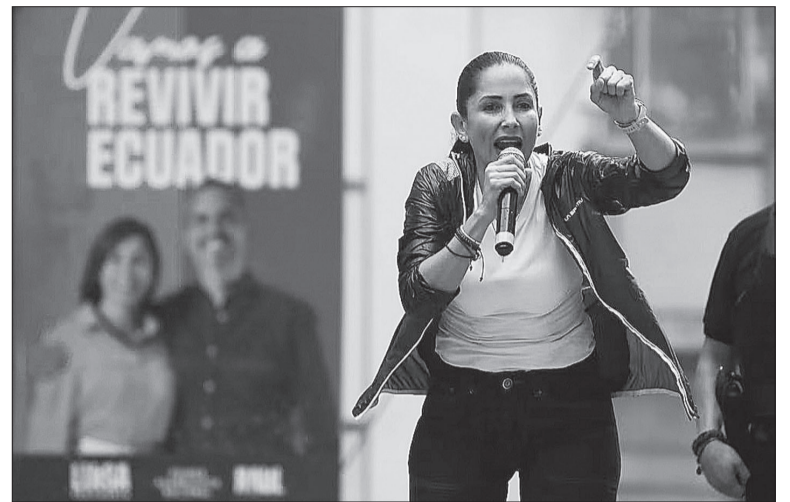
Luisa González deberá aliarse con otros opositores si quiere ser presidenta.

El proceso electoral se desarrolló en un contexto de alta participación esperada, con el voto obligatorio para ciudadanos de 18 a 64 años y voluntario para mayores de 65 y residentes en el exterior. La jornada también estuvo marcada por un fuerte despliegue de seguridad, en un país que enfrenta una grave cri-