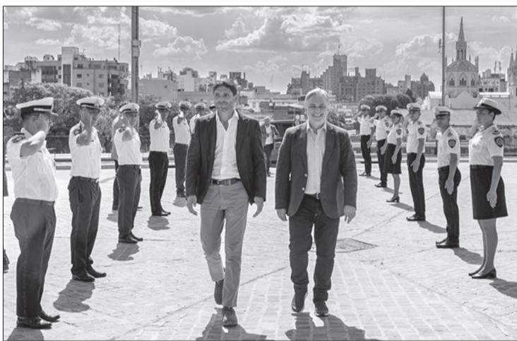
Reclamo conjunto a Francos de los gobernadores de Santa Fe y Córdoba.

Los gobiernos de Córdoba y Santa Fe, encabezados por Martín Llaryora y Maximiliano Pullaro, respectivamente, enviaron una nota dirigida al jefe de Gabinete de la Nación, Guillermo Francos, manifestando la necesidad y conveniencia de llevar adelante un conjunto de obras en el Sistema de Transporte en Extra Alta Tensión de 500 kV en el Sistema Argentino de Interconexión -SADI-, que además de resultar de importancia para el conjunto de actores del SADI, tienen relevancia para ambas provincias integrantes de la Región Centro. En la misiva, ambos mandatarios ratificaron la necesidad que desde el Sistema Argentino de Interconexión en su conjunto se dé curso a la ejecución de las obras para poder asegurar un crecimiento federal, coordinado y armónico del Sistema de Transporte en 500 kV, permitiendo así hacer frente al déficit que presenta la capacidad de transporte eléctrico en la actualidad y fortalecer el crecimiento económico y social de todo nuestro país.