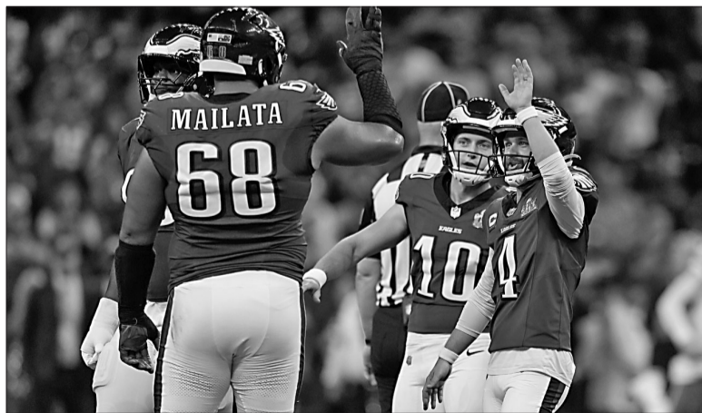
Los Philadelphia Eagles logró el título, pese a que no eran los favoritos.

PHILADELPHIA EAGLES DIO EL GOLPE Y GOLEÓ 40-22 AL CAMPEÓN DEFENSOR, KANSAS CITY CHIEFS