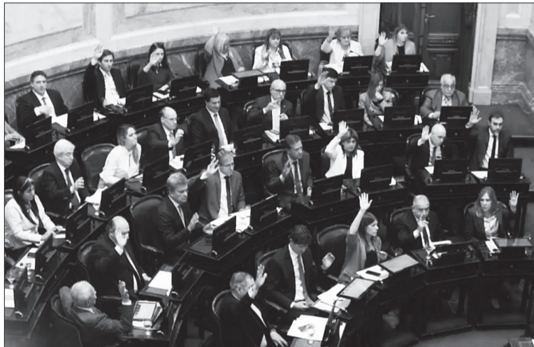
El bloque radical en el Senado es una de las grandes incógnitas.

En el Senado, necesitará sí o sí 37 votos, es decir, mayoría absoluta del cuerpo al tratarse de un cambio electoral. Allí, La Libertad Avanza (LLA) parte de la base con seis votos propios; ocho del PRO y cinco del espacio Provincias Unidas. A este lote habría que sumarle algunos votos dispersos de bloques federales como Juntos Somos Río Negro, los dos senadores misioneros del Frente para la Concordia y el formoseño Francisco Paoltroni,