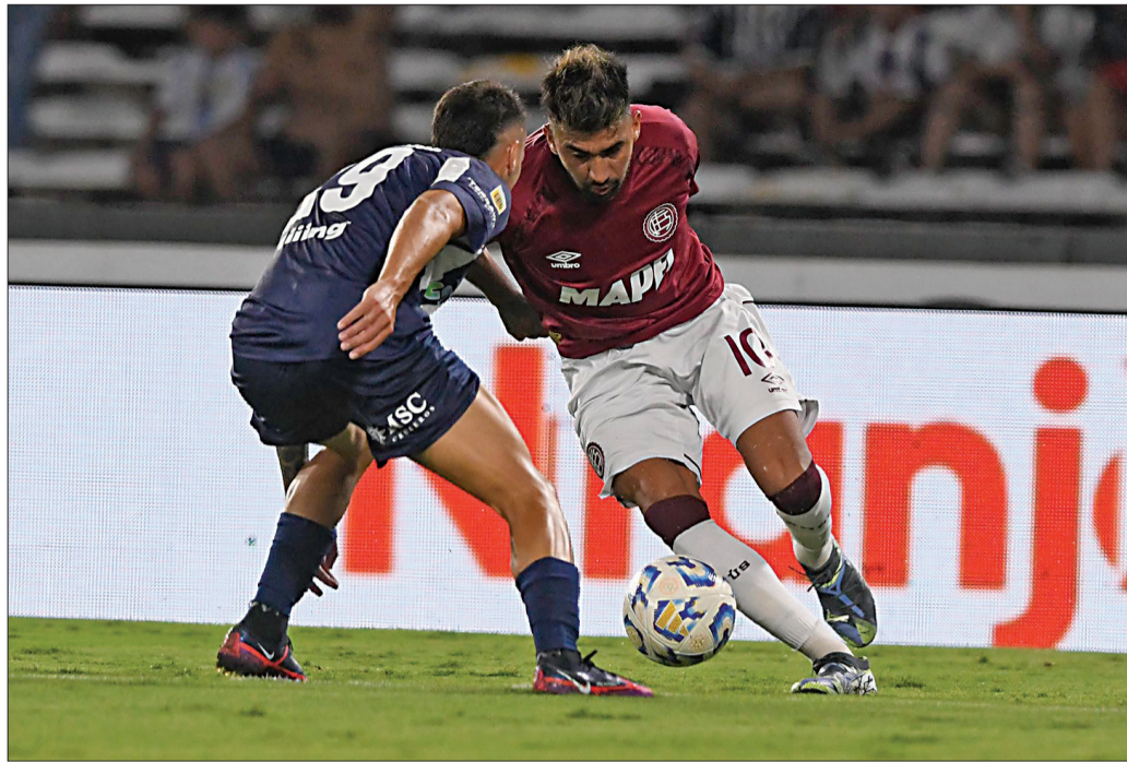
Talleres sufrió su segunda derrota al hilo de local y está último en la Zona B.