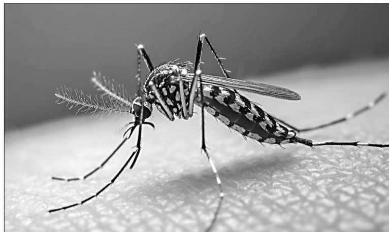
Se espera un pico de casos a mediados de abril del corriente año.

La estrategia provincial de vacunación gratuita avanza en grupos específicos: personas de 4 a 59 años con antecedentes de dengue grave, personal de salud, policías, bombe-