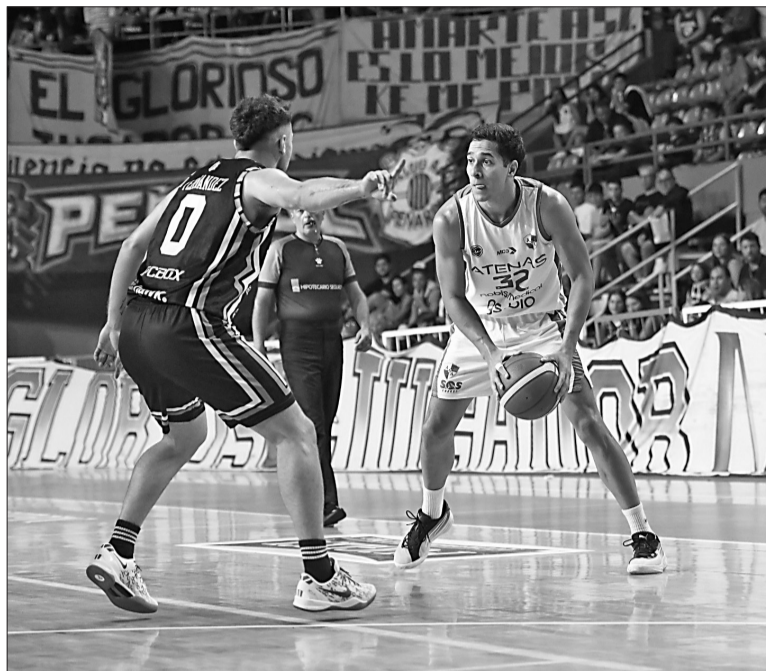
El Verde de General Bustos volvió a perder y no levanta cabeza.

Totalmente quebrado estuvo el juego del Griego en el tercero. Sin respuestas, sin fluidez en ataque y mal en defensa. En seis minutos de juego, Atenas todavía no había podido convertir. Peñarol hizo lo que quiso y estiró la máxima a 22 (58-36). Con mucho amor propio, el Griego llegó a ponerse a 14 (60-46) con un par de buenas defensas y unas bombas de tres puntos. El cuarto se cerró