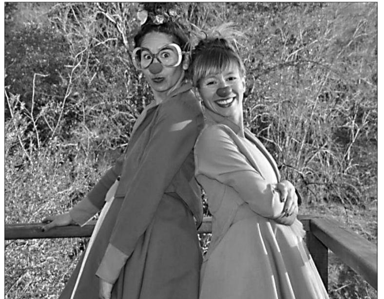
La Agencia Córdoba Cultura presentó su agenda para la presente semana.

■ El miércoles 12 de febrero, la programación continúa con el cine como protagonista. A las 17:00 y 21:00 horas, se proyectará "El Desertor" en Cine Arte Córdoba. Para los que buscan una propuesta más local, a las 21:00 horas se podrá disfrutar de "El Escuerzo" en el Galpón Blanco del Centro Cultural del Andino en Río Cuarto, con entrada gratuita. Esta pe-