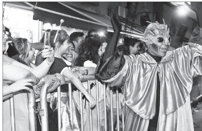
El "desfile alien" se llevó todas las miradas de los espectadores terrestres.

En cuanto al impacto turístico, y siempre de acuerdo a lo indicado desde la administración municipal, el nivel de ocupación alcanzó un 90% del total de las plazas disponibles en la localidad. De esta manera, este fin de semana escaló a lo más alto del podio entre los de