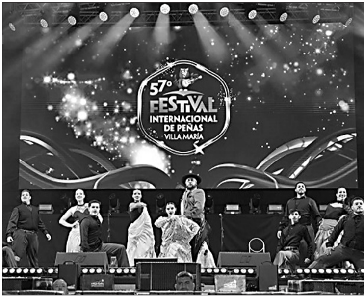
El Festival de Peñas de Villa María celebró su edición 57°.