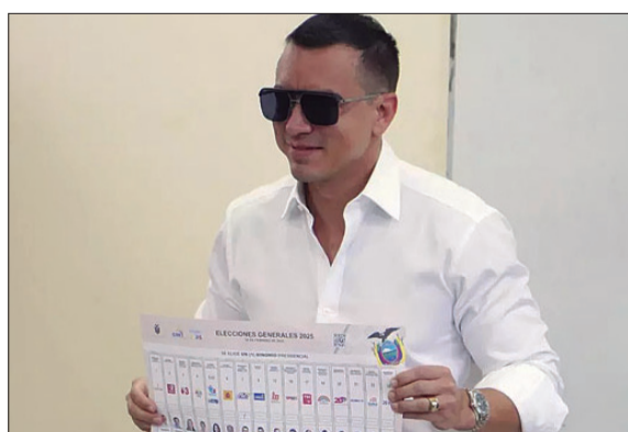
El mandatario ecuatoriano, al momento de votar.