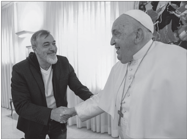
El papa Francisco tuvo otro fuerte gesto político al recibir a Aguiar.