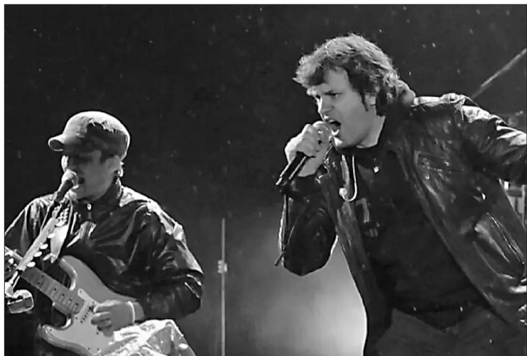
Los Piojos, tras su retorno en La Plata, será la gran atracción del domingo 16.