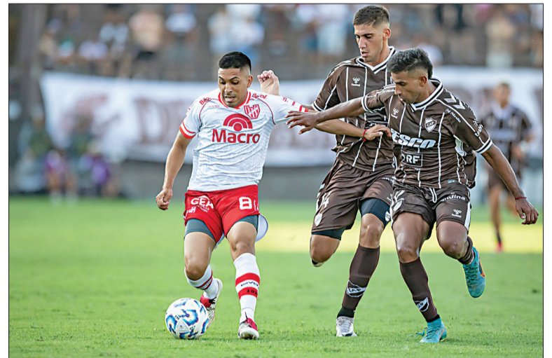
El Albirrojo jugó un discreto partido y cayó ante Platense en Vicente López.

Y estuvo bien el resultado, porque el local siempre estuvo un escalón más arriba dentro de un contexto de juego más que discreto. Platense tuvo en Guido Mainero a un jugador incansable que luchó