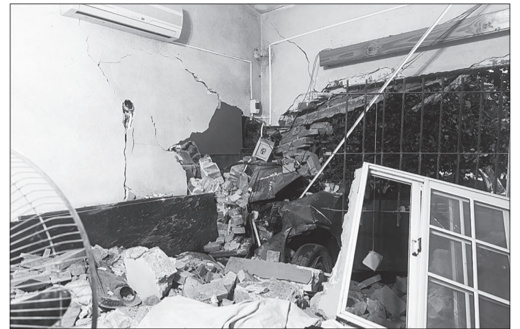
En Santa Rosa de Calamuchita, un auto se incrustó contra una vivienda.