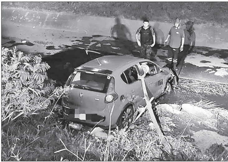
El Fiat Palio robado cayó en un canal de desagüe de Circunvalación.

Un joven de 19 años fue detenido en el barrio Parque Liceo de la ciudad de Córdoba, tras robar un automóvil que realizaba viajes para la plataforma Uber. Según informaron fuentes policiales, el delincuente robó un Fiat Palio rojo luego de golpear al conductor, quien sufrió un traumatismo de cráneo y fue trasladado al hospital Privado. El joven, que simuló ser un pasajero normal, atacó al chofer al llegar a un destino acordado previamente, y lo despojó del vehículo mediante amenazas. Luego del robo, la Policía montó un operativo cerrojo en la zona y localizó el automóvil por la avenida Circunvalación. La persecución se extendió por varias cuadras hasta que el delincuente perdió el control del auto y volcó en un canal de desagüe. A pesar del accidente, el joven salió del vehículo y continuó su fuga a pie, lo que llevó a los oficiales a disparar tres balas de goma para detenerlo. Finalmente, el sospechoso fue capturado en el jardín de una vivienda en el barrio Parque Liceo Anexo, donde se había refugiado. A pesar del vuelco, el delincuente no sufrió heridas graves y fue puesto a disposición de la justicia, mientras que el vehículo robado fue recuperado.