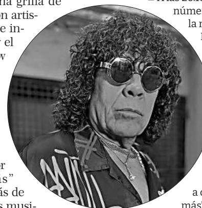
La “Mona” Jiménez celebrará sus 74 años el sábado en el Bum Bum.

Las localidades pueden adquirirse por la web universotickets.com . Luego deberán ser canjeadas por tickets físicos en los siguientes puntos: Nueva Terminal de Ómnibus Boletería 73 – Fonobus – (hasta el viernes 10 de enero de 14 a 21); Boletería Estadio Kempes desde hoy jueves de 14 a 21, el viernes de 14 a 21 y el sábado de 10 a 03 y la Tienda Oficial de Universo Jiménez (av. Rafael Nuñez 4791, MuseoBar) de 10:30 a 23. Las entradas generales disponibles tienen un valor de $75.000.