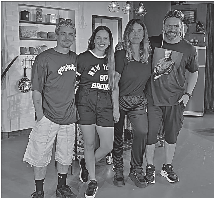
El elenco de "Suspendan la boda!" al finalizar la función del martes.

La comedia romántica "¡Suspendan la boda!" se presenta en el teatro Candilejas de Carlos Paz