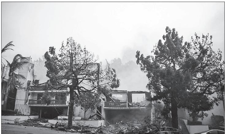
Miles de estructuras quedaron reducidas a cenizas en Los Ángeles.