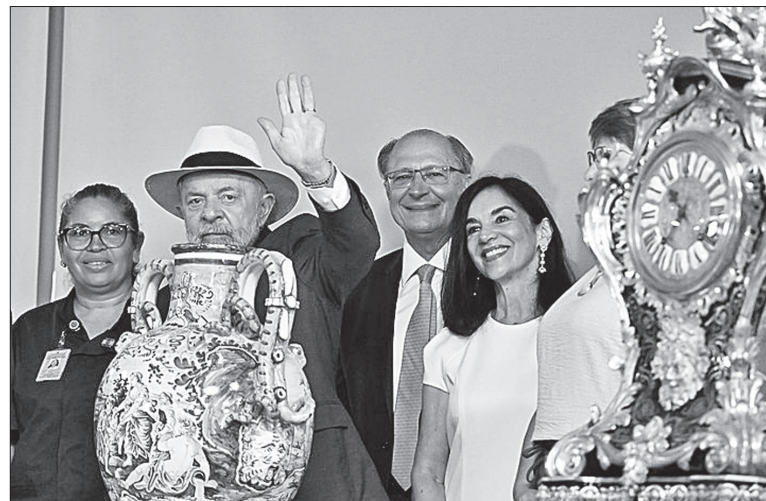
Lula y su esposa Rosângela observan un jarrón ánfora italiana restaurada.

Las obras de arte han sido restauradas, en colaboración con las autoridades suizas, y están siendo