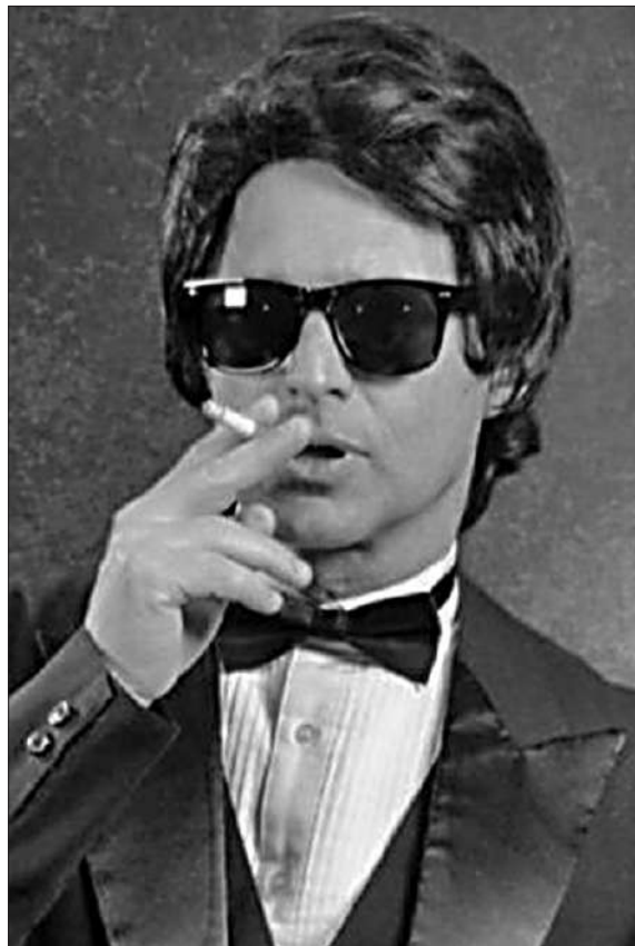
La trilogía inicia este jueves con la obra “Mi vida con Robert”.

El actor subirá a escena los jueves de enero y febrero en la sala La Llave para protagonizar tres de sus espectáculos más destacados