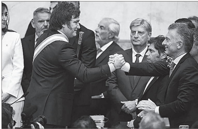
Macri saluda a Milei en el día de su asunción, con Villarruel de fondo.

Al repasar el tema electoral, analizó además las posibles candi-