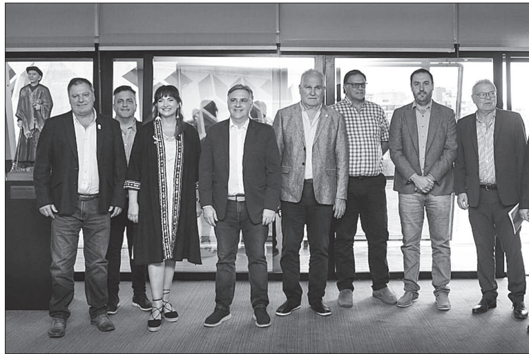
Llaryora y Busso (a la derecha) coincidieron con el planteo de la Mesa de Enlace.

El gobernador Martín Llaryora manifestó ayer su preocupación por la situación crítica del campo argentino, uniéndose al reclamo de las entidades agropecuarias de Córdoba, que exigen medidas urgentes al gobierno nacional. En particular, el titular del Centro Cívico provincial destacó desde la red social X la necesidad de reducir las retenciones a las exportaciones, argumentando que esta medida permitiría que los recursos retornen al sector productivo: “Llegó la hora del campo. Argentina aún está a tiempo de evitar una crisis profunda que golpee a su interior productivo. Por eso acompañamos el legítimo reclamo de las entidades agropecuarias, que exigen al gobierno nacional medidas concretas para enfrentar esta difícil situación”. “El campo necesita con urgencia una reducción de las retenciones a las exportaciones, permitiendo que esos recursos vuelvan a este pujante