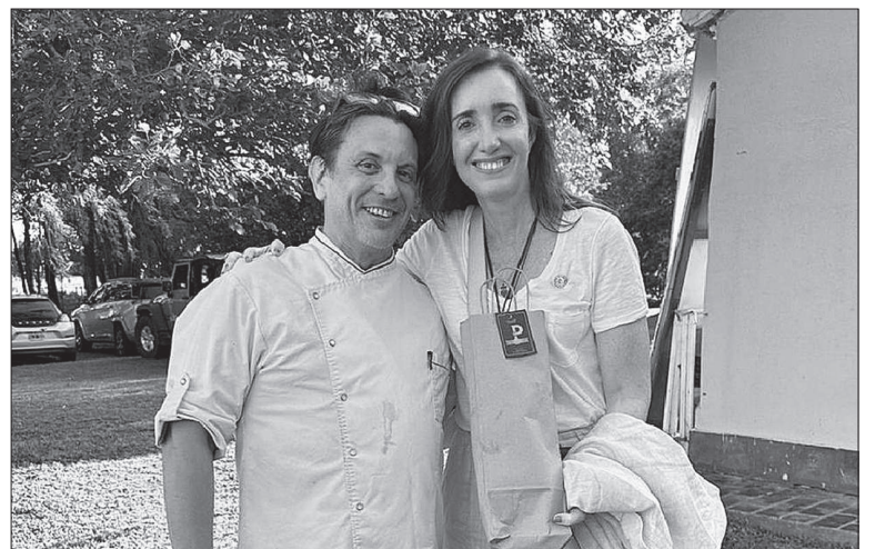
De vacaciones en Villa Allende, la Vicepresidenta se mostró en un restaurante.