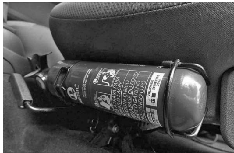
Renovar la carga llega hasta los $ 12.000, según el tamaño del matafuego.

El proceso de inspección no es sencillo. Los conductores deben cumplir con una serie de requisitos como tener la documentación en regla, incluyendo la tarjeta verde,