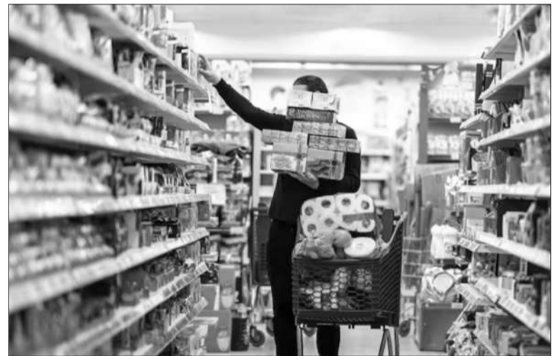
Las ventas minoristas pymes registraron un fuerte aumento en diciembre.

A la vez, con el 55% de los votos, la mayoría de los empresarios