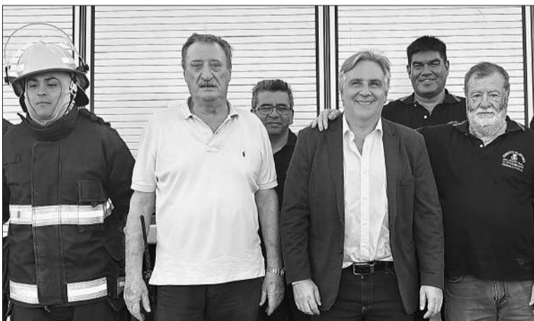
En Villa del Dique, Llaryora anunció aportes, entregó viviendas y créditos.

El gobernador Martín Llaryora aseguró que en Córdoba “podemos pensar distinto, pero podemos trabajar juntos. Porque nosotros no queremos construir trincheras, preferimos construir puentes, rutas y llevar soluciones a cada localidad que visitamos. El consenso y el diálogo permanente con los intendentes y jefes comunales es lo que mantiene a Córdoba de pie, que la hace pujante y nos permite continuar ejecutando obras de infraestructura”. El mandatario hizo esta reflexión el sábado pasado en su paso por Villa del Dique, donde anunció el aporte de la Provincia de $ 140 millones para el centro de salud, entregó viviendas, escrituras, créditos del Bando de la Gente y anunció la construcción de un parque de energía renovable. Llaryora valoró la obra pública como parte