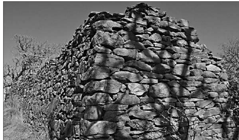
Dentro de las propuestas se encuentran diferentes Postas del Camino Real.

Cerro Colorado: abre sus puertas de viernes a domingos y feriados. Por la mañana: de 8:30 a 13. Visita guiada a pinturas, es a las