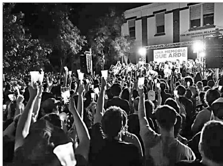
El Festival por la Memoria convocó a miles de personas en la ex Esma.