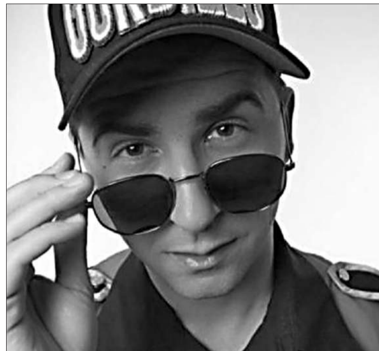
El artista visitará Mina Clavero durante los fines de semana,