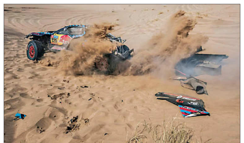
El momento del vuelco del vigente campeón, el español Carlos Sainz (p).

Pero para Sainz fue un dolor de cabeza, porque su Ford sufrió un vuelco en el kilómetro 327, tras coronar una duna de las que formaban parte de la zona central del recorrido. En ese momento, el madrileño abrió pista. No hubo consecuencia ni para el piloto ni para el