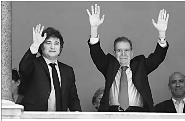
El presidente Milei y González Urrutia saludan desde la Casa Rosada.

La agenda de González Urrutia en Buenos Aires duró tan solo unas horas, pero tuvo un peso geopolítico significativo. Empezó en la Casa Rosada con la reunión bilateral con Milei, siguió en el Palacio San Martín, con un almuerzo con el canciller Gerardo Werthein y la ministra de Seguridad, Patricia Bullrich. Y termi-