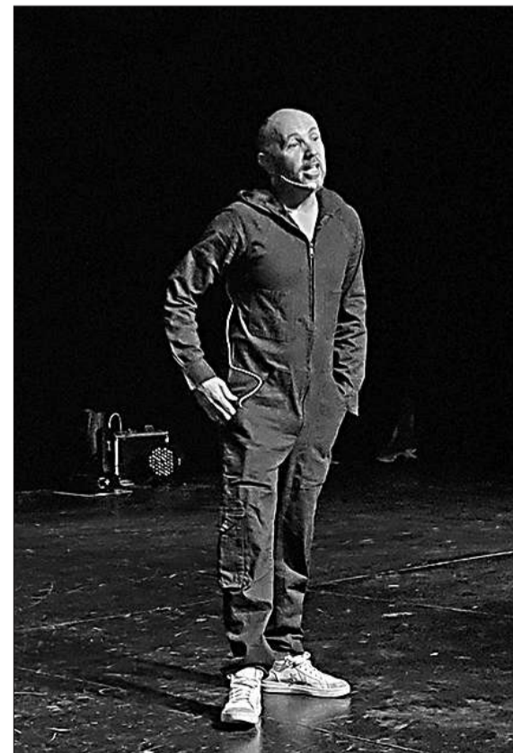
Casavalle actuará los viernes y sábado de enero y febrero.

Las entradas están a la venta en la web edentradas y en las boleterías del teatro. Las localidades oscilan entre $16.000 y $18.000.