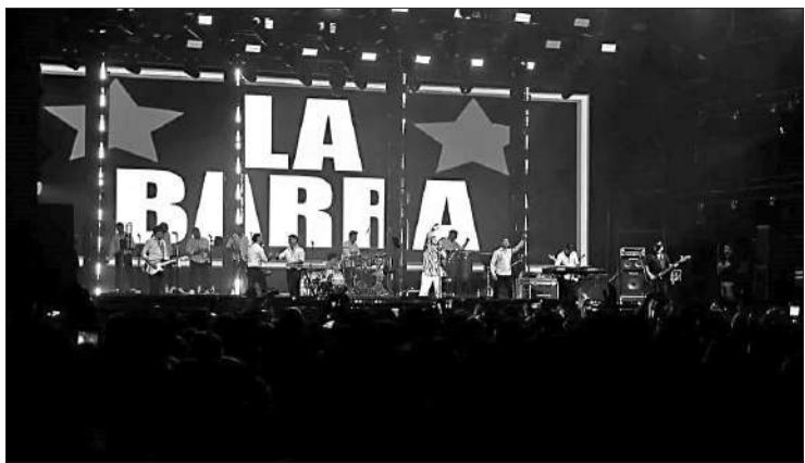
La Barra durante uno de sus bailes del año pasado, en el Quality Arena.