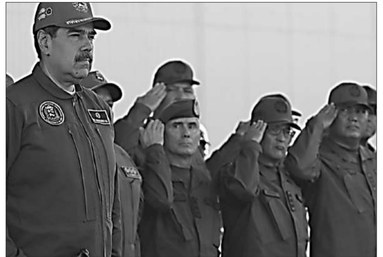
Nicolás Maduro cuenta todavía con el apoyo de los militares en Venezuela.

“Vamos a garantizar la paz del país, vamos a darle seguridad al pueblo, vamos a garantizar que el