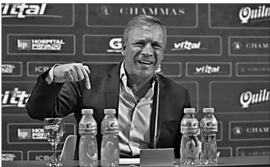
Fassi podrá volver, provisoriamente, a ser el presidente de Talleres.