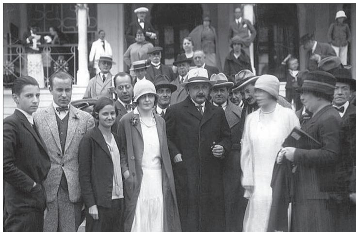
Einstein viajó por las sierras cordobesas y visitó al emblemático Hotel Edén.