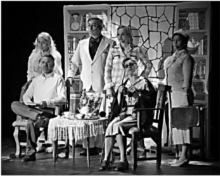
La pieza estrenada en 2023 subirá a escena en el Teatro Ciudad de las Artes.