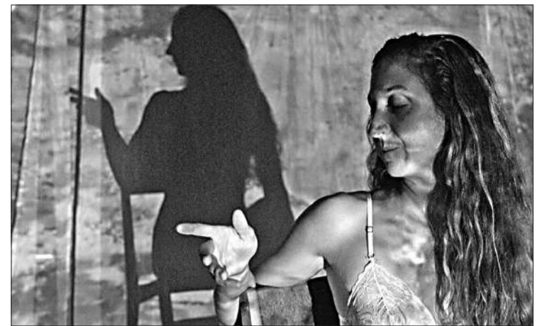
"Luz al tiempo" utiliza diferentes recursos narrativos para una puesta inmersiva.