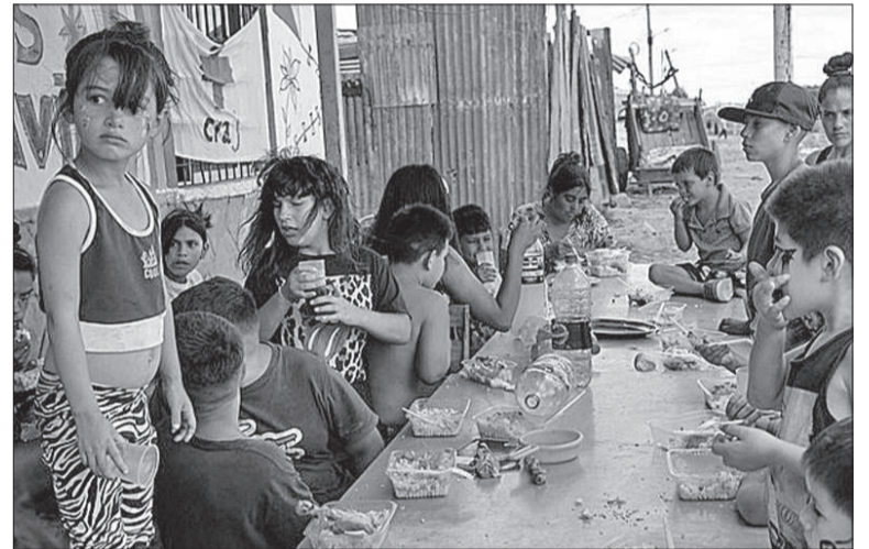
La pobreza afecta especialmente a los niños y niñas.

De esta manera, según el Indec, el año pasado cerró con aproxima-