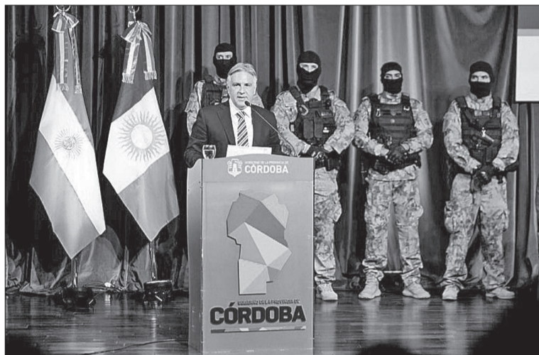
Llaryora le reclamó a la administración central la construcción de cárceles.

En la oportunidad, el Gobernador también reclamó a la Nación la construcción de cárceles federales en la provincia, que permitan alojar allí a los presos con condenas federales, y que hoy ocupan lugares en las cárceles provinciales. “De la misma manera que el gobierno nacional ha hecho inversiones en su momento y ha construido cárceles federales en otras provincias, nosotros vamos a acompañar una ley para solicitar al gobier-