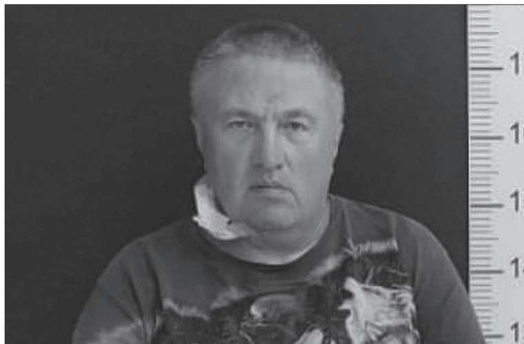
El hombre detenido es de nacionalidad rusa y tiene antecedentes penales.

En tanto, el viernes pasado en la sala de embarque del aeropuerto de