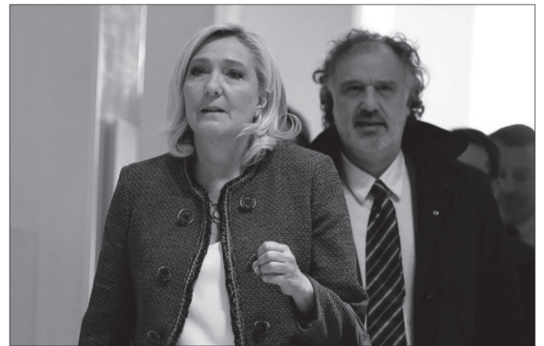
Le Pen partió exasperada de la sala del tribunal y no escuchó su sentencia.

La acusan del desvío de 474.000 euros, bajo un total de 2,9 millones