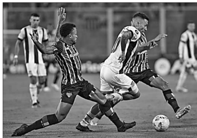
Talleres recibirá a Sao Paulo mañana desde las 21, en el estadio Mario Alberto Kempes.

Talleres deberá esperar hasta mañana, cuando reciba a Sao Paulo desde las 21.30, en un duelo que se está volviendo costumbre para los cordobeses. El historial marca que