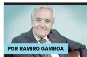
POR RAMIRO GAMBOA