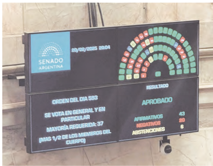
Se suspendieron las PASO

Lo cierto es que las PASO funcionan hoy como “filtro de la oferta electoral en un sistema que no pone mayores restricciones a