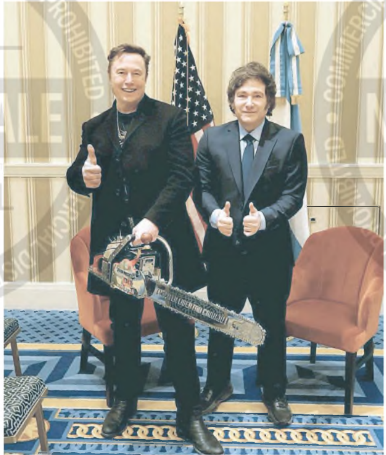
En su reciente viaje a Washington, Javier Milei le regaló una motosierra a Elon Musk.

Milei ha abandonado sus planes más alocados de dolarizar la economía y cortar las relaciones comerciales con China