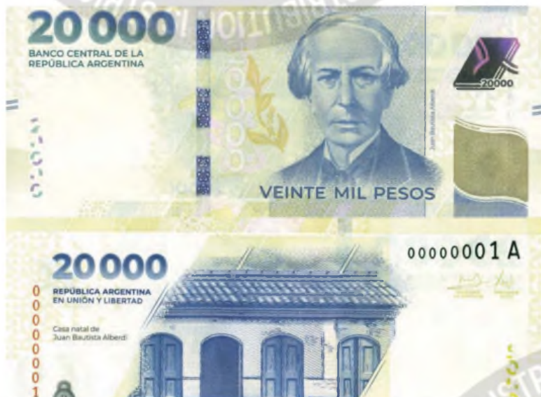
Hay menos pesos en la plaza y el mercado ahora pide más tasas al Tesoro

Los rendimientos oscilan ahora en 34% anual para las Lecap. El impacto de la licitación del miércoles, el colchón oficial. ¿Cuánto fue la inflación de febrero? Las mediciones privadas