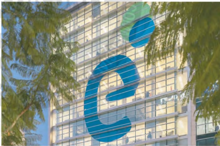
Edenor posee 3,3 millones de clientes