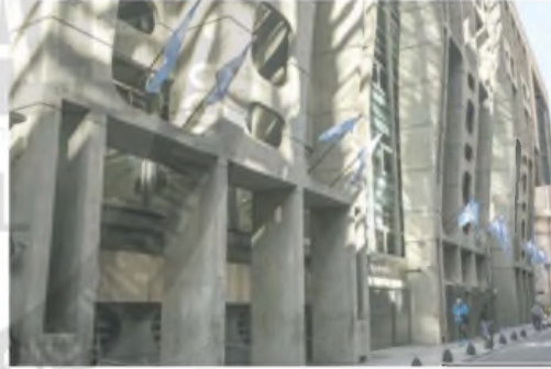
“Información importante: adecuación tarifaria”, avisan los bancos

Si se toma como referencia a otro de los bancos privados líderes, la tarjeta de crédito in-