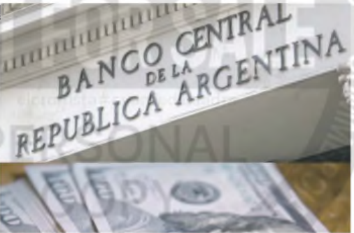
La autoridad monetaria compró u$s 23 millones en el mercado