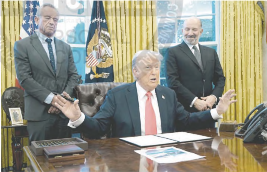
Donald Trump anticipó que los nuevos aranceles se aplicarán desde el martes próximo y que el 2 de abril aplicará los recíprocos.

El presidente Pedro Sánchez, aseguró que la Unión Europea está preparada para una guerra comercial. "Vamos a defender nuestros intereses ante quien quiera atacar a Europa con aranceles", dijo