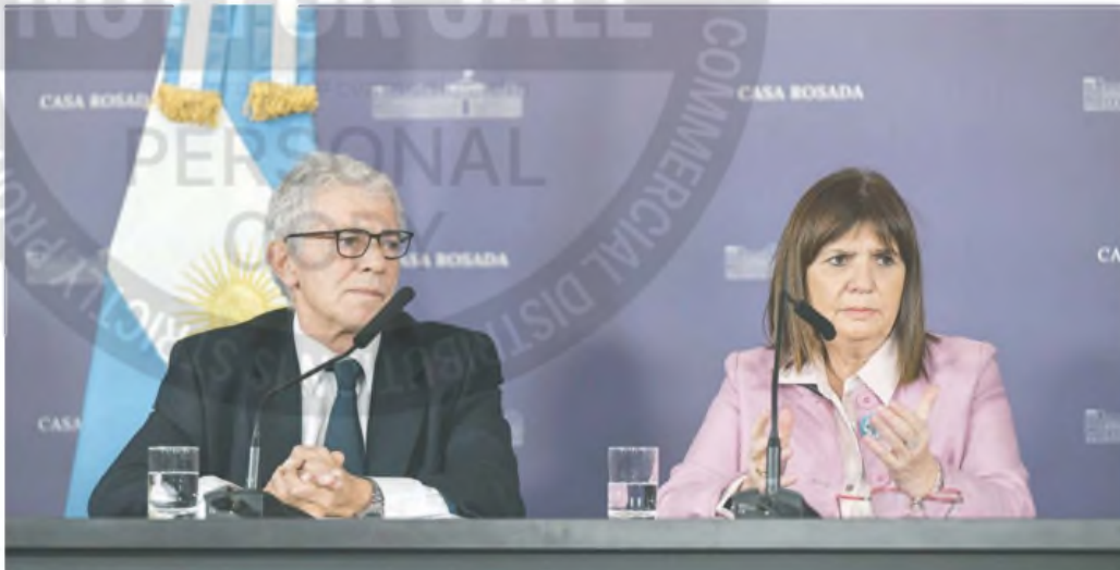
Los ministros de Justicia y Seguridad Nacional, Mariano Cúneo Libarona y Patricia Bullrich; dos de los principales impulsores del proyecto

La Cámara baja todavía tiene pendiente el tratamiento de una reforma para bajar la edad de responsabilidad penal en menores. Qué dice la iniciativa oficial que buscan acelerar