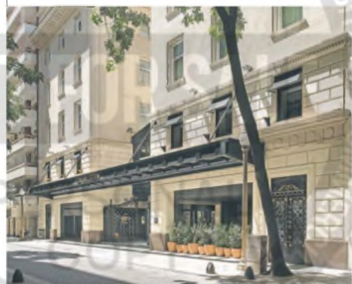
El histórico hotel de la calle Arroyo había reabierto hace dos años

El foco de la cadena Único Hotels está hoy en continuar expandiéndose en España. “La marca se encuentra inmersa en un intenso plan de crecimiento en España, como demuestra la reciente operación de adquisición de Finca La Bobadilla. Este icónico establecimiento, situado en un enclave privilegiado de Andalucía, refuerza la estrategia del grupo de apostar por hoteles singulares con alma, que reflejen la excelencia en el servicio y la conexión con su entorno”, finalizó.