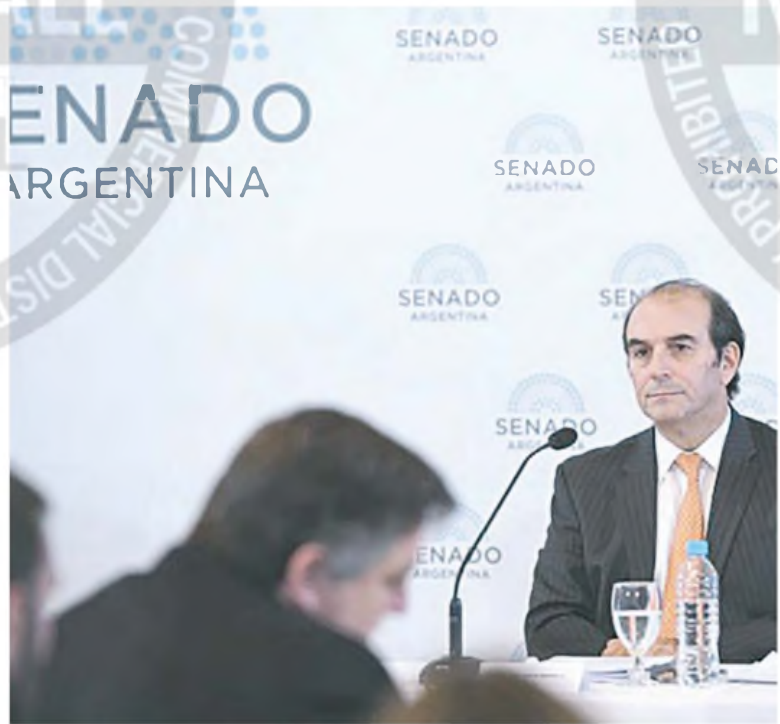
El designado juez de la Corte, Manuel García-Mansilla, en la comisión de Acuerdos del Senado el año pasado

En el Senado aclaran además que la primera vacante de la Corte no se produjo durante este receso sino cuando renunció Elena Highton de Nolasco en 2021, con lo que el Ejecutivo