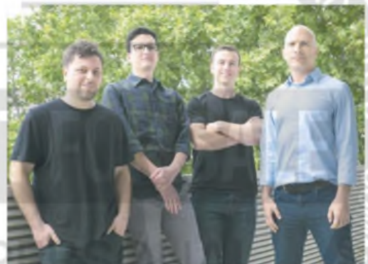
IA para el agro: los fundadores de Calice tienen background científico

La startup emplea a 15 profesionales dedicados a la digitalización de ensayos a campo. Según proyectan, esta tecnología podría reducir hasta en 80% la necesidad de ensayos físicos y acortar los tiempos de desarrollo en un 50%.