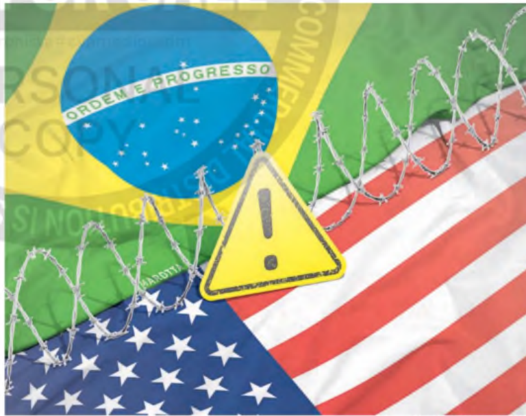
ILUSTRACIÓN FRANCISCO MAROTTA

La situación de Rumble no es un caso aislado. En 2024, la plataforma X (anteriormente conocida como Twitter) también enfrentó medidas similares por parte de las autoridades brasileñas.