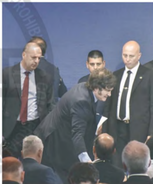
Milei en el Coloquio de IDEA

Las demás grandes cámaras del país aún no se manifestaron sobre la decisión del Ejecutivo. Los integrantes del G6 no confirmaron que el tema haya estado en discusión. Este grupo se