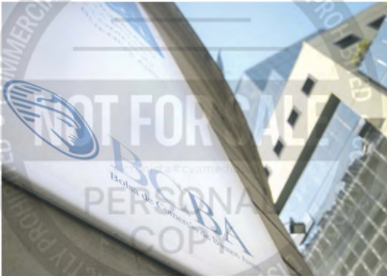
Tras otra caída de las acciones, el índice S&P Merval retrocedió 3,6% en pesos y 3,9% en dólares