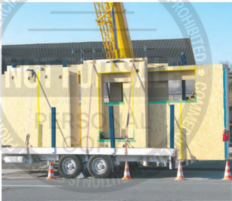
El sector maderero pidió que se cumplan con las certificaciones de calidad