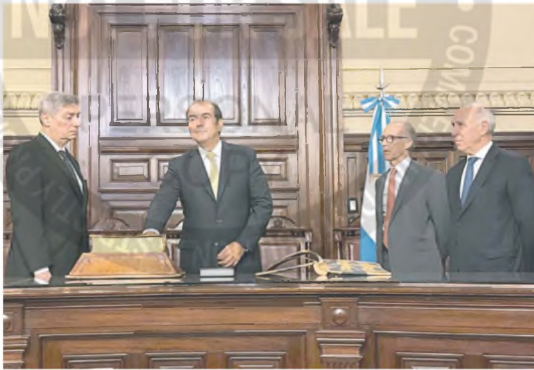
El acto de juramentación del nuevo integrante del máximo tribunal en el Palacio de Tribunales

Rosatti, Rosenkrantz y Lorenzetti habilitaron la jura del nuevo cortesano. El tribunal esperará al 6 de marzo para ver si acepta la licencia que pidió el juez federal. El nuevo panorama judicial