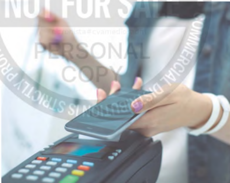
El usuario y el comerciante tienen que tener cuenta en dólares para cursar el pago

Entraron hoy en vigencia los pagos con débito en moneda extranjera. También se podrá pagar en dólares con el DEBIN Programado. Se usarían para comprar autos, tecnología, y electrodomésticos