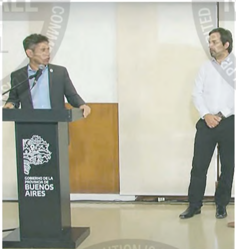
Kicillof dijo que era un "día triste" al encarar su cuarta "Conferencia del Verano" desde la costa