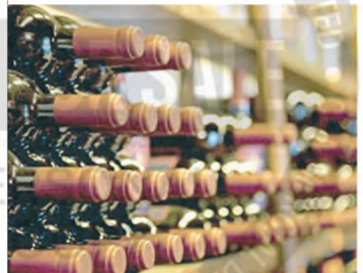
Solo el 30% del vino se exporta; Coviar cree que puede ser más

En ese sentido, actualmente, el 79% de los tractores y maquinaria con la que cuentan los productores del vino son de los años '70, según datos de Coviar. Esto, subraya González, ejemplifica por qué las bodegas argentinas tardan demasiado en adaptarse a las nuevas tendencias de consumo que ya están instaladas en todo el mundo.