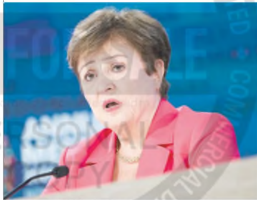
Georgieva advirtió sobre el contexto global en el G20

“Los gobiernos de otros países también están ajustando sus políticas. Los efectos combinados de los posibles cambios de política son complejos y todavía difíciles de evaluar, pero se verán con mayor claridad en los próximos meses”, anticipó sobre los efectos de la guerra comercial.