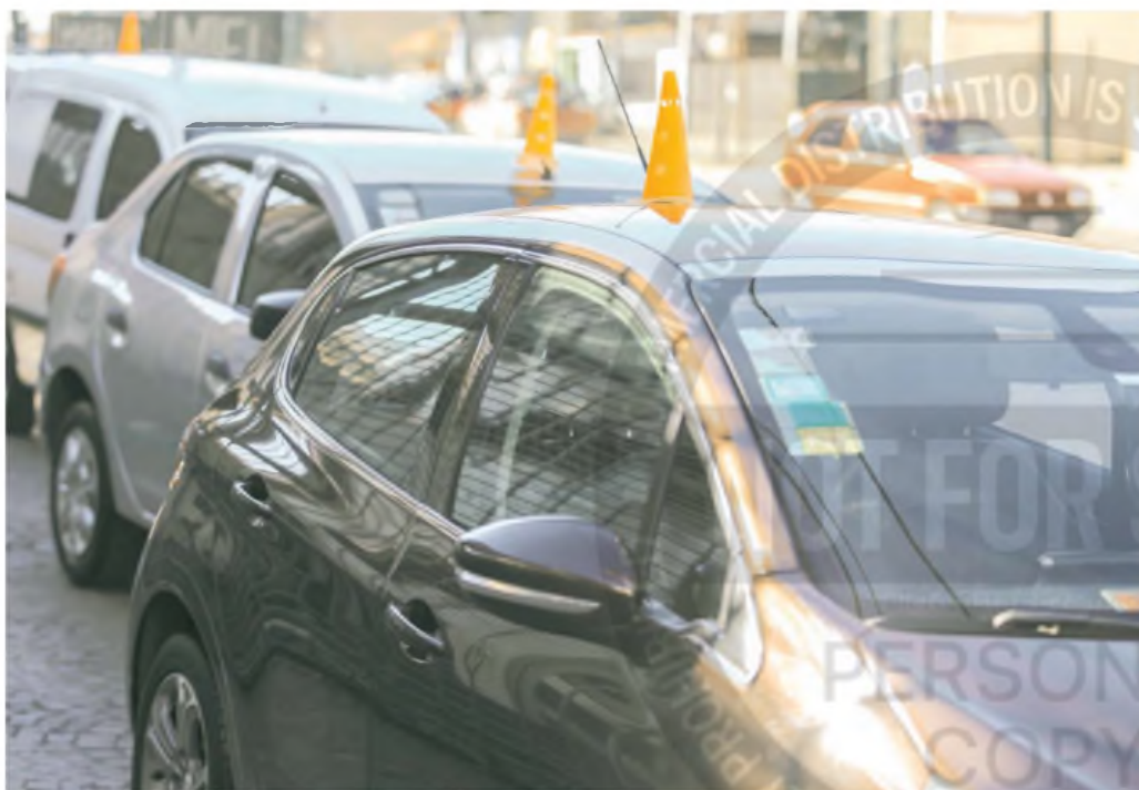
El segundo semestre de 2024 cerró con un aumento en la participación de vehículos nuevos, aunque los usados continuaron liderando el número de transacciones: ocho de cada 10 vehículos vendidos en la Argentina son de segunda mano*

En términos generales, durante el segundo semestre de 2024, se comercializó en la Argentina un total de 1.193.422 unidades, de las cuales 845.400 fueron usadas y 207.696, 0 km