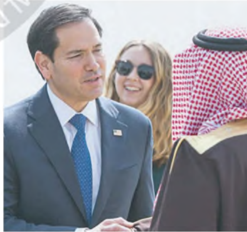
Marco Rubio, secretario de Estado de EE.UU. en Riad.

no ha abandonado su objetivo de conquistar amplias zonas de Ucrania y hacer prácticamente imposible que el país siga siendo un Estado operativo.