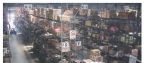
LA SOJA NO REPUNTA Y DEJA MENOS DIVISAS

El oficialismo busca sostener las sesiones en el Senado por las PASO y el pliego de Lijo para la Corte — P. 6