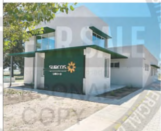
Surcos cayó en default a principios de diciembre

Su situación empeoró hace unas semanas, cuando sufrió una nueva inhibición general de bienes y un embargo judicial por más de $ 21 millones, lo que también le impidió seguir pagando vencimientos.