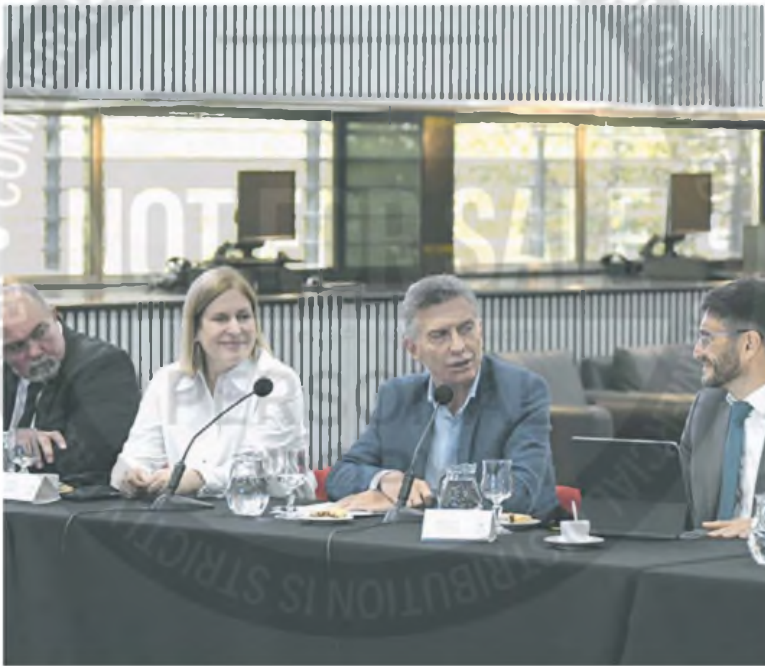
El jefe de Estado y líder del PRO se reunió con Pullaro en el marco de un acuerdo electoral para este año