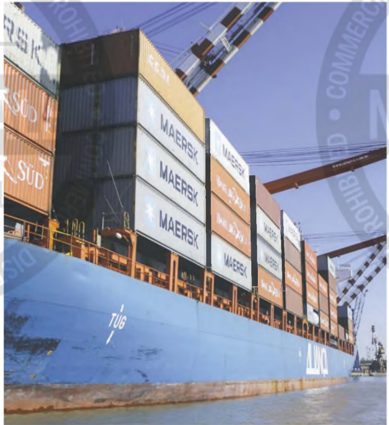
Las exportaciones cayeron casi un 20% en relación a diciembre

En el frente exportador se destacó la marcada caída de las ventas de productos primarios (-5,4%), aunque explicaron ventas por u$s 1.523 millones. En el sentido contrario, la mayor suba de las exportaciones la registró combustibles y energía, que creció 23,7% y juntó u$s 879 millones. El mayor monto por ventas al exterior lo alcanzaron las manufacturas de origen agropecuario, que sumaron u$s 2.069 millones (con una suba del 11,4%), mientras que las manufacturas de origen industrial juntaron u$s 1.418 millones y subieron 16,4%.