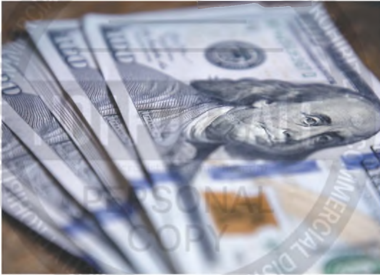
“Aquí no hay pasado nada”, destacaron en las mesas de dinero, luego del cierre del mercado.