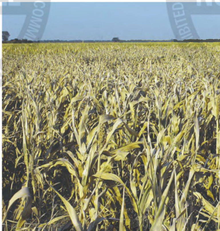
La soja, eterna estrella, no está rindiendo lo esperado

Desde LCG indicaron que la oferta del Gobierno de recortar retenciones de manera temporal a la vez que eleva los incentivos a hacer tasa en pesos, no terminan de convencer y, por ahora, el agro no está liquidando por encima de lo esperado". Además marcaron que no es flujo nuevo sino un adelanto, que "corre la época de vacas flacas".