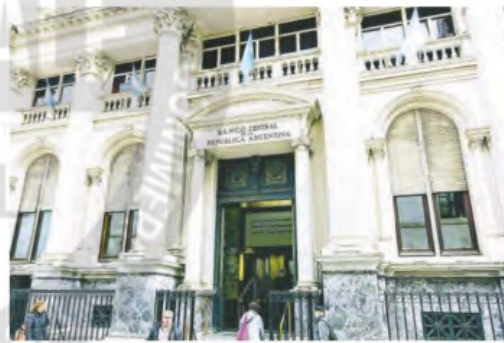
Bancos planean ir contra municipios o provincias que les cobren más.

“No hemos hecho nada aún los bancos privados pero estamos discutiendo cómo llevarlo