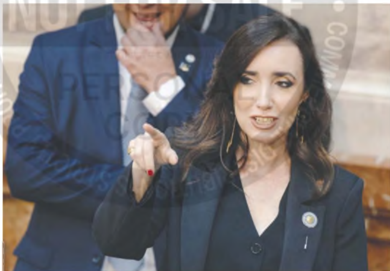
La vicepresidenta almorzó con los jefes de bloque de la Cámara alta para acordar una hoja de ruta

La presidenta del Senado se reunió con los jefes de los bloques dialoguistas y se barajó una agenda tentativa que se definirá mañana. La oposición podría conformar una comisión investigadora