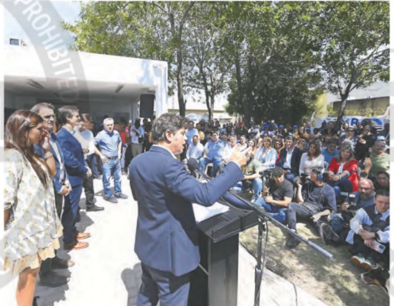
El gobernador bonaerense mantendrá sus actos con inauguración de obras como ayer en San Vicente

Ayer, el gobernador bonaerense estuvo presente en San Vicente para inaugurar las obras de puesta en valor de un Centro de Atención Primaria de