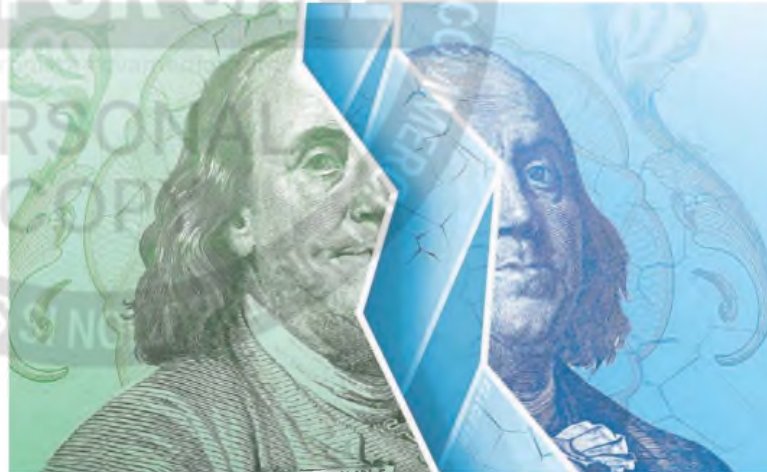
ILUSTRACIÓN FRANCISCO MARROTTA