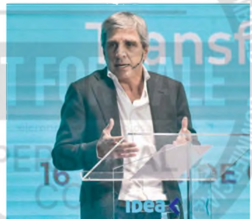
Ante la volatilidad por LIBRA, Caputo marcó "fundamentals" sólidos