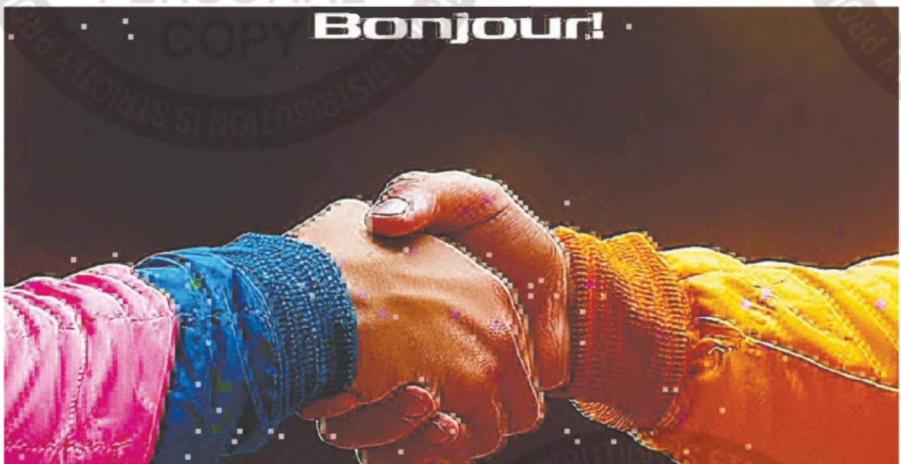
Un apretón de manos como el del logo de Mercado Libre fue la imagen elegida para anunciar que la plataforma de comercio electrónico se sumó como sponsor de Alpine

La plataforma de e-commerce, que había acompañado al piloto en Williams, anunció su auspicio a la escudería francesa