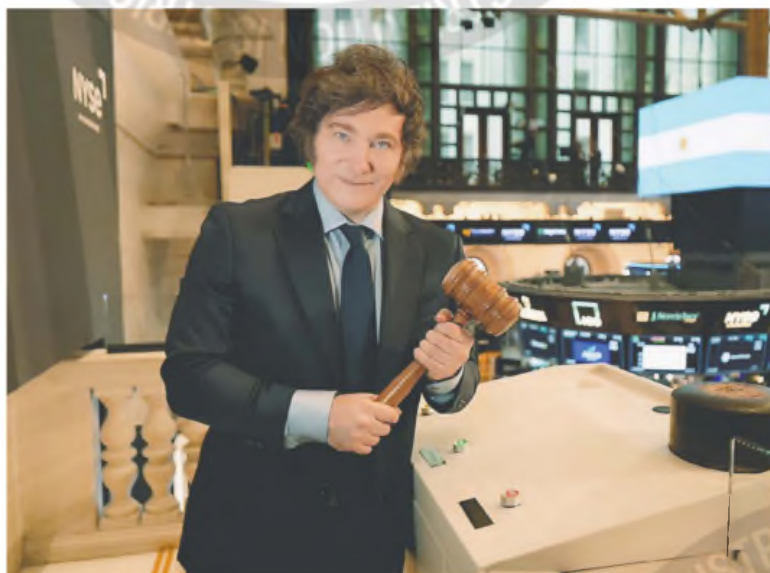
Se recuperaron los ADR de empresas argentinas en Wall Street, en la primera rueda de la semana.

Alta volatilidad en la plaza. Codicia venció al miedo y aparecieron compradores. El riesgo país trepó 3,8% a 701 puntos. Bajas en contratos de dólar futuro. ¿Cómo sigue de ahora en más?