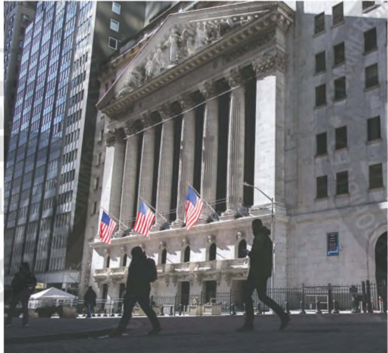
La "memecoin" habría incumplido normas de Wall Street