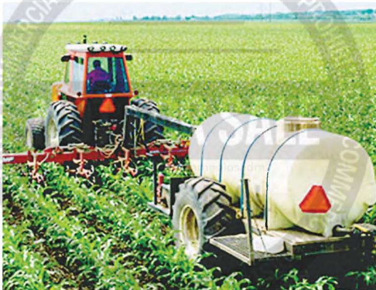
El Gobierno derogó una norma de 1973 que impedía el libre tránsito de fertilizantes por cuestiones militares

LA VENTA DE AGROQUÍMICOS CAYÓ 35% EN 2024