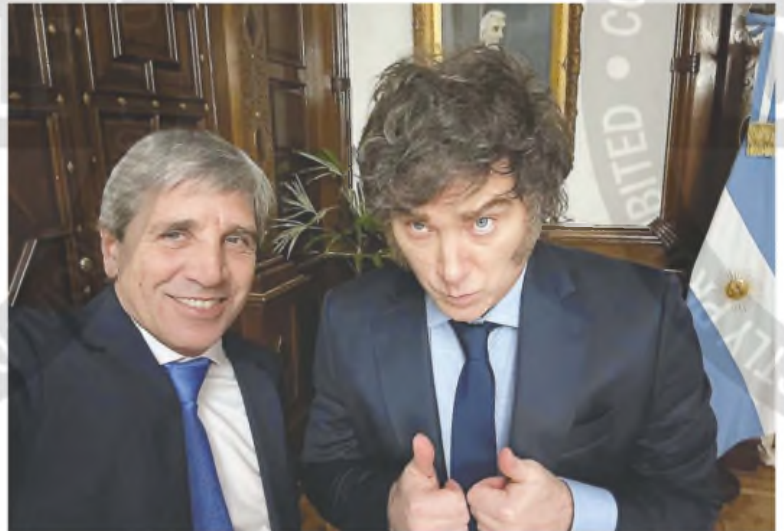
El ministro de Economía, Luis "Toto" Caputo, habló del presidente y el FMI

Según Caputo, no afecta el rumbo de la economía, "no implica un caso de corrupción ni tendrá efecto sobre las negociaciones con el FMI", explicó.