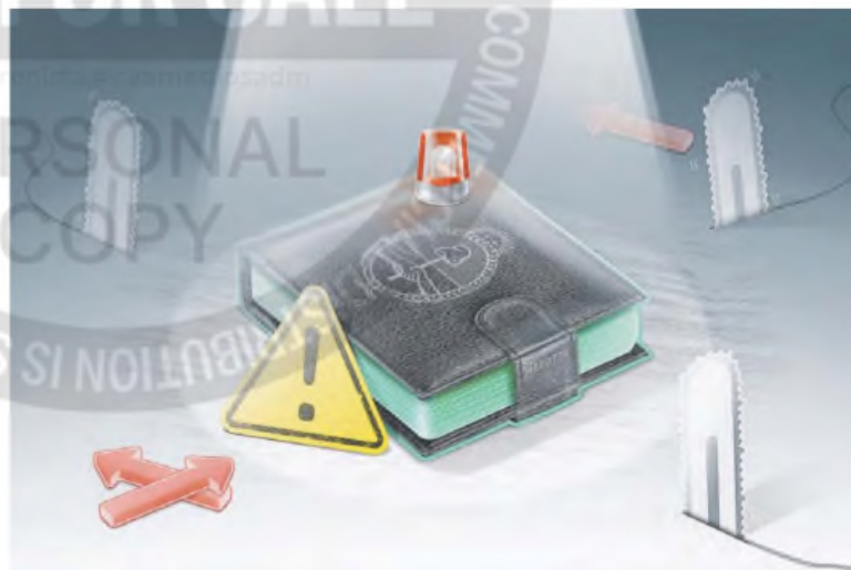
ILUSTRACIÓN FRANCISCO MAROTTA

De todas formas, los ingresos de las familias sufrieron un fuerte golpe en 2024. En el acumulado los salarios privados registrados perdieron 6% de su poder de compra mientras los públicos 20%. Un porcentaje similar al que cayeron los haberes jubilatorios, 19%. Esa reducción se produjo en un contexto de cambio en los precios relativos que modificó las pautas de consumo.