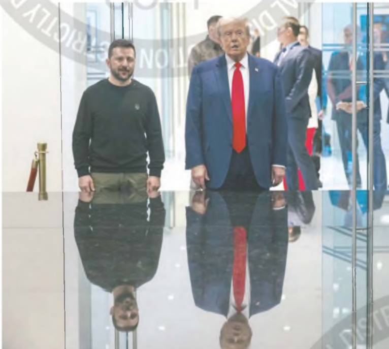
“No sé si tienen algo que hacer en la mesa de negociaciones”, dijo Peskov sobre Europa.

Moscú celebró la reunión como medio para terminar la guerra y restablecer relaciones con Washington. El presidente turco Recep Erdogan invitó a su par ucraniano a visitar Ankara