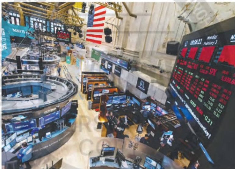
Se espera la sesión de hoy en Wall Street para dimensionar el impacto en los mercados del caso LIBRA.