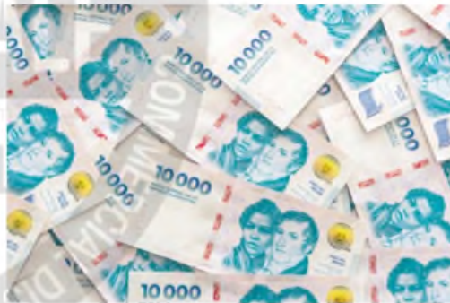
Los títulos CER vuelven a ser los protagonistas del mercado.

El mercado comienza a ver atractivo nuevamente a los bonos que ajustan por CER, es decir, aquellos que ofrecen cobertura inflacionaria. Con esta visión, desde Bind Inversiones, remarcaron que tienen hoy una preferencia por estar cortos en duración o incluso con posición en bonos duales de cara a los