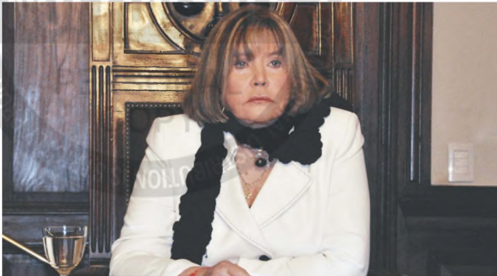
La Cámara Federal determinó por sorteo que el Juzgado Federal N°1, a cargo de Servini, concentre las denuncias por la cripto LIBRA

La magistrada concentrará todos los expedientes en Py. Entre ellos, el que promueve uno de los abogados de Cristina Kirchner. El oficialismo insiste con que "no hay delito"