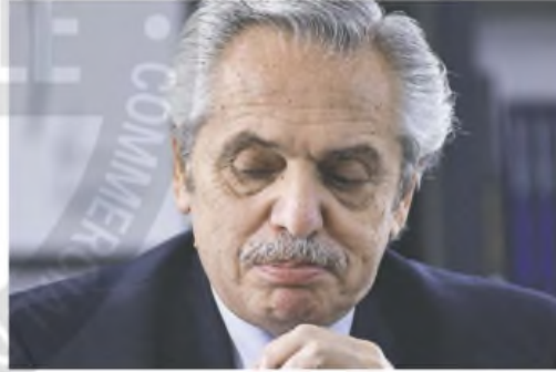
La defensa de Fernández intentó, sin éxito, apartar a Ercolini

El magistrado consignó que "tras ser electo Fernández, la violencia física habría continuado y escalado, más precisamente después de haber quedado aquella embarazada, en forma de agarrones del cuello, zamarreos, cachetazos a mano abierta y golpes que provocaron lesiones en el cuerpo de la nombrada, mientras convivieron en la Quinta de Olivos".