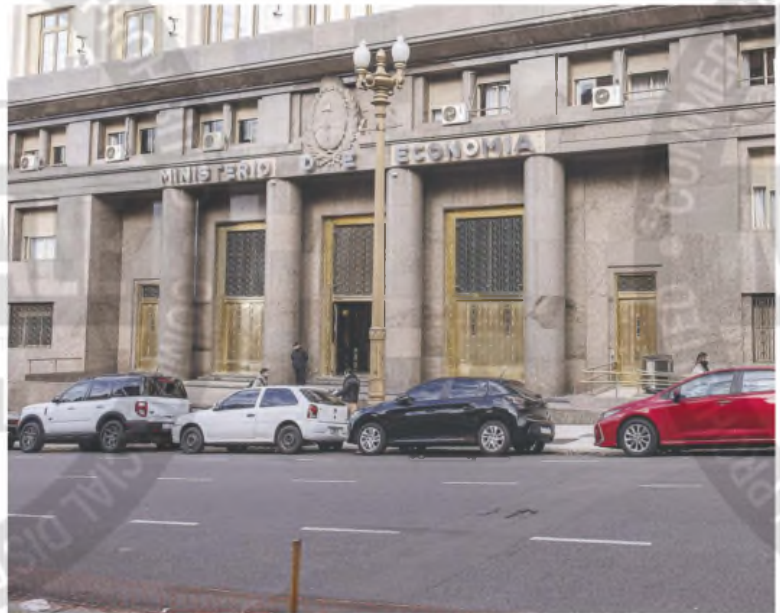
El Palacio de Hacienda conserva los números positivos

El superávit financiero fue del 0,1%. El Gobierno retomó la diferencia positiva que resignó en diciembre de 2024. Los gastos crecieron más rápido que los ingresos