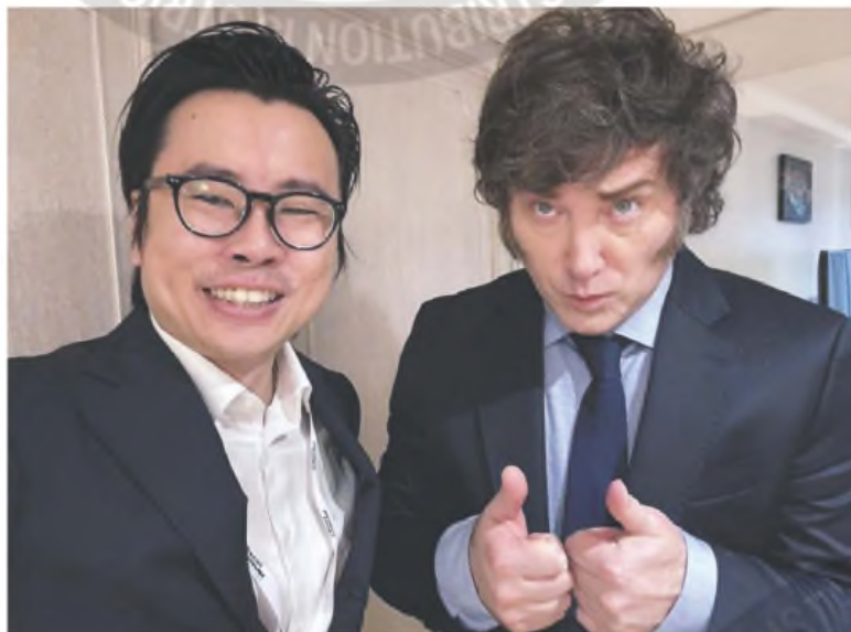
Los paneles se tiñeron de rojo en la plaza local, afectados por el escándalo de LIBRA

En el primer día, incluso sin actividad en Wall Street, los activos argentinos reaccionaron muy mal al caso LIBRA. Este martes, se sentirá todo el impacto y el mercado anticipa lo que viene