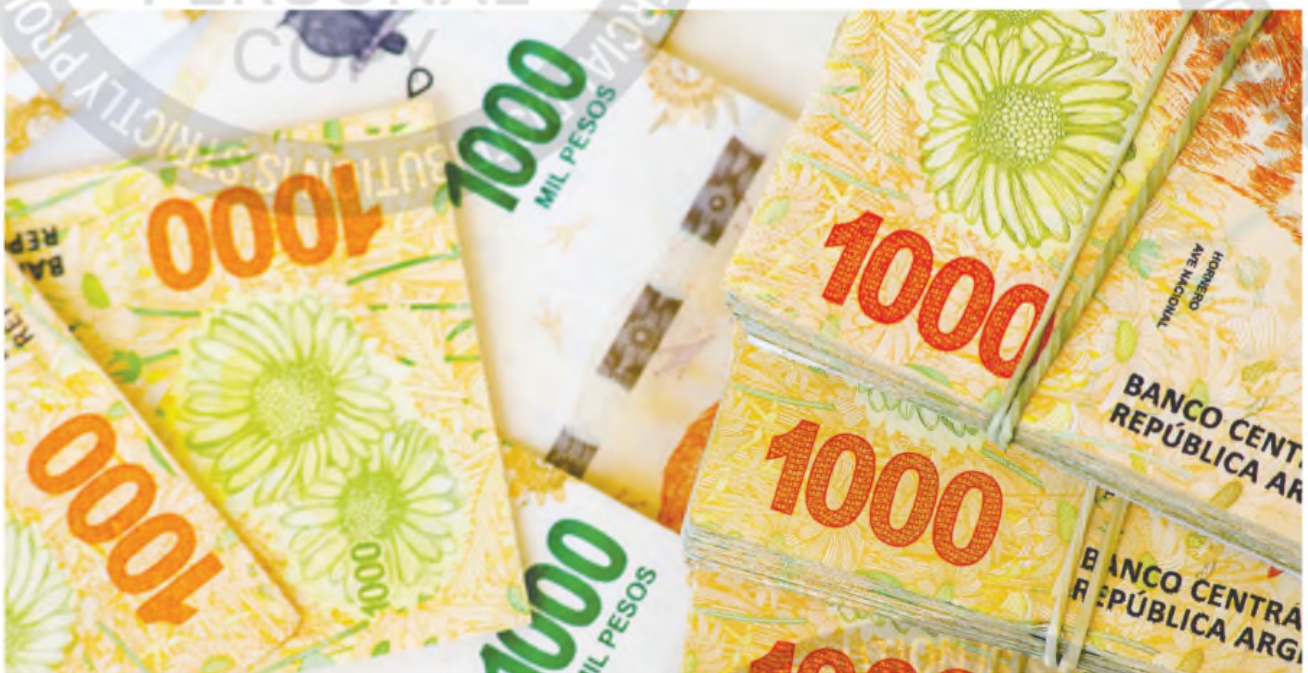
El 68% de las empresas consultadas en el relevamiento ya tiene cerrado su presupuesto junto con las previsiones de política salarial para este año.

Con la baja de la inflación, se volverán a ofrecer incrementos por mérito al personal ejecutivo y fuera de convenio