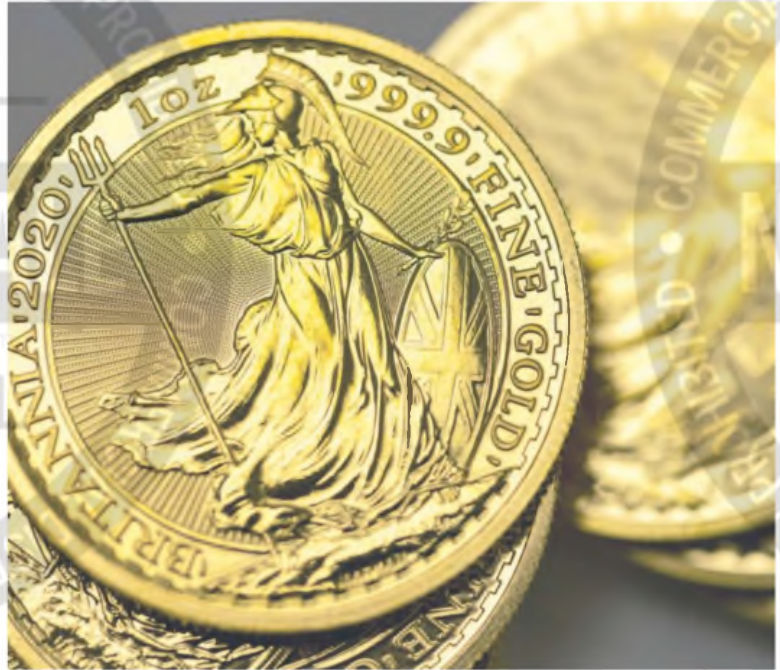
Los bancos centrales compraron más de 1000 toneladas de oro el año pasado. BLOOMBERG

Las amenazas arancelarias del presidente de Estados Unidos y el aumento de las reservas en Nueva York han ayudado a que el lingote marque una serie de máximos históricos