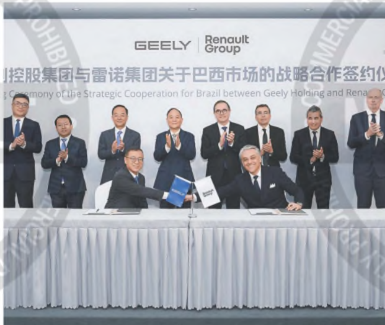
Daniel Li (Geely) y Luca de Meo (Renault), los dos CEOs al momento de anunciar el acuerdo

El grupo francés le venderá una parte de su filial brasileña y comercializará productos de la marca asiática en ese país. A cambio, su nuevo socio fabricará vehículos en la planta de Curitiba