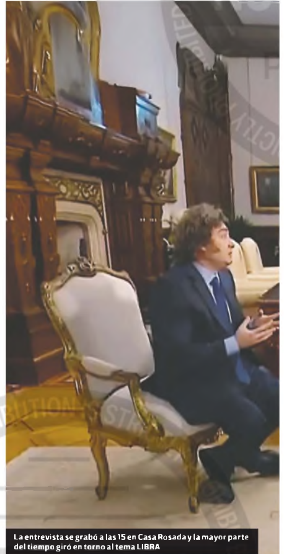
La entrevista se grabó a las 15 en Casa Rosada y la mayor parte del tiempo giró en torno al tema LIBRA

“Hay que ir a fondo contra los que le hicieron la cama a miles de personas y al propio Presidente” Diego Santilli Diputado PRO