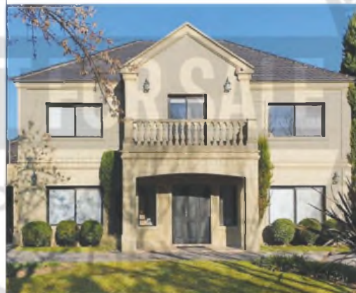
En el corto plazo, el costo seguirá subiendo a la par con la inflación

La construcción cayó 27,4% en 2024, informó el Indec. También se destacó una reducción del 30,7% en la superficie autorizada por permisos de edificación en noviembre. La crisis del sector está vinculada a la paralización de la obra pública, las consecuencias de la devaluación de diciembre de 2023 y el aumento del costo de los materiales.---