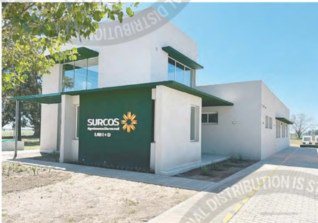
La fabricante de agroquímicos Surcos estaba con niveles mínimos de operación a la espera de la apertura de su convocatoria de acreedores

La Justicia levantó las cautelares que establecían la inhibición general de bienes y el congelamiento de sus cuentas bancarias. Con ese dinero, ahora, Surcos pagará sueldos y deudas a proveedores