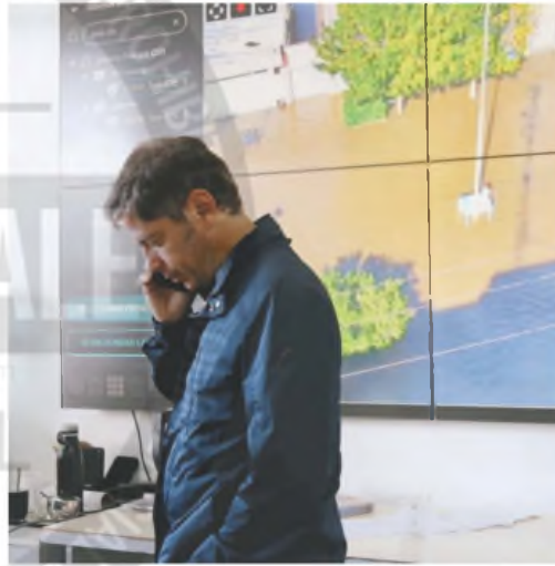
Kicillof agradeció la solidaridad de "casi todas las provincias"

El gobernador se presentó junto al intendente local para brindar detalles después de las inundaciones y diversas medidas para sus vecinos. Nuevo pedido de cita a Milei