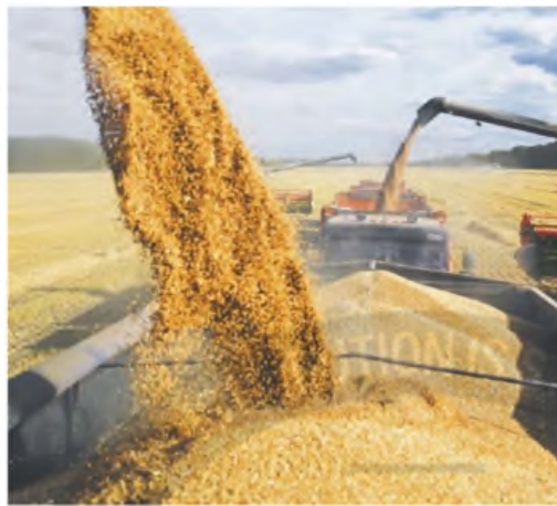
La soja, en repunte