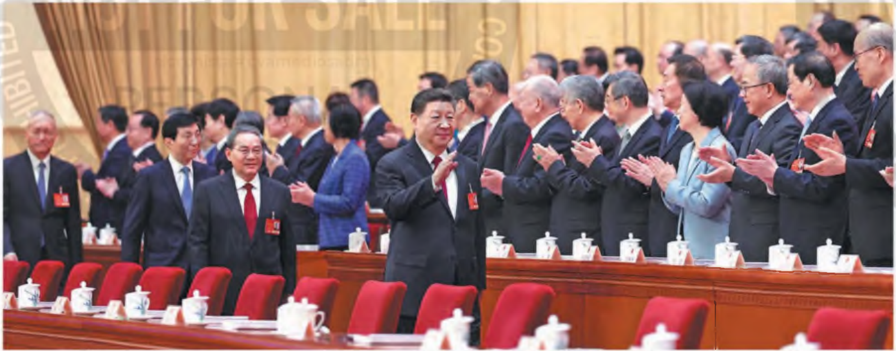
El presidente Xi Jinping y otros líderes chinos asisten a la reunión inaugural de la tercera sesión de la XIV Asamblea Popular Nacional en el Gran Palacio del Pueblo en Beijing el 5 de marzo.

EN ESTE SUPLEMENTO, PREPARADO POR CHINA DAILY, REPÚBLICA POPULAR CHINA, NO SE INVOLUCRÓ A LOS DEPARTAMENTOS DE NOTICIAS DEL DIARIO UNO, LA CAPITAL NI EL CRONISTA COMERCIAL | MAR. 12, 2025