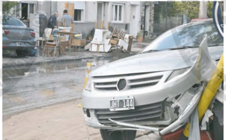
Solo hay dos de siete puentes operativos