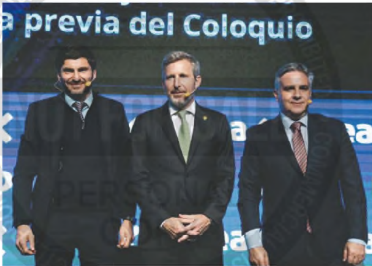
Pullaro (Santa Fe), Frigerio (Entre Ríos) y Laryora (Córdoba), gobernadores ordenados en busca de fondos.