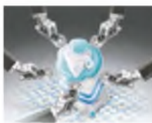
ILUSTRACIÓN: FRANCISCO MAROTTA

Horacio Riggi Subdirector Periodístico — P. 2 —