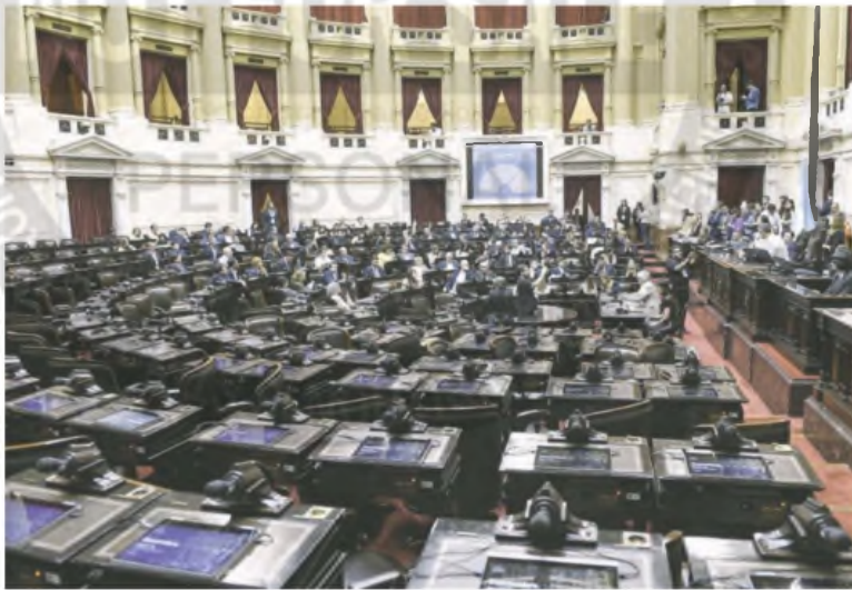
En Diputados, donde se definirá la suerte del decreto, el oficialismo es más optimista con los votos

A pesar de que tenía diez días hábiles a su favor, el Gobierno adelantó el envío del permiso para acordar con el Fondo. Buscan dar una señal a los mercados de que van a poder sostenerlo