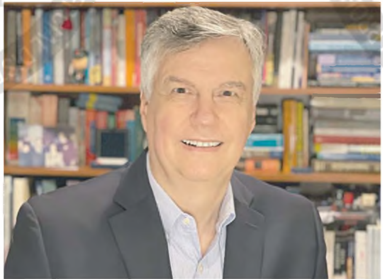
Mondino recomienda flexibilidad cambiaria para enfrentar un contexto global más adverso.

— El esquema monetario es eminentemente transitorio. Este esquema de la meta en la Base Monetaria ampliada con los bancos prestando a expensas de las Lefis se agotó. Ya estamos hacia el final de lo que el Go-