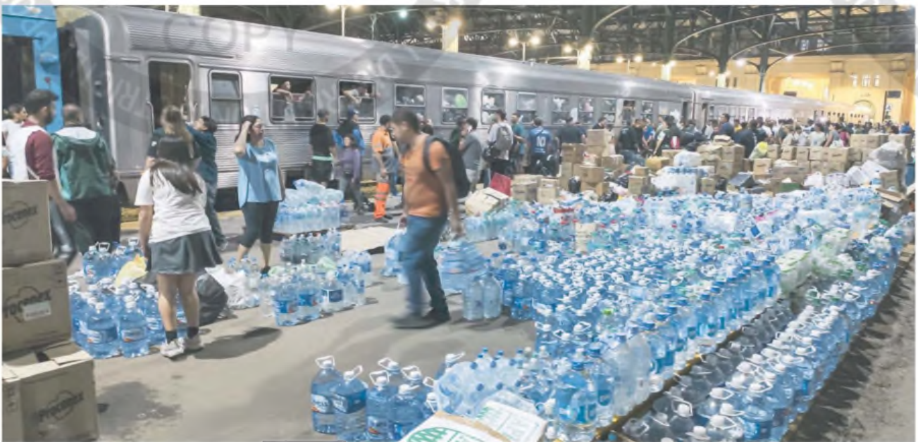
Desde Constitución, en la Capital Federal, salieron 11 vagones cargados de donaciones para los damnificados de Bahía Blanca

Donaciones, recolección de alimentos y ropa, y mejoras en la conectividad, algunas de las acciones para ayudar a los damnificados