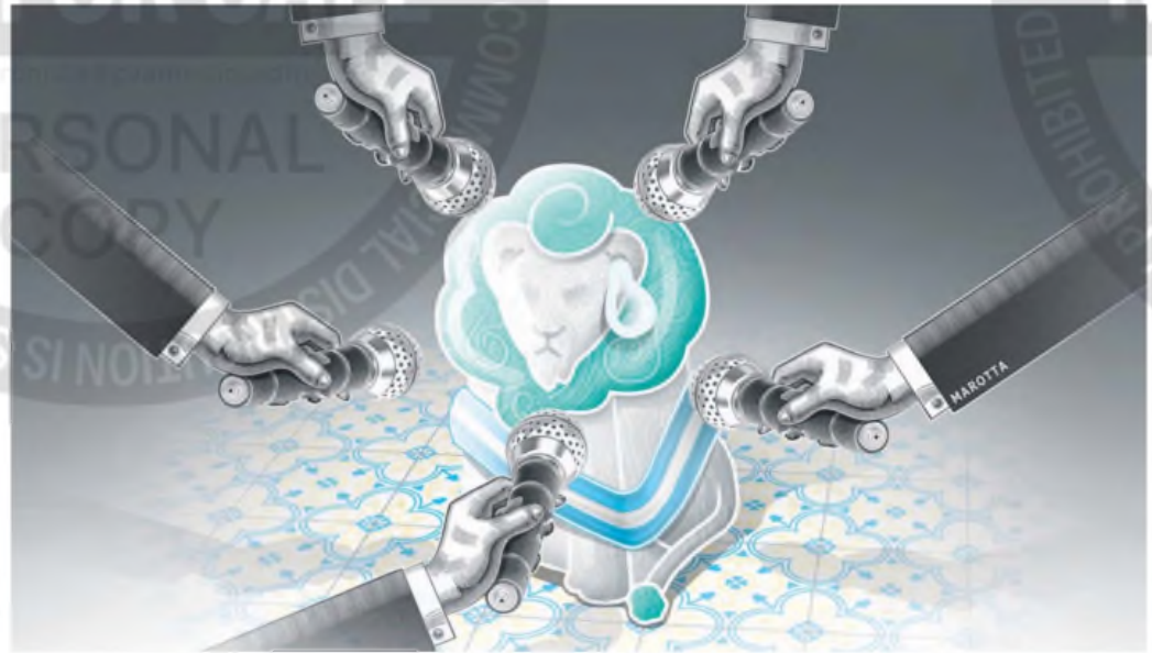
ILUSTRACIÓN: FRANCISCO MAROTTA

Pero de la Casa Rosada los problemas nose agotan en el cripto-escándalo . También la polémica de