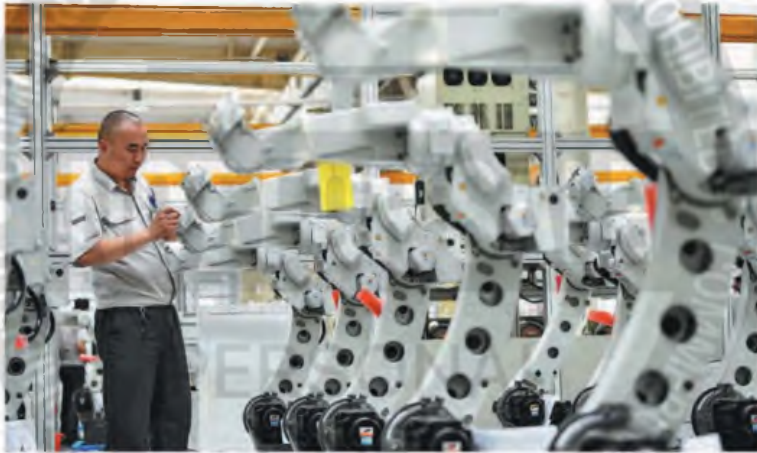
Un técnico ensambla y ajusta robots de soldadura en la fábrica de Panasonic Welding Systems (Tangshan) Co en la provincia de Hebei.