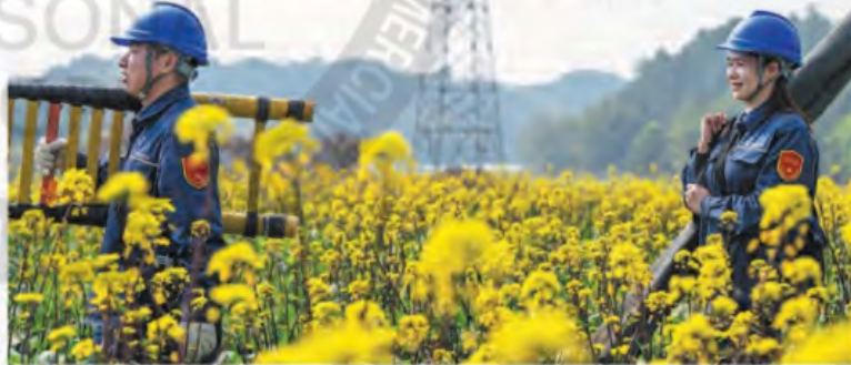
Electricistas en camino a revisar instalaciones eléctricas en una plantación de vegetales en Wuzhou, región autónoma de la etnia zhuang de Guangxi.

El país promoverá la energía renovable distribuida para reforzar la seguridad energética