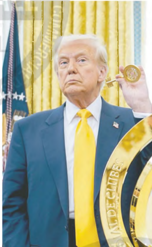
Trump dijo que Canadá impone los aranceles más altos