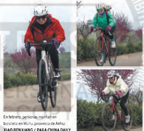
En febrero, personas montan en bicicleta en Wuhu, provincia de Anhui.

En lugar de comprar productos nuevos a precio original, los jóvenes han optado por adquirir equipos deportivos de segunda mano o alquilarlos para ahorrar dinero y fomentar el consumo circular. Además del equipamiento deportivo para exteriores, Xianyu también reportó un aumento en las ventas de drones, cámaras Polaroid y Fuji, así como otros equipos fotográficos para salidas,