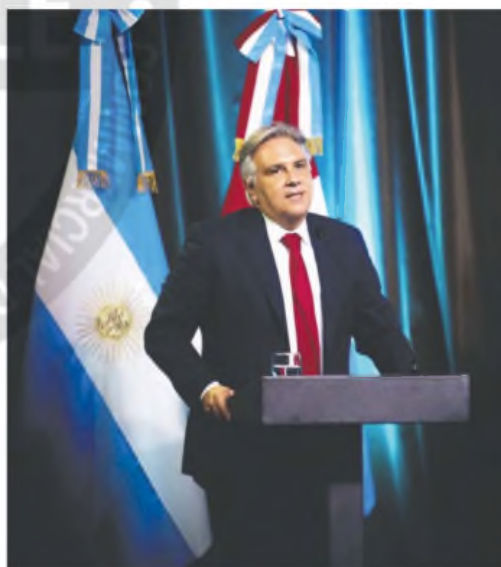
En el acto estuvieron presentes todos los miembros del gabinete

"Es obvio que la infraestructura está relacionada con el desarrollo", remarcó el mandatario