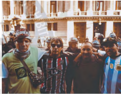
Los hinchas "funerberos", junto a los jubilados, el miércoles pasado

Tras la viralización de la hinchada de Chacarita frente a la Policía hace una semana, diversas agrupaciones de clubes deportivos se convocaron para hoy. La advertencia de Bullrich